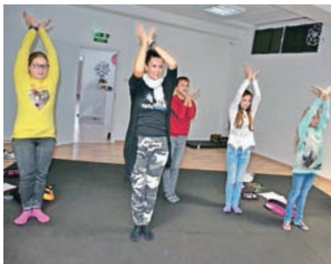
Učenje angleščine na različne načine: tudi preko plesne koreografije

Uro so zaključili s sproščanjem, ki je pomemben del freestyle. "Naša ura je vedno drugačna in zelo razgibana," je še dejala Borštnarjeva.