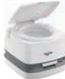
Prenosni WC Porta Potti Qube 145 46.80 EUR