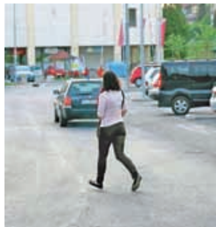
Nepravilno prečkanje cestišča zaznavajo tudi med Mercatorjem in tržnico.

Na podlagi dejstev in analiz je policija občini predlagala področja, kjer naj občinski redar poostreno izvaja nadzor v skladu s pooblastili. Določene težave še vedno zaznavajo pri nepravilno parkiranih vozilih predvsem v centru Medvod, v Zbiljah in v vaseh pod