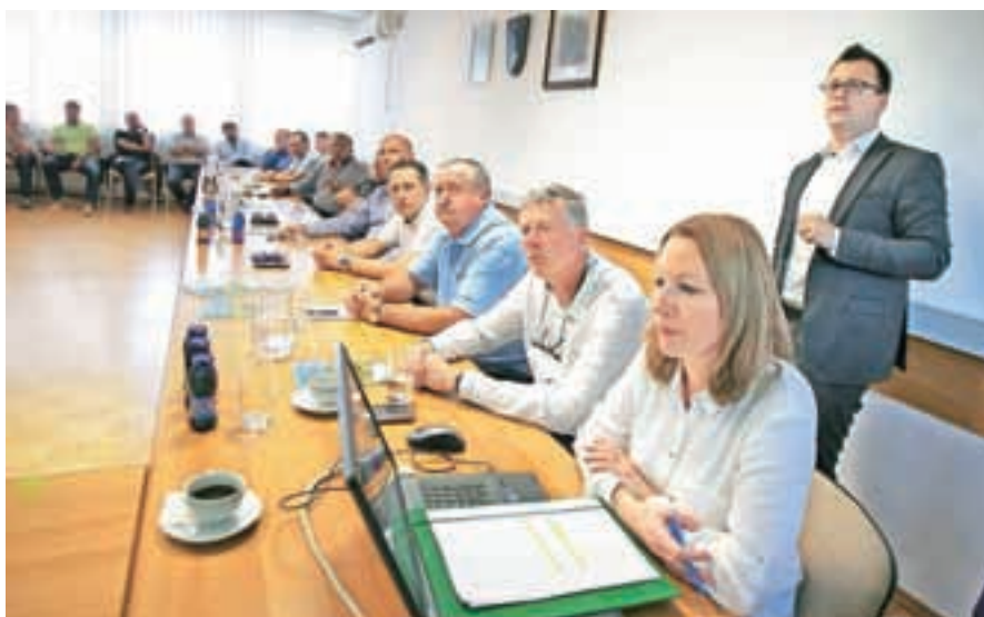
Na srečanje je prišlo več kot trideset predstavnikov medvoških podjetij.

Župan je na koncu poudaril, da je želja občine, da podjetniki ostanejo v Medvodah, in da se zaveda, da je dobro gospodarstvo osnova za vse. Gospodarstvenike bo na srečanja vabil tudi v prihodnje, poleg tega jih bodo z občine sproti obveščali o vseh spremembah, ki se tičejo gospodarstva.