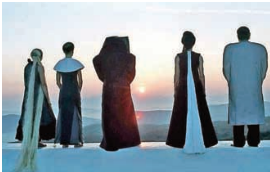
Fotografija iz filma Ruševine režiserja Janeza Burgerja