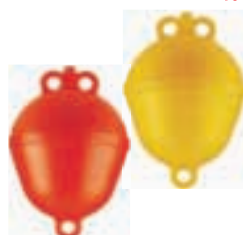
Boja 250 x 390 mm: rumena, oranžna 4.95 EUR