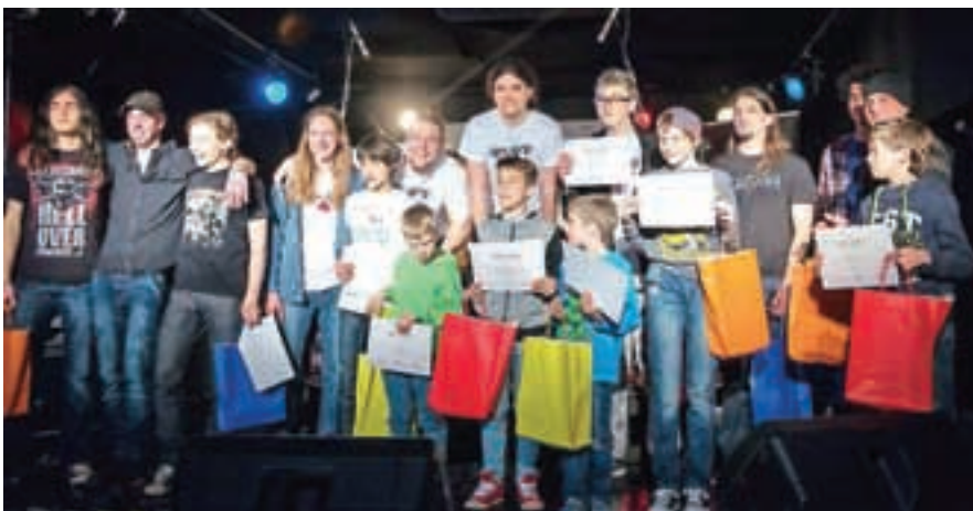
Ena izmed dejavnosti zavoda je klub Jedro, kjer potekajo številni dogodki. (Fotografija je simbolična)