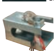
Varnostna ključavnica za prikolico 16.95 EUR