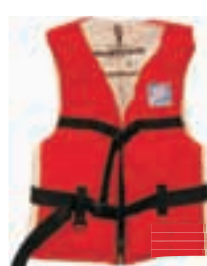
Jopič za vodne športe 50N, velikosti: XL, XXL 19.50 EUR