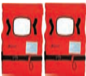
Rešilni jopič 100N 9.99 EUR