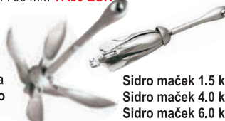
Sidro maček 1.5 kg 6.12 EUR Sidro maček 4.0 kg 15.33 EUR Sidro maček 6.0 kg 22.80 EUR