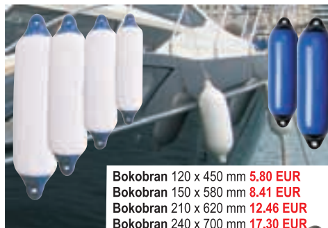
Bokobran 120 x 450 mm 5.80 EUR Bokobran 150 x 580 mm 8.41 EUR Bokobran 210 x 620 mm 12.46 EUR Bokobran 240 x 700 mm 17.30 EUR