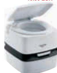
Prenosni WC Porta Potti Qube 165 50.76 EUR