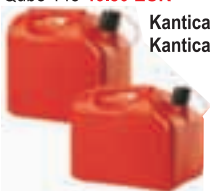
Kantica za gorivo 10 l 7.53 EUR Kantica za gorivo 20 l 12.05 EUR