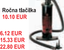
Ročna tlačilka 10.10 EUR