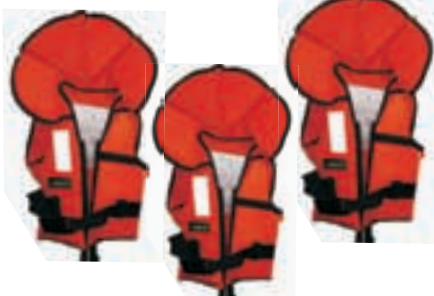
Otroški rešilni jopič do 20 kg in od 20 do 30 kg 19.50 EUR