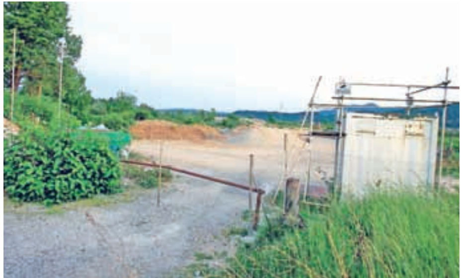
Sprememba, ki naj bi jo prinesel nov občinski prostorski načrt, je tudi lokacija zbirnega centra odpadkov. Ta je predvidena na območju gramozne jame na Jeprci (na sliki).