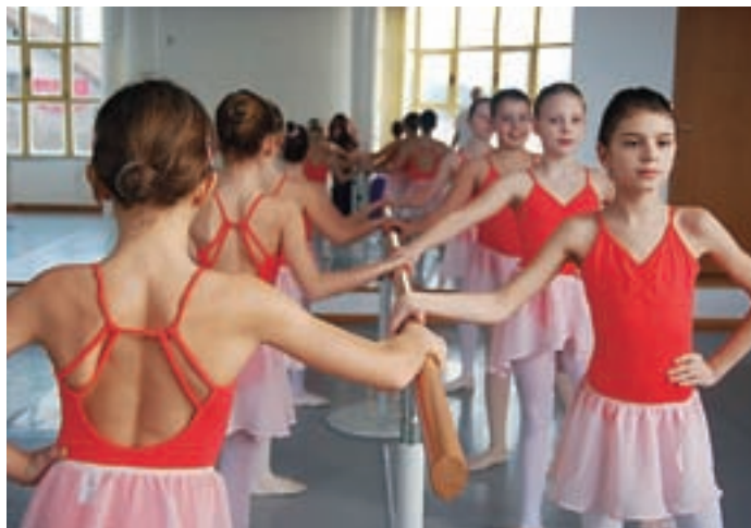
Na vaji smo obiskali mlade baletnike. Vadbna se začne z ogrevanjem ob drogu. Na sliki učenke 1. razreda.

Baletna šola Stevens deluje na treh lokacijah, obiskuje pa jo okrog 160 otrok. Decembra so praznovali deset let delovanja. Obletnico so obeležili s predstavo Hrestač v Gledališču Franceta Prešerna v Kranju.