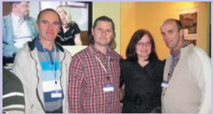
Na sejmu se je v štirih dneh predstavilo vseh osem turističnih društev. Na sliki predstavniki TOD Smlednik.