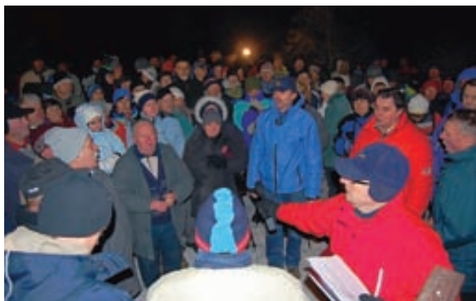
Za dobro vzdušje so skrbeli tudi pevci s Katarine, ki se jim vsako leto pridruži Lojze Peterle (povsem desno).