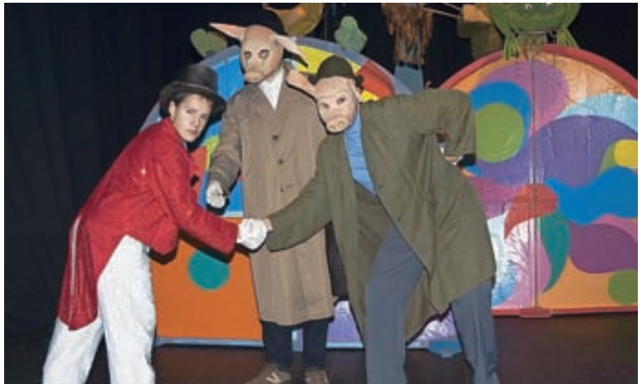
Leteča žaba je na pirniškem odru praznovala četrto stoletja.