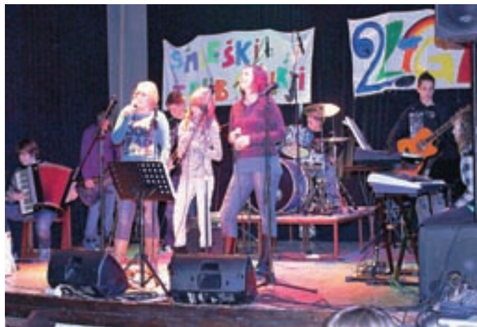
Druga liga je januarja še zadnjič uprizorila muzikal Zgodovina glasbe.