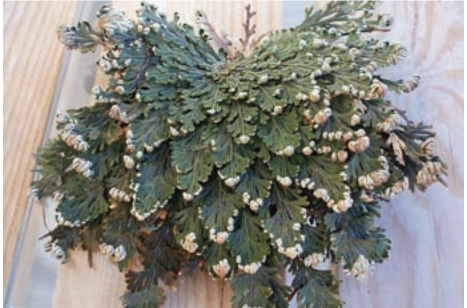
Suha rastlina se v vodi razpre in ozeleni.

Jerihonsko rožo lahko kupimo v dveh oblikah; kot suh klobčič ali kot sobno rastlino. Posušene rastline lahko kupimo na tržnicah sredozemskih držav, zasledimo pa jo tudi pri nas med jesenskimi čebulicami. Tako rastlino ne moremo gojiti kot lončnico, saj je le-ta mrtva. Postavimo pa jo lahko v podstavek z vodo,