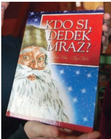
Četrta knjiga govori o dedku Mrzu

ki nosi v sebi svoje poslanstvo, da je mir, dobrota in ljubezen. To poslanstvo, te tri vrednote, ima lahko v sebi vsak človek. Zgodba torej ni klasična pravljica. Edini pravljični lik je Tinina babica, pokojna žena kmeta Lovra, ki v zgodbi dobi ime "babica Zima".