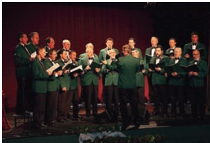
V kulturnem programu je nastopil Lovski pevski zbor Medvode in s pesmijo, sliko in besedo predstavil turnejo po državah nekdanje Jugoslavije.