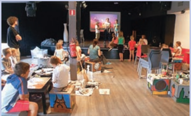
Takole je bilo v Jedru na kreativnih počitnicah poleti, živahno pa bo tudi konec februarja.