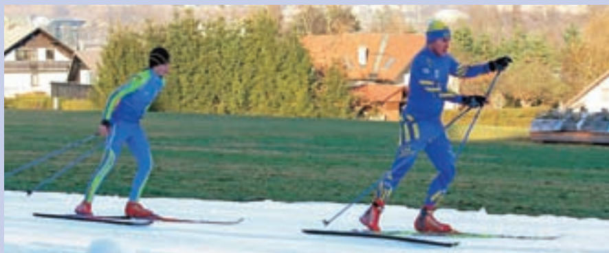
Proge v Nordijskem centru Bonovec - Medvode so odprte.