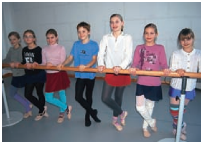
Učenke in učenec 2. razreda pred začetkom vadbe, ki traja eno uro, ves čas pa jo spremlja glasba.