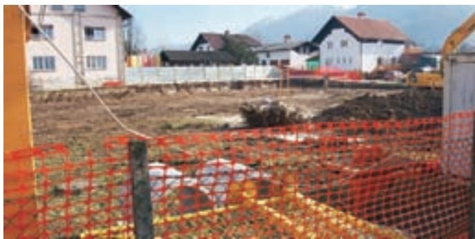
Pod obstoječim vrtcem so začeli gradnjo novega vrtca, starega pa bodo po selitvi v nove prostore podrli.