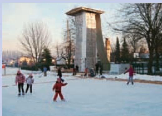
Ob ledenem plezalnem stolpu so decembra odprli drsališče.

vanem športnem parku Ledinček je konec preteklega leta razširil še z drsališčem, ki je veliko 15-krat 30 metrov. Maja Bertoncclj