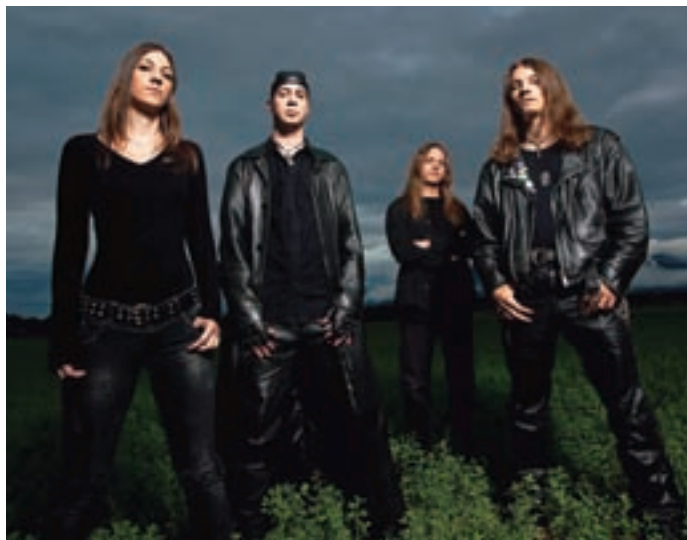
Skupina Metalsteel se predstavlja z novim albumom Entertainment, na katerem je okrog 40 minut čiste heavy metal glasbe.

”Vsekakor bomo skušali odigrati čim več koncertov, tako po Sloveniji kot tudi v tujini. Sodelovanje z ameriškim pevcem Jamesom Rivero