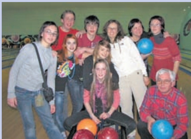
Učenci in učitelji OŠ Medvode so se preizkusili tudi v bowlingu.

Angleški učenci so tujim gostom predstavili tudi vas Ickford s šeststo prebivalci, ki ima poleg šole še trgovino, cerkev in angleški pub, zanimivo pa je, da so se domačini zavestno odpovedali javni razsvet-