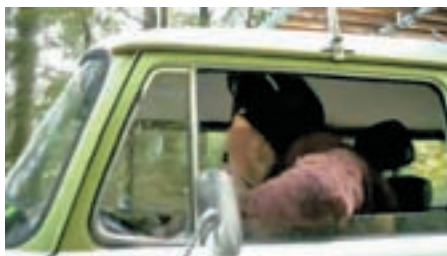
Medij v napovedniku projekta Dlake na jeziku