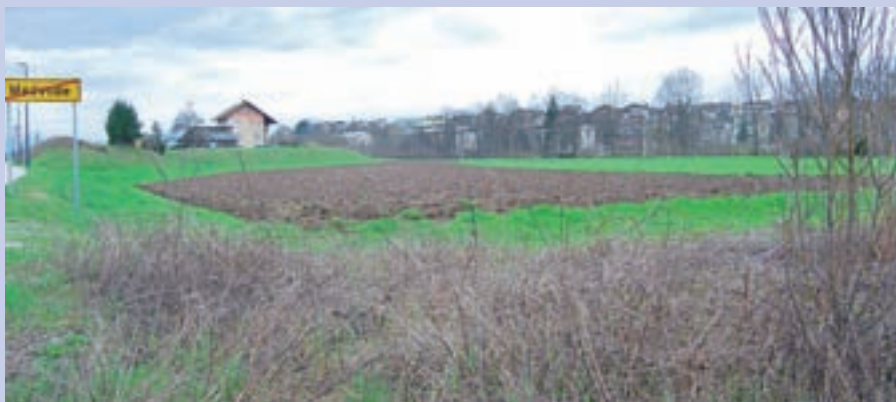
Na območju od propadajoče športne dvorane proti Goričanam je predvideno tudi nogometno igrišče.

Dvoranska sezona se torej zaključuje, medvoški igralci tenisa pa se z 20. aprilom selijo na zunanja peščena igrišča ob železnici, kjer bodo trenirali do jeseni. Balon bodo znova postavili v začetku oktobra. Maja Bertoncej