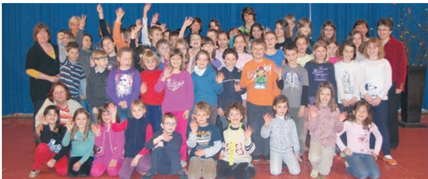
Dobitniki bronastih Vegovih priznanj na OŠ Pirniče z mentoricami