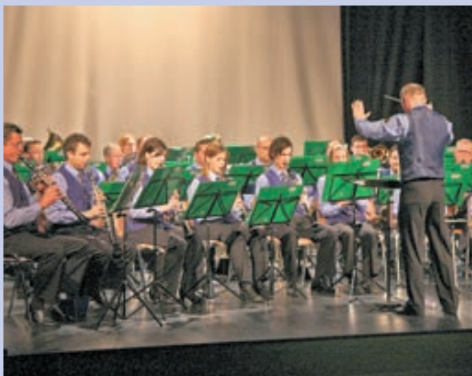
Medvoški godbeniki so se marca predstavili na pomladnem koncertu, aprila pa jim boste lahko prisluhnil na Večeru filmske glasbe.