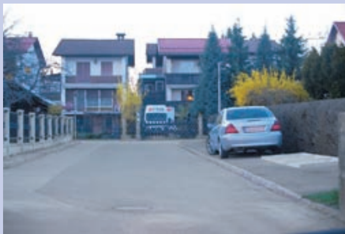
Ekološki otok je bil s Turkove ulice odstranjen, v kratkem pa naj bi ga postavili nazaj.