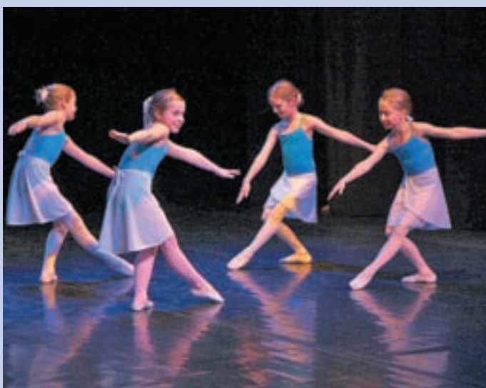
Mladi baletniki so tudi tokrat navdušili občinstvo.