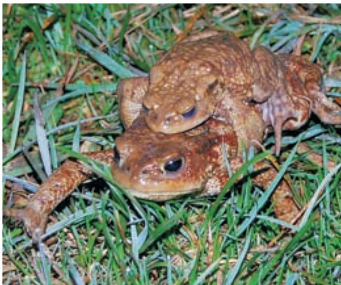
Pogost prizor, ko samica nese enega ali celo več samcev.