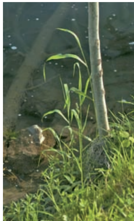
Ena izmed razstavljenih fotografij