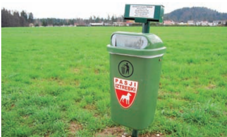
Največ koškov za pasje iztrebke je postavljenih v središču Medvod in v Preski.

Kot je dejal, se je novost kar prijetila in koški se polnijo. "So pa tudi takšni, o čemer smo se