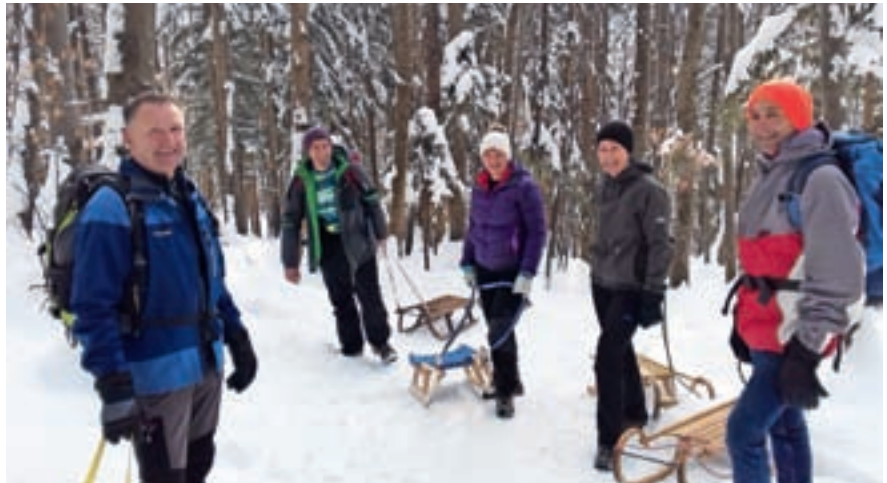
Poleg dela pa tudi prijetno zimsko druženje

treba urediti lastništvo. Krajanje so občini brezplačno odstopili odmerjene površine, kar ni običajna praksa, poleg tega so vložili tudi znatna lastna sredstva v predpripravo cest za asfaltiranje: v ureditev prepustov, naklonov in druga pripravljala dela. Ampak to je bila edina možnost, da smo izboljšali cestno infrastrukturo.«