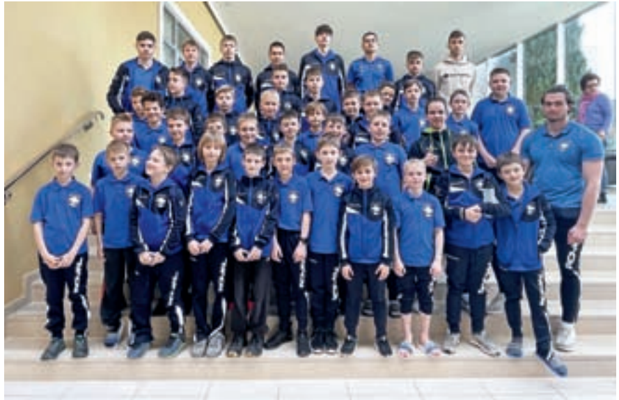
Skupinska slika mlajših kategorij z letošnjih priprav ob morju

Klub je izkoristil vse ponujene razpoložljive termine v balonu pri osnov-