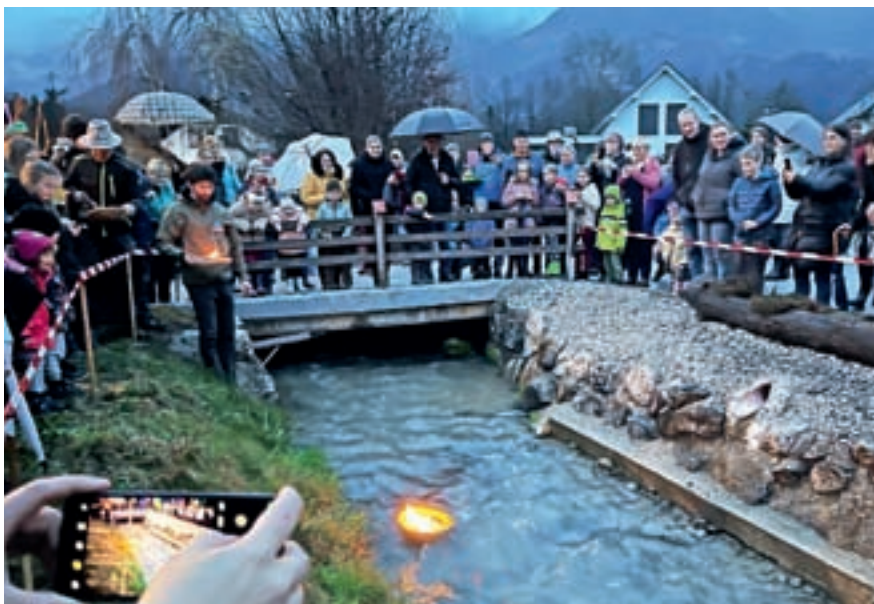
Gregorjevo na Zg. Beli, kjer so gregorčke po rakah spuščali že od začetka prejšnjega stoletja

Prvič smo izvedli Martinovanje na gradu Dvor, na katerem so se v treh koncih tedna predstavili vinorodni okoliši Primorske, Dolenjske in Štajerske. Prvič je potekal tudi Fižolov dan na Beli, na katerem so obiskovalci lahko okušali različne jedi iz fižola. Praznovanje gregorjevega se je preselilo na Zg. Belo, kjer so gregorčke po rakah spuščali že od za-