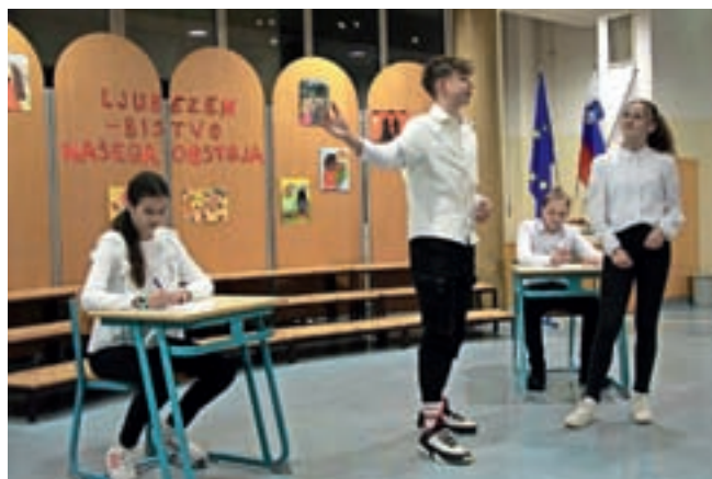
Recital ljubezenske poezije