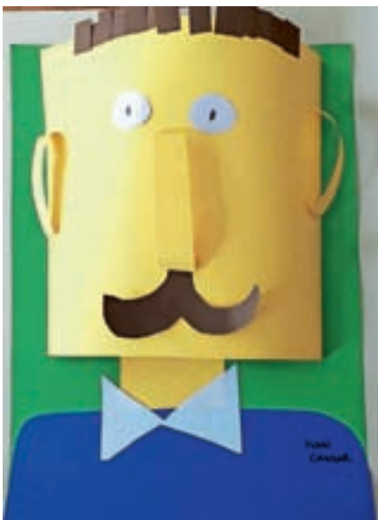
Ivan Cankar, Lovro Oblak, 3. b

Če bi bil oče, bi se lepo pogovarjal z otroki. Potrudil bi si vzeti čas zanje in zase. Veliko bi športal. Imel bi dva otroka, fanta. Poimenoval bi ju Tim in Bor. Kot oče bi ju peljal v Legoland. Imel bi psa. Želel bi si, da bi se razumeli in lepo imeli. Ažbe Mestek, 4. b