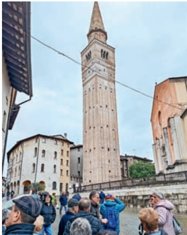
Po obisku sejma je sledil ogled mesta.

Po dveh urah na sejmu smo odšli še na ogled mesta, kjer smo si ogledali mestno hišo, cerkev nekdanjega frančiškanskega samostana in cerkev sv. Jurija. Na poti pro-