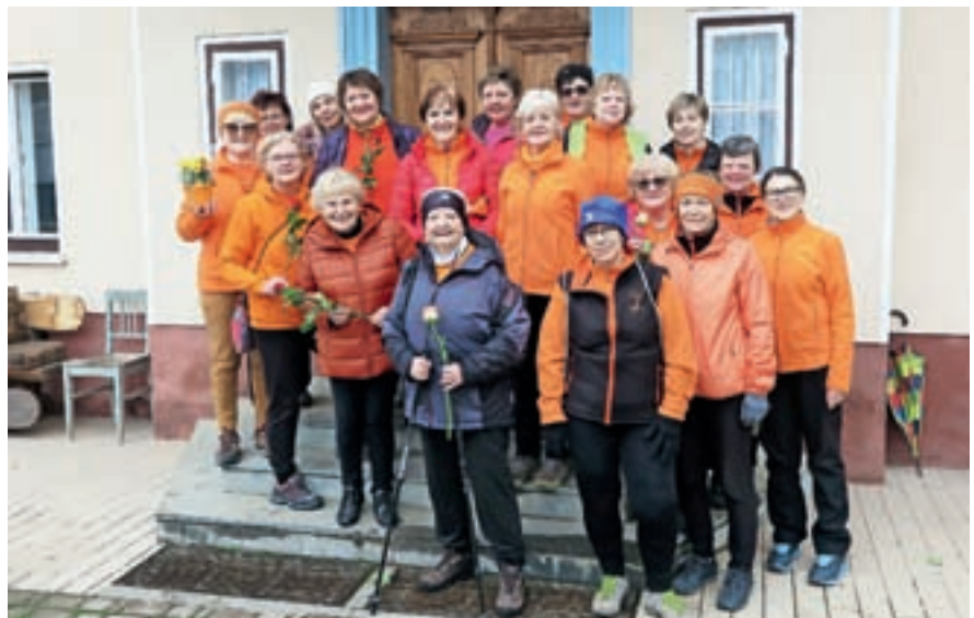
V Gostilni Majč smo na tisti marčevski petek zjutraj udeleženske nazdravile petim letom vadbe 1000 gibov. Ni manjkala niti torta. Ker je bil ravno osmi marec, je bilo še bolj slovesno.