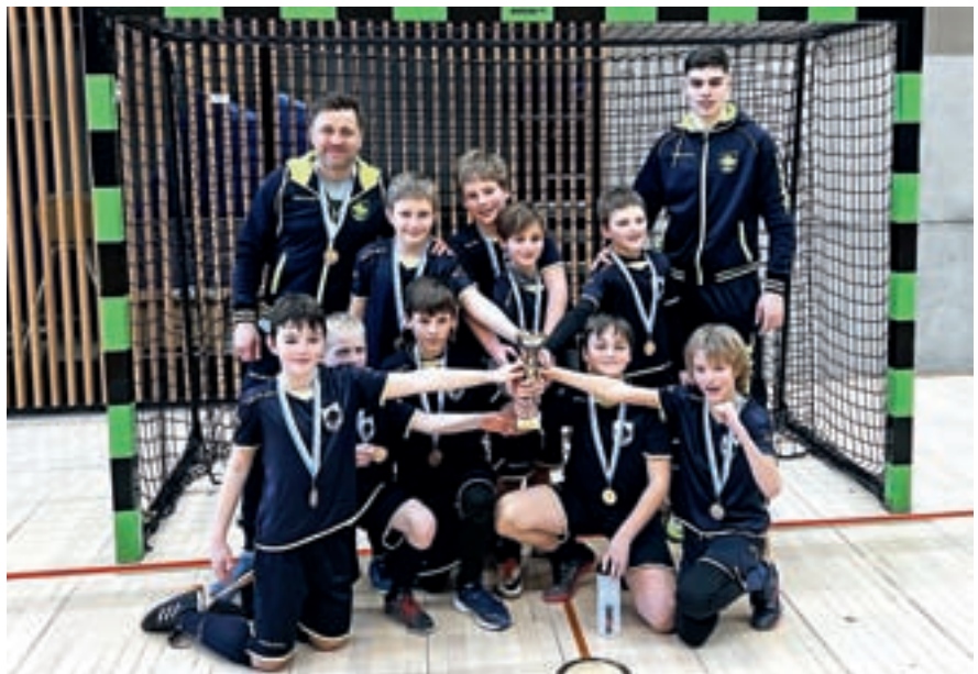
Tretje mesto v kategoriji U10 na turnirju v Stražišču

ni šoli, kjer so vse selekcije trenirale dva- do trikrat tedensko. Vrhunec pripravljalnega obdobja so bile seveda priprave v Umagu, ki so se jih od 22. do 25. februarja udeležili tako članska kot tri mlajše selekcije, igralce pa je spremljalo tudi šest trenerjev. Vse ekipe so opravile po štiri treninge in odigrale tudi dve prijateljski tekmi. V mesecu marcu so se treningi običajno že izvajali na zunanjih igriščih, kar pa letos zaradi neugodnih vremenskih razmer žal ni