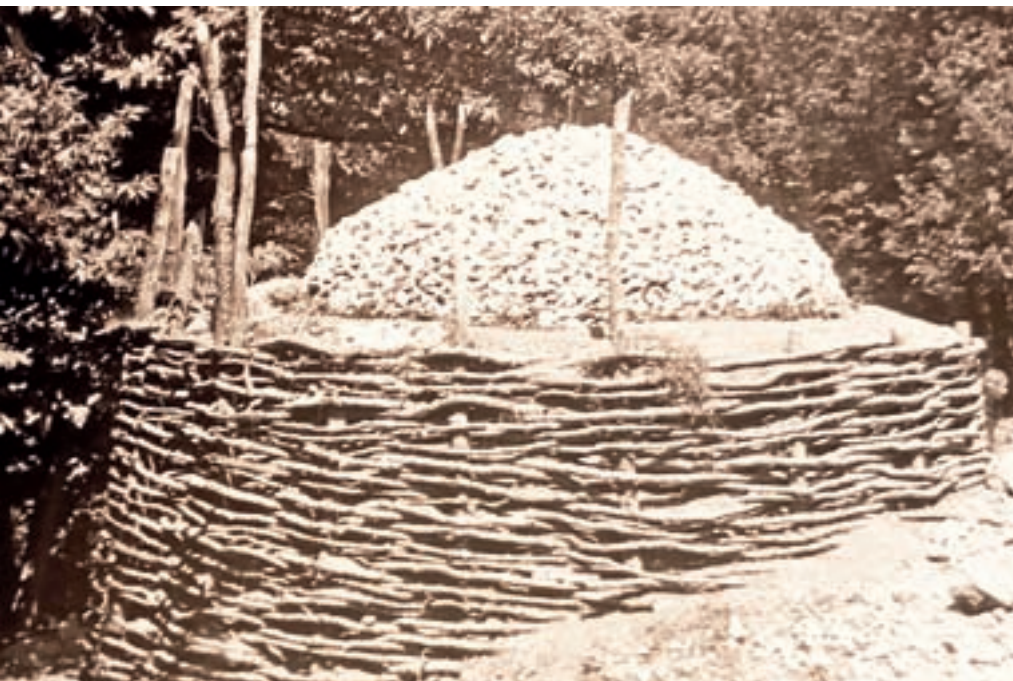
Apnenca je bila malo v zemljo izkopana okroglina, okoli katere so zabili visoke kole in med te so potem zapletli leskov les.