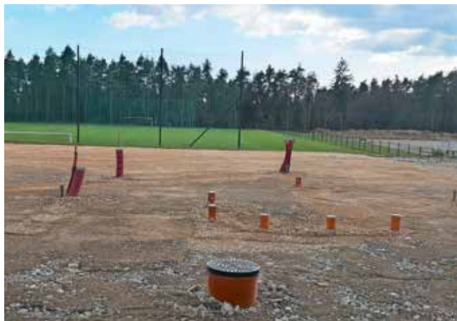
Športni park Preddvor napreduje po fazah

Gradbeni odbor se je sestel 6.7.2023 na prvi seji, kjer smo pregledali izvedbo druge faze. Izvedene so bile preostale drenaže, kompletno veliko nogometno igrišče s panelno ograjo, lovilnimi mrežami na prostoru, kjer bosta montirana oba gola, in zalivalni sistem z betonsko cisterno za namakanje igrišča z vsemi potrebnimi povezavami. Pri izkopu za cisterno je izvajalec naletel na izviri podtalnice, za katero je bilo postavljeno zajetje iz betonskih cevi, od koder se bo prečrpavala v cisterno. To je kljub vsemu pozitivna okoliščina, saj predvidevamo, da bo vode tudi v najbolj sušnem obdobju dovolj brez uporabe javnega omrežja. Namakalni sistem že obratuje s krmiljenjem preko časovnika. Izdelane so bile še grobe instalacije za javno razsvetlavo, električni ter vodovodni priključek za celotno območje športnega parka, pa tudi makadamska pot z zgornjega platoja do nogometnega igrišča na V in Z strani. Na delu območje okoli nogometnega igrišča je posejana trava. Občina ima pogodbo z izvajalcem za gnojenje in urejanje trave ter ločeno pogodbo za košenje. Trenutno se izvajajo dela tretje faze. Zgrajena bodo parkirišča na zgornjem delu platoja, servisni objekt (garderobe, sanitarije, klubski in pomožni prostori,...), plato z zunanji umivalniki in za zabojnike za komunalne odpadke ter pripadajoča zunanja ureditev vključno z asfaltiranim uvozom na območje kompleksa. Izvedene bodo tudi vse povezave na gospodarsko javno infrastrukturo, katera je potrebna,