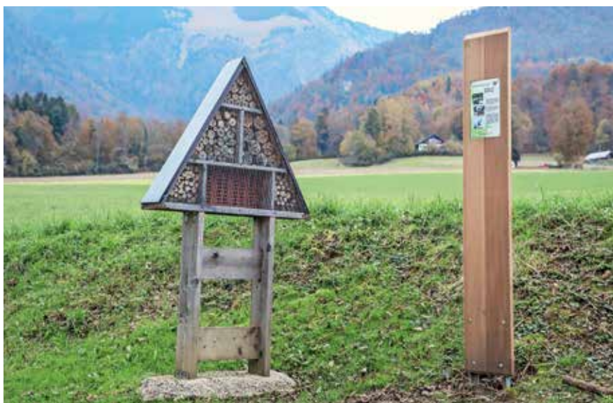
Na učni poti je tudi hotel za žuželke.