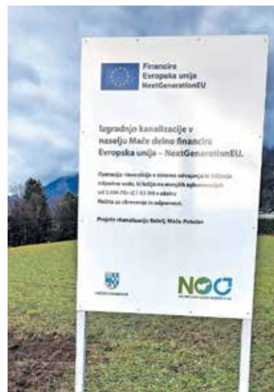
Občina Preddvor, Dvorski trg 10, 4206 Preddvor