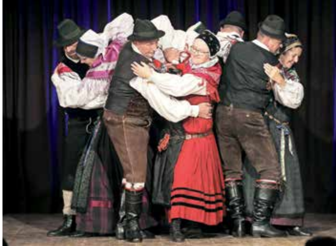
Folklorna skupina Preddvor je tokrat predstavila dolensjske plesse.