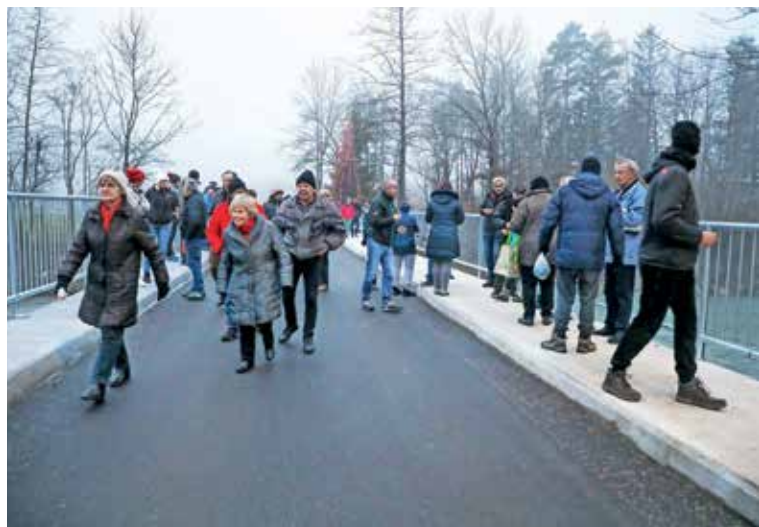
Na odprtju obnovljenega mostu se je pridobitve veselilo veliko krajanov.