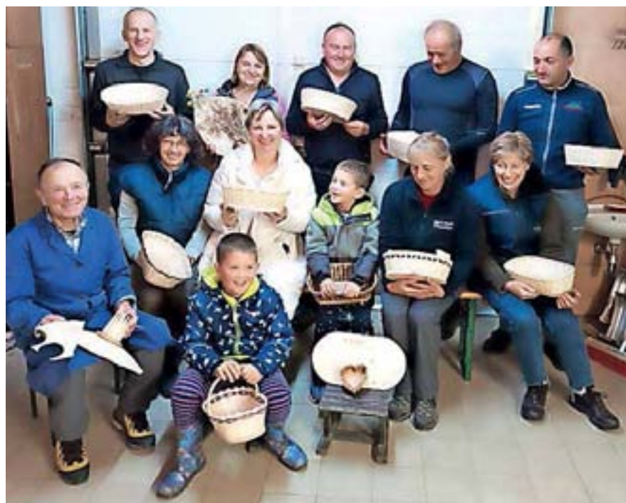
Udeleženci z izdelki