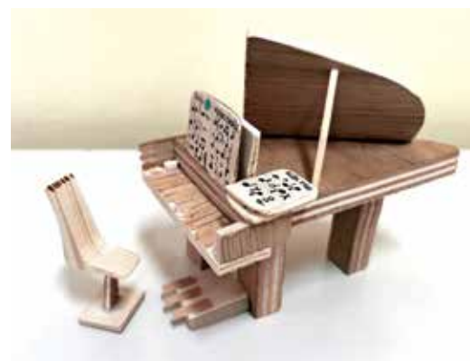
Klavir iz odpadnih kosov lesa, Eva Fras, 6. b

Nekega dne je poplavilo razred 3. b. Nekaj dni smo se selili iz učilnice v učilnico. Potem pa smo našli novo učilnico – preselili smo se v telovadnico v vrtcu. Postalni smo šolarji v vrtcu. V vrtcu nam je dobro – učimo se in se igramo. Na začetku smo imeli majhno belo tablo, a zdaj smo dobili veliko