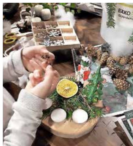
Delavnice so bile presenetljivo dobro obiskane.

Sredi decembra smo potem izdelovali še voščilnice in lanternice, fantje pa so postavljali smrečico na začetku vasi. Sledil je prižig lučk in pohod z lanternicami okoli Bašlja. Na božični večer nas čaka še pohod k polnočnici, 26. decembra pa nas bo ponovno obiskal Božiček, ob 17. uri pa bo pred Brunarico igricala za otroke in obdaritev bašljanskih otrok. Več o Božičk-