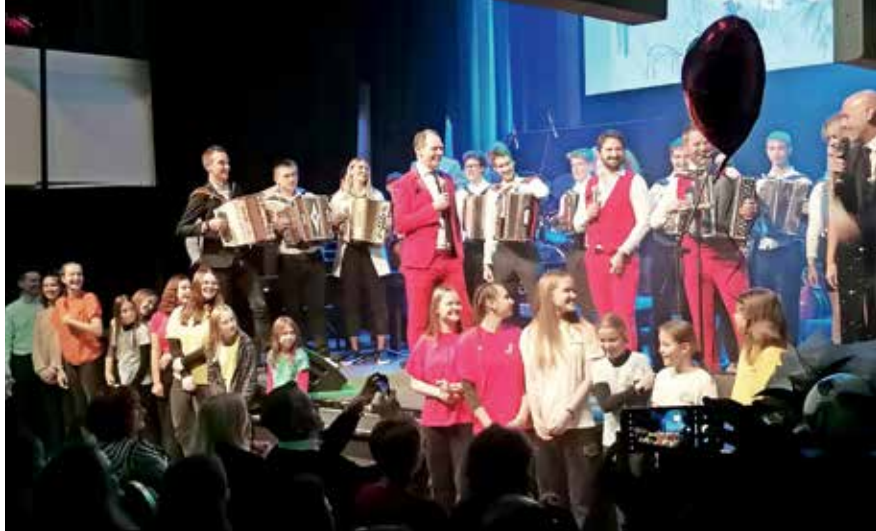
Dobrodelni koncert za otroke z rakom v Festivalni dvorani