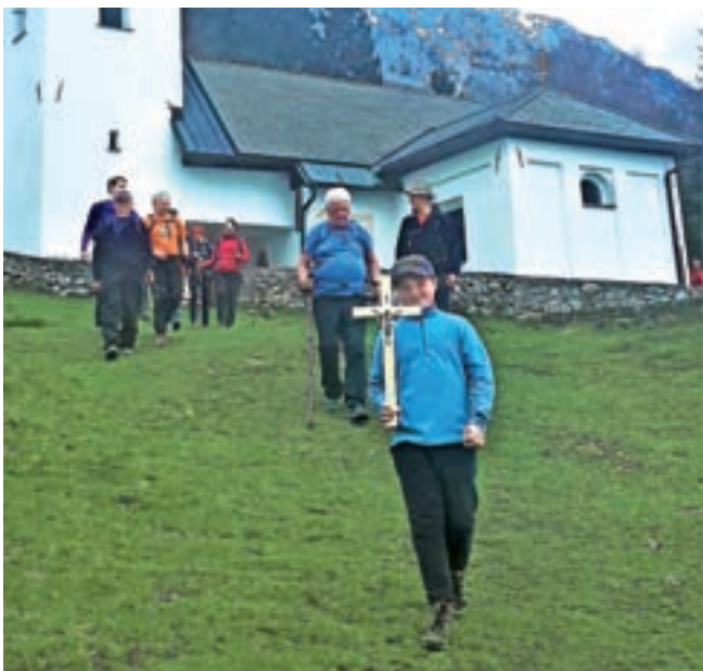
Sv. Lovrenc nad Bašljem

zime ustvarili nov film. Že v petek, 16. junija, ob 19.30 pa bomo v sklopu dogodkov ob občinskem prazniku ponovno predvajali lanski film Z ledinskimi imeni na Zaplato. Vabljeni torej »v kino« v preddvorski kulturni dom.