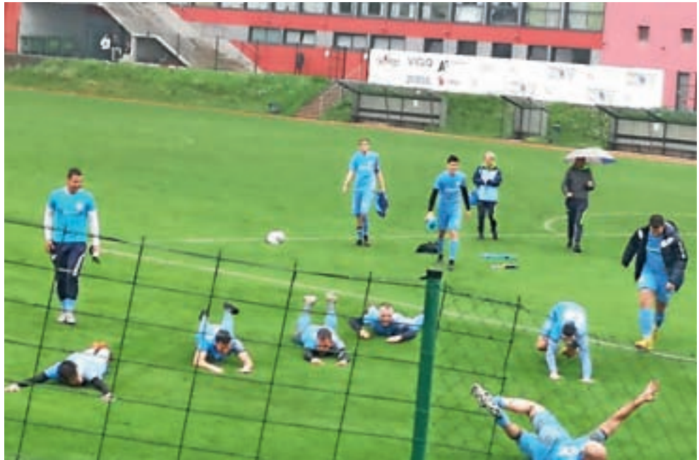
Veselje ekipe po osvojeni točki na Jesenicah