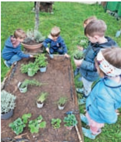
Vrtnarjenje v Storžku

Lani smo ugotovili, da otroci zelo radi vrtnarijo, in smo zato z otroki v vrtcu Storžek ponovno zasadili vrtčevske gredice, ki pa so podobo malce spremenile: starejšim skupinam smo tokrat ponudili možnost raziskovanja uporabe zelišč in začimb. Pridno smo zavihali rokave in zasadili peteršilj, pehtran, origano, lovor, meto, meliso, timijan, stevio, sivko in drobnjak. Zdaj opazujemo različne sorte in njihove posebnosti, ugotavljamo razlike med začimbami in zelišči, otroci pa povsem praktično spoznavajo različne okuse. Moči združujemo tudi z vrtčevsko kuhinjo, kjer lahko naš pridelek uporabijo za popestritev okusa jedi. V mesecu juniju, ko nam bo verjetno že precej vroče, bomo iz sveže mete in melise pripravili osvežilen sirup, s katerim si bomo lajšali žejo. Spoznali bomo uporabo naravnega sladila (stevia) in pripravili mešanice za okusne in zdrave čaje. Če pa nam bo slučajno ostal kakšen pridelek, se ga bomo naučili posušiti in shraniti za hladnejše mesece. Ker je letošnja vrtnarska dogodivščina namenjena spoznavanju različnih okusov, smo grmičevje popestrili z belo malino in belim ribezom. Lepo je zacvetela tudi ameriška borovnica, ki smo jo posadili lani. Otroci že komaj čakajo na obiranje plodov in nove dogodivščine na vrtčevskem vrtu. Blažka Gašperlin, vzgojiteljica