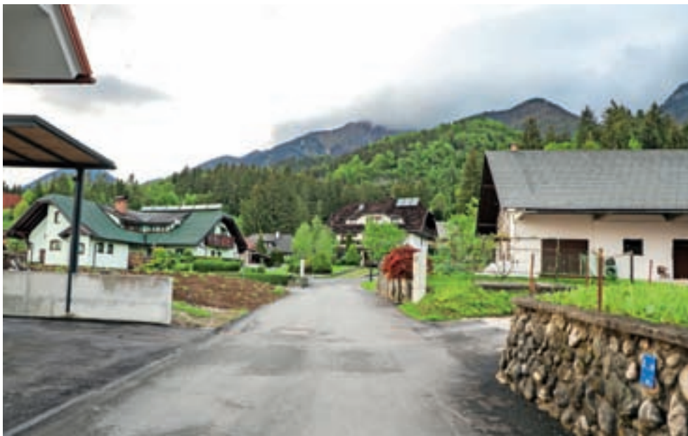
V Mačah se zdaj izvajajo priklopi na kanalizacijsko omrežje.

»Trebalo se je tudi zavedati, da se ljudje začnejo odseljevati, če ni kakovostnih pogojev bivanja, vemo pa, kaj to pomeni za podeželje.«