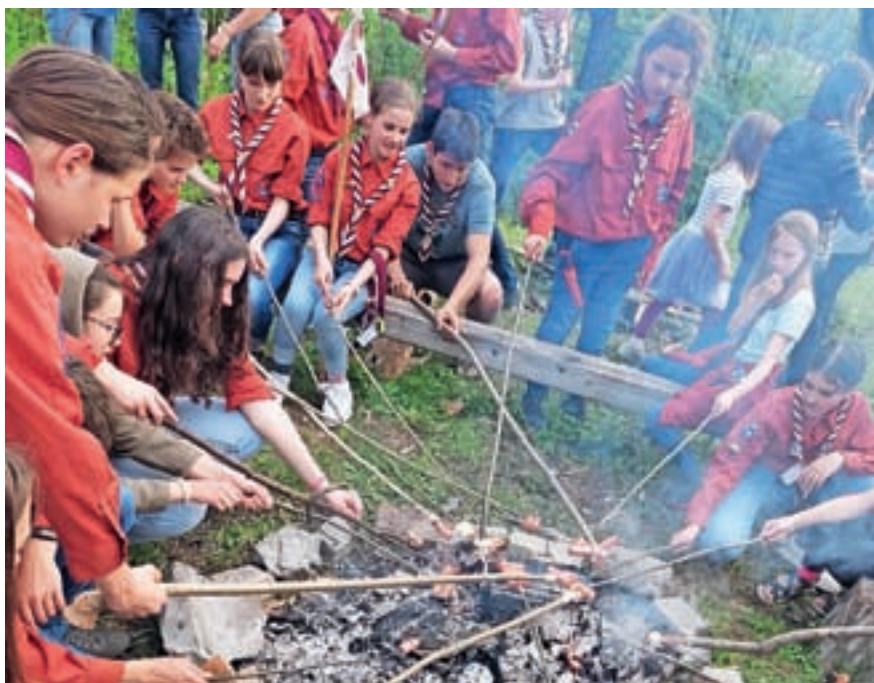
Ob ognju / Foto: arhiv Viharnih kavk

Skavti stega Preddvor 1 smo tako aktivni po Sloveniji in toliko se nam godi, da komaj uspemo najti čas, da kaj tudi zapišemo. Pridno izkoriščamo vse vremenske pojave, ki so nam dani, ter svoja srečanja oblikujemo v naravi. Vsaka veja je letos že odpovala na svoje zimovanje, najmlajši volčiči daleč tja nad Idrijo, četa malo bližje v Tunjice, popotniki pa so se potepali po Izoli. Krdelo Mogočnih volkov je poleg tega pripravilo pogostitev za mame v naravi kljub močnemu deževju (sami so nabrali, skuhali ter zamesili in spekli zajtrk v naravi), obiskali so kmetijo Ata volka ter se naučili, kako skrbeti za živali, spoznali, od kod pride mleko, ter z brbončicami ugotavljali, kaj vse lahko naredimo iz njega. Prav tako so sodelovali na prvem ognjiščnem srečanju s krdeli iz vse Gorenjske. Izvidniki in vodnice so svoja srečanja spomladi namenjali