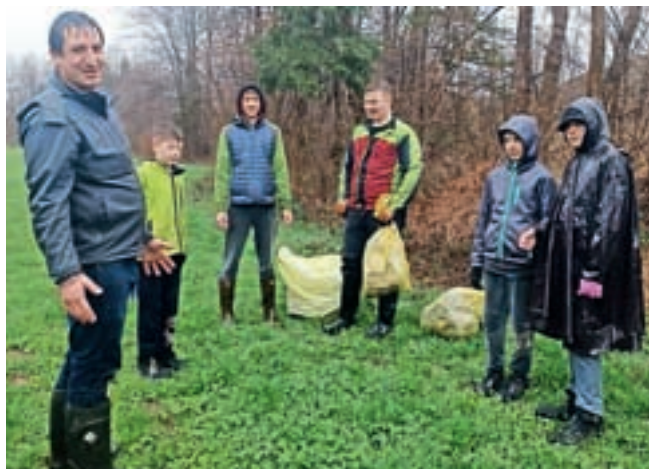
Slabo vreme odraslih in šolarjev ni odvrnilo od udeležbe na čistilni akciji.

V okviru medgeneracijskega sodelovanja bo Ljudska univerza Kranj v sodelovanju z Občino Preddvor izvedla poletne počitniške aktivnosti za otroke, stare od 6 do 12 let. Potekale bodo od 26. do 30. junija od 8. do 16. ure in vključujejo kosilo. Celoten program počitniškega tedna bo na voljo v začetku junija.