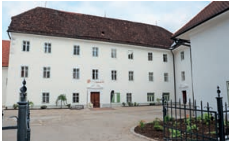
Grad Dvor

Občina Preddvor z objavami na spletni strani ponuja možnost večjega obveščanja in vključenosti občanov. Vse, kar morate storiti, je, da se registrirate na spletni strani https://www.preddvor.si in se brezplačno naročite na e-obvestila občine. Ta vam bodo posredovali enkrat tedensko. Če pa bi želeli stopiti v stik s krajevnim odborom (KO), oddajte zahtevek za dostop do e-obveščanja na naslednje elektronske naslove: kopotoce@gmail.com (KO Potoče), kobaselj@gmail.com (KO Bašelj), p.bergant@kokra.si (KO Kokra), krajevni.odbor.bela@gmail.com (KO Bela), kopreddvor@gmail.com (KO Preddvor) in janko.bolka@gmail.com (KO Breg, Možjanca, Tupaliče). To so tudi elektronski naslovi, kamor lahko krajani naslovite svoje želje, opažanja in pripombe, ki se nanašajo na vaš kraj.