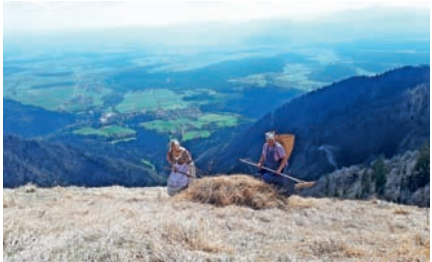
Silva in Simona grabita t. i. starico / Foto: arhiv društva

Letos bomo s postavitvijo tabel ohranili sedem imen, ki bi sicer čez nekaj let, ko današnje starejše populacije ne bo več, utonila v pozabo. Pet jih je ob Mačevski poti: Medvednek, U konc pota, F'ndetov vrt'c, Fuchsova frata in