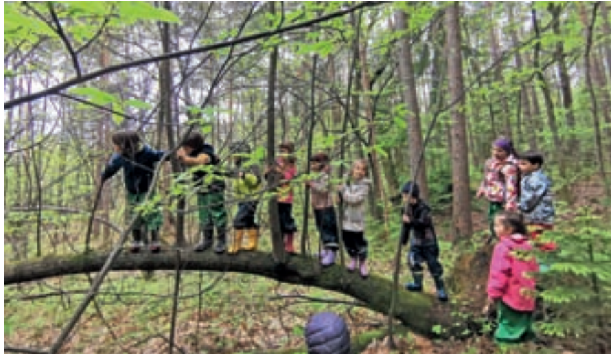
Gozdne dejavnosti vrtca Čriček

Prednostna naloga in prepoznavna vizija vrtca Čriček je bivanje in dejavnosti v naravnem okolju. V letošnjem letu smo si vzgojiteljice zadale »gozdne« cilje s področja varnega in spodbudnega učnega okolja, kar gozd vsekakor je. Hkrati pa je pomembno tudi doživljanje gozda z vsemi petimi čutili, ki pa se nadgrajujejo s še dvema manj znanima, a zelo pomembnima čutoma: propriocepcijo, ki je zavedanje telesa, občutek lastnega gibanja, sile in položaja telesa, in vestibularnim čutom (ravnotežno čutilo), ki je vseskozi aktiviran na neravnih gozdnih površinah, pri plezanju, premagovanju ovir, hlodov v gozdu, pri vzpenjanju in spuščanju, gujanju ... V našem vrtcu se zavedamo, da dobro razvit vestibularni sistem nima vpliva samo na ravnotežje, ampak bistveno vpliva na učenje. Ponujamo različne dejavnosti, omogočamo pa tudi veliko proste igre v gozdu. S tem seznanjamo tudi starše in jih z dejavnostmi v