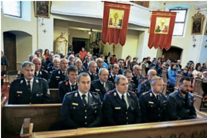
Tradicionalno smo se preddvorski gasilci večerne maše udeležili v svečanih uniformah.

V marcu smo prvo iz sklopa spomladanskih operativnih vaj namenili gozdnim požarom, saj mineva eno leto od požara na Potoški gori. Na povabilo vodstva podjetja Jelovica smo v sklopu preventive izvedli prikaz gašenja z ročnimi gasilnimi aparati za zaposlene v industrijskem obratu v Preddvoru. V maju smo izvedli taktično vajo na Srednji Beli, kjer so se naši novi operativci spoprijeli z najbolj izpostavljenimi nalogami operativnega delovanja. Žal pa od občnega zbora in do danes ni šlo brez intervencij. Tako smo aprila skupaj s kolegi iz PGD Jezerško in dežurno ekipo koncesionarja očistili cesto Preddvor–Jezerško v Kokri, ki je bila zaradi podora kameinja in dreves neprevozna. V začetku maja smo s tehničnim posegom odprli vhodna vrata stanovanjske hiše in ekipi PHE NMP Kranj omogočili dostop do onemogle osebe. Prvi konec