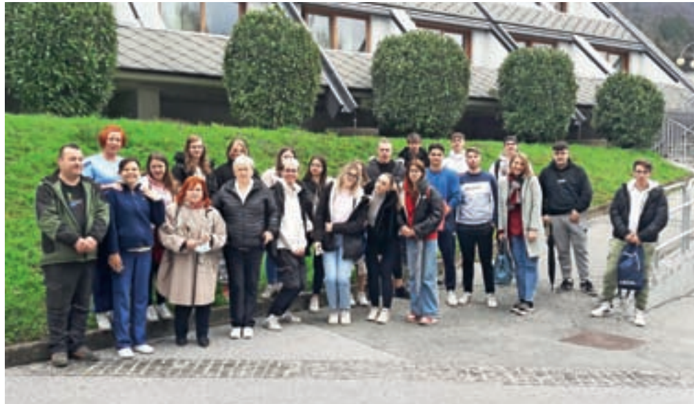
Skupaj z dijaki in profesorji Srednje ekonomske, storitvene in gradbene šole ŠC Kranj smo pripravili zanimiv in pester prostovoljski dan.

Stanovalci se že veselijo majskega izleta na Brezje z obiskom sv. maše, piknika s svojci, obiska ribogojnice Bizjak v okviru projekta LAS Gorenjska košarica, predstavitve Žoga benda na Paradi učenja v Kranju ter nastopov pevskih zborov, otrok iz vrtca Preddvor, Rdečih noskov ter folklornih skupin DU Naklo in FS Sava Kranj, razstave likovnih del učencev OŠ Preddvor ... Na praznik dela, 1. maj, so nas tudi letos razveselili god-