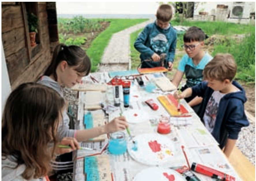
Pri Tomaževi kajži so otroci ustvarjali panjske končnice.

Pomlad je že nakazovala razgibano poletje. Odprtje dogajanj je pripadalo tednu Okusi čemaž v Preddvoru, na katerem že peto leto sodelujejo domači gostinci s svojo odlično ponudbo dobrot iz čemaža. Žal nam je letos zagodlo vreme in prvič v vsem tem času nam ni uspelo izpeljati Čemaževe kuhinje na prostem, ki je iz leta v leto bolj obiskana. Tudi velikonočno dogajanje je postreglo s kar nekaj zanimivi dogodki. Pri Tomaževi kajži na Zgornji Beli so se otroci lahko prvič preizkusili v starih igrah s pirhi ali pa so se podali v iskanje velikonočnega zajčka po Gamsovi poti, v gradu Dvor pa so bile prvič razstavljene pasijonske jaslice, ki so požele veliko zanimanja obiskovalcev od blizu in daleč. V juniju se bodo ljubitelji pohodništva podali na 13. pohod po Stari tovarni poti, po kateri so naši predniki v 14. stoletju iz Kranja skozi dolino Kokre v Železno Kaplo tovorili železo in morsko sol. Svetovni dan čebel pa smo proslavili z delavnico poslikave panjskih končnic, na kateri si je bilo možno ogledati čebelnjak s predstavitvijo čebelarstva, ki ji je sledila manjša pogostitev z domačimi dobrotami ob spremljavi harmonike. Vseskozi so v gradu Dvor potekali tudi pogovorni večeri z izjemno zanimivimi gosti in temami, ki pa se bodo z junijem do jeseni zaključili. Junij je običajno poln dogodkov, saj v tem mesecu praznuje naša občina. Tudi letos smo pripravili pester program. V začetku vas vabimo