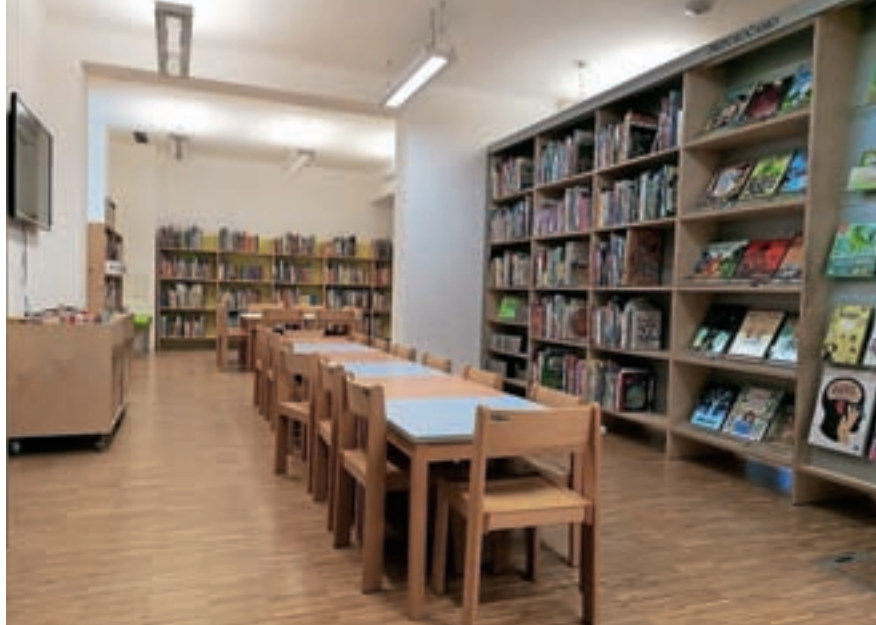
Prostornejši otroški oddelek po prenovi

Največja pridobitev pa je prav gotovo širitev pravljичne sobe oz. otroškega oddelka, ki je po prenovi mnogo preglednejši in prostornejši. V prostor smo umestili dodatne regale, svoje mesto so npr. med drugim končno dobili tudi priljubljeni stripi in gradivo iz znanega projekta Družinsko branje. Gradivo je na ta način bolj pregledno, pridobili pa smo tudi nove površine, kjer bomo predstavljali novosti, izpostavljali tematske razstave ipd. Še