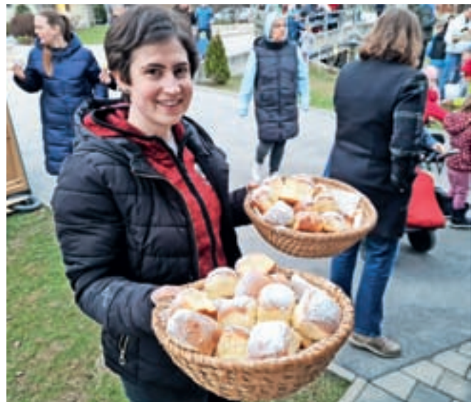
Iz kuhinje ljubiteljskega etnologa vedno diši po čem sladkem, sveže pečenem ...