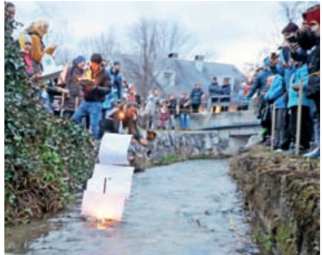
Po Belici so ponovno zapluli gregorčki.

Na velikonočni ponedeljek pa kajža ponovno vabi v svojo bližino: med 15. in 19. uro bodo potekale igre s pirhi, dišalo pa bo tudi po kuhanih štrukljih.