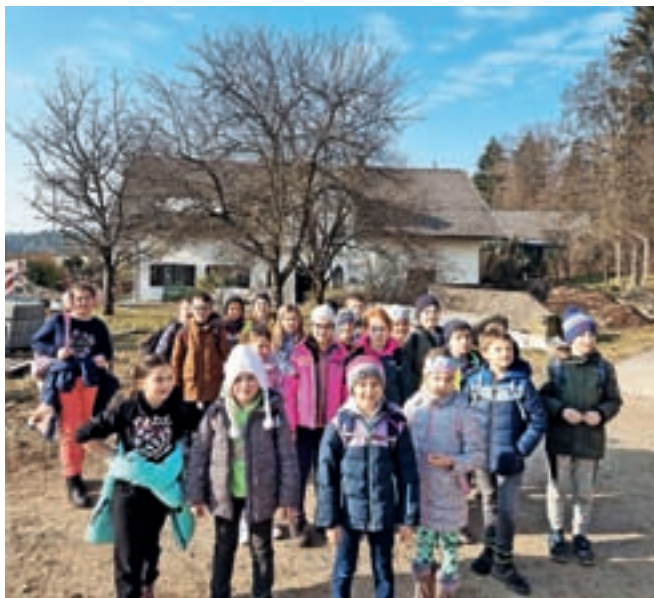
Tretješolci pred Valjavčevo rojstno hišo