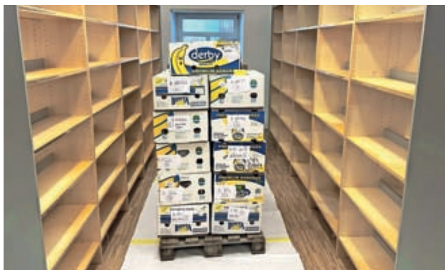
S knjigami smo napolnili več kot petsto škatel.

posebno pa nas veseli, da se bodo v prostoru lahko izvajale pravljичne urre z ustvarjalnimi delavnicami, ki potekajo vsako soboto ob 10. uri, ter bibliopedagoške dejavnosti – tu imamo v mislih predvsem obiske vrtčevskih skupin in razredov prve triade osnovne šole.