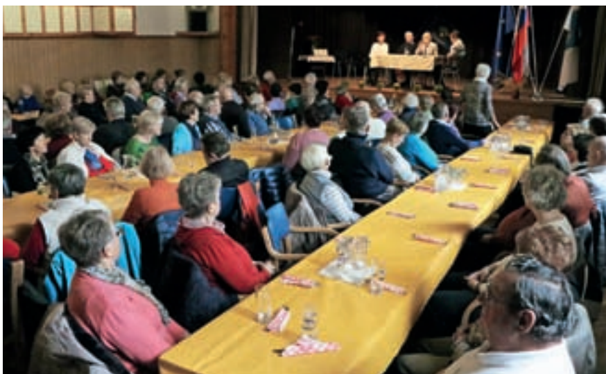
Praznovanje visokega jubileja DU Preddvor je bilo združeno tudi z letnim občnim zborom.