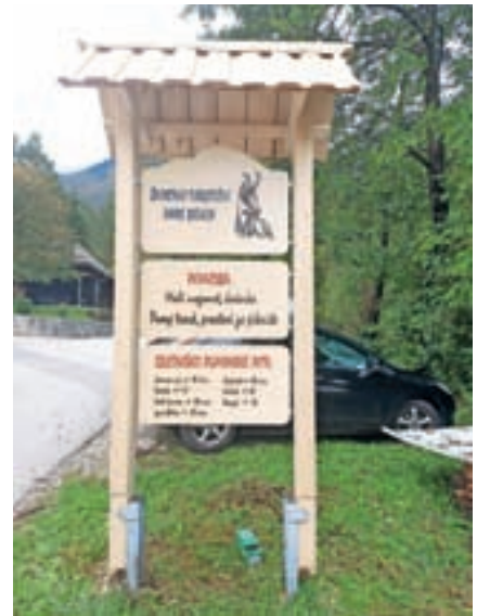
Informacijska tabla

Na velikonočni ponedeljek, 10. aprila, bomo skupaj z RK Bašelj pogostili starejše nad 80 let. Ker se po navadi vsi