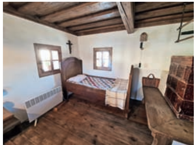
Pogled v notranjost kajže