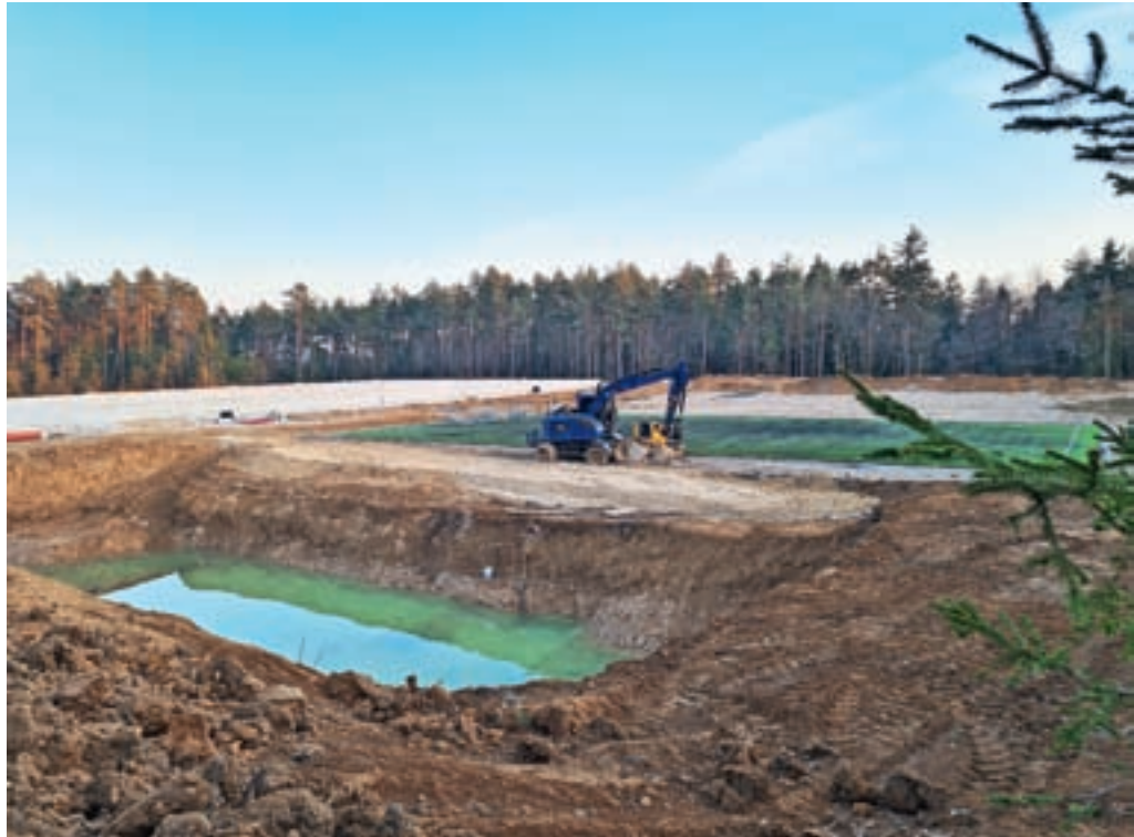
Izkop za izgradnjo zbiralnika vode. Trenutno dela še potekajo.

In ko se spomladi ozračje dovolj segreje in je temperatura primerna za sejanje trave – najverjetneje maja – bodo to tudi izpeljali. »Iz prakse: po besedah izvajalca lahko podobna igrišča, mogoče s še malce slabšo drenažo, kjer je bil uporabljen ta princip, avgusta že gostijo prvo tekmo,« je optimističen župan.