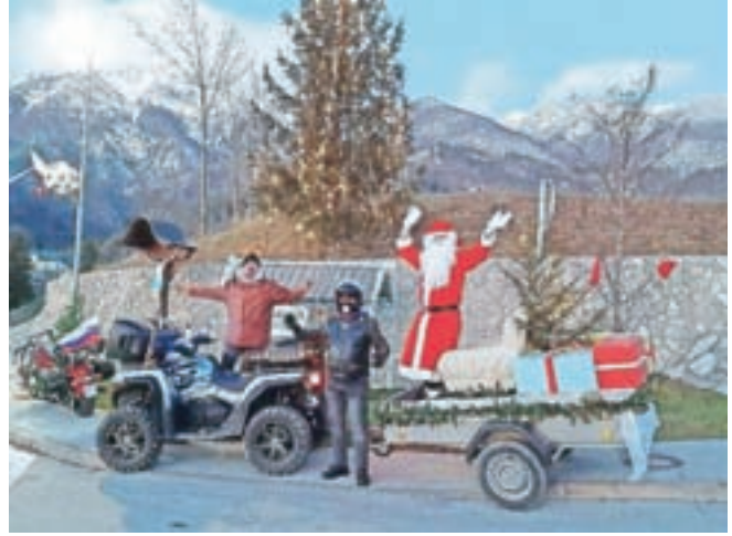
Bašljanski Božiček na poti z darili

Pomočniki skratje so pred obiskom Božička, ko so otroci gledali igrico, razdelili darila pred vrata hiš. Ta so vsa pri-