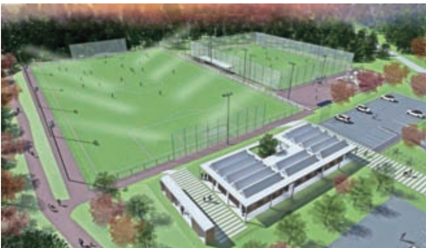
Kako bo videti športni park / Skica: Hafner Arhitekti, d. o. o.

Ker nam v vsej šestdesetletni zgodovini najmnogičnejšega športnega društva v občini optimizma ni nikoli zmanjkalo, še vedno upamo na ugoden razplet in začetek gradnje velikega nogometnega igrišča v športnem parku najkasneje letošnjo jesen.