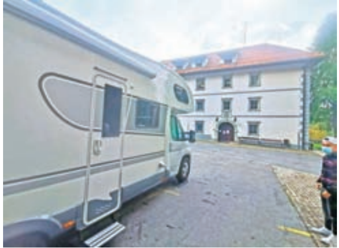
Avtodom za pomoč zaposlenim v DSO Preddvor

Na vrhuncu epidemije, ko so bili zlasti na udaru domovi upokojencev, se je najbolj izkazala tudi družbena solidarnost. Tudi Dom starejših občanov Preddvor je bil v tem času deležen različnih oblik pomoči, od prostovoljcev iz lokalnega okolja, ki so osebju priskočili na pomoč pri oskrbi stanovalcev, do gostincev, ki so občasno pošiljali priboljške za preobremenjene zaposlene. V drugem valu epidemije pa je dom dobil v uporabo tudi dva avtodoma, ki ju je za štiri mesece odstopila Hiša na kolesih. Ta se ukvarja z izposojavo avtodomov, prodajo in servisom; v sezoni oddajajo 75 vozil, epidemija, ki je močno zamajala turizem, pa je njihovo dejavnost okrnila za več mesecev.