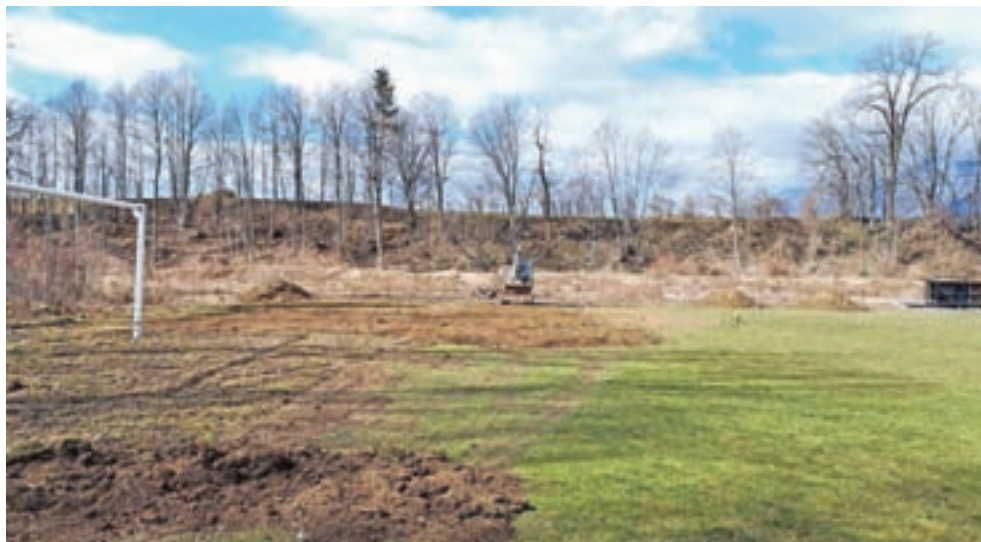
Nujna vzdrževana dela na nogometnem igrišču Za žago

Upali smo vsaj na izvedbo tradicionalnega smučarskega tečaja med letošnjimi zimskimi počitnicami, vendar so nam epidemiološke razmere in sprejeti ukrepi tudi to preprečili. Prav tako se je spet zavlekel postopek pridobi-