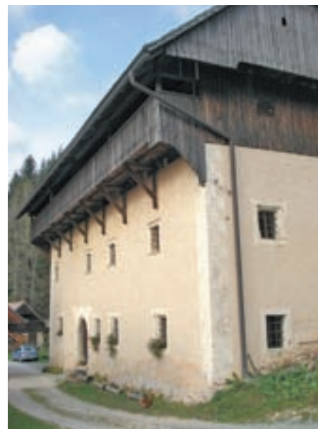
Del kmetije je tudi Jenkova kasarna, v kateri je etnografski muzej.

Nikdar ni pomišljala, da bi ji bilo v življenju lažje, če ne bi bila na Jezerskem, ki je malo od rok. Nasprotno: doma na Jezerskem