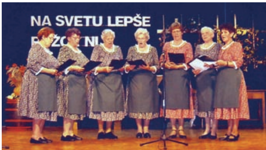
Jezerške pevke v Skorbi