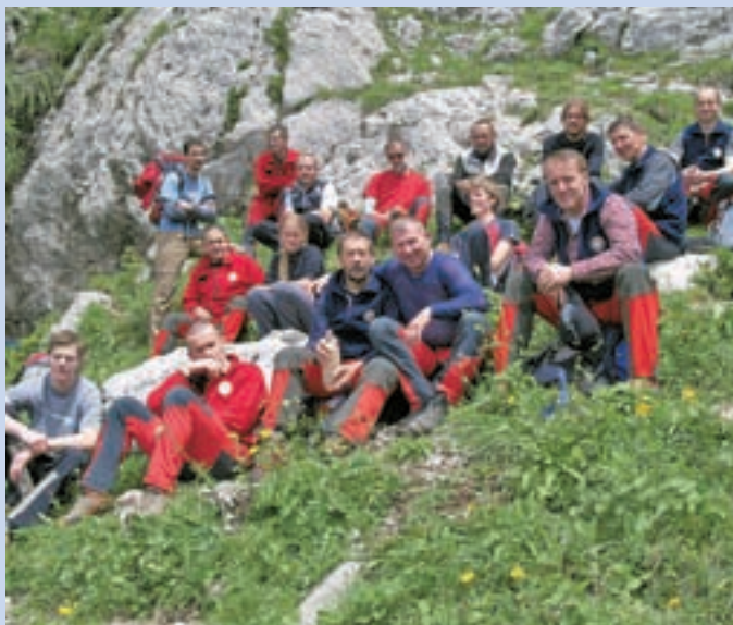
Gorski reševalci na Velikem vrhu