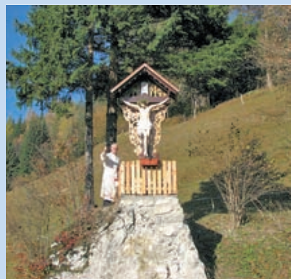
Blagoslov Jožovega križa