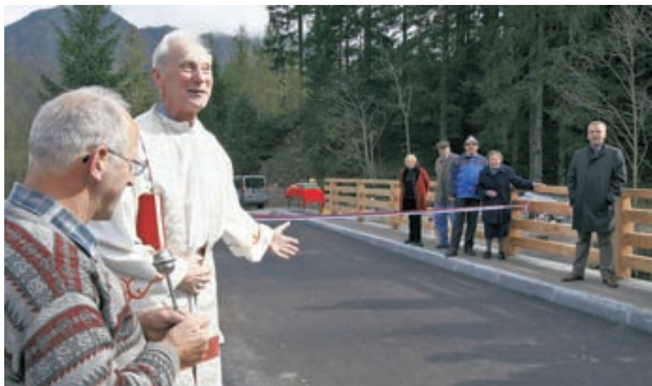
S slovesnega odprtja Lustikovega mostu

zerska dolina od Storžiča do Obirskega, tudi vsi trije cerkveni zvoniki.”