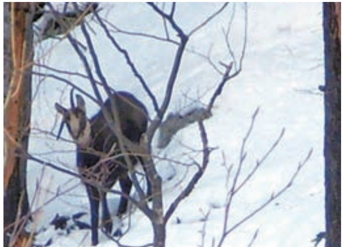
Gams s posebnimi roglji

Zimovališča so območja, ki ponujajo živalim (sorazmerno za letni čas) dovolj hrane, toplote, miru, preglednosti, zaščite. Različne vrste v različnih strukturah in številu. Pojavljajo se tudi v naši neposredni bližini; v vrtovih, sadovnjakih, na kompostih, jeleni so se prilagodili in če je stiska velika, od-