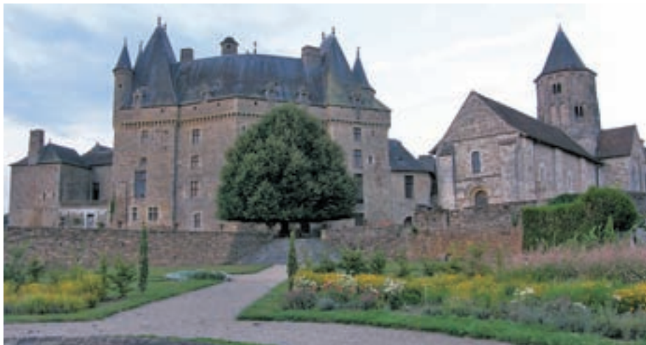
Chateau de Jumilhac

ločilo več kot sto petdeset kilometrov. Si pač sam, le dežela ob poti in nebo nad glavo ter cesta, ki si te podaja - kaj drugega bi počela, kot šla še malo naprej?