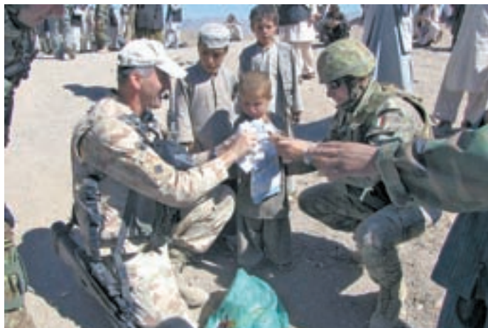
Dobrodelna akcija za Afganistan