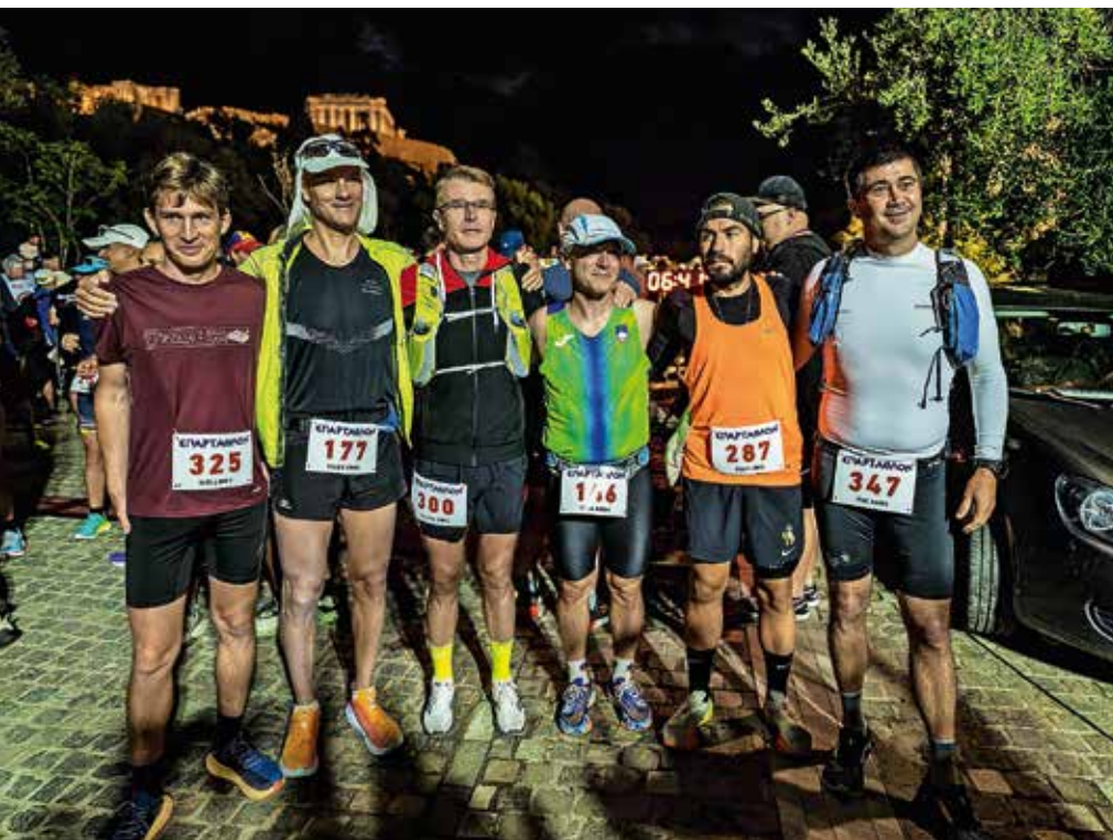
Večina slovenskih udeležencev Špartatlona 2023 pod Akropolo

Na tekmo smo tudi tokrat odšli ekipno skupaj z Romanom, Primožem in Markom. Start je bil načrtovan za soboto, 30. septembra. Od članov, ki mi sicer največ pomagajo na tekmah, je manjkal le Iztok. Že v torek smo z Brnika preko Beograda prispeli v Atene. Letos nas je bilo