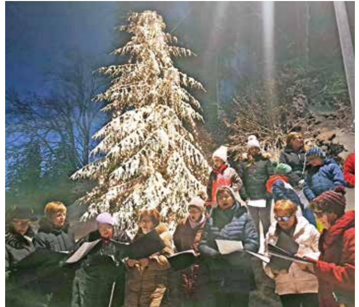
Program ob prižigu lučk so soustvarile tudi domače ljudske pevke.

Vsem občanom in nastopajočim se zahvaljujemo za sodelovanje