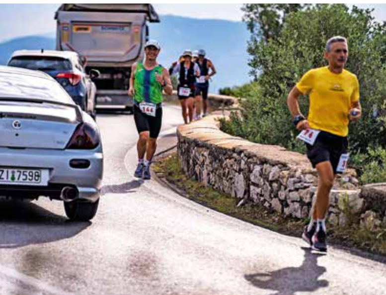
Trasa ob morju je bila tudi valovita.

na startu osem Slovencev med približno 390 tekači, s katerimi smo se pred tekmo tudi na kratko podružili in si izmenjali načrte ter poskrbeli, da so se podporne ekipe spoznale med seboj. Tudi tako, da smo si izdelali enotne majice, za kar je poskrbel naš najboljši ultramaratonec ta hip, Luka Videtič.