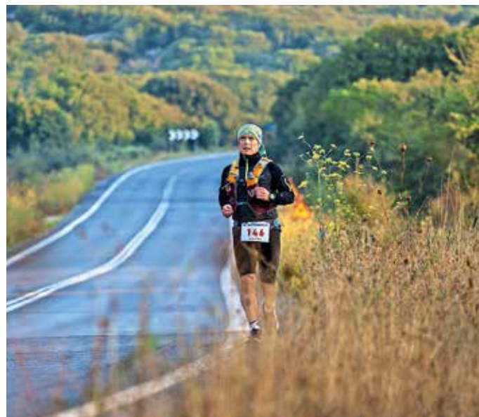
Jutro je bilo precej hladno.

Po nekaj vzponih in spustih počasi nastopi nočni čas. To je na tej tekmi neugodno še iz enega zornega kota. Grčija je namreč vsaj v tem delu polna tropov potepuških psov, ki lahko predstavljajo dokaj neprijazno okoliščino ob srečanju. Tega se do-