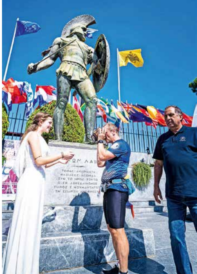
Konkretno požirek vode pred kipom Leonidisa

Nekaj vedrine je nastopilo z jutrom, saj dan po navadi poskrbi za dvig razpoloženja na takih tekih. Še kar nekaj časa je bilo pošteno mrzlo, okoli devete ure pa je hipoma nastopila konkretna vročina. Tako sem spoznal, kako silovito težje bi lahko bilo, če bi bile take temperature že dan prej. Dejansko so bili pogoji za tekmovanje izvrstni, kar kažejo tudi trije novi rekordi: moški in ženski rekord ter rekord števila tekačev, ki nam je uspelo zaključiti tek.