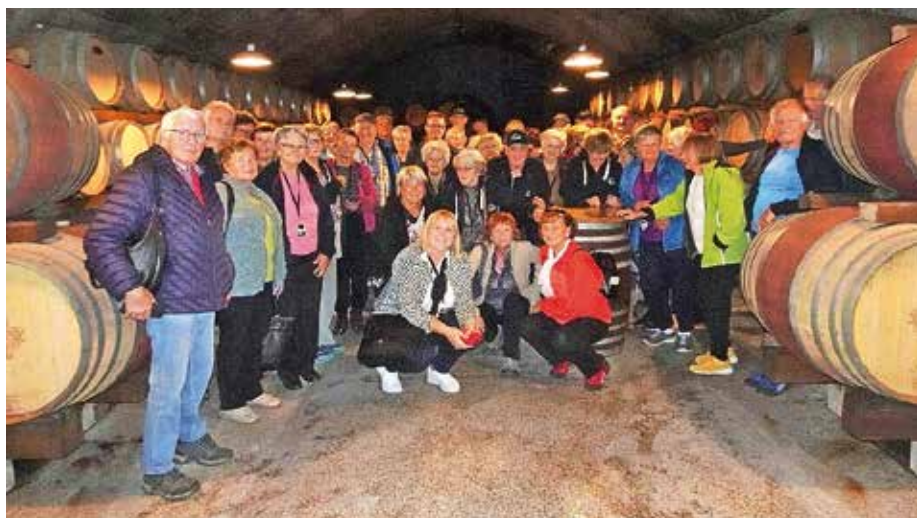
Klet Brda

Domov smo prispeli v večernih urah, zadovoljni, da smo se imeli lepo.