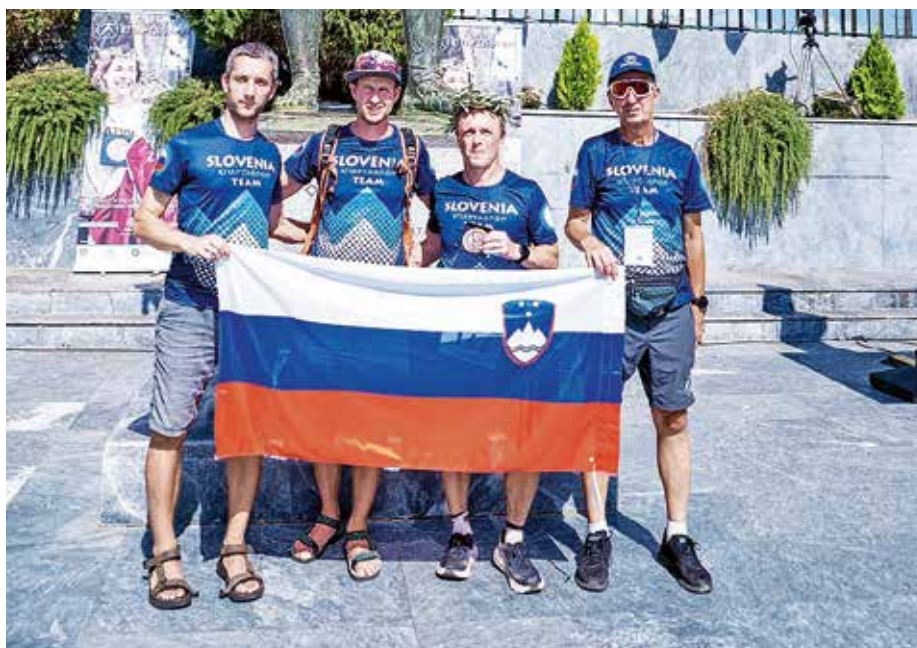
Jezerska ekipa na cilju Špartatlona

Vse od leta 2016, kar se ukvarjam z ultratekom, sem tudi sam pogledoval proti tej tekmi. Najprej sramežljivo, za-