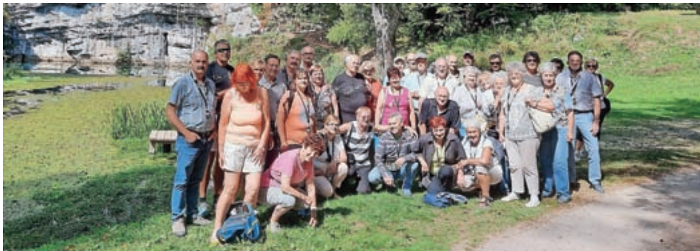
Na izletu v Beli krajini