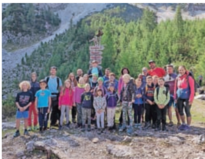
Mladi planinski orli

razredov matične in podružnične šole. Vreme nam je bilo naklonjeno, morje je bilo res še toplo in učenci so uživali v vseh dejavnostih ter predvsem nadgradili svoje plavalno znanje. Za nami je tudi že prvi športni dan. Učenci od prvega do četrtega razreda so se odpravili na tematsko orientacijsko pot Skrivnost preddvorskih štokelj. Ob tem so spoznali okoliške vrhove, živali, rastline, se seznanili z različnimi markacijami, osvežili znanje o primerni obutvi in opreми, ki jo potrebujemo v hribih v različnih vremenskih razmerah, ob zanimivih nalogah pa spoznali nagajivega vrana Frana, ki je uročil grofa in grofico.