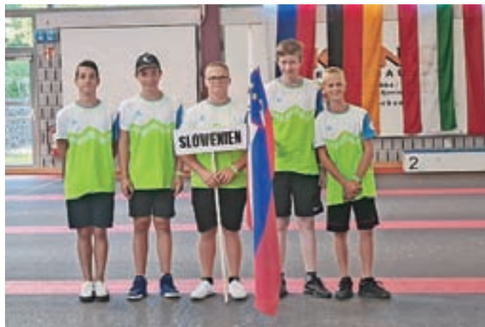
Na mednarodnem tekmovanju v kegljanju na asfaltu v Celovcu