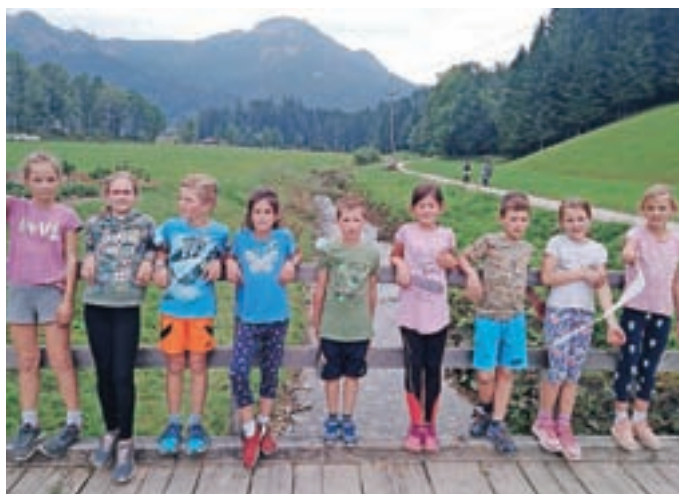
Tek za junake 3. nadstropja

Želim, da bi se veliko naučili in da bi znali računati račune. Gaja Ančimer Karničar, 2. r.