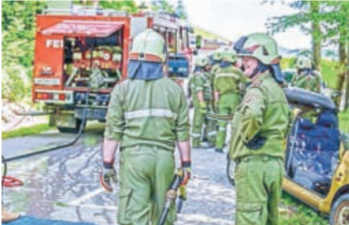
Posredovanje pri prometni nesreči PGD Železna Kapla