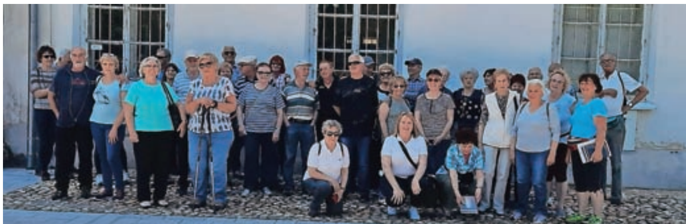
V Murski Soboti, kjer brez "gasilske" slike ni šlo