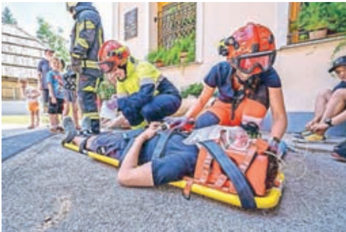
Trižno mesto in oskrba ponesrečencev