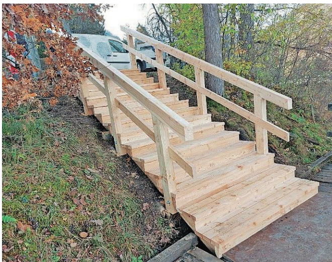
Stopnišče in ograja v Veliki Zaki sta v celoti obnovljena

Občina Bled je v sodelovanju z Infrastrukturo Bled v novembru zaključila več projektov in vzdrževalnih del. Eno izmed najnujnih vzdrževalnih del je bila zamenjava dotrajanega oziroma nagnitega stopnišča na mostovžu v Veliki Zaki. Stopnišče in ograja sta v celoti obnovljena. V prihodnjem letu sledi še menjava stopnic in ograje na vzhodni strani poti.