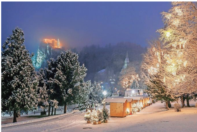
Jezerska promenada bo zasijala v vsej svoji lepoti.

Jezerska promenada bo zasijala v vsej svoji lepoti. Hišice s praznično ponudbo, jaslice v Zdraviliškem parku, laboda ob jezeru in okrašeno srce. Pod smreko velikanko stoji znameniti blejski rdeči stol, vhod na sejem na praznični promenadi je skozi okrašeni portal. Lepe praznike želimo in veliko svetlobe!