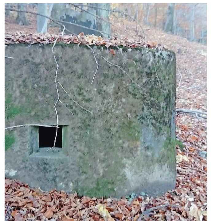
Objekti Rupnikove linije na Homu

Obrambna linija je potekala nad desnim bregom Radovne, se nadaljevala čez Savo in Moste do Karavank in je branila pred prodorom sovražnika po dolini Save Dolinke. Po načrtih bi zadrževala napadalce, dokler ne bi z mobilizacijo popolnili enot, ki bi nato na območju Radovljice in Begunj nadaljevale odpor v mnogo bolj utrjenih položajih. Zaradi terena in slabih temeljev so objekti danes v slabem stanju, se pa, čeprav so bili izdelani brez uporabe armaturnega železa. Še danes vidi kakovost betona. Po pripovedovanju domačinov, ki so se še spominjali tistih časov, je bila del te obrambe tudi nedokončana pot nad Vintgarjem na desnem bregu Radovne.