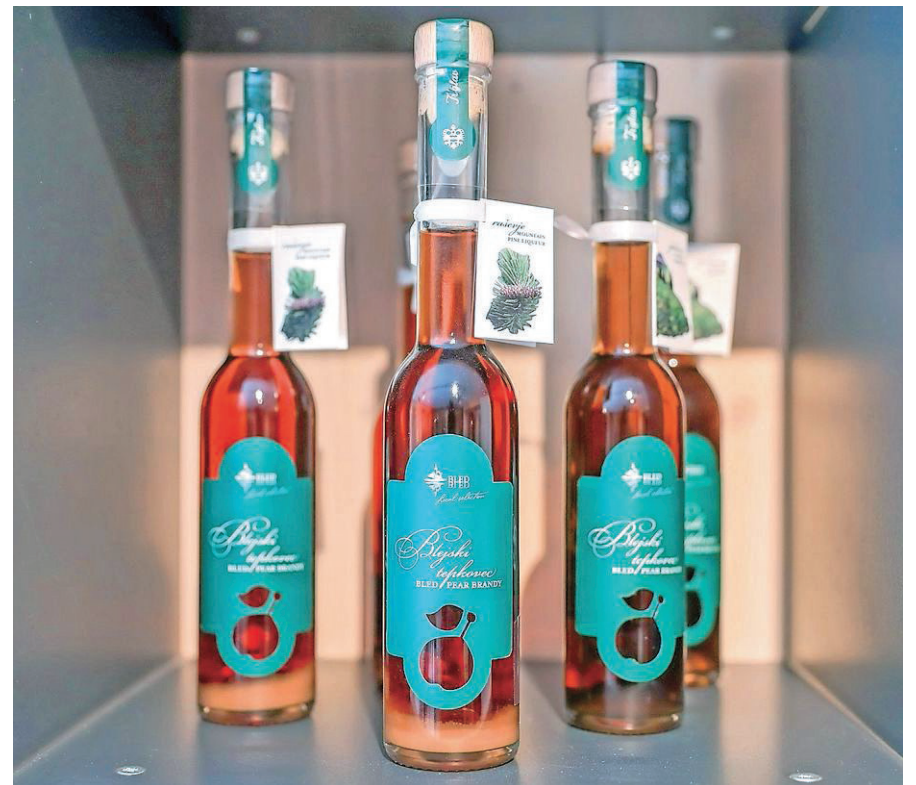
Blejski lokalni izbor se širi z novimi izdelki.

splošno poimenovane izdelke. Komisija je tudi ugotovila skromno ustvarjalnost na področju poimenovanja izdelkov. Nekateri pa so bili celo nepravilno poimenovani (razna žganja). V primerjavi med rokodelskimi izdelki in živila je bila splošna kakovost in paleta različnosti na strani slednjih. Menimo, da je dober