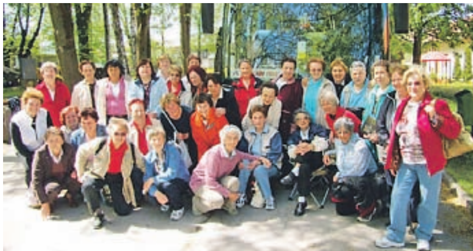
Izleti so med upokojenci zelo priljubljeni. Članice rekreacijske skupine so se letos odpravile tudi v Muzej premogovništva v Velenje.

Športniki so predvsem aktivni v maju, ko se udeležujejo različnih tekmovanj, ki jih organizira Medobčinska zveza upokojencev občin Kranjska Gora, Jesenice in Žirovnica. Tekmovali so v balinanju, streljanju z zračno puško, namiznem tenisu, tenisu, pikadu, smučanju, sankanju in smučarskih tekih. Vedno je pri vseh prisoten pravi tekmovalni duh, še bolj pa se držijo znanega reka 'Važno je sodelovati'. Poleg omenjenih tekmovanj se udeležujejo tudi