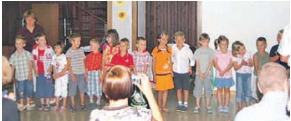
Po mnogih letih, če ne celo prvič v zgodovini šole, je v prvem razredu le en oddenek, v njem pa je 27 prvošolcev.

Za novo šolsko leto smo se začeli pripravljati že pomladi. Najprej je bil vpis v prvi razred, kjer smo se že zelo kmalu zavedeli, da vseh vpisanih ne bo zadosti za dva oddelka. Po mnogih letih, če ne prvič v zgodovini šole, imamo tako v prvem razredu le en oddenek, v njem pa 27 učenk in učencev. Vpisu v prvi razred je sledil še vpis v vrtec, kjer se je po vpisu pokazalo, da bo potrebno zagotoviti pogoje za dodatno skupino. Eno z drugim se je lepo izšlo - vpisanih otrok v vrtec ni bilo treba odklanjati. Tako imamo v vrtcu 125 otrok v eni skupini prvega starostnega in petih skupinah drugega