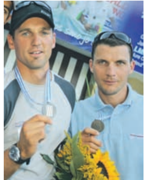
Brata Pirih sta na sprejemu na Bledu vsem ljubiteljem veslanja z veseljem pokazala bronasto medaljo.