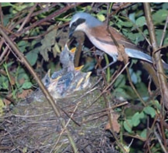
Samec prinaša hrošča mladičem v gnezdo, ki je v za srakoperja tipičnem grmu s pretežno šipkovo sestavo.

Rjavi srakoper je ptica selivka, ki prezimuje v južni in vzhodni Afriki. K nam se vrača proti koncu aprila in maja. V Sloveniji je splošno razširjen, saj je bil pri popisu za Ornitološki atlas ugotovljen v 90 odstotkih kvadrantov, kar gre seveda pripisati tudi temu, da rjavega srakoperja zlahka odkrijemo. Spada med naše najbolj razširjene ptice, čeprav ni najbolj številna vrsta, saj pri nas gnezdi okrog 20 tisoč parov (OAS, 1995).