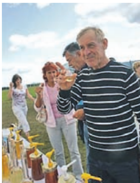
Obiskovalcem so teknile medene dobrate.