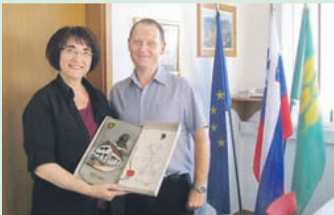
Župan z ministrico za obrambo Ljubico Jelušič