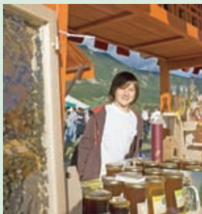
Naslovnica: Utrinek z medenega dneva

NOVICE OBČINE ŽIROVNICA (ISSN 1854-4932) - Ustanovitelj in izdajatelj: Občina Žirovnica, Breznica 3, 4274 Žirovnica. Pravice izdajatelja izvaja: Gorenjski glas, d. o. o., Kranj, Bleiweisova cesta 4, 4000 Kranj. Odgovorna urednica: Marija Volčjak. Urednica in novinarka: Ana Hartman. Časopis izhaja v nakladi 1.550 izvodov, brezplačno ga prejemajo vsa gospodinjstva v Občini Žirovnica. Tisk: Set, d. d., Ljubljana. Naslov uredništva: Gorenjski glas, d. o. o., Kranj, Bleiweisova cesta 4, 4000 Kranj, tel. 04/201-42-00, fax: 04/201-42-13, e-pošta: ana.hartman@g-glas.si; trženje oglasov: Miroslav Braco Cvjetičanin, miroslav.cvjeticanin@g-glas.si, tel.: 031/614-467.