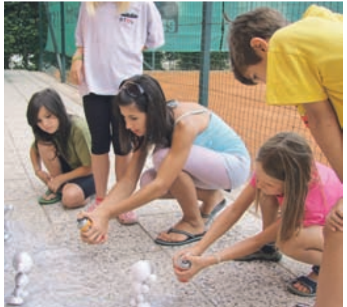
Počitniške delavnice v knjižnici je obiskalo kar 229 otrok.