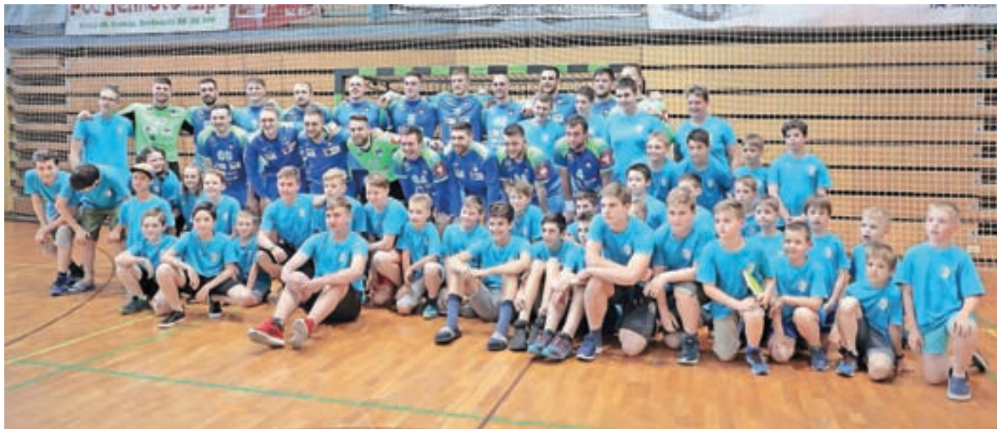
Cerkljanski rokometiški skupaj s slovenskimi reprezentanti

V Cerkljah so obletnico delovanja kluba kronali s prijateljsko tekmo reprezentanc Slovenije in Avstrije.