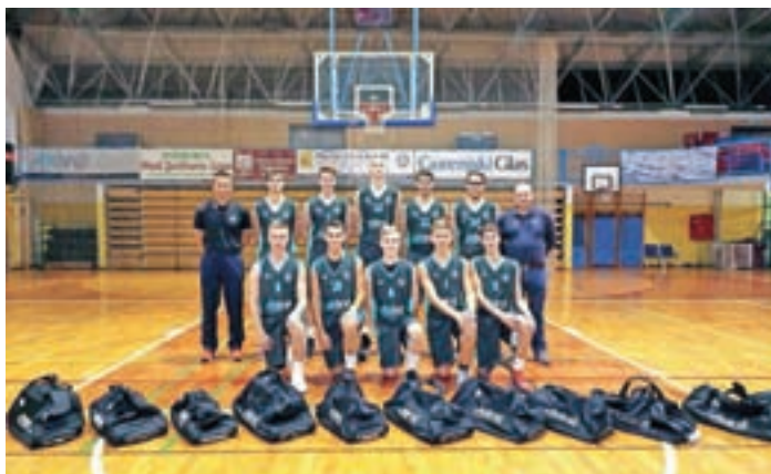
Ekipa mladincev Krvavec Ambrož