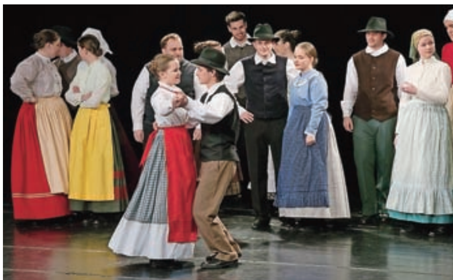
Dejavnost folklornih skupin je izjemno pomembna pri ohranjanju naše kulturne dediščine.