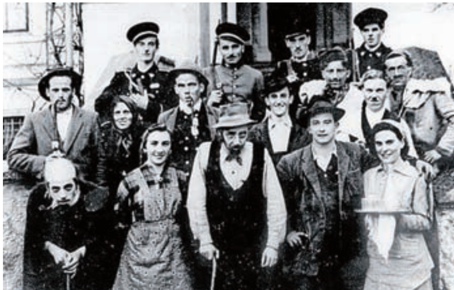
Leta 1965 so uprizorili Finžgarjevo igro Naša kri.

Kulturna dejavnost je bila v vaseh Adergas, Trata pri Velesovem, Praprotna Polica in Velesovo živahna že prej, saj so na večjih skednjih pogosto uprizarjali predstave, ki so odmevale tudi po širši okolici. V zapisih vaških kronistov beremo, kako so se krajanji zbrali, se družili v raznih dekliških in fantovskih odsekih in družbah ter prirejali proslave in uprizarjali igre na večjih kmečkih skednjih oziroma podih, kot Pri Martinovcu v Adergasu in pri Grašču v Velesovem ter drugih domačijah. Takim prireditvam, ki so imele odmev po širši okolici, je sledila običajno veselica ob harmoniki vaških godcev. Ustanovitev društva je sovpadala s praznovanjem sedemstoletnice božje poti v Velesovem in ustanovitvijo samostana. Ob tej priložnosti je društvo pripravilo upri-