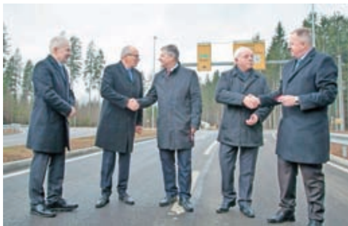
Sredi januarja so tudi uradno odprli obvozno cesto mimo letališča.

"Lani je bilo več kot 470 prireditev, kar je fantastična številka. Izstopa nekaj večjih dogodkov, ki dvigujejo prepoznavnost občine. Med njimi je recimo Fest po rokovem pa Luža na Kravcu. Dne 22. marca odpiramo sejem velikonočnih in pomladnih aranžmajev. Večje dogodke želimo še nadgraditi, jih iz enodnevni razširiti v dvodnevne, ali pa dodati še kakšen segment ponudbe in s tem popestriti dogajanje. Dodali pa bi radi še dva nova večja dogodka, enega poletnega in enega zimskega. Več o tem pa bom povedal, ko svet zavoda sprejeme predlagan akcijski načrt (seja sveta zavoda je bila po zaključku redakcije Novic izpod Krvavca, op. a.)."