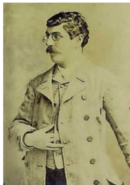
Ignacij Borštnik