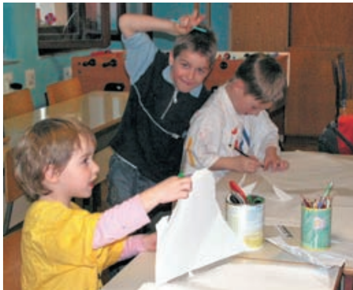
Utrinek z ustvarjalnih delavnic