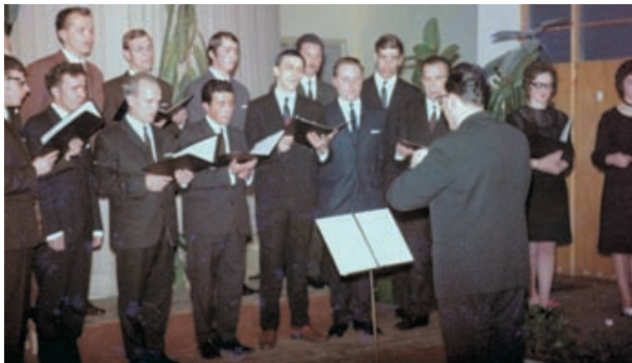
Drugi samostojni koncert leta 1971

Število članov zbora je v različnih obdobjih zelo nihalo, od skromnih začetkov z enajstimi člani pa do sedemintrideset članov v letih 1985-86, v letih največjih uspehov. V devetdesetih letih prejšnjega stoletja je zbor deloval v zasedbi šestnajstih pevcev, kar pa se je izkazalo za preveč utesnjeno zasedbo, zato je povabil