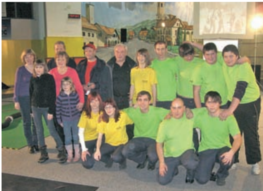
Organizator tekmovanja PGD Zalog je uspešno nastopil z žensko in moško ekipo.