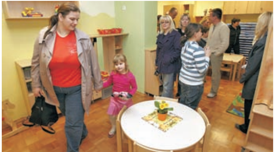
Starši med ogledom novega oddelka v Zalogu