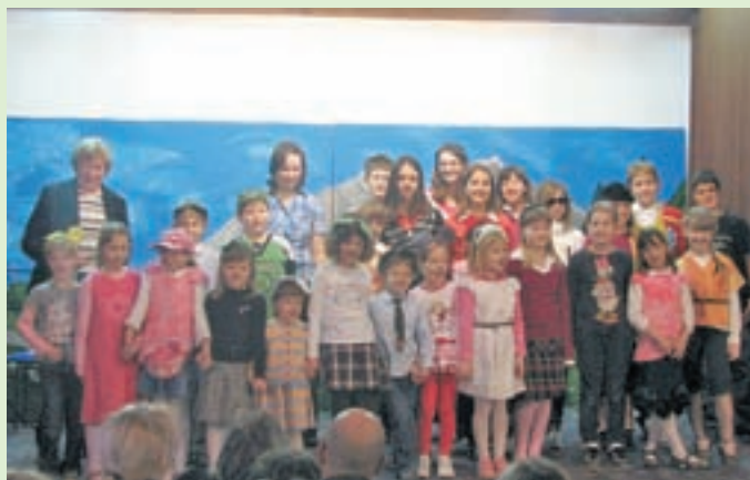
Nastopajoči na proslavi ob materinskem dnevu