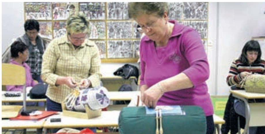
V skupini za ročna dela ustvarja osemnajst članic.

Mrgoletova ugotavlja, da so udeleženke zelo marljive in vztrajne: "Že po treh mesecih so izdelale zelo lepe izdelke." Članice si želijo, da bi svoje izdelke prvič razstavile jeseni v sklopu občinskega praznika.