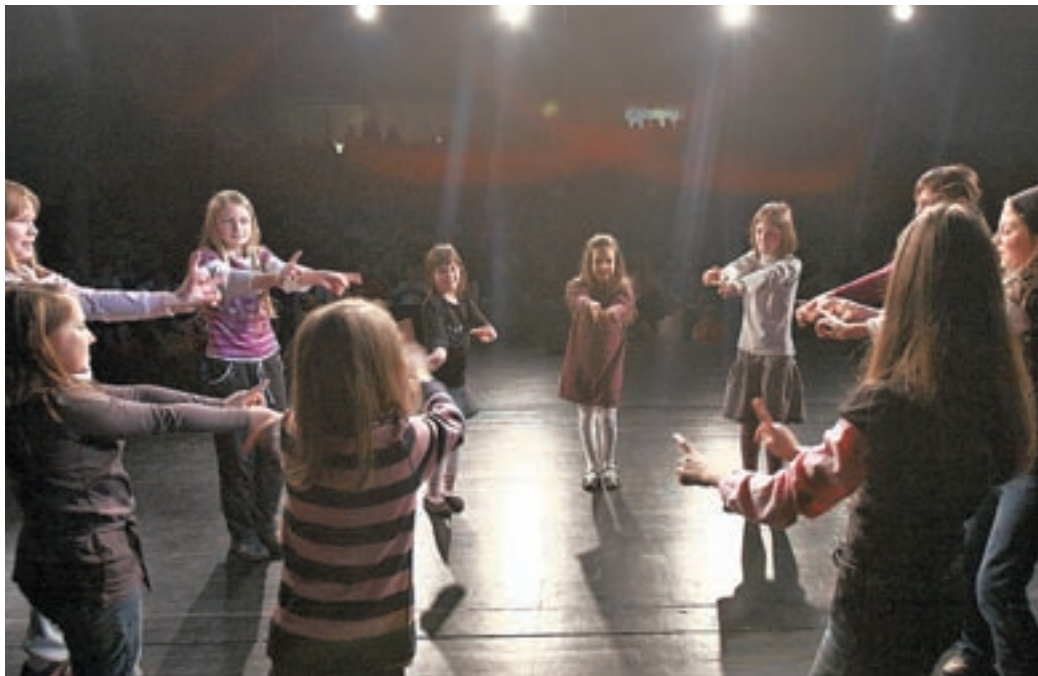
Nastopili so tudi učenci Plesne šole Miki iz Zaloga.