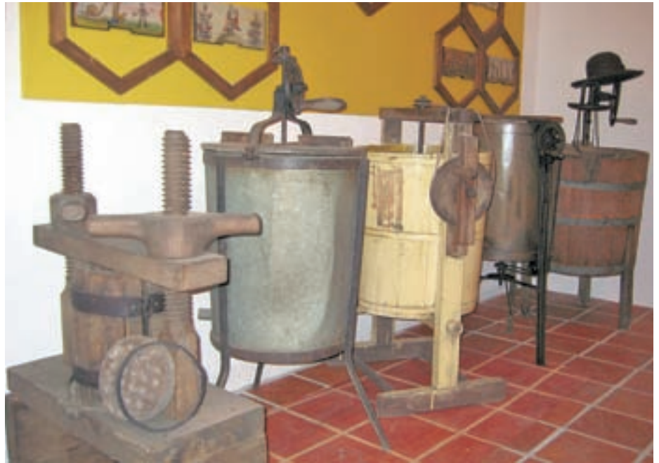
Stari čebelarso-kmečki pripomočki

škarje za striženje ovc, pa pripomočke, ki so jih nekdaj uporabljali v črni kuhinji in pri peki kruha, lončene posode, amfore za olje ... Razstavila sva tudi čebelarso-kmečke s častitljivo starostjo: točila, panjske končnice, literatura, panje, prešo za med, ‘gašperčka’ za kuhanje voska ..., del pa bo namenjen tudi mojemu pokojnemu očetu - čevljarju, tako da bo na ogled tudi čevljarso-kmečko orodje,” je na kratko