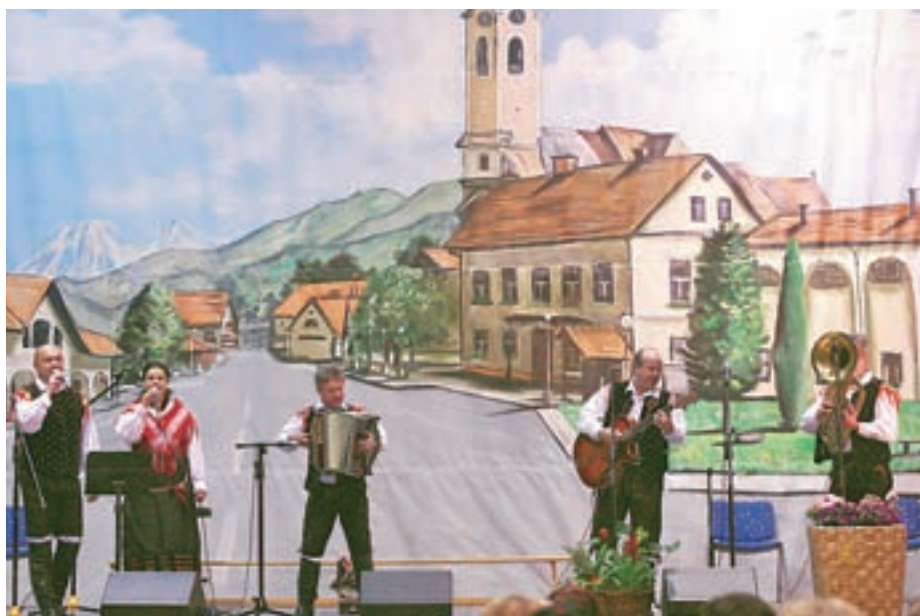
Nastopil je tudi ansambel Nagelj.