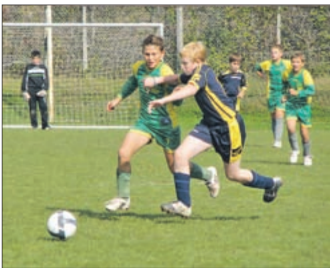
Tudi borbeni igralci v otroških in mladinskih selekcijah na tekmah dosegajo lepe uspehe.