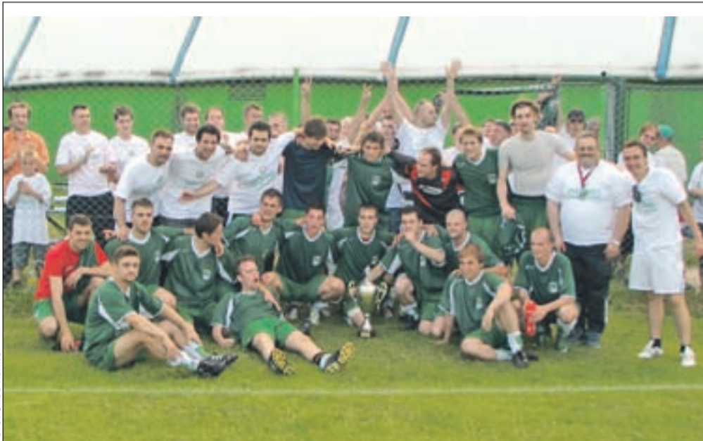
Veseli članske ekipe po osvojitvi naslova gorenjskih prvakov in uvrstitvi v tretjo slovensko ligo

Naklo - Potem ko je članska ekipa nogometašev Nogometnega kluba Naklo z odličnimi predstavami zasluženoma osvojila naslov prvakov v prvi gorenjski nogometni ligi, bo naslednja sezona v marsičem drugačna. Prvič bodo namreč zaigrali v tretji slovenski ligi, to pa predstavlja precejšen zaloga tudi za vodstvo kluba. "Minuli teden smo na Nogometno zvezo Slovenije oddali uradno vlogo za licenciranje in prosili odgovorne na zvezi, da bi se čim prej oglašili pri nas na ogled