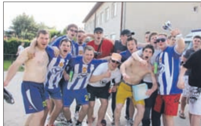
Dupljanski rokometiški so bili drugi.