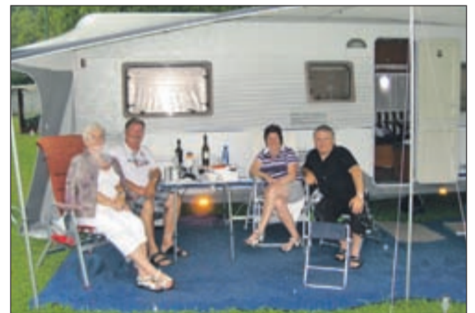
Turisti z Nizozemske so odločeni, da se prihodnje leto spet vrnejo.