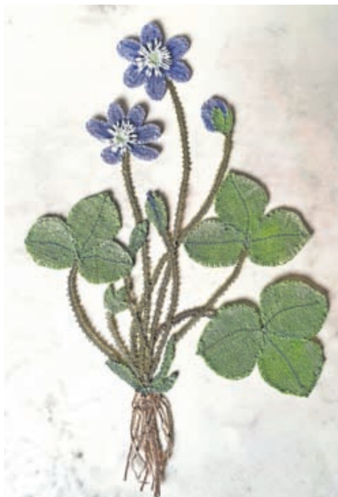
Za osrednjo temo letošnjih Slovenskih klekljarskih dni so izbrali cvetje.