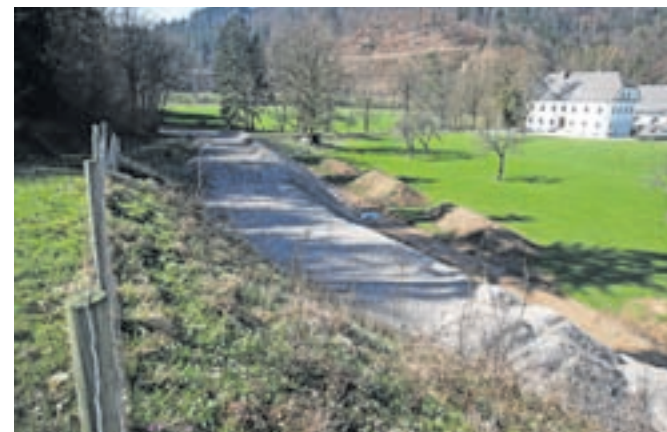
Sanacija plazu ob Dvorcu Visoko

ne, je razložil župan Milan Čadež. Kot je dodal, je bilo doslej omenjeno brežino težko vzdrževati, saj jo je prerasčalo grmovje. Po tem, ko bodo zmanjšali naklon, pa občina na tem mestu namerava urediti tudi letno gledališče, je še razkril župan.