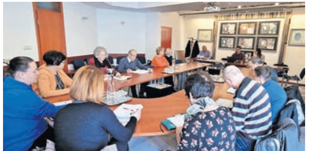
V februarju so se prvič letos sestali člani Lokalne akcijske skupine starosti prijazne občine Žiri.

Med aktivnostmi, ki se jim bodo posvetili letos, je tudi vzpostavitev družabniškega prostovoljstva za razbremenitev svojcev in zmanjšanje osamljenosti v SeneCura Domu starejših občanov Žiri. V ta namen bodo izvedli izo-