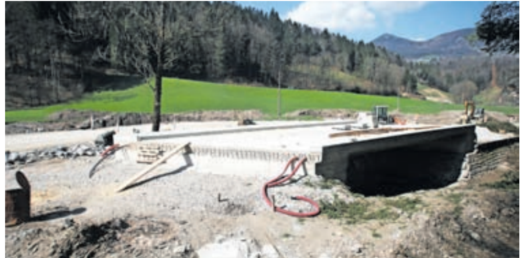
Odpravljanje posledic lanske ujme obsega okrog štirideset projektov.

Največja investicija ta čas je sanacija plazov na 1,4 kilometra dolgem odseku ceste Vršaj–Hlavče Njive in na 900 metrov dolgem odseku ceste Hlavče Njive–Brda. Dela, ki morajo biti končana do jeseni, bodo vredna 1,8 milijona evrov. Med večjimi