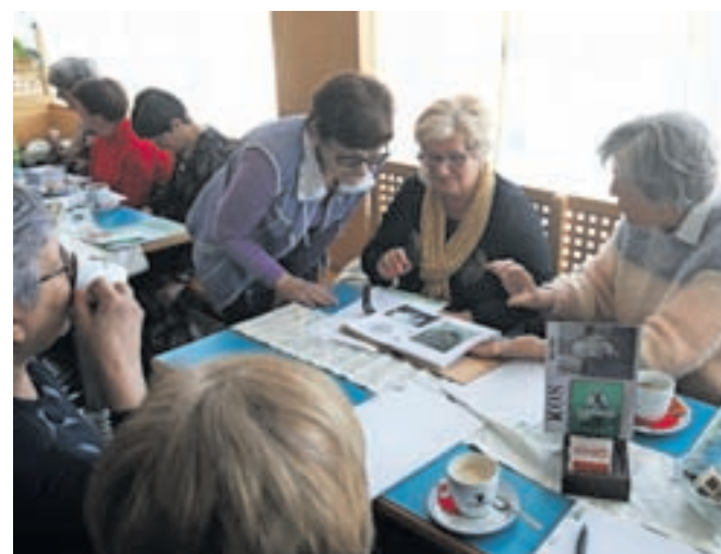
Četrtkove Klepetalnice-ustvarjalnice v kavarni športne dvorane v Železnikih / FOTO: GORAZD KAVČIČ

Železniki – V kavarni Športne dvorane Železniki od sredine marca ob četrtkih dopoldne potekajo Klepetalnice-ustvarjalnice. Nastale so v sodelovanju Javnega zavoda Ratitovec, Ljudske univerze Škofja Loka in Občine Železniki, ki podpira projekt lokalnega učnega središča (LUS). Do konca maja starejše občane ob četrtkih med 10. in 12. uro vabijo na ustvarjalna neformalna izobraževanja, že pred tem pa so od 8. ure dalje vabljeni na kavo in klepet.