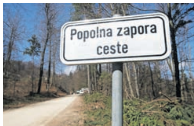
Zapora ceste na odseku Gorenja vas–Hlavče Njive

plazov sanirajo še na odseku lokalne ceste Srednja vas–Dolenje Brdo, na kateri bo popolna zapora do 12. aprila