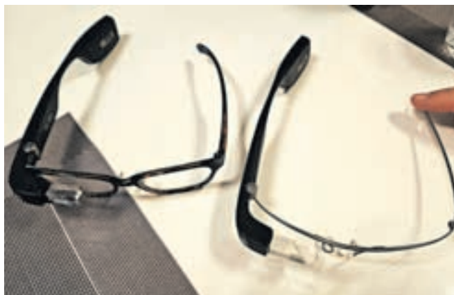
Pametna očala za slepe in slabovidne