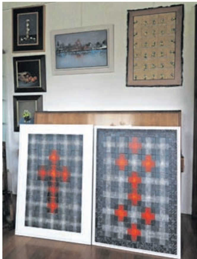
Kontrast med realizmom in abstraktnim

slikarskem stojalu sliko šopka. Kakšnega in v kakšni slikarski maniri, pa bomo nedvomno videli na kakšni naslednjih razstav.