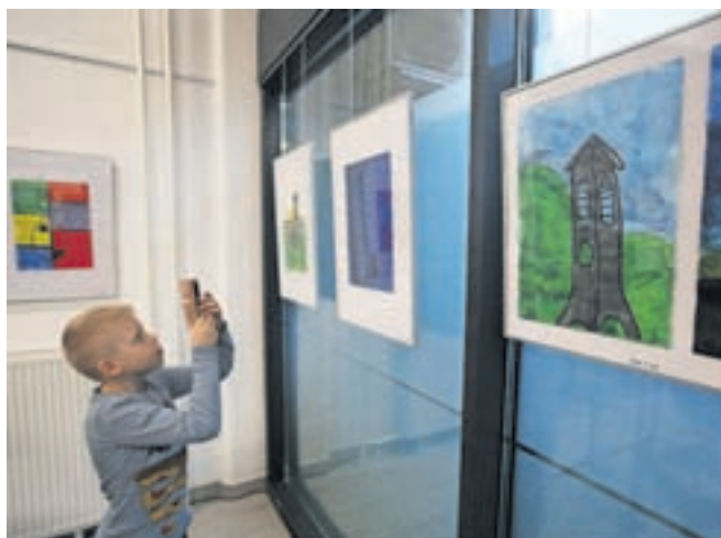
Razstava Tam plavž stoji bo na ogled do 16. aprila.

Njihove izdelke bodo praviloma vsak tretji torek v mesecu razstavili v galeriji. Njen glavni namen je otrokom in mladostnikom dati možnost, da se izkažejo tako na likovnem kot tudi glasbenem področju, saj ob odprtju razstav velikokrat hodita z roko v roki. Galerija bo po napovedih direktorice JZR na voljo tudi za razstave otrok iz vrtcev, osnovnih šol, starejše generacije, ki ob četrtkih ustvarja v kavarni športne dvorane, in drugih. Zadovoljna je, da jim je uspelo osvežiti in prebeliti tudi prostore mladinskega centra, ki so ga po odprtju galerije z veseljem pokazali obiskovalcem. Gre za prostor, ki je namenjen skavtom, tabornikom, študentom in tudi drugim mladim.