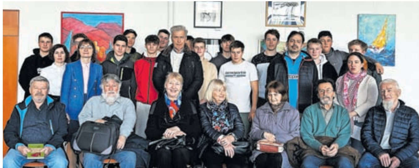
Likovni ustvarjalci srečanja Jasna v družbi gostiteljev v Šolskem centru Škofja Loka

Že več let se zbirajo v Strunjanu, sredi narave in ob morju, kjer nastanejo različ-