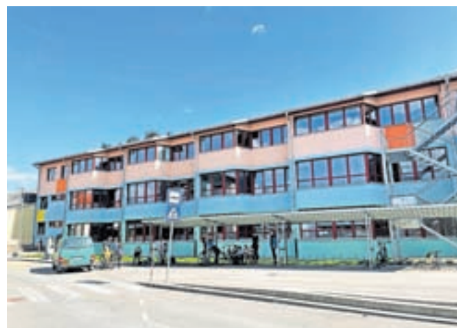
Občina ni ukinila sredstev za varstvo vozačev, ampak jih je zgolj zmanjšala.

Nekateri svetniki so že lani namenja katekolli sosednja primerljiva občina, zato so prepričani, da je krčenje varstva nerazumna in nepotrebna odločitev šole. Nekateri svetniki so že lani namenja katekolli sosednja primerljiva občina, zato so prepričani, da je krčenje varstva nerazumna in nepotrebna odločitev šole. Nekateri svetniki so že lani namenja katekolli sosednja primerljiva občina, zato so prepričani, da je krčenje varstva nerazumna in nepotrebna odločitev šole. »Glede na zbrane podatke