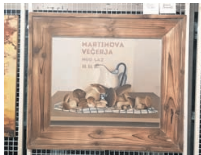
Nagrajena slika Martinovo tihožitje

Večkrat je svoja dela že predstavil na samostojnih razstavah, prvič se spominja, da v