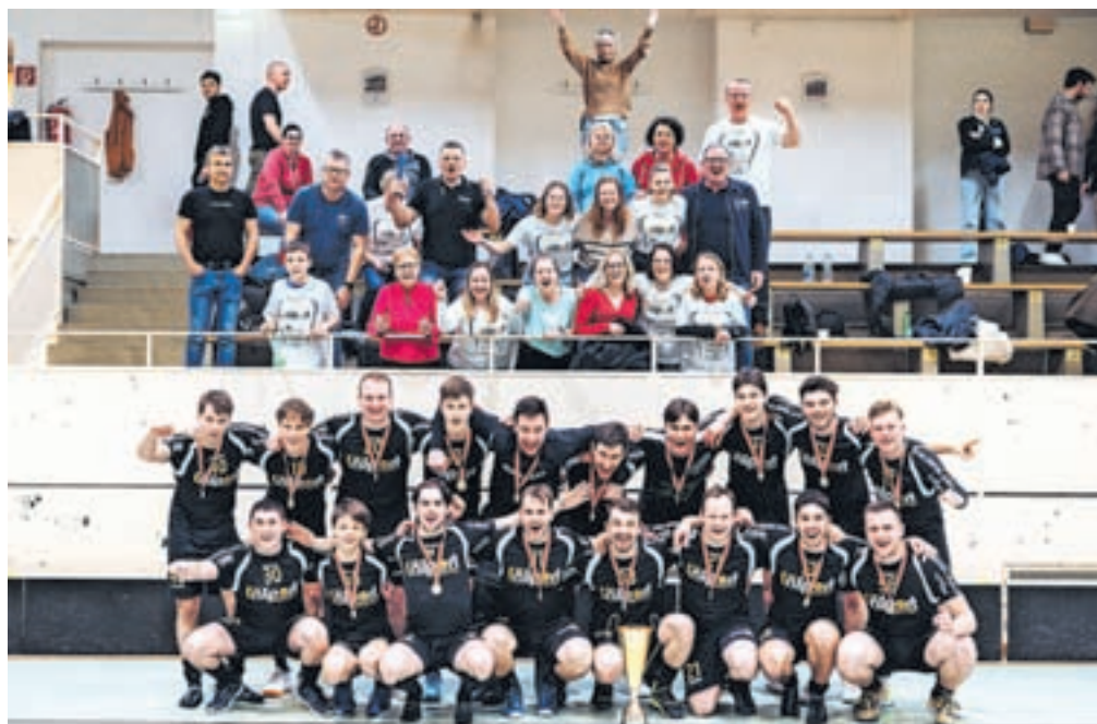
Ekipa Insporta se je novega naslova prvakov veselila skupaj z navijači.