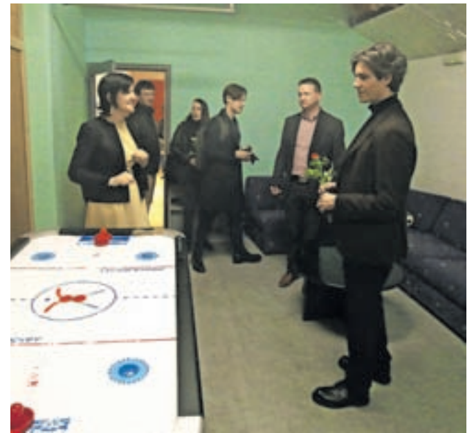
Po odprtju galerije Kres si je minister Luka Mesec ogledal prostore osveženega mladinskega centra.

»Verjamem, da se bo začela iskrica galerije Kres razvijala in da bo v marsikom