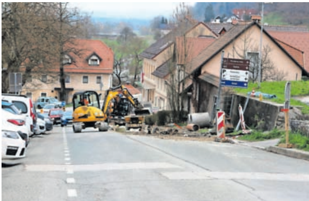
Dela so prejšnji teden potekala na Pepetovem klancu.

»Pri Puštalskem mostu je gradbena jama, dela se nadaljujejo pri mlekarini in na križišču s Fužinsko ulico in gredo naprej po hribu. Na delu so tudi arheologinje in arheologi, ki so že našli nekaj stvari. Sproti se odločajo, ali so za izkop in shranitev ali jih pa zgolj identifikacijo. Se pa intenzivno dela in računamo, da bodo priključne cevi nameščene v kratkem in se bodo dela kmalu nadaljevala na Mestnem trgu in Klobovso-