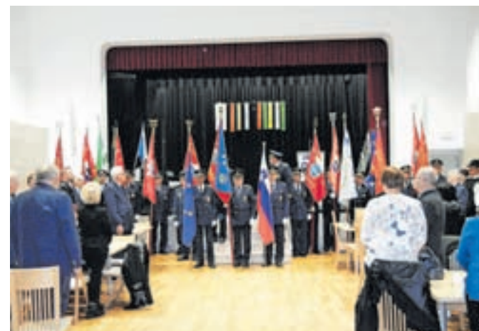
Člani ZŠAM Žiri na zboru v Gorenji vasi

cijo za varnost prometa, občinskimi sveti za preventivo in vzgojo v cestnem prometu ter združenji ZŠAM po vsej Sloveniji. Združenje se je specializiralo za varovanje kolesarskih dirk po Sloveniji, obenem pa skrbijo za varovanje občinskih in drugih prireditev ter varovanje otrok na poti v šolo. »Naše združenje je bilo na prehojenih poti vedno spoštovano,« je še poudaril Dolenc in dodal, da se mora za to zahvaliti tako sedanjim kot nekdanjim članom. »Ta čas ima združenje več kot 50 uniformiranih članov, ki izvajajo zgoraj našete naloge.«