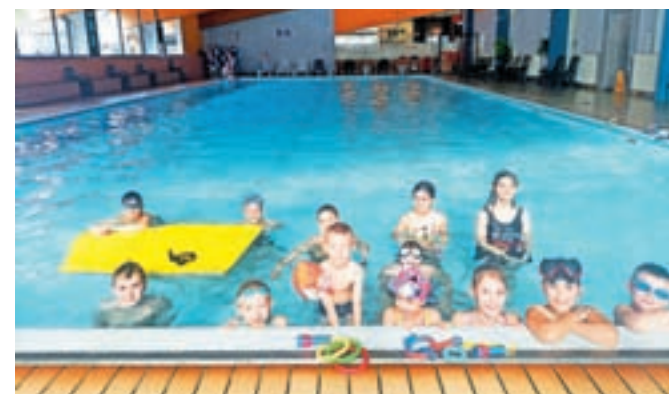
Počitniške Čofotalnice v plavalnem bazenu

Sredi marca JZR uvaja še eno novost: Klepetalnice-ustvarjalnice za starejše. Prostore lokala v Športni dvorani Železniki bodo vsak četrtek dopoldne odprli za starejše prebivalce občine Železniki; prvič 14. marca. Ob 8. uri jih vabijo v kavarno, kjer bodo lahko poklepetali, odigrali družabno igro ter negovali in širili socialno