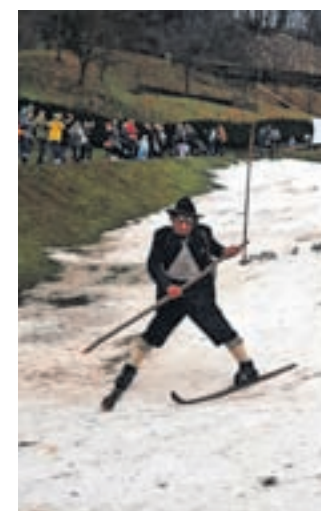
... in se z njimi spustili po grajskem hribu.

je čisto vsakdo, ki si je drznil spustiti po vratolomni progi na hribu pod gradom, pokazal tako hrabrost, da bi si zaslužil medaljo.