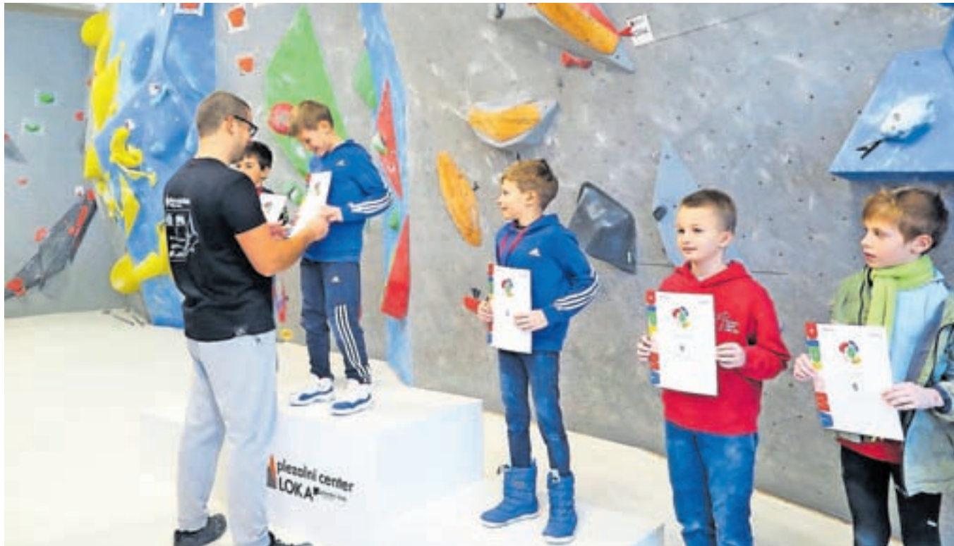
Najboljši mladi plezalci v balvanskem plezanju so se v Škofji Loki razveselili kolajn in priznanj.

trju, sklenili, da pripravimo balvansko tekmo. Na njej je kar precej gneče, saj nas je presenetilo, da se je prijavilo kar tristo devdeset tekmovalk in tekmovalcev. Na žalost smo morali tekmi kadetinj in kadetinj zato odpovedati, saj spored poteka oba dneva od jutra do večera in se nam časovno ne bi izšlo. To bo v nadaljevanju sezone gotovo postal tudi problem drugih organizatorjev,« je povedal predsednik