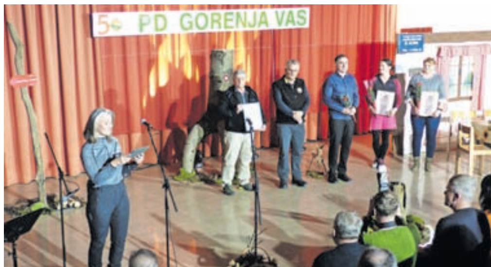
Ob zlatem jubileju društva so zaslužnim članom podelili priznanja.

vem letu je potrdilo dobro sodelovanje in skupaj smo kovali načrte, na kakšen način ponuditi še več zdravstvene oskrbe našim občanom,« je poudaril župan in dodal, da je na vseh področjih ključ uspeha le v sodelovanju, skupnem iskanju novih, še boljših rešitev. Tako je tudi na področju šolstva in duhovne oskrbe v občini, kar so potrdili na sprejemu za ravnateljice in župnike v občini. Tudi njim se je zahvalil za njihov trud in dobro sodelovanje.