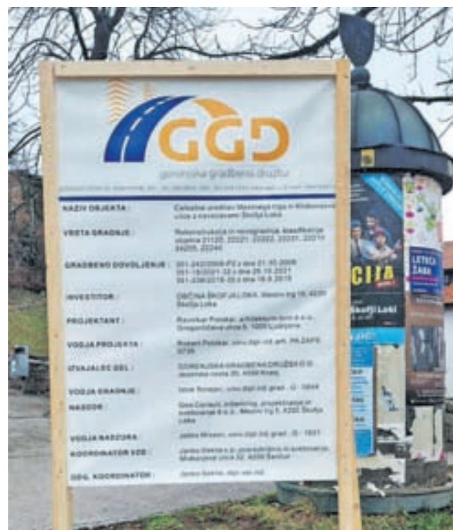
Prenova Mestnega trga bo predvidoma trajala poldrugo leto.

Škofja Loka – Ena od letošnjih prednostnih nalog Občine Škofja Loka je poleg odprave posledic poplav začetek težko pričakovane obnove Mestnega trga. Na tem območju bo, kot piše na spletni strani občine, urejena tudi celotna podzemna infrastruktura: meteorna in fekalna kanalizacija, vodovod, kabelska kanalizacija in strelodovi, javna razsvetljava in plinovod. V posamezni stavbi bo treba zagotoviti priključke oziroma povezavo z obstoječimi internimi napeljavami. »Ker gre pri tem lahko tudi za poseg v skupne dele in naprave, predlagamo skupni sestanek na vsakem od naslovov za razjasnitev vseh vprašanj glede izvedbe hišnih priključkov. S predstavniki izvajalcev bomo v vsaki stavbi individualno predstavili okvirni potek in