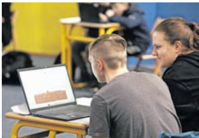
Tekmovalo je 66 udeležencev iz cele Slovenije.