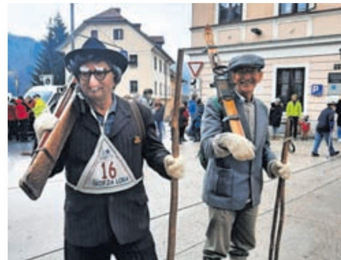
Tudi nekateri tekmovalci so si nadeli pustne maske ...