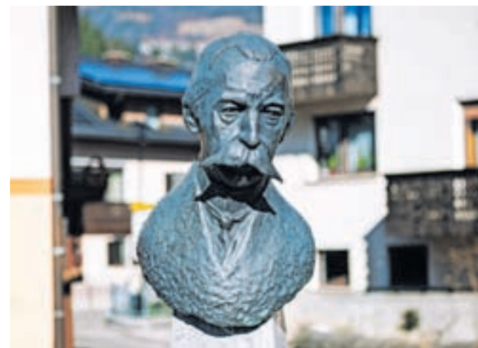
Doprski kip dr. Franca Kosa v spominskem parku v Selcih

Prav na stoto obletnico smrti dr. Franca Kosa, v četrtek, 14. marca, ob 18.30 bo v spominskem parku v Selcih komemoracija s polaganjem venca k njegovemu doprskemu kipu, na kateri pričakujejo tudi predsednika državnega sveta Marka Lotriča. Ob 19. uri bo v Krekovem