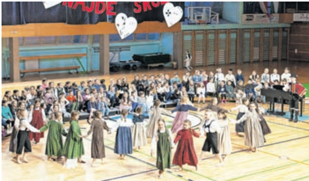
V množici nastopajočih otrok so bili tudi mladi folklorniki.