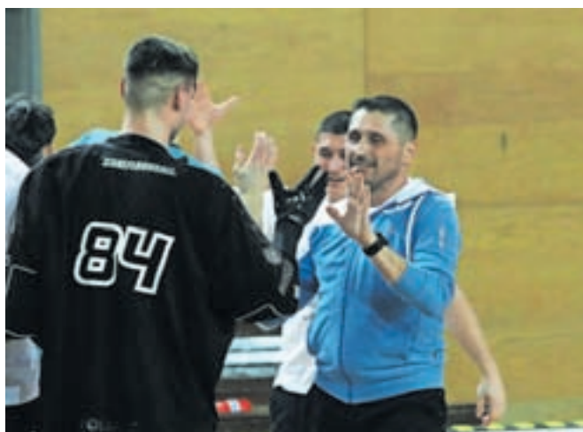
Selektor Gorazd Tomc se je veselil odličnih iger.