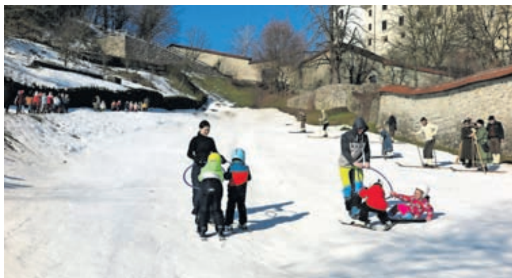
Na snegu pod Loškim gradom je bilo januarja in v začetku februarja ves čas živahno.

Najmlajši, stari komaj tri leta, sicer niso smučali, so si pa z zanimanjem ogledali smučarje s starodobno opremo. »Zelo nam je všeč, tudi mi radi smučamo in se veseljem opazovali smučarske zavoje in se veselili zimskih radosti.