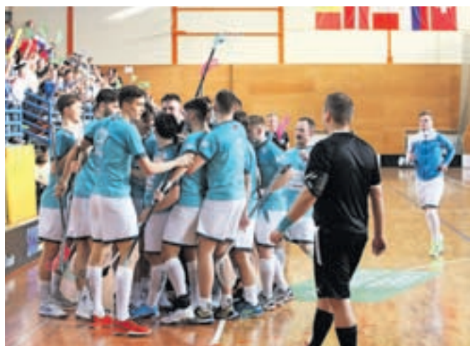
Slovenci so slavili skupaj s številnimi navijači.