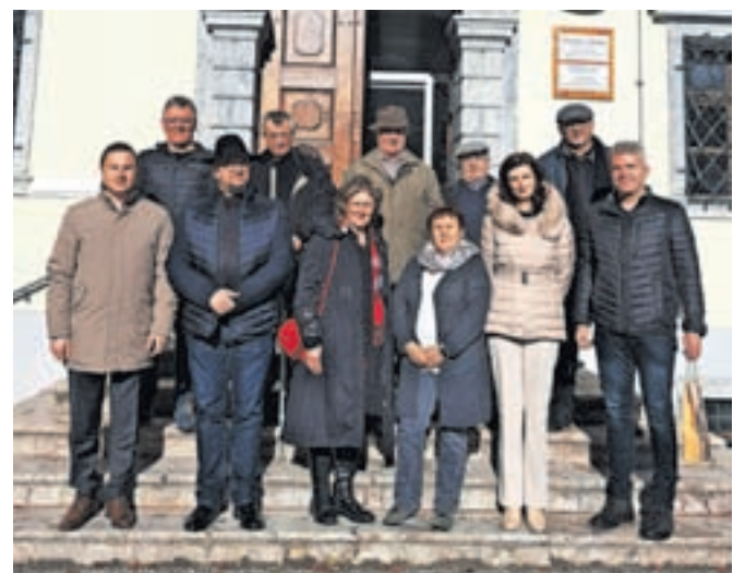
Sprejem za ravnateljice in župnike v Dvorcu Visoko