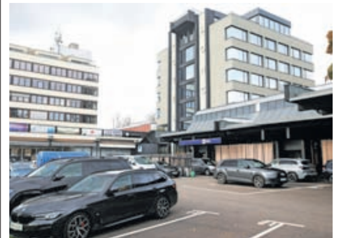
Za goste je pred hotelom Lonca urejeno tudi parkirišče.

iz Danske, Belgije in Švice. »Hotel je za tovrstne dogodke ustrezna izbira, tako zaradi lokacije same, ki nudi dodatne možnosti športnega udejstvovanja na Škofjeloškem, kot tudi zaradi individualiziranih ponudb glede na posamezno skupino gostov,« se dobrega obiska in tega, da dobivajo pozitivne odzive od gostov, veselijo v Lonci. Kot so nam povedali, so imeli v hotelu od odprtja dalje večkrat bistveno večje povpraševanje, kot imajo možnosti ponudbe nočitev. Dolej so v hotelu bivali gosti iz Španije, Francije, Grčije, Nemčije, Italije, Nizozemske in celo Kanade in drugih držav ameriške celine, so nam povedali in dodali, da je ena izmed novosti, ki so jo uvedli v hotelu, t. i. brunch, ki je v Lonci, kot pravijo, prvi oziroma edini v ponudbi na Škofjeloškem.