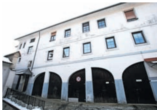
Kot pravijo na občini, bodo v kompleksu povezali več dejavnosti.