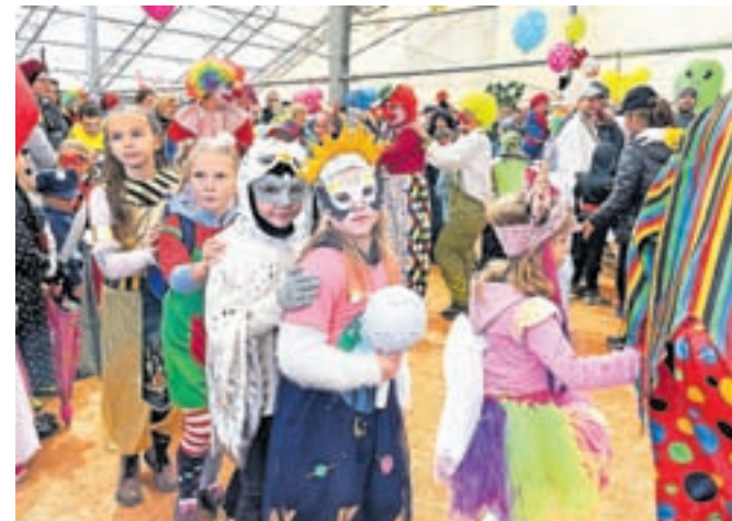
Pustno rajanje v središču Žirov