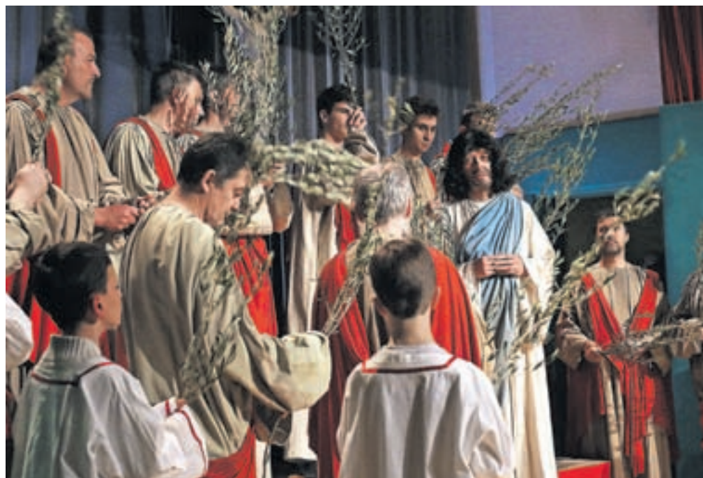
Tudi letos bo v Stari Loki potekal Pasijonski večer.