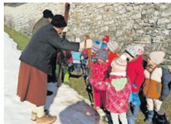
Vrtčevski otroci so si z zanimanjem ogledali staro smučarsko opremo.

»Pred kratkim smo obiskali Baragov vrtec v Stražišču in najmlajši so bili nad našo opremo zelo navdušeni. Tako se nam je porodila ideja, da se predstavimo tudi loškimi vrtčevskim otrokom, in mislim, da je prireditev lepo uspela,« je povedal predsednik Društva Rovtarji, ki goji smučanje in kolesarjenje po starem,