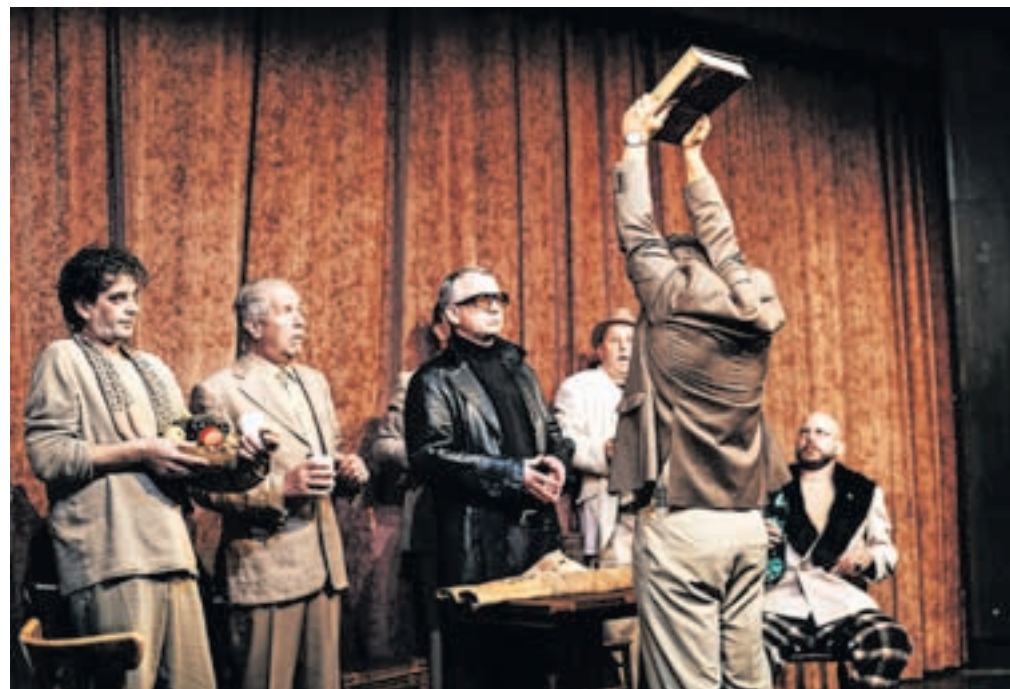
Predanost odlične ekipe Loškega odra igri se odraža skozi vso predstavo.

»Vsebinsko je projekt zasnovan na Tavčarjevi Visoški kroniki, natančneje na poglavju 'Krvava rihta' (sojenje Agati). Situacija je postavljena na večer pred sodbo. Vsi liki so povzeti po Tavčarju, vendar so postavljeni v novo situacijo. Skozi novonastali