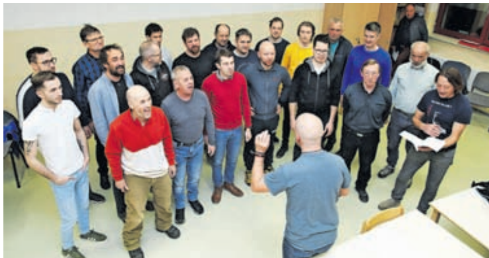
Moški pevski zbor Alpina Žiri