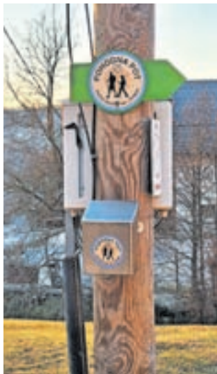
Kontrolni žig v Leskovici

Leskovica, Lučine – Skrbniki občinskega pohodnega in kolesarskega kroga so sporočili, da je prišlo do sprememb pri lokacijah kontrolnega žiga občinskega pohodnega kroga v Ogradah in kontrolne točke kolesarskega kroga v Lučinah. Kontrolni žig občinskega pohodnega kroga KT7 je iz Ograd prestavljen v Leskovicu na leseni električni drog ob cerkvi svetega Urha. Kontrolno točko občinskega kolesarskega kroga KT3 pa so z Okrepčevalnice Matija prestavili na Kulturni dom Lučine.