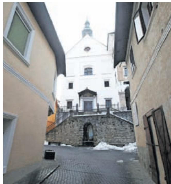
Nunski samostan prehaja v last Občine Škofja Loka.

Svetniki so sklep sprejeli, čeprav so nekateri izrazili bojazn v zvezi s tem, koliko