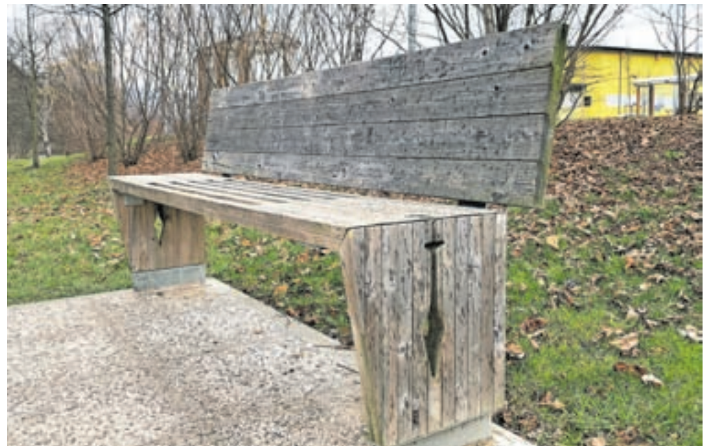
V okviru projekta Lesni feniks je iz odsluženega lesa nastala urbana oprema.

Razpis za dobre prakse trajnostnega urbanega razvoja Mesta >> mestom je potekal med oktobrom in decembrom lani. S pozivom so iskali inovativne prakse in nove rešitve, s katerimi občine, javna podjetja in regionalne razvojne agencije rešujejo izzive v svojem lokalnem okolju in poudarjajo aktualne tematike, ki so relevantne tudi za druge slovenske občine. Ocenjevalna skupina, ki so jo sestavljali