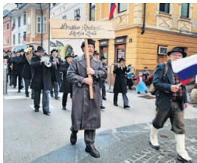
Povorko udeležencev je skozi mesto tradicionalno pospremil Mestni pihalni orkester Škofja Loka.