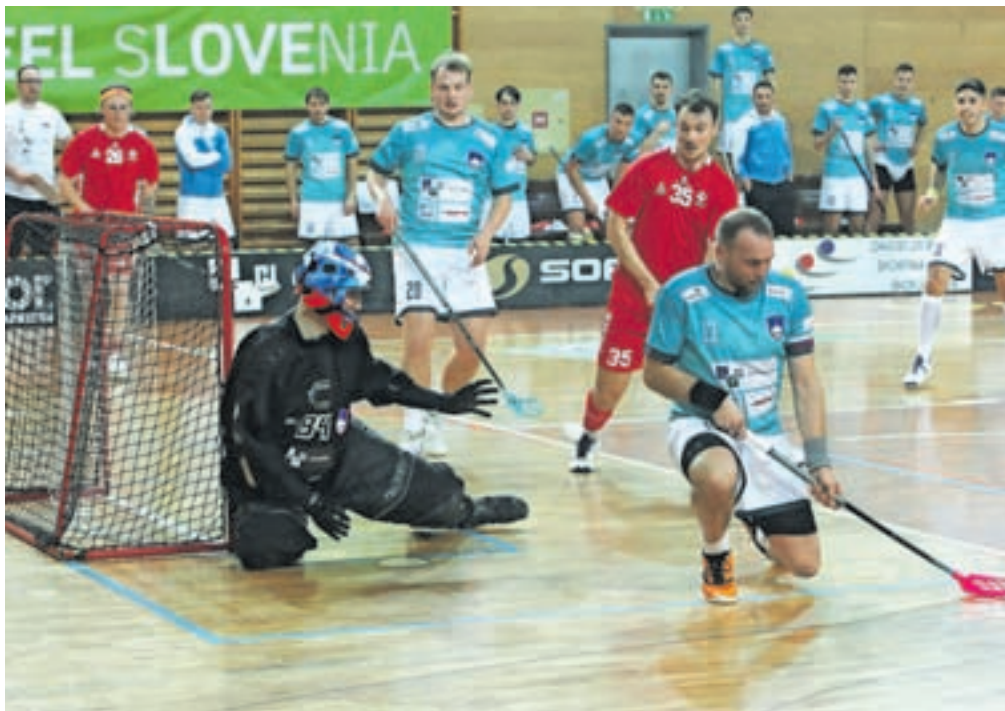
Naša reprezentanca je z borbeno igro ugnala Dance.

»Turnir je potekal po naših željah. Zelo smo si želeli zmage na prvi tekmi proti Dancem, saj je prav ta zmag pomenila velik korak do našega glavnega cilja, ki je bil uvrstitev na svetovno prvenstvo. Tudi tekma proti reprezentanci Italije je potekala podobno, kot smo si jo