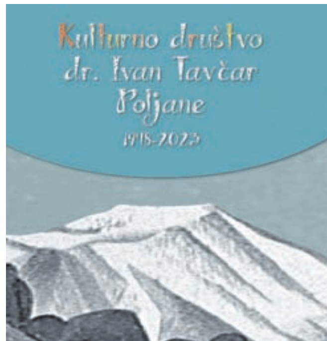
Naslovnica zbornika, ki je nastal ob 75-letnici delovanja Kulturnega društva dr. Ivan Tavčar Poljane.