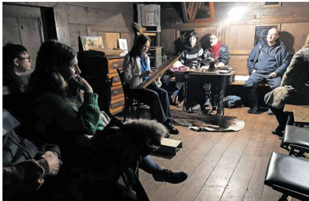
Topla izba in vzdušje sta spomnila na pripovedovanje zgodb v starih časih.