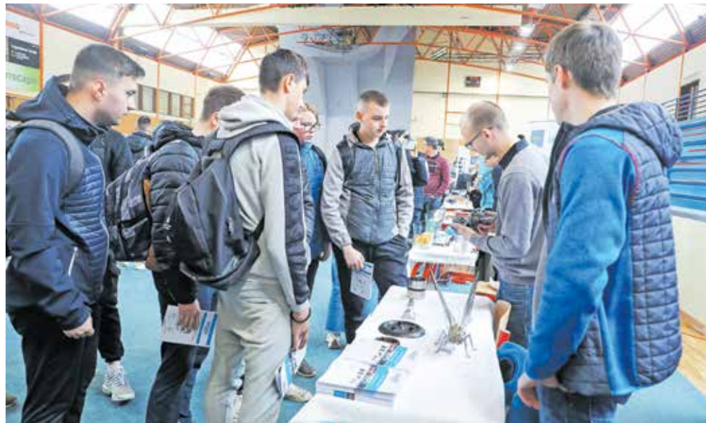
V Šolskem centru Škofja Loka se na različne načine trudijo mladim približati poklice, za katere izobražujejo.

Za vpis v Gimnazijo Škofja Loka je po podatkih iz razpisa na voljo 140 vpisnih mest, od tega 28 za program klasične gimnazije. V Šolskem centru Škofja Loka pa so za bodoče dijake razpisali skupaj 458 mest v 12 programih. Za program tehniške gimnazije, ki ga bo šola izvajala, če bo do roka za prijave, torej 2. aprila, prejela vsaj 20 prijav, je na voljo 28 mest. Srednja šola za strojništvo je za program pomočnik v tehnoloških procesih razpisala 16 mest, za program strojni tehnik je na vo-