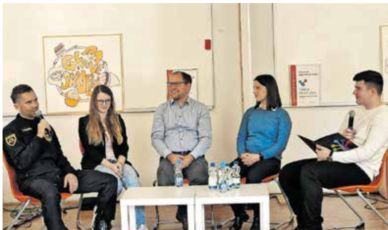
Okrogla miza na prireditvi projekta Inženirke in inženirji bomo!

zapored pometla s konkurenco in zmagala na 3. IKT natečaju na področju multimedije. Zelo uspešni pa sta bili tudi dijakinji