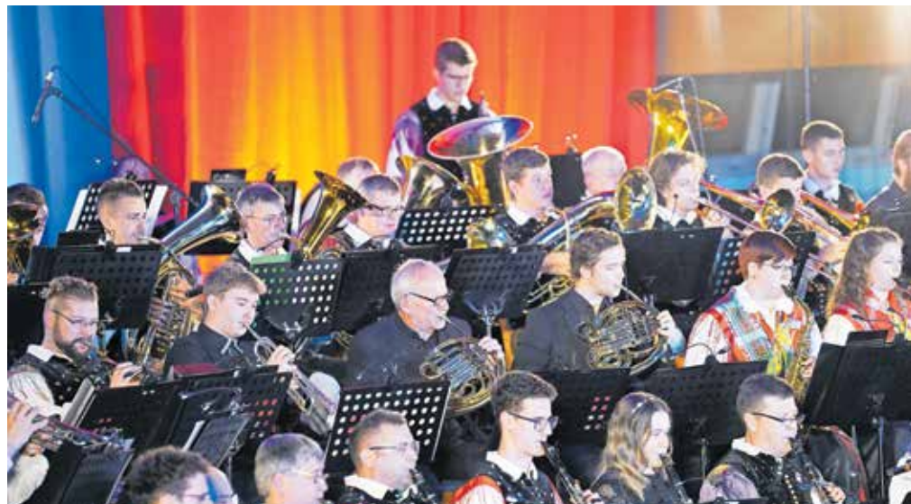
Koncert je občinstvu postregel z raznolikim glasbenim programom.