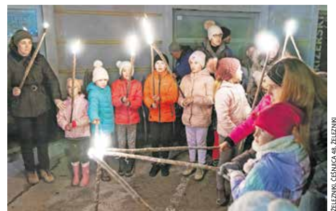
Baklada je pritegnila okoli 160 udeležencev.