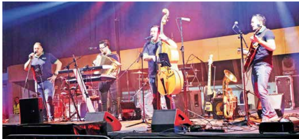
Člani Kvarteta za 5 prihajajo iz Selške doline.