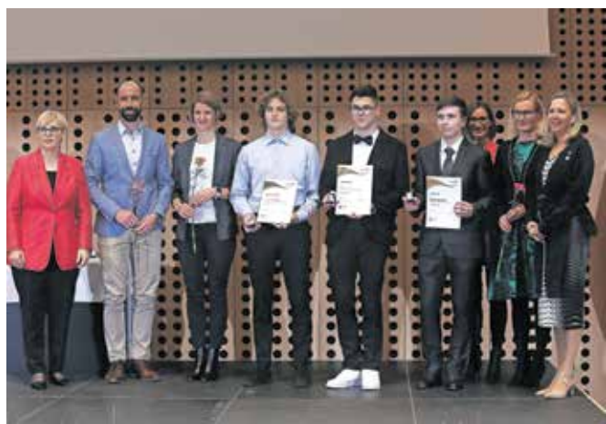
Prejemniki zlatih priznanj s Šolskega centra Škofja Loka