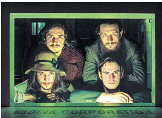
Skopski multižanrski Vagina Corporation

Škofja Loka – Koncert bo v petek, 23. februarja, in po nekaj več kot pol leta ponovno združuje moči s škofjeloškim društvom Jadran. Tokrat v goste prihajajo (severno)makedonski multižanrski odpljenci Vagina Corporation in prekmurski noise rokovski muzikantje Moving as a giant. Že nekaj let sodelujejo pri izvedbi koncertnega dela Hafnerjevega memoriala v Železnikih, lani pa so v avli Kulturnega doma skupaj pripravili tudi koncert zasedb Klotljudi in Disdrug. Po pričevanju vpletenih jih združuje veliko stvari. Ne govorimo samo o glasbi, ampak tudi medsebojni podpori na način obiskovanja koncertov kot tudi pomoči pri izvedbi različnih projektov. Navsezadnje je tu tudi brezdolnost, saj obe društvu še vedno ne premo-