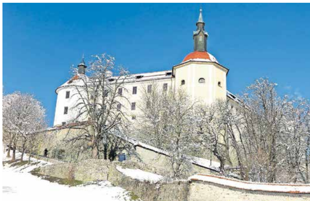
Loški grad je po zunanji in notranji prenovi ter energetski sanaciji sedaj ponos mesta.

Začela se je statična sanacija ter obnova fasade jugozahodnega oziroma okroglega stolpa, južnega in severnega dela gradu ter veznega trakta, ki grad povezuje z objektom nekdanjega Nunskega samostana. Ta je vključevala tudi celovito energetsko pre-