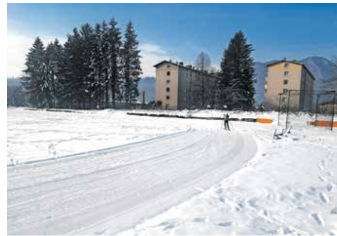
Od prejšnjega tedna tekači na smučeh lahko uporabljajo progo v nekdanji vojašnici.

dobro obiskana. Sneg, ki je zapadel pred dobrim tednom, je razveselil tudi druge, ki imajo radi zimo, od prejšnjega tedna pa je poskrbljeno tudi za smučarske tekače. V Zavodu za šport so namreč v nekdanji vojašnici pripravili progo za tek na smučeh. Ob tem sprehajalce prosijo, da se ne sprehajajo po progi ter da njihovi hišni ljubljenci na njej ne opravljajo potrebe.