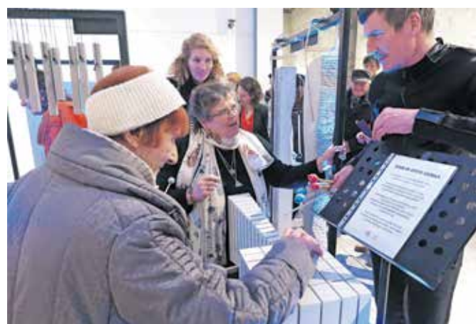
Obiskovalci so lahko preizkusili zven kamna.