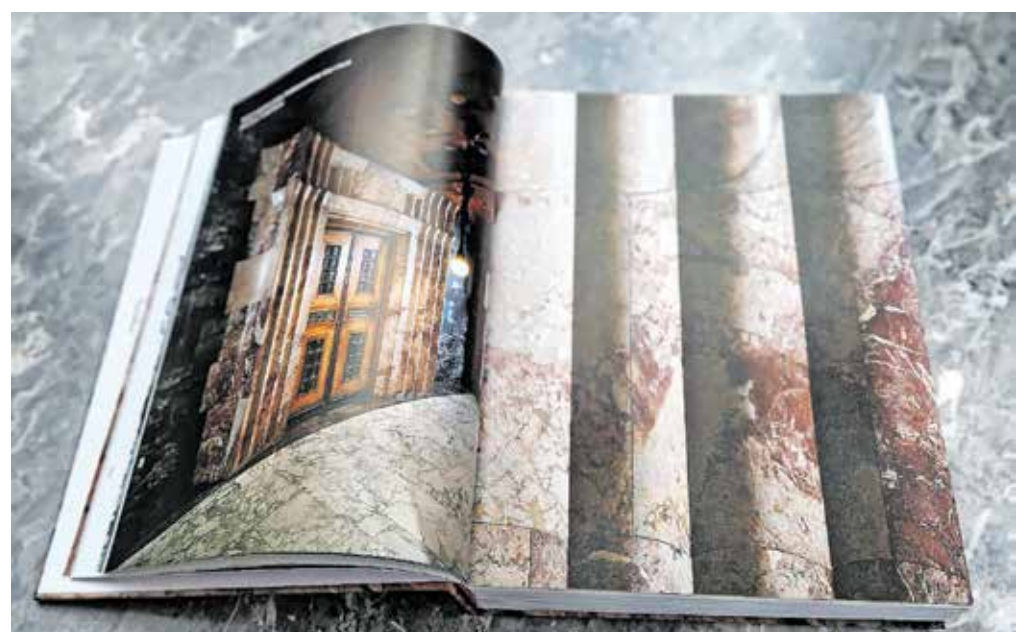
Ob tristoletnici kamnoseštva na Hotavljah so v podjetju Marmor Hotavlje izdali monografijo z naslovom 300+.

Za monografijo, ki so jo naslovlili 300+, so po Čeferinovi besedah dolgo časa zbirali pričevanja ljudi, povezanih z Marmorjem Hotavlje, in zbirali fotografije, ki dokumentirajo razvoj podjetja. »Gradivo smo sestavili kot sestavljenko. Kronologije dogodkov se nismo vedno držali, prav tako nismo razvrščali dogodkov po pomembnosti za gospodarsko uspešnost podjetja. Vodila nas je želja, da bi dobili čim bolj verodostojno sliko podjetja, ki bi pripovedovala o težkih, prijetnih, usodnih, zabavnih, pomembnih, pa tudi o čisto običajnih dogodkih na Hotavljah in v drugih krajih po vsem svetu.« Tako je nastala edinstvena publikacija, ki so ob jubileju podarili vsem zaposlenim in poslovnim