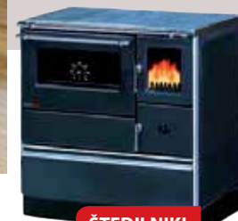
ŠTEDILNIKI ALFA PLAM