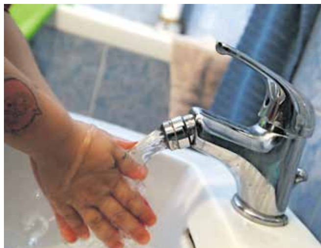
Popis vodomerov poteka ta mesec.

Občinski svet Občine Škofja Loka je na zadnji izredni seji sprejel sklep, da se gospodinjstvom uporabnikom oziroma uporabnicam iz naselij, ki so jih prizadele poplave in ki so nastalo škodo iz poplav in plazov prijavili v sistem Ajda, iz občinskega proračuna pokrije vrednost storitev, povezanih s prekomerno porabo pitne vode v avgustu. Gospodinjstvom uporabnikom iz naselij: Demšarjeva cesta, Fužinska ulica, Gosteče, Hosta, Log nad Škofjo Loko, Na Logu, Podpulfrcu, Pungert, Puštal, Sorška cesta, Stara cesta, Stara Loka, Studenec, Virlog, Visoko pri Poljanah in Zminec bodo zaposleni