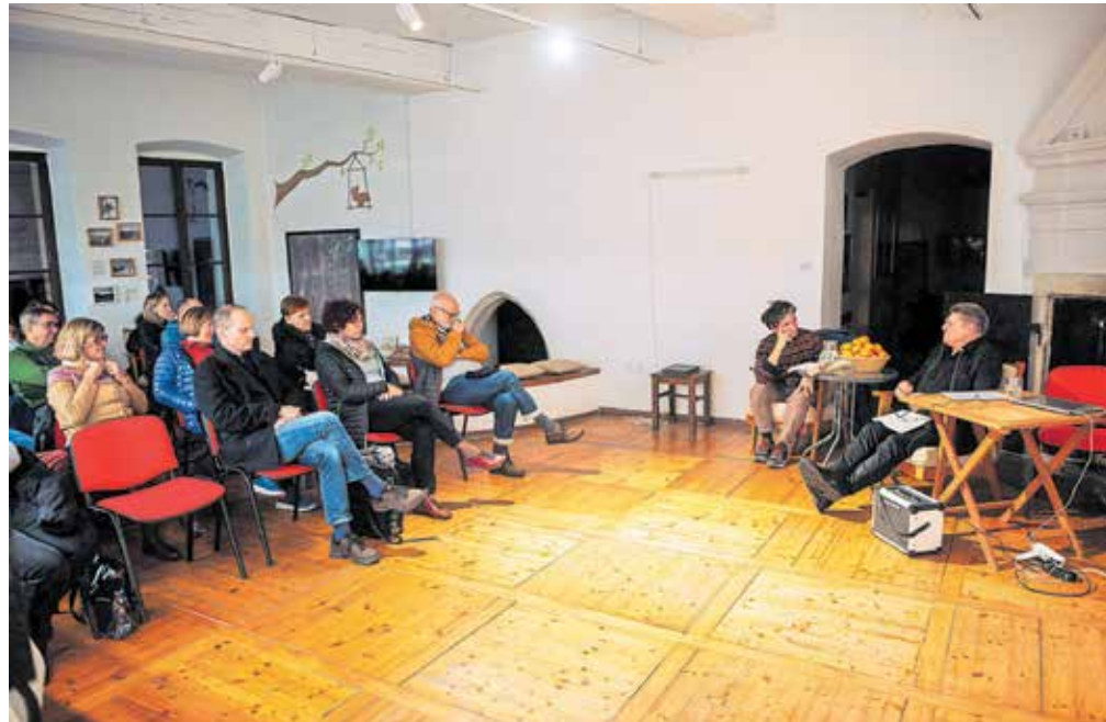
Film War Memorial – Spomenik vojni je pritegnil pozornost obiskovalcev.