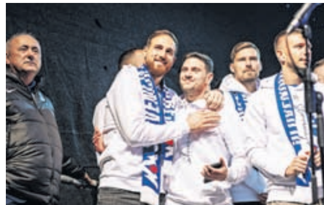
Kapetan Jan Oblak se je uvrstitve naše reprezentance na evropsko prvenstvo veselil skupaj s soigralci in navijači.

»Vse se je izšlo tako, kot je bilo treba, in res smo si zaslužili to evropsko prvenstvo. Vloženega je bilo veliko dela in truda z vseh stran in zdaj nam je končno uspelo. Vsi smo zadovoljni in srečni, to smo si zaslužili. Verjamem, da v Nemčijo ne gremo samo nastopati in da bomo tudi tam prišli do dobrega rezultata,« je po tekmi razmišljal slovenski kapetan, Škofjeločan Jan Oblak, ki se je v domačem klubu že kma-