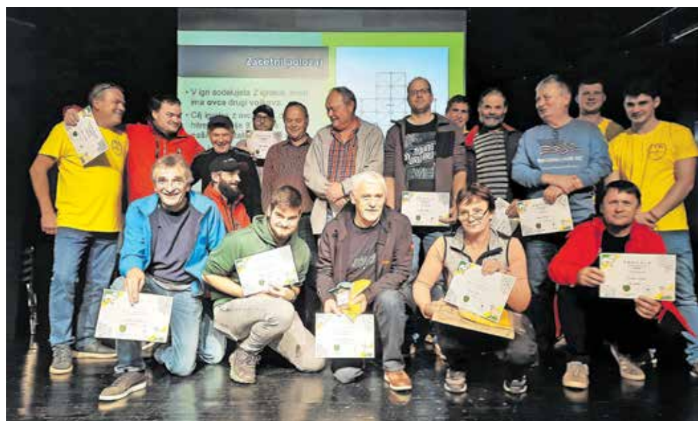
Tekmovalci in člani komisije

bljanskem zvonu, po katerih se je njegova ustvarjalna pot le še vzpenjala, dokler ni dosegel zrelosti klasičnega realizma ter v Cvetju v jeseni in Visoški kroniki »v izčiščenem in zrelem izrazu zapel poslednji pesem duhovni obliki ljubezni, ki je (najbrž) tudi najvišja oblika ljubezni«, so zapisali v predstavitvi knjige. »Ivan Tavčar preišča in piše, vrže na valove življenja, ki ga nosijo in zibajo, visoko dvigajo in globoko spuščajo, ki glasno hrumijo in tihotno šumijo, da bi se naposled izlili v literarne besede,« so še zapisali ob knjigi.