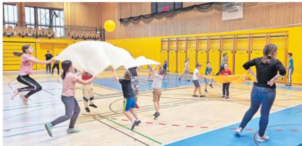
Za razgiban dan so poskrbeli z zanimivo igro z žogo v šolski telovadnici.