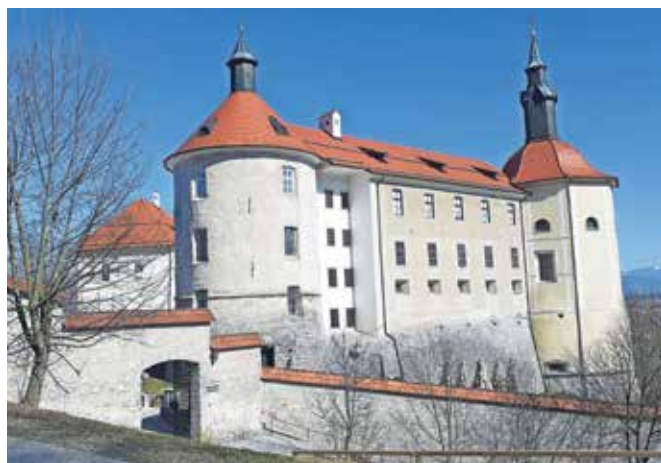
... je leta 2022 ponovila Ophélie Chapuis.