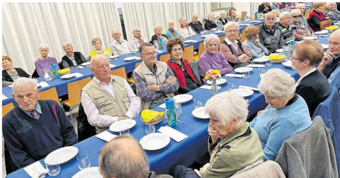
Srečanje starejših v Žireh