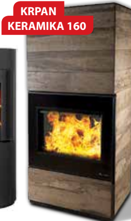
KRPAN KERAMIKA 160