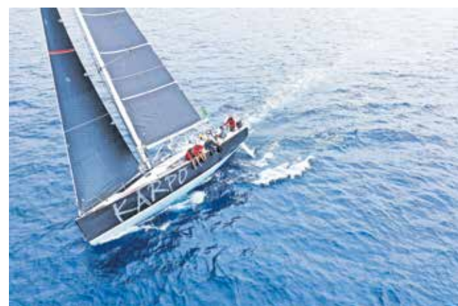
Jadrnica Elan 450, ki je popeljala ekipo do zmage