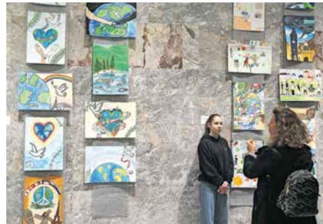
Učenke in učenci so znova pokazali, kako ustvarjalni so.