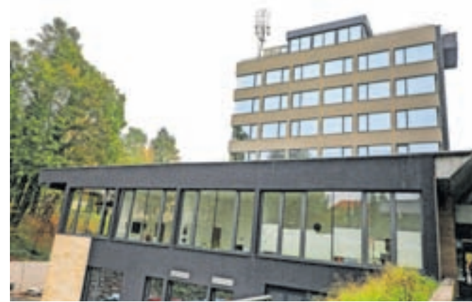
Hotel Lonca v prihodnjem mesecu pričakuje prve goste.