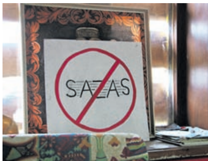
Prizor iz danes žal že ugasle Ambasade ŠKM

Škofja Loka – V zadnjem dobrem desetletju so izginila prizorišča pri nas. KUD France Prešeren v Ljubljani, Mink v Tolminu, C.M.A.K. v Cerknem, Ambasada Štefana Kovača Marka v Beltincih, pa Izbruhovalni kulturni bazen v Kranju itd. Ta razpadni proces kulturnih mladinskih samoniklih prizorišč je opazila tudi Ustanova nevladnih mladinskega polja Pohorski bataljon (UPB). Četudi je zemljevid samoniklih prizorišč, ki je bil pripravljen kot del raziskave, ki jo je dr. Rajko Muršič s sodelavci pred dobrih desetletjem izdelal, UPB pa izdal v obliki knjige Na trdna tla, danes videti precej opustošen, ga zlahka dopolnimo z mnogimi novimi prizorišči, ki so nastala in nastajajo še danes. A ta so mnogokrat drugačna. Ne več organizira-