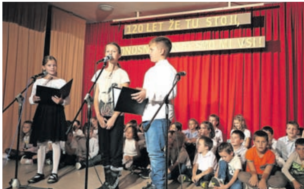
Šolarji so poskrbeli za zanimiv program in nasmejali zbrane na prireditvi.

»Želimo si, da bi naša šola še naprej ostala središče izobraževanja in kulture ter da