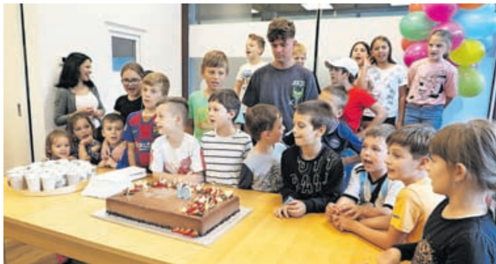
Mladi so komaj čakali, da upihnejo svečke na torti.

razne osebne stiske in jih usmerjali v koristno preživljanje prostega časa. Sprva smo v ta program vključevali otroke iz družin, ki so bile obravnavane na našem Centru za socialno delo, kasneje pa so začele z nami sodelovati tudi šolske svetovalne službe in starši sami. Potreba je bilo sčasoma več kot možnosti za vključitev. V nas sta začela tleti želja in cilj, da bi program nadgradili z dnevnim centrom za otroke in mladostnike, ki bi bil odprt vsako popoldne in v katerem bi za strokovno izvajanje vsebin skrbela ekipa strokovnih de-