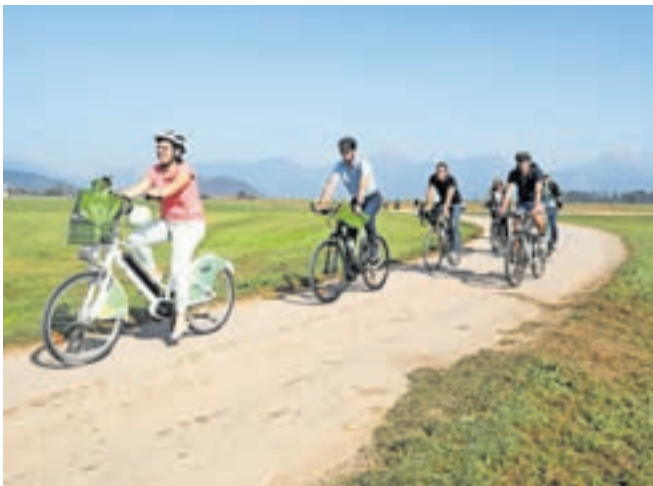
Skrb za kolesarsko infrastrukturo po Gorenjskem se krepi.