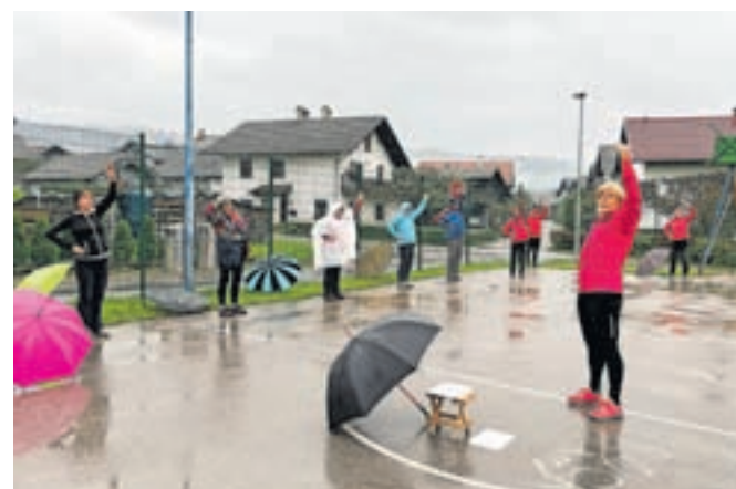
Vadba poteka ob vsakem vremenu.