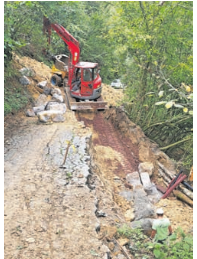
Skoraj tri mesece po uničujoči ujmi še vedno odpravljajo posledice na cestni infrastrukturi.

Samo stroški nujnih interventnih del so v avgustu po besedah župana znašali 250 tisoč evrov, prav tako naj bi dvesto tisoč evrov presegle okvirni stroški del, ki so jih izvedli v septembru. »Glede na to, da nas čaka še kar nekaj dela, bomo torej teh šeststo tisoč evrov od države zlahka porabili, prav tako se bodo stroški zaradi poplav odražali tudi v proračunih prihodnjih let,« je še dejal župan.