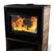
KRPAN KERAMIKA 110