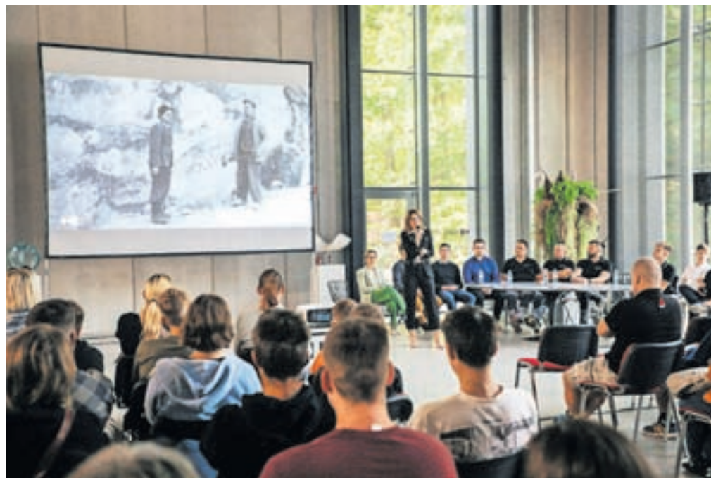
Na dnevu odprtih vrat so mladim in njihovim staršem predstavili podjetje s tristoletno tradicijo obdelave kamna.