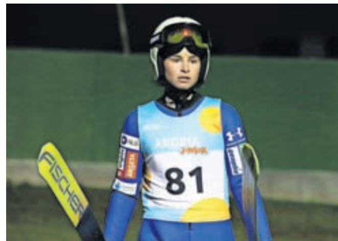
Nika Križnar je postala zmagovalka poletne velike nagrade in osvojila tretje mesto na državnem prvenstvu.