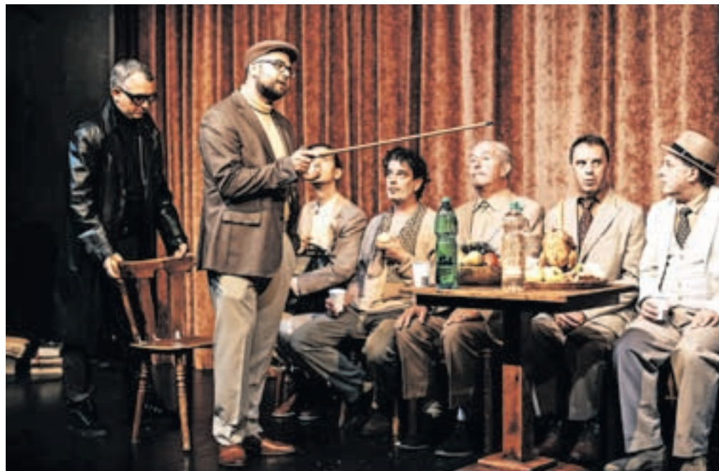
Skozi predstavo se odraža izjemna predanost igri vse ekipe Loškega odra.

Vrnimo se torej v 17. stoletje, čas Visoške kronike, morda z mislijo na začetek 20. stoletja, ko je roman nastajal, ali pa ostanimo kar v aktualnem času, v dvorani Loškega odra – tu si bomo odgovarjali na vprašanja, ki jih bo pred nas postavila uro in deset minut dolga predstava. Ta poteka na predvečer sojenja Agati Schwarzkobler, obdolženi čarovništva. V uvodu predstave v sproščenem pogovoru o obsojenki in še o marsičem pričakamo družbo škofjeloških veljakov (baron, pisar, sodnik, žitničar, zlatar in še kdo) z gostoma, sodnikom in rabljem iz Ljubljane. Čakajo na škofa (tistega, ki bo za razliko od njih Agato odrešil s preizkusom v vodi), ki