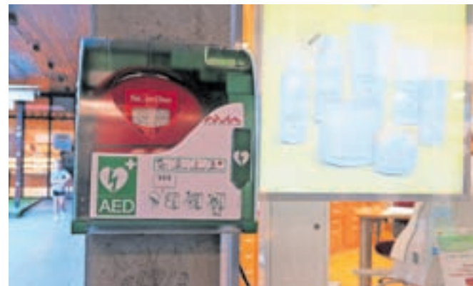
Defibrilator je že ob lekarni v Podlubniku.