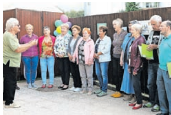
Na prireditvi so nastopili tudi starejši, ki se vsako dopoldne, ko so prostori Dnevnega centra za mlade prazni, družijo v Srečevalnici.