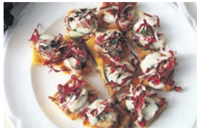
Uroš Štefelin je predstavil jedi iz lokalnih sestavin, primernih za umestitev na jedilnike vrtcev, šol in domov za starostnike.

javnih zavodih nameni več denarja, obenem pa bi bilo treba v javnih razpisih omogočiti večji odstotek lokalne hrane, ki zdaj znaša 20 odstotkov. Lokalna hrana je namreč bolj zdrava hrana, je poudarila strokovnjakinja za zdravo prehranjevanje in klinična dietetičarka Andreja Širca Čampa. »Lokalna hrana ima krajšo pot od zemlje do mize in s tem višjo biološko in hranilno vrednost.« Lokalna hrana pa ni samo bolj kakovostna, je poudarila, ampak se na ta način lahko v javnih zavodih izognejo tudi odvečni embalaži. Podžupan Občine Gorenja vas - Poljane Anton Debeljak je ob tem opozoril, da je kakovostna lokalno pridelana hrana dražja, v vrtcih in šolah pa so omejeni z najvišjo določeno ceno malice. »Zato bo treba to urediti tudi na zakonski ravni,« je predlagal. Ob tem pa se zaveda, da je treba tudi otroke naučiti, da izberejo domačo hrano, sploh če je niso navajeni od doma.