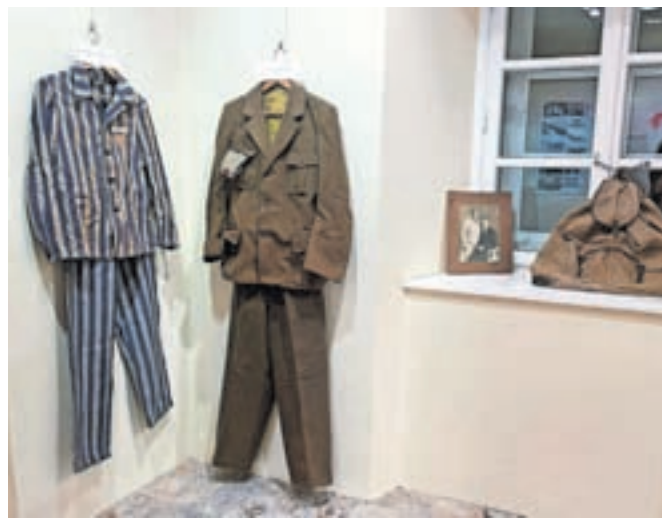
Razstava Žiri in narodnoosvobodilno gibanje v času druge svetovne vojne v Mali galeriji Muzeja Žiri

Razstava zajema dogajanje od krute razmejitve z rapalsko mejo po prvi svetovni vojni do osvoboditve. Avtorica je tako predstavila življenje ob meji ter začetke druge svetovne vojne v Žireh in kako so jo doživljali domačini, opisala je tudi begunsko izkušnjo, saj so mnogi Žirovci morali zapustiti svoje domove. »Osrednje mesto zavzema okupatorjev pritisk in rojstvo upora proti okupatorju. To je bilo v