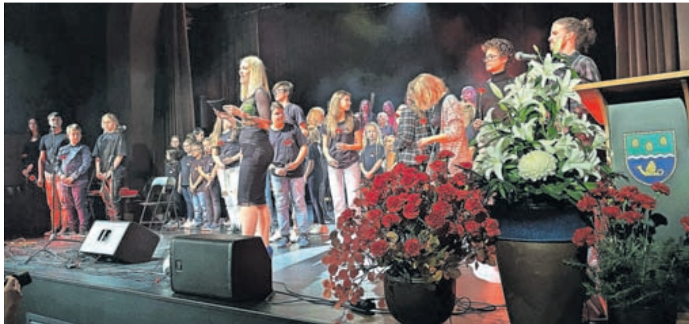
Kulturni program so pomagali oblikovati številni nastopajoči.

slabi učenci, saj »psihopati spet govorijo o končnih rešitvah«. Zato je pozval vse »svobodne, čuteče in odgovorne ljudi, da bodimo aktivni državljani in uporabimo spoznanja iz zgodovine, zdravo pamet, pogum in srce, da na vsakem koraku pozivom na vojno rečemo ne, prav tako pa trgovcem z orožjem in vsem, ki hujskajo k vojni«.