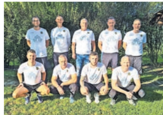
Ekipa Trate, ki je nastopila na kvalifikacijskem turnirju regionalne balinarske lige

Tretji konec tedna v oktobru pa je na Trati in v Ljubljani potekal kvalifikacijski turnir skupine Slovenija letošnje regionalne balinarske lige, v kateri sodelujejo klubi iz Slovenije, Hrvaške, Srbije in Črne gore. Trata, lanski zmagovalec lige, je zabeležila zmago proti Skali Sežana (12 : 10) in Ilirski Bistrici (14 : 8) ter poraz proti hrvaški Puli (5 : 17), kar je zadoščalo za drugo mesto v skupini in uvrstitev na finalni turnir v Beogradu, kjer bodo nastopili še Pula, Meljine in Novi Beograd.