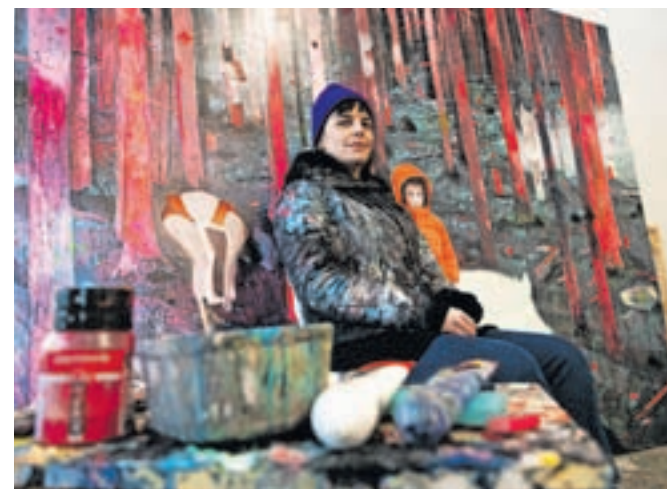
Nekoč v ateljeju

ji, oboje pa kombinira z elementi množične kulture in filma. Poleg slikanja se ukvarja tudi z ilustracijo in gledališko scenografijo,« je o ta čas zagotovo eni najbolj prepoznavnih škofjeloških likovnih umetnic zapisal njen sogovornik, kustos Loškega muzeja Boštjan Soklič. Pogovor bo vodil v okviru redne serije pogovorov z umetnicami in umetniki, ki jih pripravljajo v Loškem muzeju.