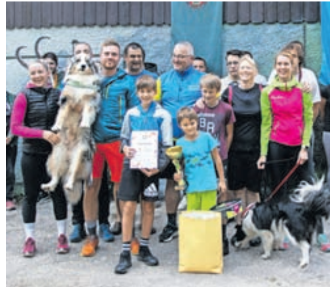
Prvovrščena ekipa Jakati

Soriška planina – Drugo nedeljo v oktobru so taborniki Roda zelene sreče Železniki priredili Občinsko orientacijo, že 21. po vrsti, tokrat na Soriški planini. Udeležba je bila rekordna, saj se je tekmovanja na čudovit jesenski dan udeležilo kar 28 ekip z več kot 160 tekmovalci. S kompasi in zemljevidi so se podali na 12 kilometrov dolgo traso ter se preizkusili v orientiranju v naravi in opravljanju različnih nalog: od iskanja ranjenca v naravi, prve pomoči do reševanja kvizov. Končni rezultat je bil odvisen od uspešnosti reševanja nalog, hitrosti ekipe in števila najdenih kontrolnih točk. Najbolje so odrezali Jakati, drugi so bili Pašavci, na tretje mesto pa se je uvrstila ekipa Debeli Jazbec. Železnikarski taborniki so te dni že na jesenovanju; odpravili so se v Smlednik.