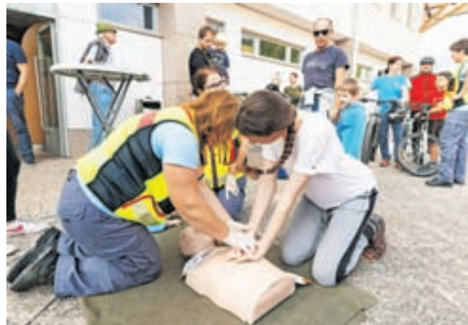
Prikazali so tudi postopke oživljanja.

Veliko pozornosti je pritegnila vaja reševanja ob prometni nesreči, v kateri sta bila po scenariju ponesrečena oseba na skiroju in voznik avtomobila, ki je med vo-