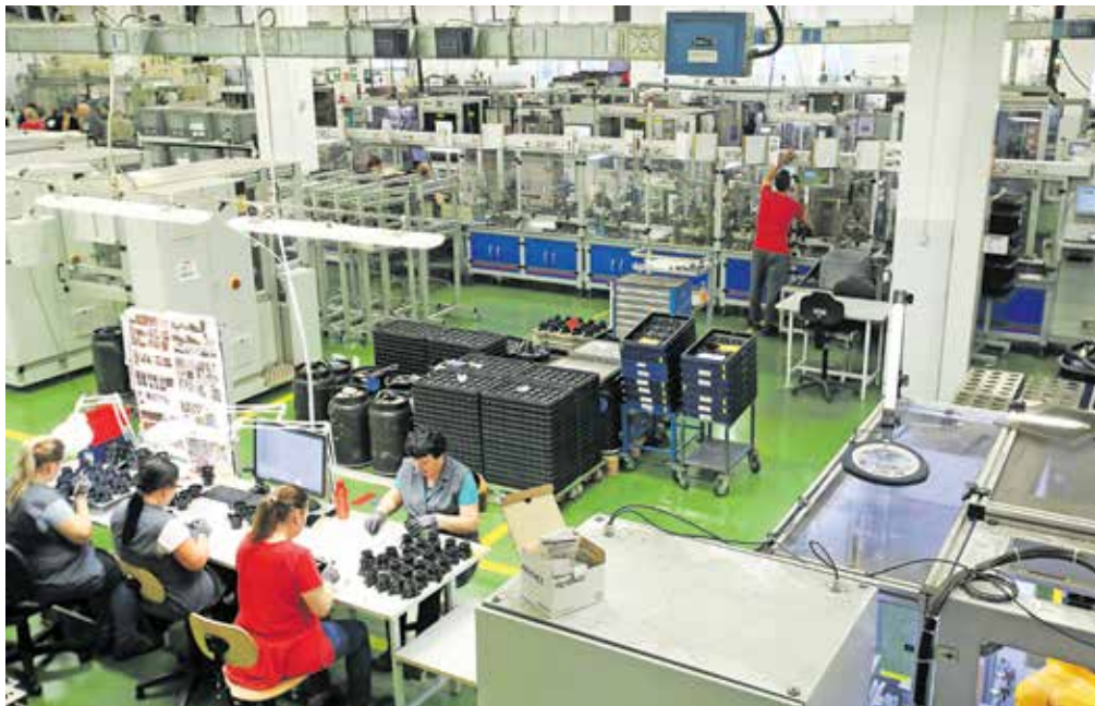
Ogled proizvodnje v Domelu v Retečah

V Domelu v Retečah je trenutno 210 zaposlenih. Kot je povedal direktor prodaje in marketinga v Domelu Jaka Kavčič, je večina investicij v podjetju vezana ravno na tehnologijo EC-motorjev (prav letos praznujejo