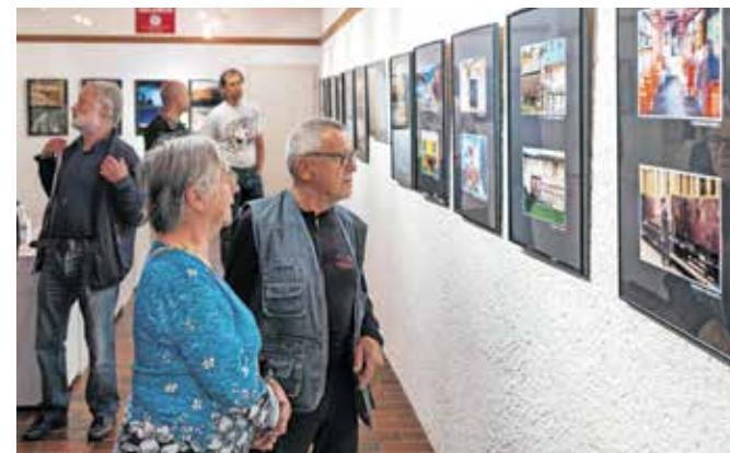
Fotografije, ki prinašajo zgodbe

Železniki – V Galeriji Muzeja Železniki s fotografsko razstavo gostuje Foto klub Anton Ažbe iz Škofje Loke. Kot je povedal predsednik kluba Izidor Jesenko, je v njem trenutno 54 članic in članov, na tokratni razstavi pa se jih predstavlja 29. Gre predvsem za fotografije zadnjih nekaj let, ki so jih posneli tako izkušeni fotografski mojstri, ki pogosto pošiljajo svoja dela na mednarodne razstave, kot mlajši avtorji, ki so se v fotografsko družino pridružili v zadnjih letih. Nekateri tako stavijo na motive iz živalskega sveta in narave v različnih letnih časih, druge je zanimala arhitektura in podobe mesta, kdo je na razstavo namenil posnetke iz potovanj po svetu, na nekaterih fotografijah spoznamo podobe naše kulturne dediščine, tudi tiste, ki izginjajo. Razstava bo na ogled vse do 11. novembra.