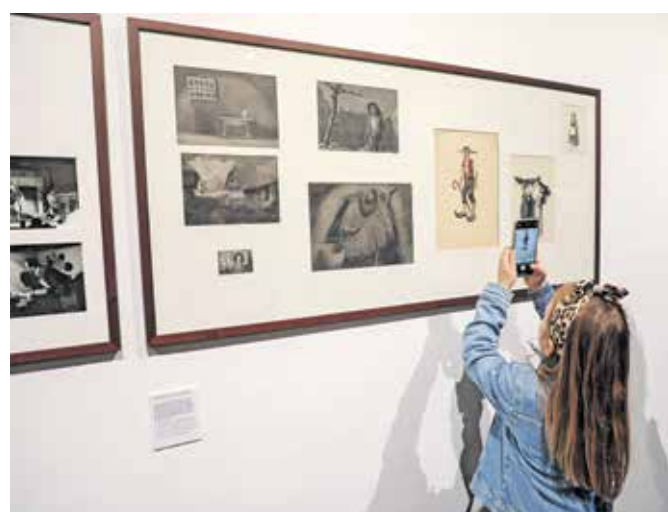
Najmlajše zanimajo ilustracije za film o Kekcu.