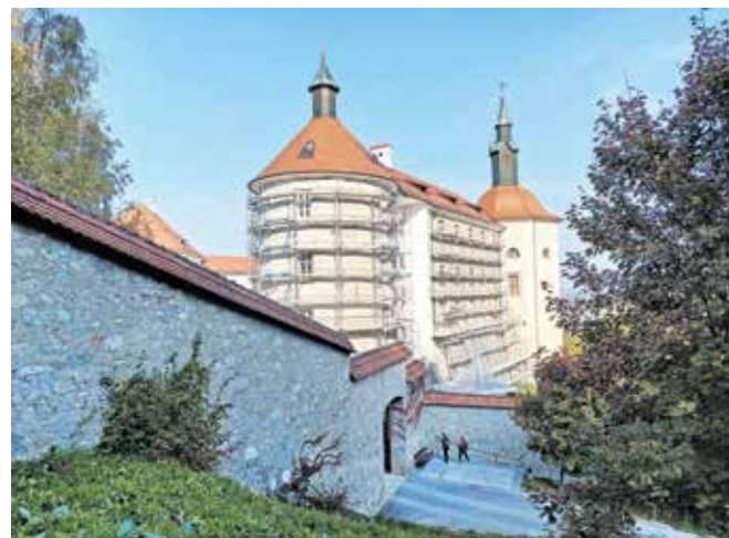
Po obnovi strehe Loškega gradu se je prejšnji mesec začela nova faza prenove.

Prenova obsega statično sanacijo ter obnovo fasade jugozahodnega okroglega stolpa, južnega in severnega dela gradu ter veznega trakt, ki Loški grad povezuje z objektom nekdanjega Nunskega samostana. Vključuje tudi celovito energetske prenovno severne in južne grajske fasade, vključno z jugozahodnim okroglim stolpom, grajskega atrija in