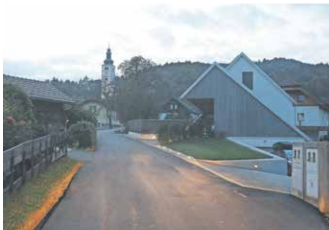
Cesta proti Crngrobu je asfaltirana.

Crngrob – Kot so prejšnji teden sporočili odgovorni, se zaključujeta celovita rekonstrukcija lokalne ceste in ureditev odvodnjavanja na odseku med vojaškim streliščem v Crngrobu in parkiriščem pod cerkvijo v Crngrobu. Odsek je dolg 550 metrov, kot pojasnjujejo na Občini Škofja Loka, pa bodo skupaj z rekonstrukcijo ceste in ureditvijo odvodnjavanja vgradili tudi cevno kanalizacijo za energetska omrežja do transformatorske postaje. Sicer pa je celotna investicija skupaj z odkupom nekaterih zemljišč ocenjena na okoli 160 tisoč evrov. Izvajalec gradbenih del je podjetje Dolenc, asfaltno prevleko pa je vgradilo gradbeno podjetje GGD. »Ministrstvo za obrambo Republike Slovenije bo rekonstrukcijo ceste sofinanciralo v višini 60 tisoč evrov, s čimer se nadaljuje dobro sodelovanje pri urejanju infrastrukture na vplivnem območju vojaškega strelišča,« še dodajajo na loški občini.