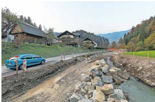
Ob rekonstrukciji 650 metrov ceste od Loga proti Rudnu bodo zgradili tudi pločnik.

DRSI zamaknil. »Najprej so nameravali zgolj obnoviti vozišče preko vzdrževalnih del, kar bi po ocenah stalo 2,1 milijona evrov, sedaj pa načrtujejo konkretno rekonstrukcijo ceste, za kar so izdelali tudi projekt. Ocenjen je na 4,5 milijona evrov, izvedli pa ga bodo preko investicij. Upamo, da bo čim prej uvrščen v državni proračun, pri tem pa se nadejamo tudi pomoči obeh poslancev, ki zastopata naše območje,« je povedal župan. Za rekonstrukcijo dotrajane državne ceste skozi Sorico je DRSI že pridobil vsa potrebna zemljišča in z občino podpisal sporazum o sofinanciranju. Po besedah župana upajo, da bo projekt uvrščen v državni proračun za prihodnje leto. Enako velja za gradnjo pločnika na Zalem Logu, za kar sta občina in DRSI prav tako že podpisala sporazum. Glavnina potrebnih zemljišč je pridobljena, usklajujejo se le še z enim lastnikom.