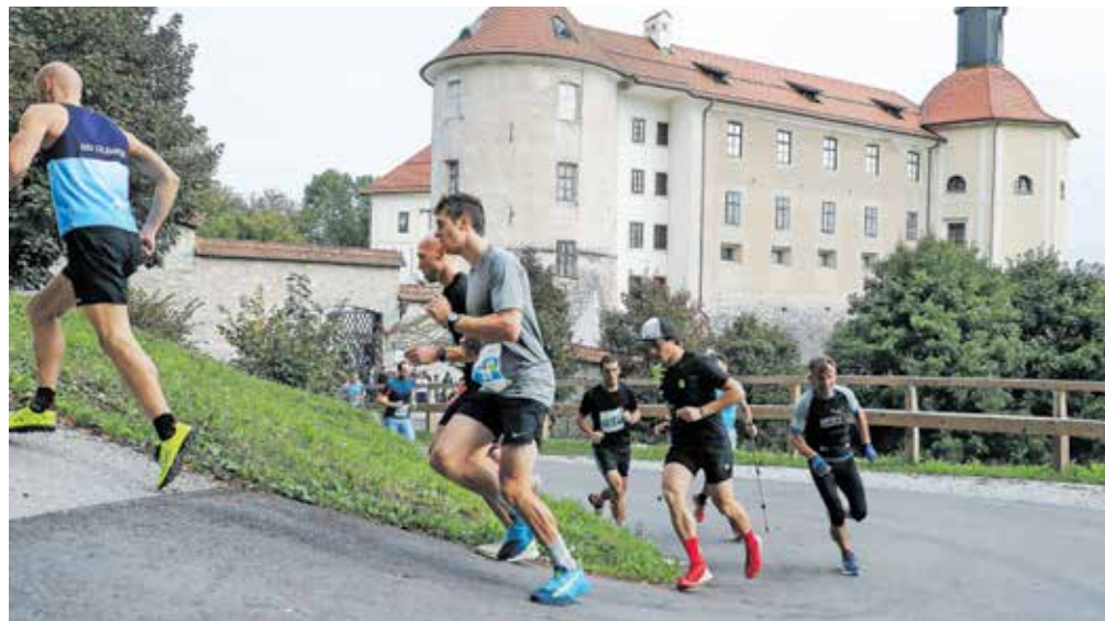
Teka na Lubnik se je udeležilo šestinpetdeset tekačic in tekačev.

Tek na Lubnik ima sicer dolgo tradicijo. Začetki segajo že v 70. leta prejšnjega stoletja, ko je mladinski odsek Planinskega društva Škofja Loka prvič organiziral tek na Lubnik. Kasneje je ta postal tudi del državnega prvenstva v gorskih tekih, nato pa so v 90. letih organizacijo prevzeli člani ŠD Puštal. Vrhunec so dosegli leta 2004, ko je bila krožna trasa Tek na Lubnik izbira tekma za članice slovenske reprezentance za svetovno prvenstvo v gorskih tekih. Organizatorji Teka štirih mostov in kole-