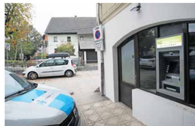
Bankomat so prestavili na novo lokacijo.

razložili na občini. Kot najprimernejše mesto za bankomat se je izkazal objekt nekdanje pekarnice na naslovu Poljane nad Škofjo Loko 28. »Občina je za potrebe postavitve bankomata obnovila pritrlične prostore, kamor se je začasno preselila tudi Krajevna knjižnica Poljane,« so še pojasnili na občini.