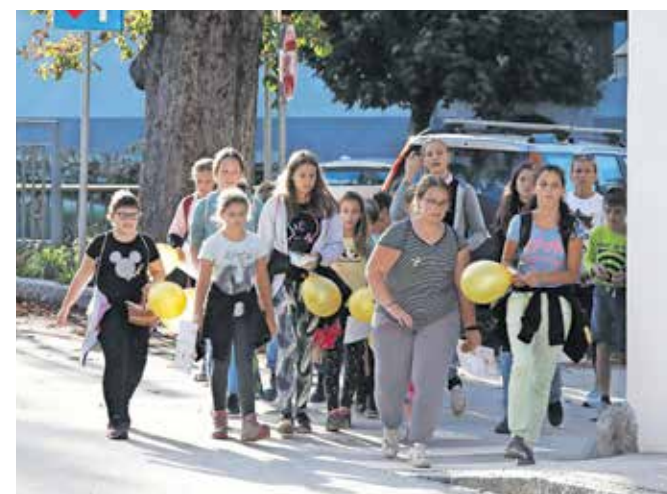
V OŠ Poljane so pripravili dobrodelni tek Koraki za junake.