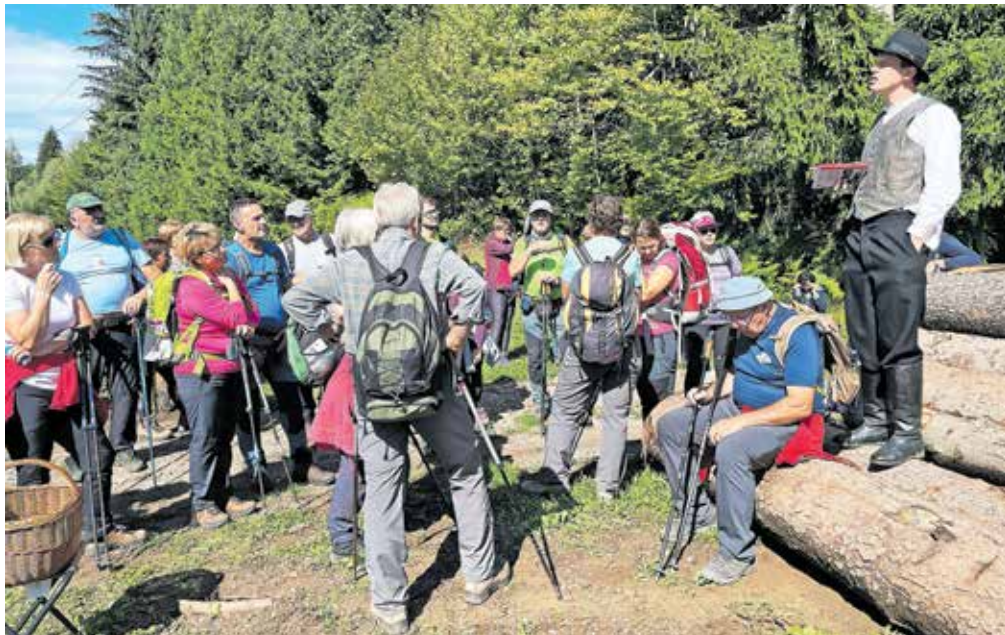
Zgodovinsko obarvan pohod ob rapalski meji