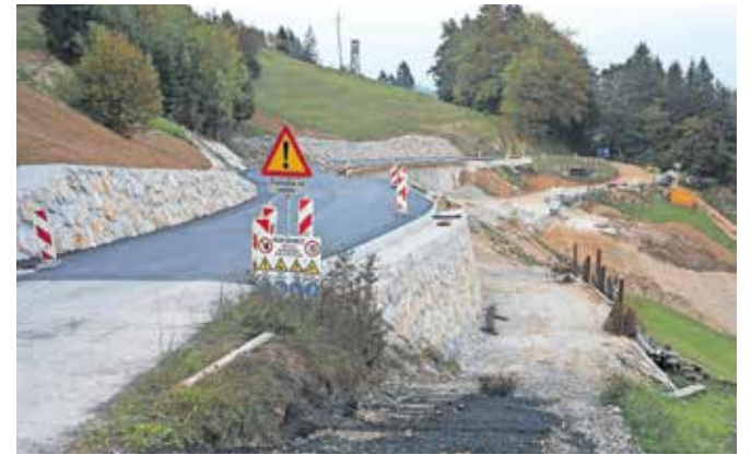
Sanacija plazu na regionalni cesti pri Lajšah naj bi bila končana konec oktobra.

V Železnikih že težko čakajo tudi gradnjo obvoznice mimo starega dela mesta. DRSI, občina in izvajalci so že podpisali pogodbo, a je bila na izdano gradbeno dovoljenje za tretji odsek protipoplavnih ukrepov od Dermotovega jezua do Dolenčevega jezua, ki jim bo sledila še gradnja obvoznice, vložena pritožba. Postopek na upravnem sodišču še poteka, a se lahko izvajalci obvoznice že lotijo vzdrževalnih del v javno korist na