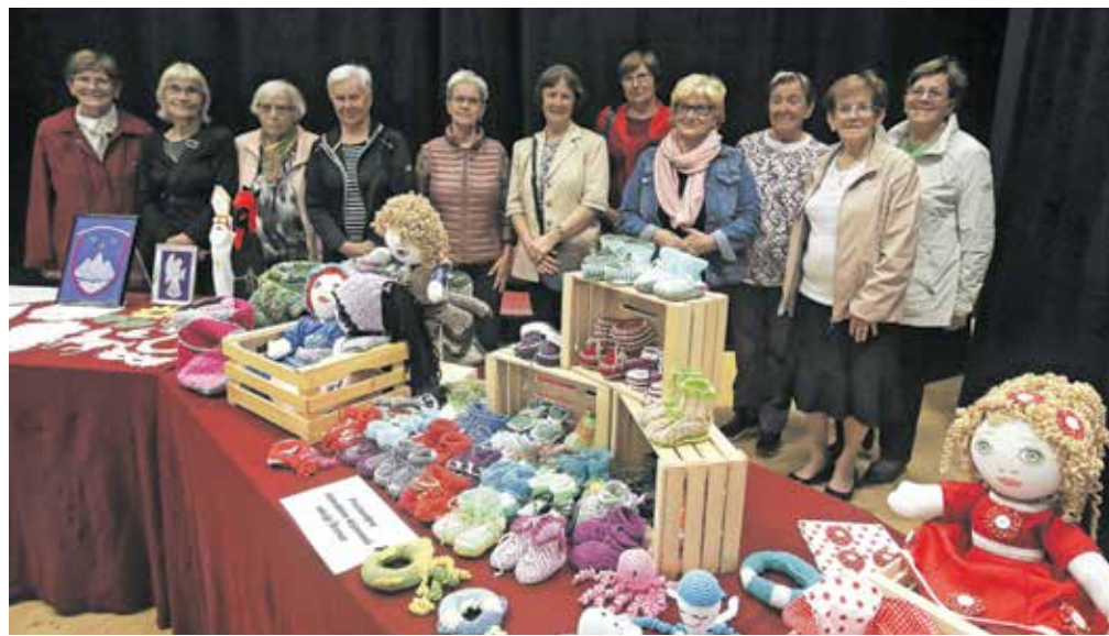
Članice Društva upokojencev za Selško dolino Železniki so razstavile čipke, vezenine, copatke za novorojenčke, Unicefove punčke iz cunj, kvačkane odeje za starostnike na invalidskih vozičkih...