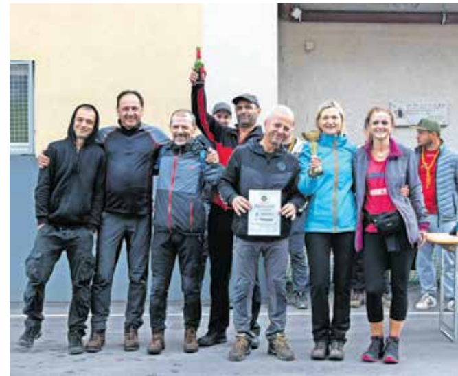
Na dvajseti Občinski orientaciji je slavila ekipa Izgubljeni.

V RZS Železniki se ta čas že pospešeno pripravljajo na jesenovanje. Letos ga ponovno prireajo v Dolenjih Novakih, kjer bodo preživeli zadnje štiri dni v oktobru. Za udeležence so pripravili za-