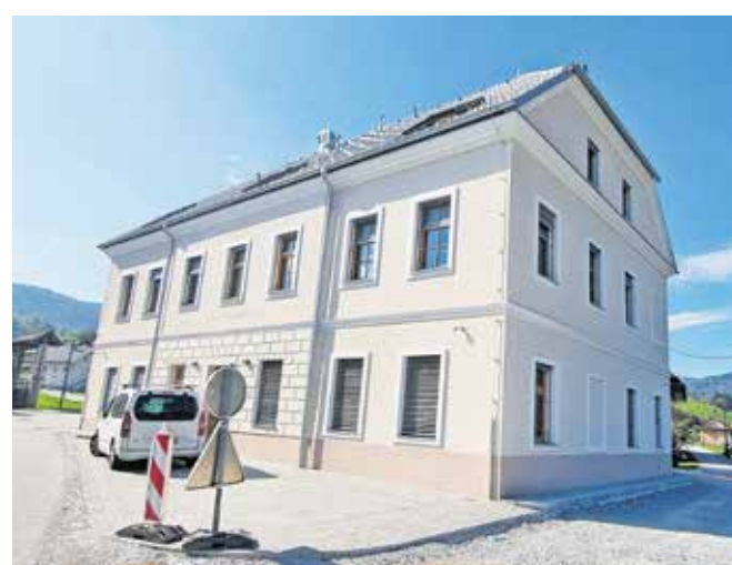
Prve uporabnike bi lahko sprejeli v začetku prihodnjega leta.

Prednost pri sprejemu v dom bodo imeli prebivalci