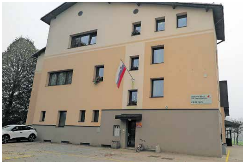
Prostori vrtca v osnovni šoli se zdijo staršem neprimerni.

»Kljub splošno znane dejstvu, da naselje Reteče v zadnjih letih neizmerno raste in se povečuje in da je vedno več otrok, ki bodo obiskovali ali že obiskujejo vrtec kot tudi šolo v Retečah, Občina Škofja Loka še ved-