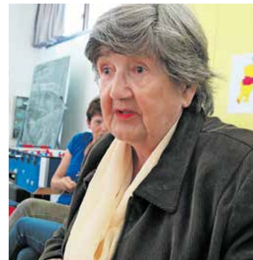
Pobudnica za druženja Mana Veble Grum