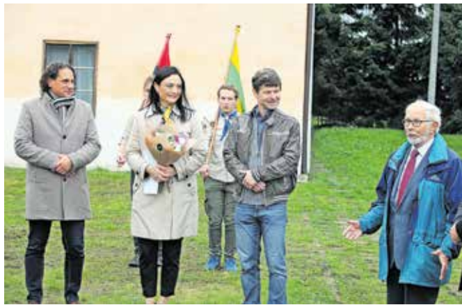
Obisk predstavnikov Škofje Loke v Taboru na Češkem je potrdil, da je sodelovanje med pobratenima mestoma uspešno.