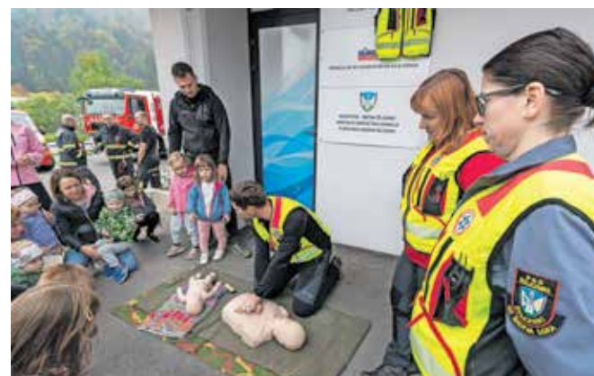
Prvi posredovalci PGD Železniki med prikazom oživiljanja