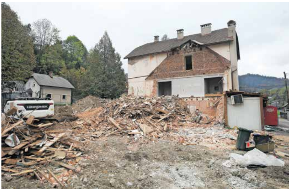
Rušenje starega kulturnega doma v Poljanah

»Gradnjo smo razdelili v dve fazi, pri čemer bomo prednostno izvedli gradnjo celotnega objekta in znotraj tega kulturne dvorane,« je razložil župan in dodal, da bo naložba vredna dobre štiri milijone evrov. »Objekt je zasnovan po inovativnem konceptu dva v enem, saj je prva etaža enovita, v višjih etažah pa se objekt razvije v dve zgradbi z osrednjo ploščadjo in povezovalnim mostovžem. Tako se je zasnova objekta prilagodila ureditvi vaškega jedra, obenem pa bo zagotovljena prostorna osre-