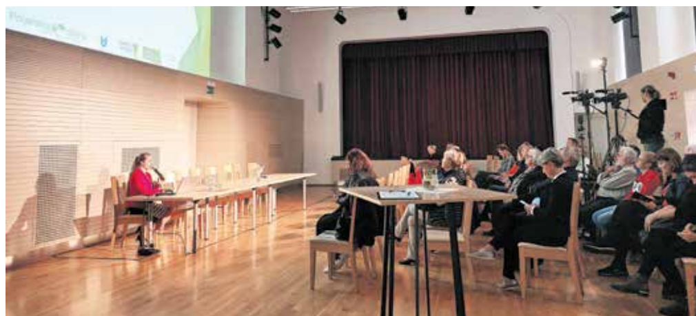
Zavod Poljanska dolina je ob svetovnem dnevu turizma pripravil posvet Zeleni dan Poljanske doline.