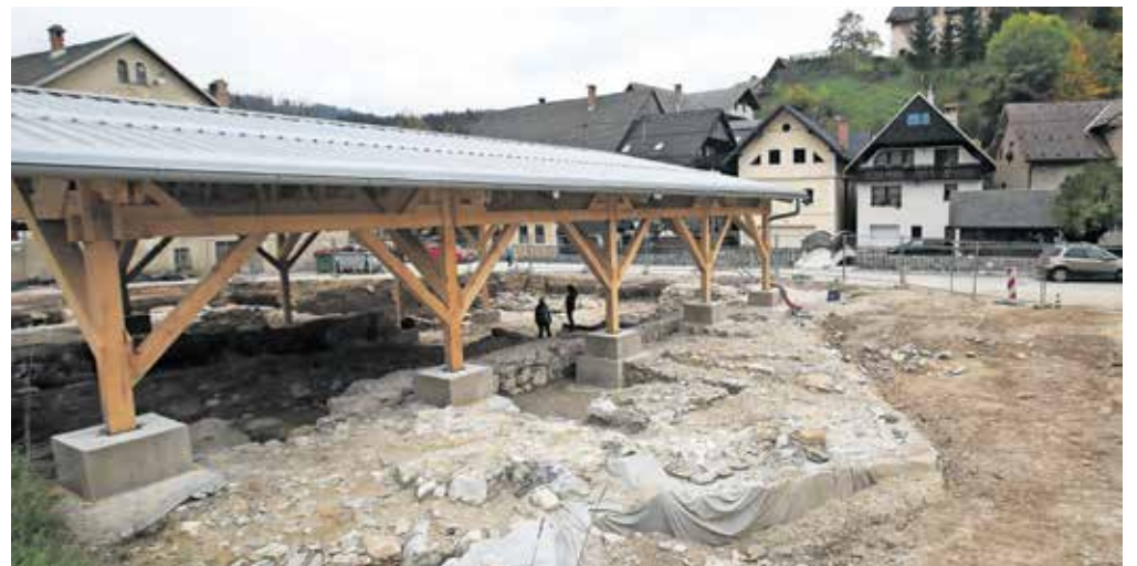
Najdišče so zaščitili z nadstrešnico.