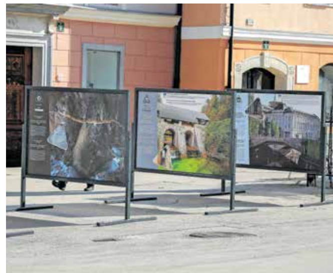
Okno Loške hiše opozarja na slovenske vpise na Unescov seznam nesnovne kulturne dediščine.

no dramsko besedilo v slovenskem jeziku in najstarejša ohranjena režijska knjiga v Evropi. Sledili so mu še drugi. Razstava obenem zaznamuje tudi 50 let od sprejetja Konvencije o varstvu svetovne kulturne in naravne dediščine, ki je bila sprejeta 16. novembra 1972 na srečanju generalne konference Unesca.