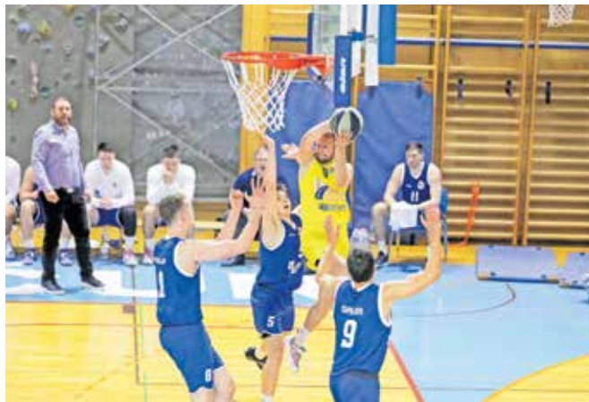
Ločani so morali premoč priznati tudi Gorenjski gradbeni družbi Šenčur.

Škofja Loka – Na prvo oktobrsko soboto je ekipa LTH Castings odigrala prvo tekmo v najmočnejši slovenski košarkarski ligi Nova KBM. V domači dvorani na Podnu so varovanci trenerja Igorja Dolenca gostili košarkarje Ilirije. Po borbeni igri so se na koncu zmagali z 80 : 84 veselili gostje. V drugem krogu so Ločani gostovali pri Gorenjski gradbeni družbi Šenčur in zabeležili tudi prvi poraz v gosteh. Domačini so bili namreč boljši z 72 :