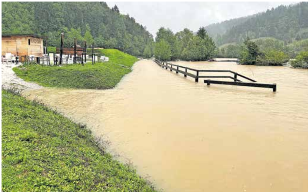
Pod vodo je bilo tudi kopališče na Pustotniku. / FOTO: TANJA MLINAR

»Škoda je nastala predvsem na kmetijskih zemljiščih, na katerih so ostale naplavine, a glede na količino padavin niti ni bila tako velika,« je razložil Poljanšek in kot razlog za to navedel, da je poplavljal samo v spodnjem toku rek in je tako večino naplavin prinesla Poljanska Sora, ki je precej manj kamnita kot recimo Račeva. »Do izpada pridelka je tako prišlo na nekaterih travnatih površinah, a ker je bila zdaj že tretja košnja, bo ta škoda zanemarljiva.« Poleg tega so bili poplavljeni trije objekti v Žireh, a je škoda nastala zgolj na enem, saj na drugih dveh voda ni vdrla v notranjost objekta. Za okrog 17 ti-