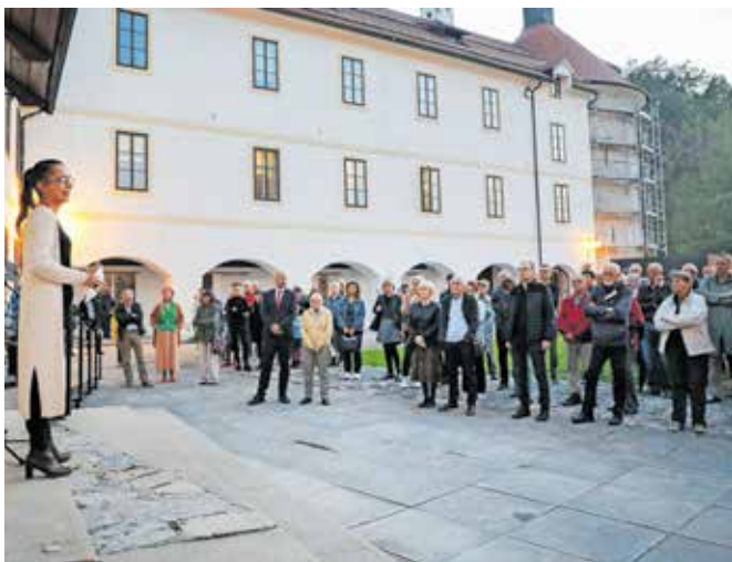
Na razstavi že dolgo ni bilo toliko ljudi.