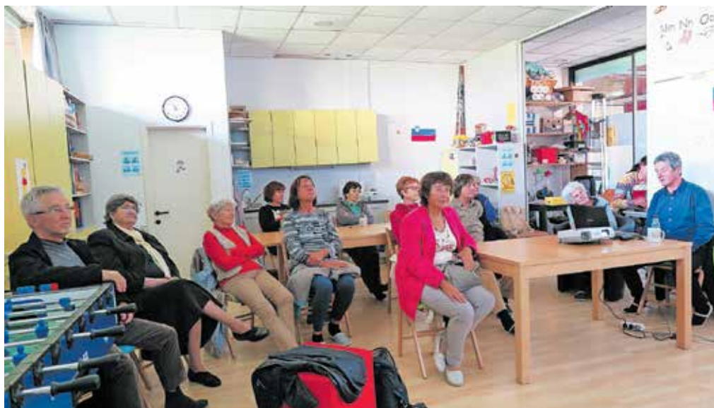
V Srečevalnici potekajo tudi zanimiva predavanja.

Kandus iz Večgeneracijskega centra pri Zavodu O, zavodu škofjeloške mladine.