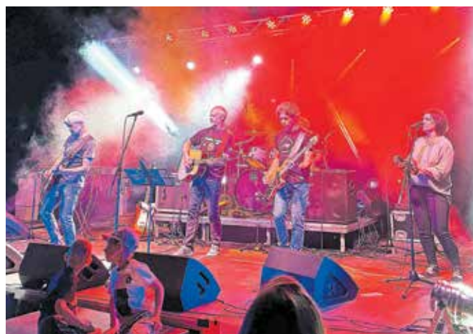
Poletno muzejsko noč je s svojim jubilejnim koncertom zaokrožila skupina Lintverni.