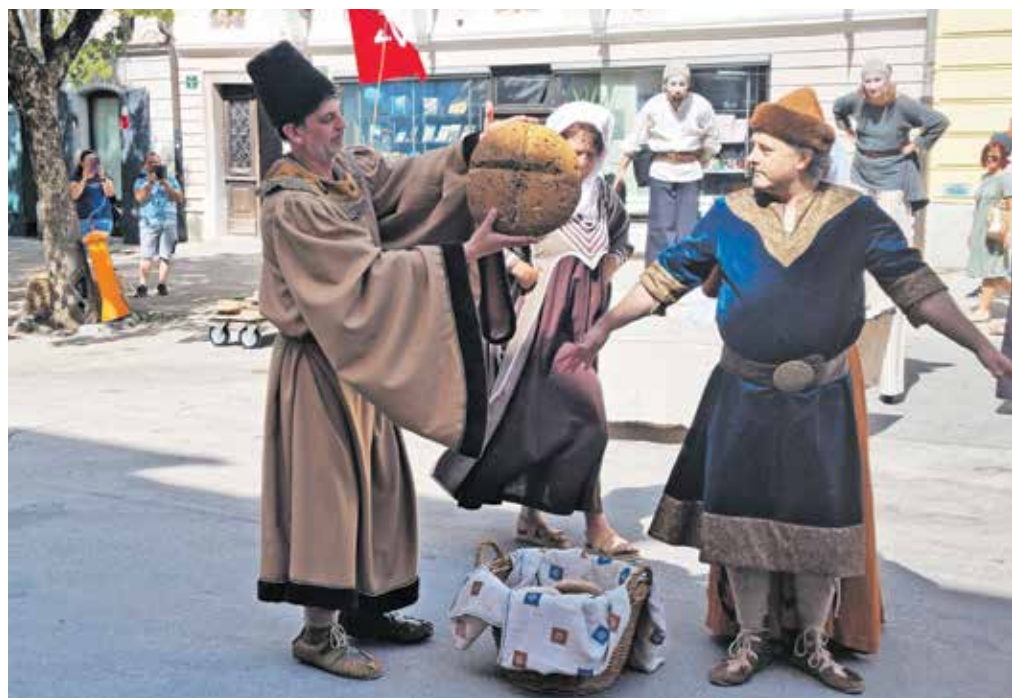
Dramska uprizoritev igre Kruh in pivo

med katere so delili tudi kruh, o katerem je govorila igra. V Sokolskem domu pa je bilo mogoče prisluhniti predavanju Sanje Lončar z naslovom Samooskrba nekoč in danes – kaj se lahko naučimo od srednjeveške grajske samooskrbe.