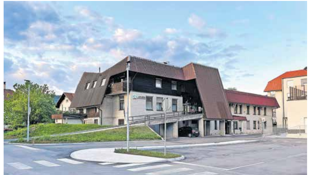
Občinskim svetnikom so predstavili idejno zasnovo prenove zdravstvene postaje.

Kot je pojasnil Erznožnik, je streha tako na objektu zdravstvene postaje kot lekarne