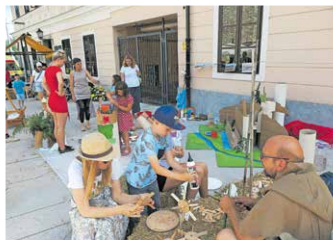
Otroške delavnice na Trgu pod gradom

Pester je bil tudi nabor spremljevalnih dogodkov. Prostor med ateljejem Amuse in sodobnim tekstilnim centrom Kreativnice je bil namenjen tekstilu in klobučarstvu, v Rokodelskem centru DUO pa si je bilo mogoče ogledati razstavo historičnih oblačil in pripadnostnih kostumov mojstrice Andreje Stržinar. V Škoparjevi hiši so potekale delavnice peke kruha, obi-