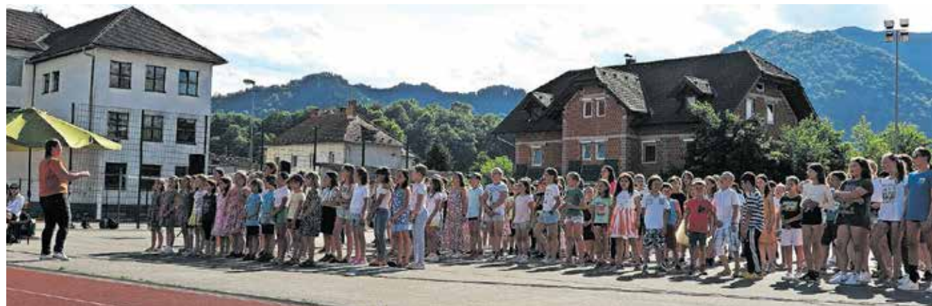
Na pristrčni prireditvi se je predstavil tudi šolski pevski zbor.

slanstvu in skrbijo za vsako generacijo posebej. Tretjič pa tudi zato, kar za staro damo tudi dobro skrbimo, saj vsako poletje poskrbimo, da so prostori še svetlejši, še lepši in še prijaznejši. Tako bo tudi letos,« je poudaril župan Radinja, ki je zbranim na prireditvi za največjo loško šolo zaželel tudi dolgo lepo in vroče poletje.