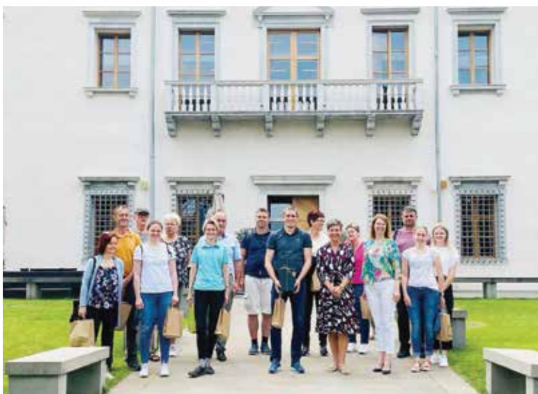
Udeleženci strokovne ekskurzije na območje LAS V objemu sonca

je koles je delno sofinancirana s sredstvi projekta Kolesarska veriga na podeželju in projekta (NAD)gradimo ponudbo Škofjeloškega . Kolesa si lahko trenutno izposodite na sedmih postajah s skupno 85 ključavnicami. Naj za konec poudarimo, da je Gorenjska.bike še vedno edini medobčinski sistem izposoje koles v Sloveniji. Vse aktualne novice lahko spremljate na spletni strani LAS loškega pogorja ( www.las-pogorje.si ) ali pa informacije dobite v pisarni LAS loškega pogorja na Razvojni agenciji Sora, d. o. o., Poljanska cesta 2, Škofja Loka.