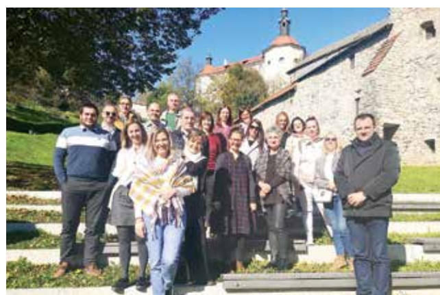
Srečanje partnerjev projekta CCI4Tourism v Škofji Loki.