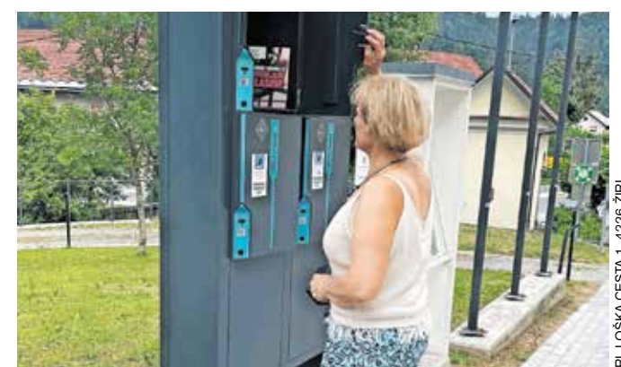
Paketnik za prevzem naročenega gradiva pred knjižnico v Žireh