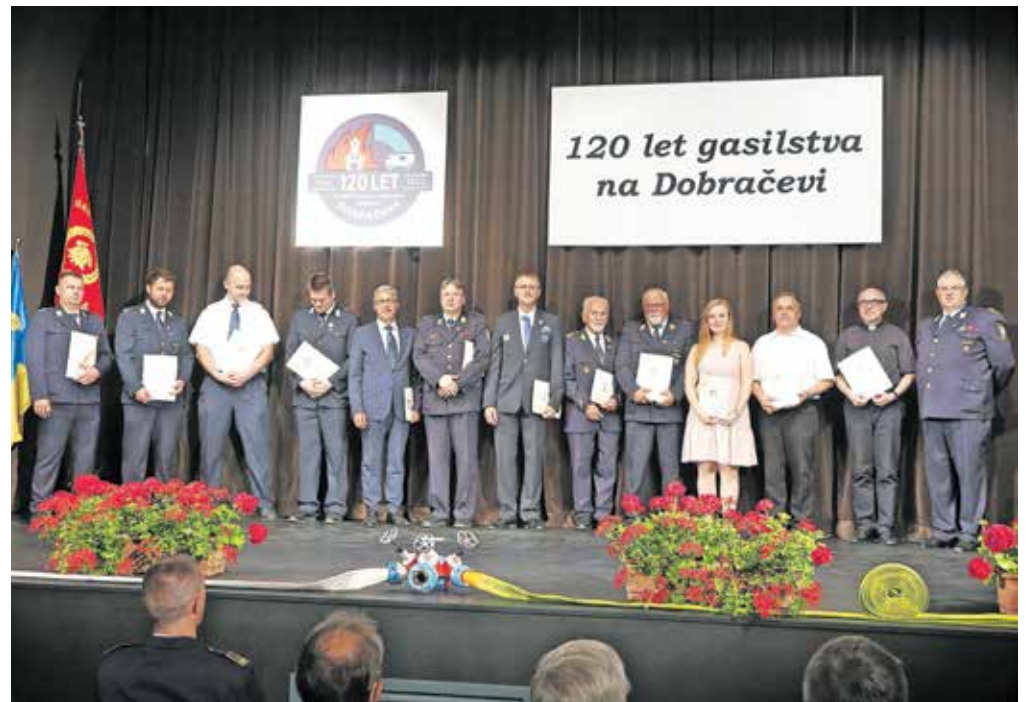
Prejemniki zahval PGD Dobračeva