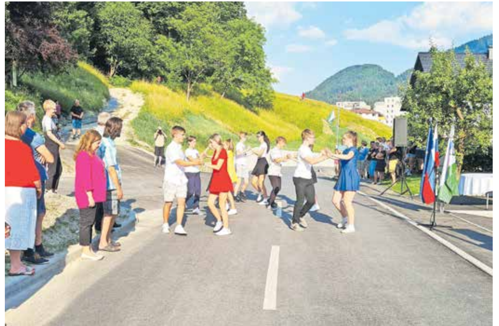
Takole so plesalci Osnovne šole Železniki zaplesali po na novo urejenem odseku v Dašnici.