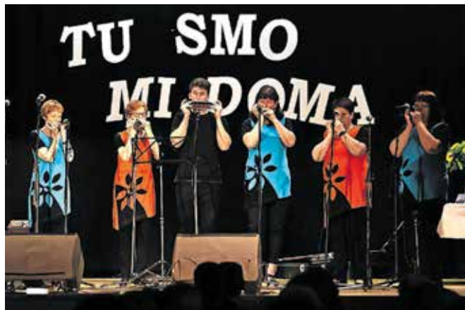
Francetovi orgličarji igrajo in nastopajo dobrih sedem let.