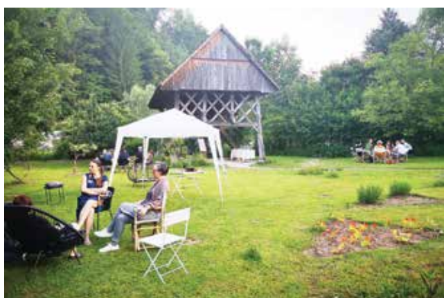
Srečanje delovnih ekip in mentorjev na vrtu Kržišnik v Žireh.

Projekt je v zadnji fazi izvajanja. Končuje se konec leta 2022, do takrat pa bodo izvedeni še vsi podprti projekti, na izvedbo čaka tudi še nekaj dogodkov in izobraževanj. Na podlagi rezultatov vseh projektnih aktivnosti bo ob koncu projekta izdelan transnacionalni akcijski načrt razvoja kulturnega turizma v regiji, ki ima brez dvoma izjemen potencial za nadgrajevanje.