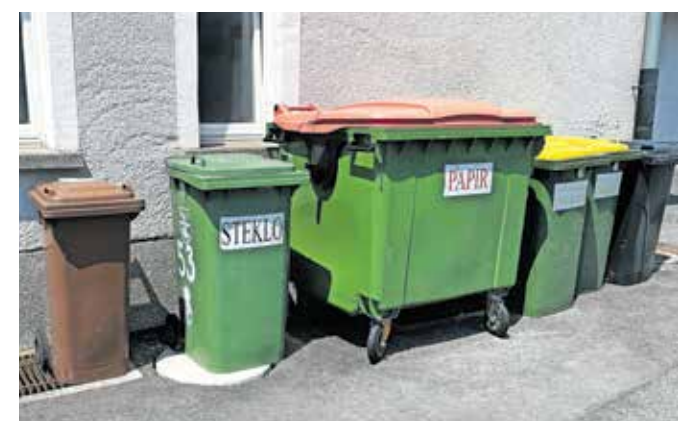
Izvajanje storitev zbiranja in odvoza komunalnih odpadkov bo v prihodnjih štirih letih opravljal podjetje Avtoprevozištvu Martin – Valentina Frelj.

brih 280 tisoč evrov brez DDV, so pojasnili na občini. »Obe ponudbi sta bili v celoti primerljivi tako glede kakovosti voznega parka kot razporeda odvozov in načina opravljanja storitev. Ob izpolnjevanju vseh zahtevanih pogojev in referenc je bil tako izbran ponudnik, ki je ponudil nižjo ceno,« so odločitev utemeljili na občini. Urnik odvozov za gospodinjstva se ne spreminja, povečalo pa se bo število odvozov z ekoloških otokov, da bi tako prispevali k njihovi večji urejenosti, so še dodali na občini.