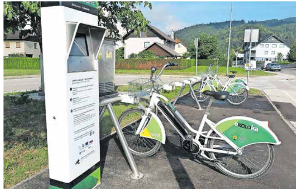
Za izposajo koles je že veliko zanimanja.

Izposoja in vračilo koles sta v Škofji Loki trenutno mogoča na sedmih postajah s skupno 85 ključavnicami, saj bo postaja na parkirišču Lipica predvidoma zaživila šele jeseni, po zaključku gradnje krožišča. Tako so trenutno postaje pri zdravstvenem domu, železniški postaji, trgovskem centru na Grencu, na avtobusni postaji, pri športni dvorani na Podnu, v Podlubniku in na parkirišču v Puštalu. Sistem deluje tako, da se na postaji prijavimo in si izposodimo kolesa z uporabniškim imenom in geslom ali pa alternativno z uporabni-