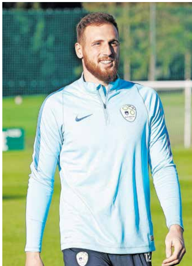
Ob letošnjem občinskem prazniku bo naziv častnega občana prejel nogometni vratar Jan Oblak.