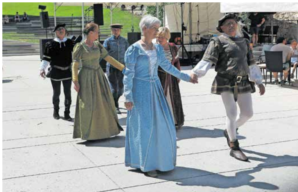
Obiskovalci so lahko spremljali tudi historične plesne.

pouličnimi nastopi plesnih in glasbenih skupin, na manjšem odru na Trgu pod gradom pa je bilo mogoče spremljati tudi nastope škofjeloških osnovnih šol. Otrokom je bil namenjen tudi obsežen program ustvarjalnih delavnic na Trgu pod gradom, na Cankarjevem trgu pa so zanje pripravili etnološko-rokodelske delavnice, lutkovne predstave, stare igre in pravljice. Slednjim so lahko prisluhnili tudi na vrtu Občine Škofja Loka v okviru knjižnice na prostem. Osrednji dogodek je predstavljala dramska uprizoritev igre Kruh in pivo, ki je potekala po mestnem jedru med gledalci,