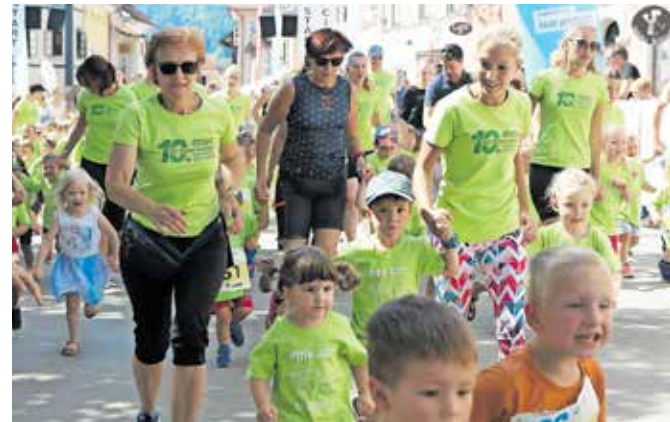
Najprej so bili vrtčevski teki.

Tek štirih mostov bo šel v prihodnje še bolj v smer zelenega in trajnostnega. »Raz-