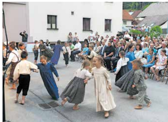
Mlajša folklorna skupina iz Selc se je predstavila s pastirskimi igrami in plesom.

Selca – Kulturno društvo dr. Janez Evangelist Krek iz Selc je minuli četrtek izpeljalo občinsko prireditev ob dnevu državnosti z naslovom Rad živim v Sloveniji. Slavnostni govornik na praznovanju 31. rojstnega dne naše države pred gasilskim domom v Selcih je bil Lojze Peterle, predsednik prve slovenske vlade in trenutni predsednik Združenja za vrednote slovenske osamosvojitve. »Državo smo naredili za vse, za leve in desne, za vse generacije. Ta praznik nas ne deli, ta praznik nas povezuje. Državo smo naredili zato, da nam bo v njej dobro. Mislim, da lahko še veliko skupaj naredimo,« je poudaril Peterle in se zahvalil vsem, ki so v času osamosvajanja podprli njegovo vlado. »Zahvaljujem se vam za vaš delež podpore, zato da danes živimo kot narod z dostojanstvom lastne države, ki je postala članica evropske zveze. Sami si da-