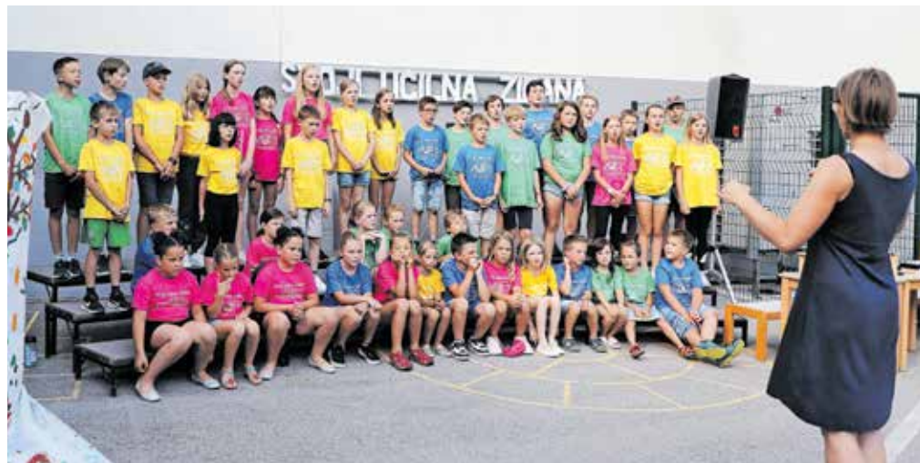
Program prireditve ob jubileju šole so pomagali oblikovati vsi učenci šole in tudi vrtčevski otroci.