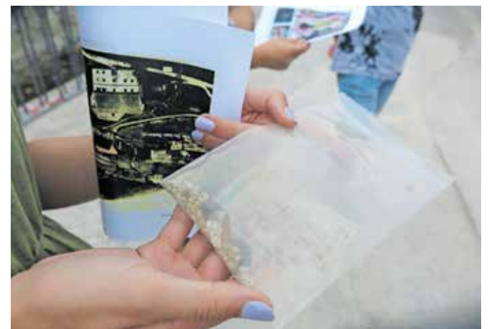
Najdbe so skrbno shranili in evidentirali.

tem dejala, da gre za prav poseben simbolni prostor, tudi zaradi več cerkva, ki so jih gradili eno nad drugo. Prepričana je, da je to ob-