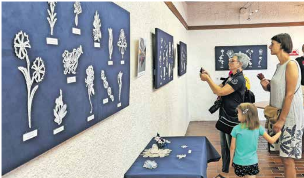
Razstava 60 rož za 60 Čipkarskih dni bo v galeriji Muzeja Železniki na ogled še do 11. julija.