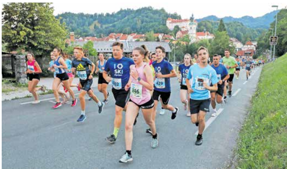
Na 10-kilometrsko progo se je podalo nekaj manj kot sedemsto tekačev.

mišljamo tudi o tem, da bi večtisočglavo skupnost T4M aktivirali večkrat na leto v obliki druženja, srečevanja, izobraževanja in ozaveščanja – tudi z mednarodno noto. Še naprej bomo prečkali mostove in povezovali ljudi pa tudi podaljševali mize in zniževali zidove, seveda pa bomo za doseganje teh ciljev potrebovali dodatno podporo in pomoč sponzorjev, donatorjev, podpornikov in prijateljev Teka štirih mostov,« še pravi Drakulić.