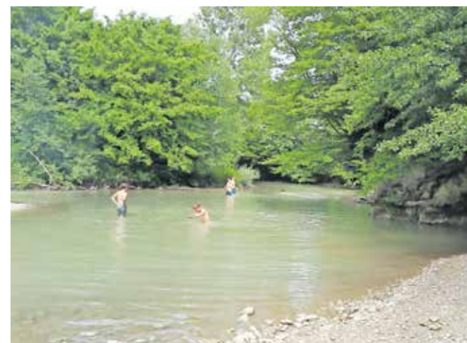
Kopanje v Selški Sori odsvetujejo.

Škofja Loka – Na loški občini vsako leto na začetku kopalne sezone naročijo strokovno analizo vzorcev površinskih kopalnih voda na lokacijah naravnih kopališč oziroma kopalnih območjih, kjer je poletje največ kopalcev. Tako je v začetku junija strokovno analizo izvajal Nacionalni laboratorij za