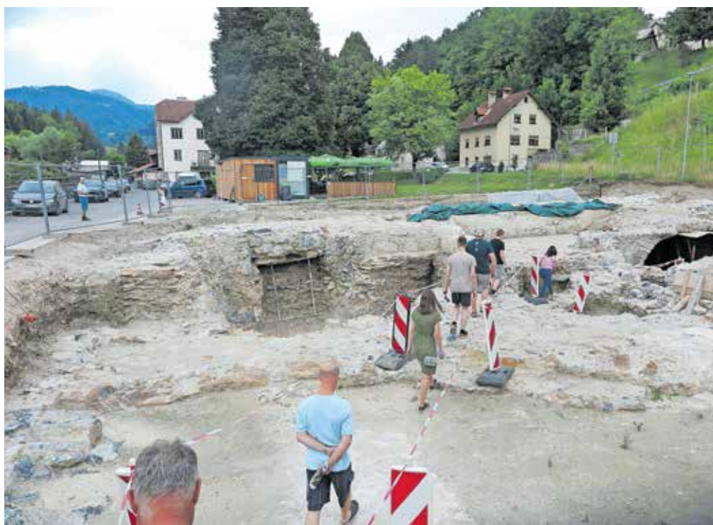
Na ogledu arheološkega najdišča v Poljanah