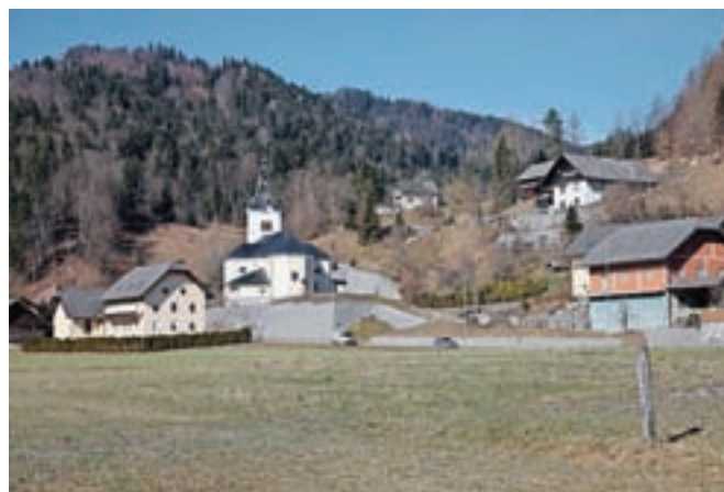
Dom starejših bi zgradili na zemljišču pod župniščem v Selcih.