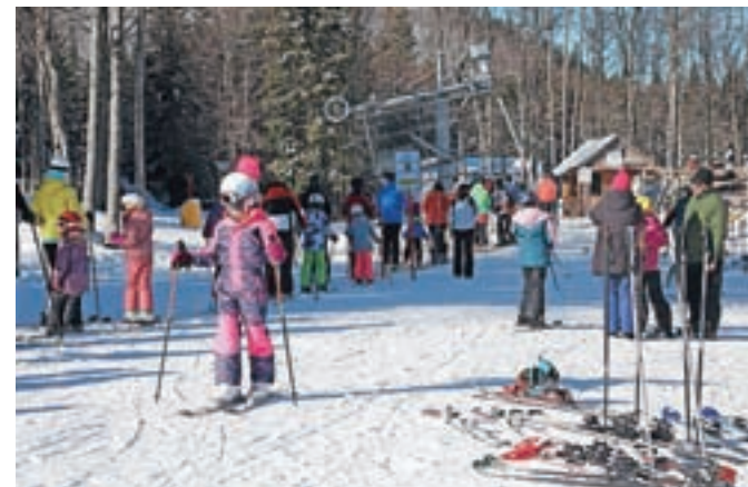
Na Soriški planini so v tej sezoni našli že več kot 35 tisoč smučarjev.

Tudi na smučišču Rudno so z dosedanjo sezono zadovoljni. "Začeli smo jo 12. decembra. Ves čas smo nemoteno obratovali, z izjemo dveh dni, ko je bilo vreme preslabo, sicer pa je bilo večino časa lepo in stabilno. Škoda je sicer, da je naravni sneg hitro skopnel; imamo le umetni sneg, na katerem se je možno tudi sankati, tek na smučeh po rudenskem polju pa ni več možen. Umetnega snega smo izdelali veliko, da