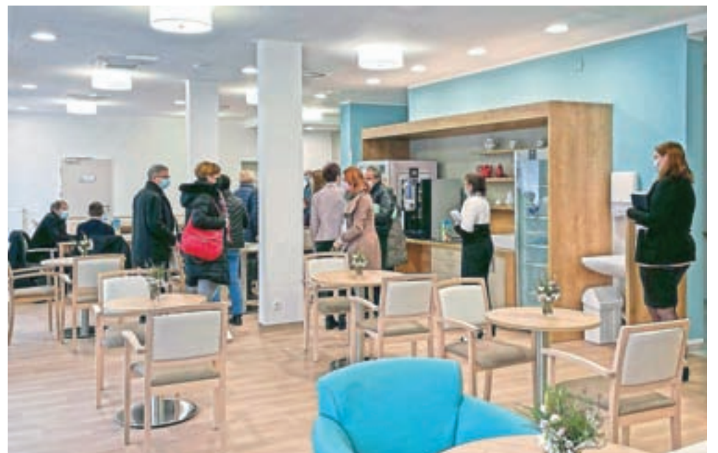
V novem domu je že vse pripravljeno za sprejem prvih stanovalcev, potrebujejo samo še kader.

V domu so sicer pričakovali, da bodo zaposlovanje končali do konca preteklega leta in bi v začetku leta začeli sprejemati prve stanovalce, a jim to ni uspelo. Zato so bili primorani predstaviti tudi začetek delovanja doma, za zdaj je predvideno, da se bo to zgodilo v marcu. "Upamo, da nam do takrat uspe dobiti tudi nujno potreben kader. Pri tem dajemo, tako kot pri sprejemanju stanovalcev, prednost domačinom, saj nam