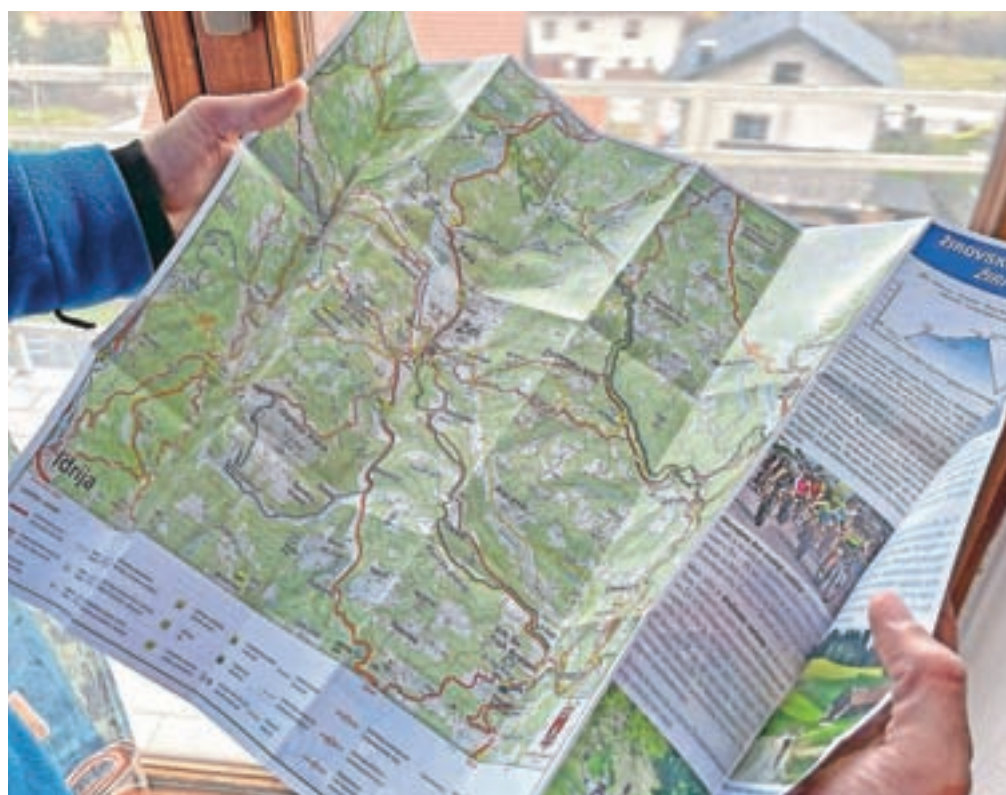
Izšel je nov turistični zemljevid Žirov.

Na zemljevidu je karta Občine Žiri z bližnjo okolico ter karta središča Žirov, na kateri so posebej označeni občinski, kulturni in turistični objekti. Označili so naravne in kulturne znamenitosti, razgledne točke ter pohodne