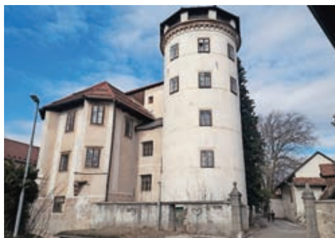
Starološki grad, ki že leta sameva, išče novega lastnika.

Zadnja javna dražba za prodajo Starološkega gradu in nekaterih pripadajočih nepremičnin je bila maja leta 2018. Cena je bila 190 tisoč evrov. Gradu in okoliškega zemljišča takrat niso prodali, tudi Občina Škofja Loka pa se je odrekla predkupni