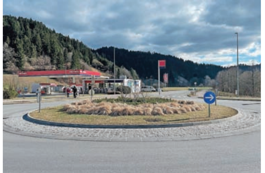
Predvidoma v marcu bodo nadaljevali gradnjo obvoznice proti Logatcu.

Najugodnejšo ponudbo je na razpisu oddalo podjetje Gratel s partnerjem Garnol, in sicer po pogodbi vrednost naložbe znašala 2,4 milijona evrov, je razložil Podobnik in dodal, da bo občina prispevala približno deset odstotkov sredstev. "Del sredstev smo že namenili za pripravo projektne doku-