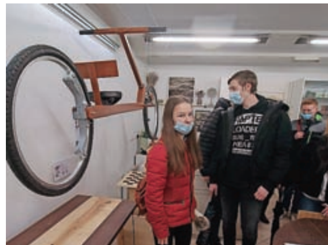
V Rokodelskem centru DUO Škofja Loka so novo sezono rokodelskih razstav začeli z razstavo izdelkov dijakov Srednje šole za lesarstvo Šolskega centra Škofja Loka.