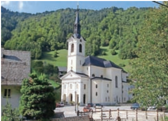
Župnijska cerkev sv. Antona