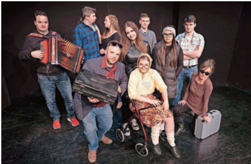
Konec januarja so premierno uprizorili predstavo Kmetija Terapija.