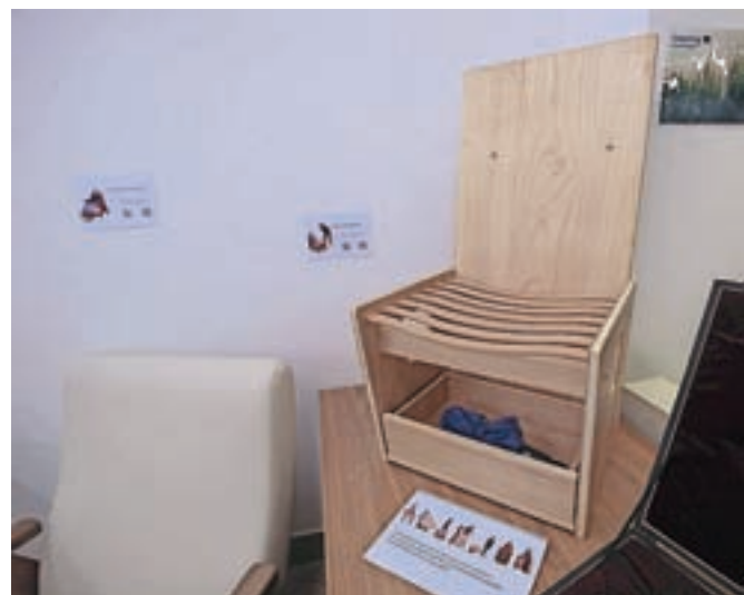
Dijaki so dokazali, da je uporaben vsak les, tudi les tujerodnih invazivnih in prezrtih domačih drevesnih vrst.