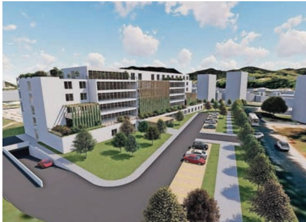
Nov, sodoben dom za starejše, ki bo lahko sprejel 156 oskrbovancev, bo koncesionar zgradil na severozahodnem delu nekdanje vojašnice v Škofji Loki.

Novi dom za starejše, ki bo lahko sprejel 156 oskrbovancev, bo koncesionar zgradil na severozahodnem delu nekdanje vojašnice v Škofji Loki. Kot pojasnjuje odgovorni, bo gradbeno dovoljenje predvidoma pridobljeno že to pomlad, gradnja doma pa naj bi se začela kmalu zatem. Dela bodo predvidoma dokončali v naslednjem letu. "Občina Škofja Loka pozdravlja nove sodobne domske kapacitete in se jih veseli, saj so potrebe po domski oskrbi za starejše tako v lokalnem okolju kot tudi na območju širše Gorenjske precej večje, kot je na voljo razpoložljivih kapacitet. Zasebni dom za starejše bo predstavljal dobrodošlo dopolnitev ponudbe obstoječega javnega doma za starejše ter mreže drugih