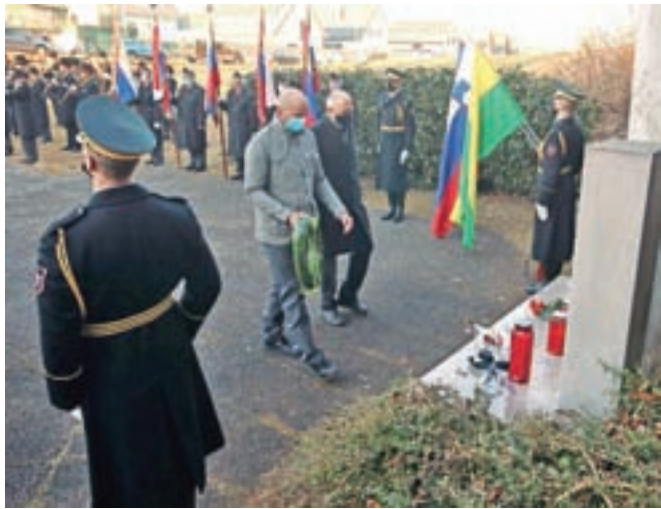
Pri spomeniku za Kamnitnikom so se spomnili ustreljenih talcev.