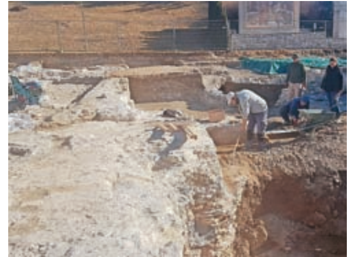
Ob zadnjih izkopavanjih so odkrili lepo vidne ostanke gotske cerkve.