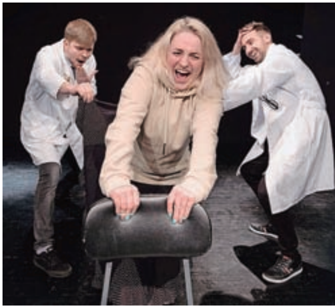
Zdaj razveseljujejo že z novo predstavo, Limonavirusom.