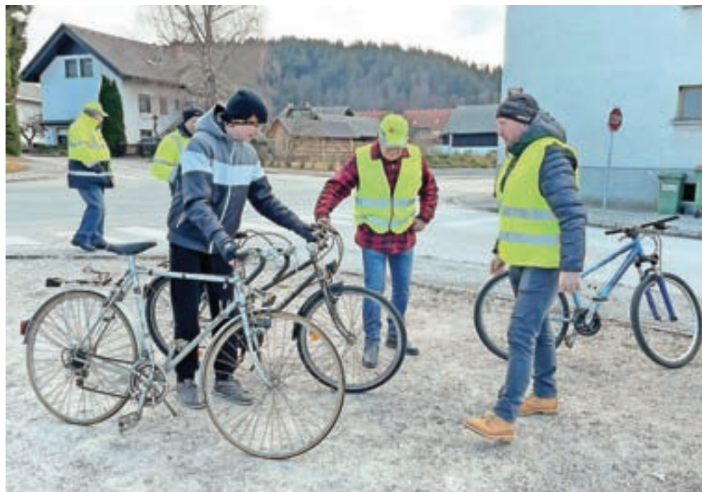
Akcijo Kolesa za vse! so sredi februarja pripravili tudi v AMD Žiri.