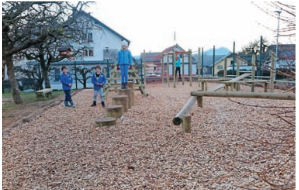
Nova zunanja telovadnica ob podružnični osnovni šoli v Retečah že navdušuje mlade.

Do sedaj zaključeni projekti so nova otroška igrala na Godešiču, celostna urbana ureditev krajevnih skupnosti