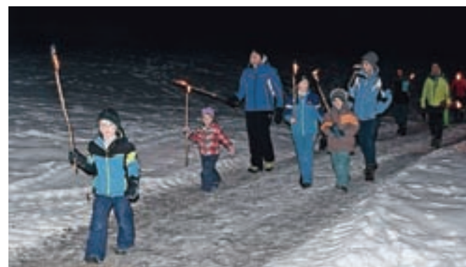
Pohod z baklami je še posebno zanimiv za otroke.