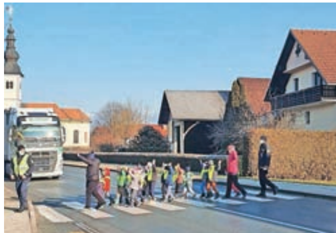
Varno čez cesto

Škofja Loka – Pred kratkim je Svet za preventivo in vzgojo v cestnem prometu Občine Škofja Loka Vrtcu Škofja Loka predal petsto odsevnih rutic z logotipom vrtca. Otroci so si navdušeno nadeli rutice in z obiskovalci klepetali o projektih Pasavček in Trajnostna mobilnost. Akciji so se pridružili tudi policisti Policijske postaje Škofja Loka, ki so otroke pospremili čez cesto in jih opozorili na varno prečkanje cestišča na zebri. Kot so povedali, vzgojiteljice in vzgojitelji vrtčevskih otrok pomemben delež izobraževalnega programa namenjajo prometni varnosti. Otroci spoznavajo prometne znake, pravila obnašanja v cestnem prometu, pomembnost pripetosti z varnostnim pasom na vseh poteh ter uporabo čelade. Prav tako veliko pozornosti posvečajo trajnostni mobilnosti, pri čemer so otroci kot pešci, kolesarji ali skiroisti še bolj izpostavljeni. Zato je zelo pomena dobra vidljivost otrok.