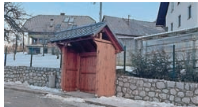
Avtobusna hiška Lučine

sta iz naravnega materiala – lesa, pokriti pa s 'špičakom', to je staro avtohtono kritino z modernim pridihom." Ob tem so še dodali, da sta hiški v obliki čebelnjaka, ki je poleg kozolca slovenska arhitekturna posebnost. "S tem prispevata k boljši prepoznavnosti naše občine in lepe Poljanske doline ter sovpadata z drugimi avtobusnimi hiškami po občini."