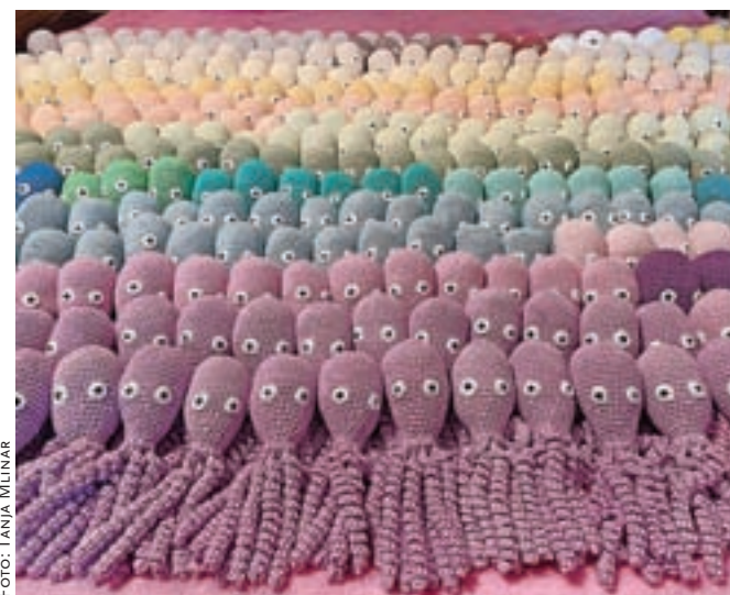
Lani je izdelala že 380 hobotnic za nedonošenčke.

gaj, zato se je znašla tako, da je na samostojni razstavi gobelinov, ki jo je pripravila v galeriji DPD Svoboda v Žireh, zbirala prostovoljne prispevke. "Nabralo se je dovolj, da sem imela za vse leto za material za hobotnice," je poudarila. V Odeji Škofja Loka pa se je dogovorila, da so ji brezplačno zagotovili polnilo za hobotnice. "Napolnili so tako veliko vrečo, da sem jo komaj stlačila v prtljajnik avtomobila," se posmeje. Leta 2019 je tako nastalo 214 hobotnic, še bolj ambiciozen cilj pa si je zadala v letu 2020. "Ker je bilo prestopno leto, sem se odločila, da jih nakvačkam 366, za vsak dan eno. Delala sem vse dneve, k čemur je pripomogla tudi korona, zaradi katere tako ali tako nisem mogla nikamor." Kvačkanje hobotnic je nadaljevala tudi lani, čeprav se je morala ob tem spopasti tudi z boleznijo. Ugotovili so namreč, da ima raka na grlu, kar je s seboj prineslo kemoterapije in obsevanja. Kljub temu je lani oddala kar 380 hobotnic za male junake v inkubatorjih.