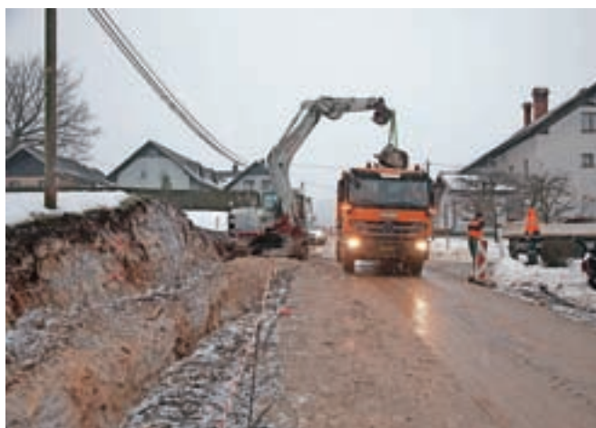
Nadaljuje se obnova ceste od Dolgih Njiv proti Suhemu Dolu.