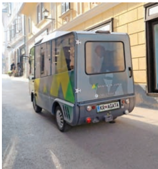
Električna minibus vozita po opravkih v mestu in okolici.