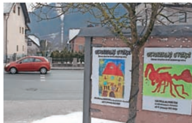
Oglasne deske po Železnikih ta čas krasijo plakati z otroškimi likovnimi deli.

pojasnila Čufarjeva. Pri izboru je bila pozorna, da bodo predstavljeni različni motivi: osebe, živali, rože, hiše, vozila, narodne noše, drevesa ... "Posebej sem želela, da bi si čim več ljudi ogledalo nagrajeno likovno delo še ne štiri-letne deklice Družina v sončku. Na natečaju 15. Cici umetnij je bilo izbrano za razstavo in objavljeno v katalogu razstave, kamor so uvrstili le petdeset najboljših izmed dva tisoč prispelih del. Ta risba je na ogledni deski pred pošto – na strani avtobusne postaje, kjer se vozi mimo res veliko ljudi," je razložila. Vesela je, da je razstava plakatov deležna številnih pozitivnih odzivov: da gre za odlično idejo, domiselno razstavo, da so otroške umetnine krasne, da polepšajo ogledne deske ter poživijo opazo-