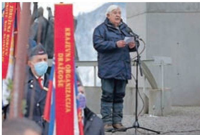
Slavnostni govornik prvi predsednik Republike Slovenije Milan Kučan

varnega oživljanja fašizma, katerega podobe sicer niso enake tistim v polpretekli zgodovini, vendar imajo enaka izhodišča, od napadov na ustanove države do prostaškega govora in zlorabe zgodovinskega govora in zlorabe zgodovinskega govora. Temu se je treba upreti, je dejal Kučan in očital oblasti. Zaradi nje, ki v primeru epidemije ne išče zaveznitva z državljanji, ampak jih krivi za neuspešen boj, smo Slovenci raztreščeni kot nikoli doslej. Rekel je, da ne potrebujemo samohvale, ampak realno oceno razmer in cene, ki jo bomo v okrepanju po epidemiji plačevali. Govor je sklenil s povabilom na bližnje volitve in na cepljenje proti covidu-19.