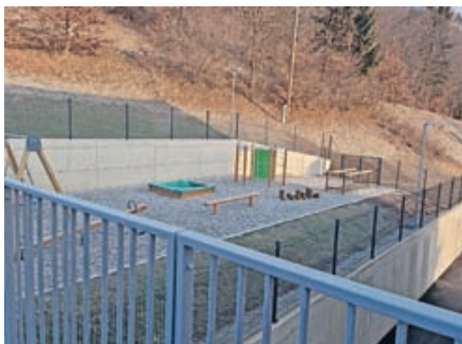
Nova pridobitev je tudi dodatno zunanje igrišče.

Gradnja vrtca je predstavljala največjo investicijo občine v vrtčevske prostore v zadnjih dvajsetih letih. Skupna vrednost projekta je znašala dobrih 2,5 milijona evrov, pri čemer so na razpisu ministrstva za izobraževanje, znanost in šport pridobili skoraj 761 tisoč evrov nepovratnih sredstev, še 280 tisoč evrov pa je prispeval Ekosklad za gradnjo nizkoenergijskega objekta.