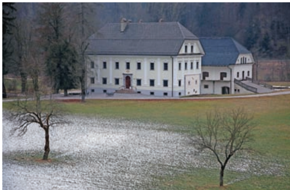
Prihodnji mesec se bo začela obnova še gospodarskega poslopja na Visokem.

Po županovih besedah bodo na gospodarskem poslopiju obnovili streho in fasade s kamnitimi oboki, leseni balkon, celotno leseno stavbno pohištvo, kovane mreže na oknih in obokano kletno dvorano. Še ta mesec bo potekala uvedba v delo, delati pa naj bi začeli februarja. "S prenovno želi občina na dolgi rok