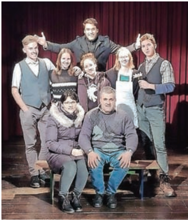
Igralci Krekovega kulturnega društva upajo, da se bodo z igro Tri sestre lahko kmalu vrnili na oder.