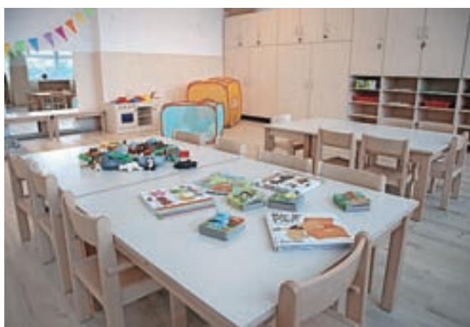
Sodobno opremljena igralnica na 65 kvadratnih metrih omogoča zelo dobre pogoje za varstvo otrok.

Za potrebe novega vrtca so v pritličju dražgoške šole uredili dobrih sto kvadratnih metrov površin, od tega 65 kvadratnih metrov za igralnico, ostalo pa so namenili sanitarijam, garderobi in kabinetu za osebje. Investicija je