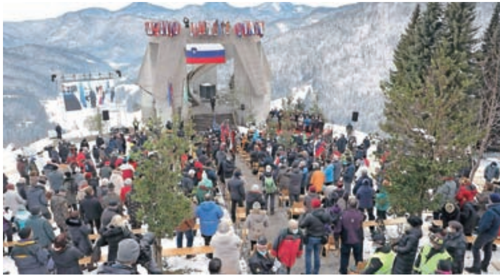
Pred spomenikom in v njegovi okolici se je zbralo blizu 1500 ljudi.

Na letošnji svečanosti je bila zaradi ukrepov za preprečevanje širjenja virusa udeležba manjša kot običajno, vendar je kljub temu prišlo v vas okrog 1500 ljudi. Med njimi sta bila tudi predsednik Republike Slovenije