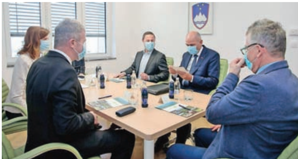
Predsednik vlade Janez Janša in državni sekretar za nacionalno varnost Žan Mahnič ob obisku na Občini Gorenja vas - Poljane

"V Poljanski dolini smo kleni, marljivi, delovni, zanesljivi ljudje, ki vemo, da se živi od dobrega dela in da se demokracija začne z obveznostmi in dolžnostmi," je še poudaril župan in se vladi zahvalil za prispevek, ki so ga vse občine v Sloveniji prejele v obliki povprečnega. Plod odličnega sodelovanja vlade in slovenskih občin so številne nove občinske investicije po vsej državi, so ob tem poudarili v občini Gorenja vas - Poljane in dodali, da so tudi v njihovi občini vse glavne investicije podprte z nepovratnimi evropskimi in državnimi sredstvi. Za gradnjo vodovodov so pridobili 1,5 milijona evrov, za Hišo generacij 1,4 milijona evrov, za Vrtec Agata sedemsto tisoč evrov in za