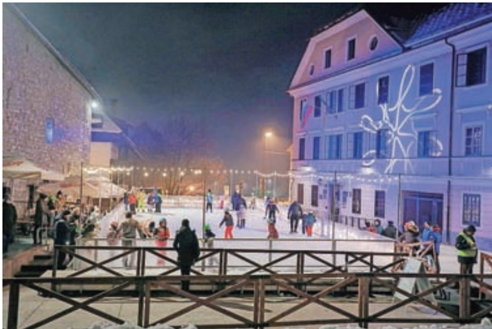
Prejšnji teden je na Trgu pod gradom zaživelo Mestno drsališče, ki bo v prazničnih in počitniških dneh zagotovo še posebno dobro obiskano.

Izložbe domišljije, prodajne razstave umetnikov in rokodelcev, za obiskovalce ponujajo nepozabno praznično izkušnjo. "V skupni akciji, v kateri želimo v prazničnem času obiskovalcem starega mestnega jedra ponuditi umetniška dela in kakovostne izdelke rokodelcev, se povezuje dvanajst organizacij. Svoje prostore namenjamo prodajnim razstavam del umetnikov, rokodelcev, fotografov, oblikovalcev in drugih ustvarjalcev ter jih spreminjamo v praznične trgovine, v katerih si obiskovalci lahko izberejo unikatna darila," pravijo organizatorji in vabijo v Rokodelski center DUO Škofja Loka (Razvojna agencija Sora), Galerijo Ivana Groharja (Loški muzej Škofja Loka), Sokolski dom Škofja Loka (Zavod 973), Knjižnico Ivana Tavčarja Škofja Loka, Atelje Amuse, Sodobni tekstilni center Kreativnice, Trgovino Paleta, Trgovino in galerijo