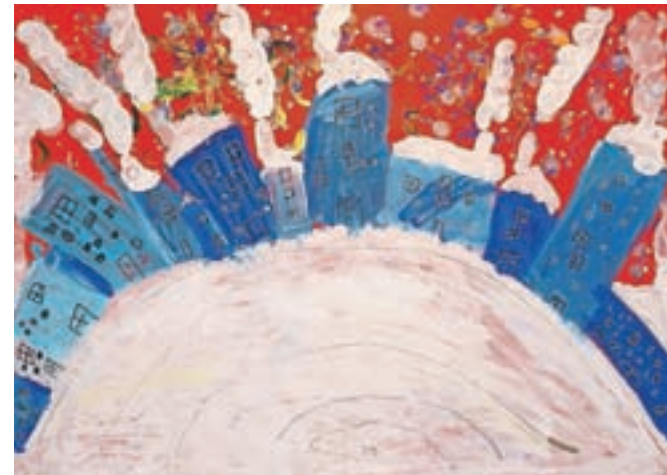
Zimski večer, eno od otroških likovnih del, ki bodo krasila ogledne deske v Železnikih.