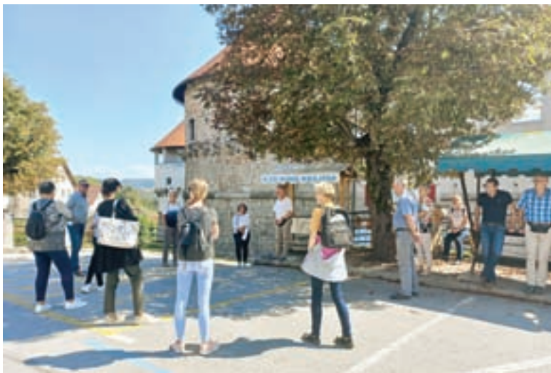
Strokovna ekskurzija LAS v septembru

Vse aktualne novice lahko spremljate na spletni strani LAS loškega pogorja ( www.las-pogorje.si ) ali pa informacije dobite v pisarni LAS loškega pogorja na Razvojni agenciji Sora, d. o. o., Poljanska cesta 2, Škofja Loka.