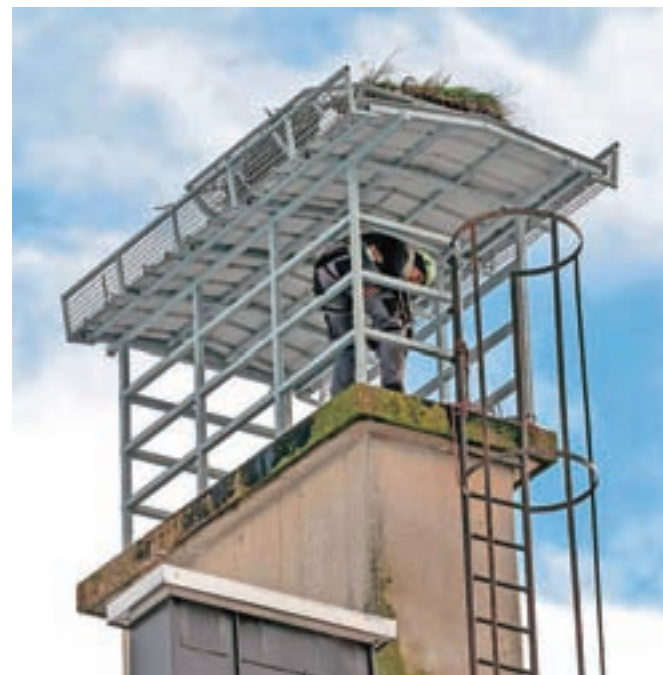
Medtem ko so štorklje v toplih krajih, so jim v Frankovem naselju posodobili dom.

Kot pravijo odgovorni, bo domača občina v prihodnje poskrbela tudi za letno čiščenje žlebov, strehe stavbe in bližnje kotlovnice ter s tem zagotovila, da žlebovi ne bodo polni vej in hrane, ki jo štorklje prinašajo s seboj.