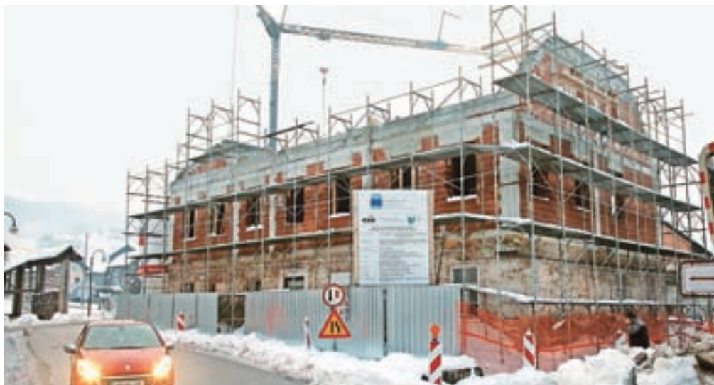
V Gorenji vas nastaja Hiša generacij.

Gorenja vas – V Gorenji vasi se je poleti začela 1,7 milijona evrov vredna obnova prostorov nekdanje šole, v kateri bodo po obnovi zagotovili šest mest za dnevno varstvo starejših in šestnajst začasnih namestitev za starejše. Po besedah Bernarda Strela iz občinske uprave so že končali rušitvena dela, v okviru katerih so odstranili prizidek garaže ter porušili streho in stopnišče vse do nivoja sten pritličja. Ta čas je v izdelavi jeklena konstrukcija za tehnično medetažo. Opravili so tudi injektiranje kamnitih zidov pritličja, odkop kletnih zidov, podbetoniranje temeljev, hidroizolacijo in toplotno izolacijo vkopanih zidov ter drenažo in zasip tako saniranih kletnih zidov. Zgradili so tudi že nov prizidek stopnišča,