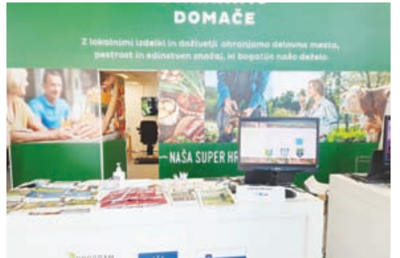
Sodelovanje na sejmju Agra 2021

Kot že rečeno, smo v iztekajočem letu poleg rednega dela izpeljali ali pa se udeležili zanimivih dogodkov, aktivnosti. Tudi v letu, ki se zaključuje, smo za člane LAS in druge lokalne deležnike organizirali tradicionalno vsakoletno strokovno ekskurzijo . Namen takih ekskurzij je, da se udeležencem pokažejo primeri dobrih praks črpanja sredstev LEADER/CLLD tudi drugje po Sloveniji ali tujini. S tem lahko najdemo nove in sveže ideje za projekte na našem območju. V letošnjem letu smo se odpravili na območje Suhe krajine, Temenice in Krke, na območje Lokalne akcijske skupine STIK. V Trebnjem smo si ogledali Galerijo likovnih samora-