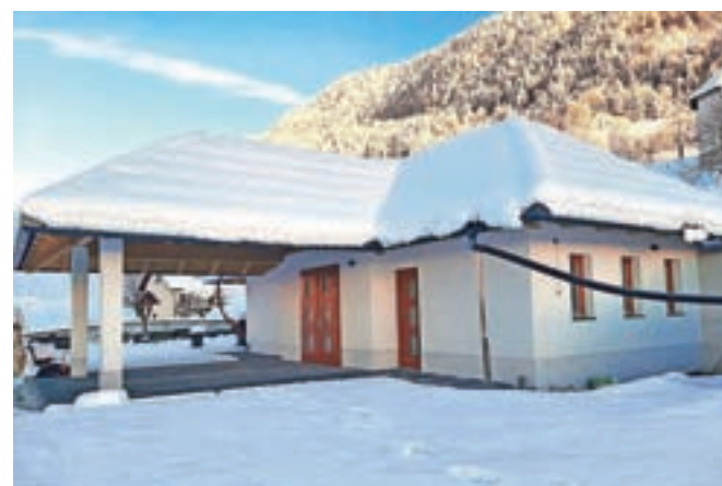
Poslovljeni objekt v Dražgošah bodo namenu predali prihodnje leto.