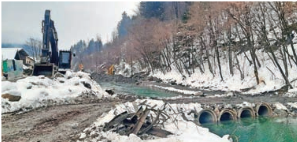
Dela so se začela na območju Alplesovega jezua.

Železniki – V Železnikih na zmanjšanje poplavne ogroženosti čakajo že vse od hudih poplav v letu 2007. Po dolgotrajnih postopkih, ki so jih spremljali tudi različni zapleti, so se dela konec novembra začela tudi na terenu, in sicer na območju Alplesovega jezua. "Poleg prvega odseka od Alplesa do Domela bodo izvajalci po novem letu začeli urejati še nadaljnji odsek do Dermotovega jezua in območje okoli Dolenčevega jezua, prav tako bodo začeli izvedbo ureditev na vodotoku Češnjica. Glede na vremenske razmere do novega leta ver-