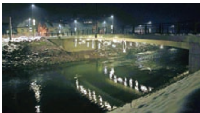
Element ribe se v okrasitvi pojavlja kot simbol plodnosti in obilja.

vesti Cvetje v jeseni in jo povezujemo z ljubeznijo, Tavčar pa jo je kot simbol vključil v svojo zgodbo tudi zaradi njenih zdravilnih moči – blaženja in umirjanja srčnih boleznih," je razložila Jana Oblak in dodala, da je posebnost tega cveta, da zacveti ob neobičajnem jesenskem času in krasí naravo v prvem hladu. "Tako naj ta za zimsko okrasitev neobičajen element cveta krasí naše kraje tudi skozi hladne dni prazničnega dela leta."