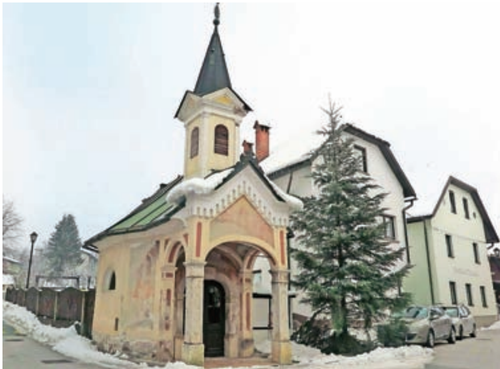
V Stari Loki obnavljajo Marijino kapelico.

Seveda zob časa kapelici ni prizanesel. Tako so podobe postale neprepoznave, razpoke pa globoke. Kapelica je potrebna temeljite obnove, ki se je začela oktobra, zaključek pa je predviden do leta 2024, ob 200-letnici kapelice. Za izvajalca je bilo izbrano podjetje Triptih – Restavratorski atelje Bogovčič, ki bo saniralo cokel, obnovilo tlak ter restavriralo zunanje in notranje poslikave (freske), kamen, štukature, okna in vrata vse do lesenega oltarja