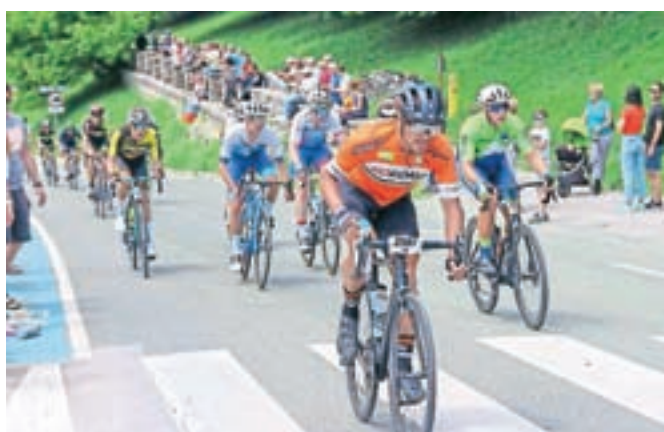
Navijači so pozdravili tudi udeležence Maratona Franja, med katerimi so bili številni Ločani.