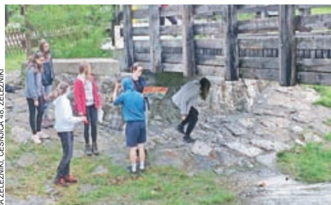
Računanje pretoka Dašnice