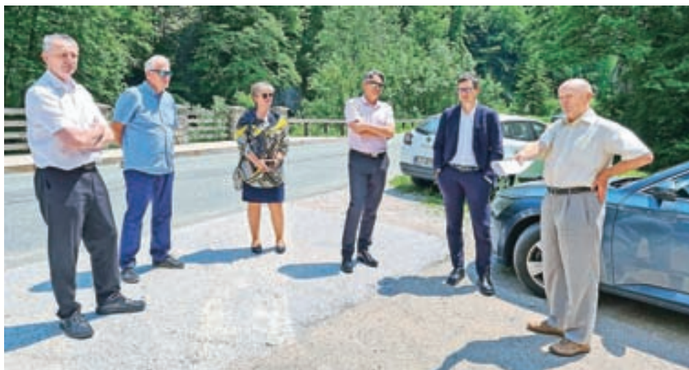
Podpisu pogodbe je sledil še terenski ogled lokacije prihodnjega zadrževalnika pod Sušo.