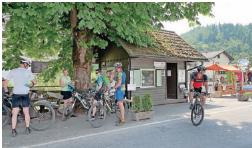
Kartončke, v katerih kolesarji zbirajo žige Žirovskega kolesarskega kroga, je letos prevzelo že več kot sto kolesarjev.