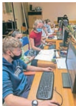
Učenci so pri sodelovanju na virtualni izmenjavi pokazali veliko prilagodljivosti in odgovornosti.