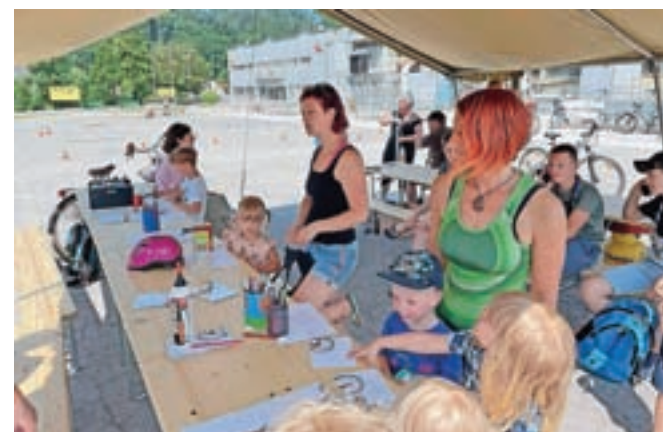
Pestro dogajanje so pripravili tudi za najmlajše, ki so se med drugim lahko preskusili na kolesarskem poligonu ali ustvarjali na delavnicah.