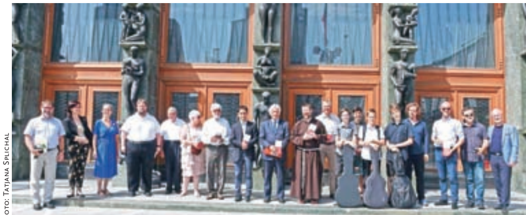
S sprejema delegacije, v kateri so bili predstavniki združenja Europassion, Občine Železniki, slovenskih pasijoncev in Glasbene šole Škofja Loka, v Državnem zboru

Hkrati s Čipkarskimi dnevi je potekal mednarodni projekt Prostovoljstvo ohranja evropsko dediščino živo: Mladi za evropska mesta – mesta za mlade, katerega nosilka je bila Občina Železniki. Projekt je bil namenjen udeleževanju mladih pri ohranjanju kulturne dediščine, vanj pa so vključili še dve