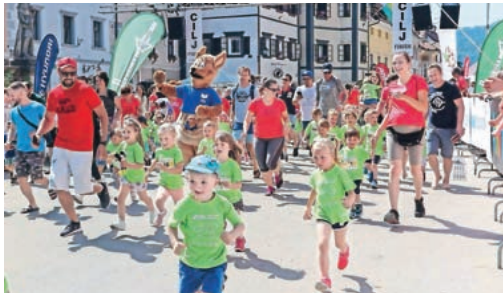
Dopoldan so v družbi staršev in vzgojiteljic tekli predšolski otroci.

Tek štirih mostov se je sicer začel dopoldan s teki predšolskih otrok, nadaljeval pa popoldan s šolskimi teki. Le-tošnja novost je bila tudi ta, da so udeleženci lahko čez dan označeno pet kilometrov dolgo progo pretekli ali prehodili – netekmovalno. Organizatorji iz Društva T4M in Športne zveze Škofja Loka so bili po koncu prireditve zadovoljni. "Zelo smo zadovoljni, da nam je uspelo pripraviti skoraj tak dogodek, kot smo ga vajeni. Žal nam je sicer za zaplet, ko je nekaj vodilnih tekačev zavilo z označene proge, za-