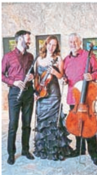
Trio Lontrg