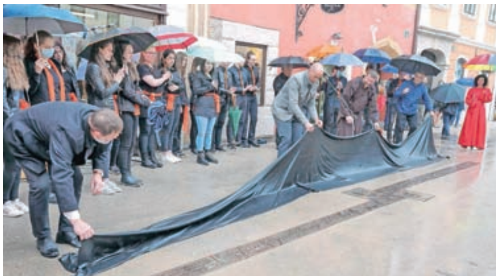
Ob odkritju pasijonskega znamenja na Mestnem trgu