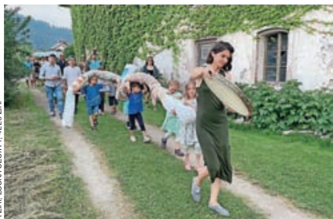
V programu so nastopili tudi otroci iz vrta in šole Žiri.