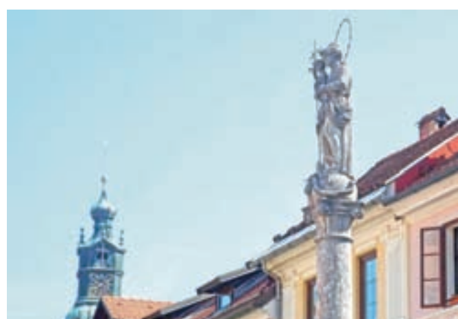
Obnovljeno bo tudi Marijino znamenje na Mestnem trgu.

Kot še navajajo, je obnova kulturne dediščine v kontekstu Strategije razvoja Občine Škofja Loka 2025+ – Zelena Loka, modro mesto.