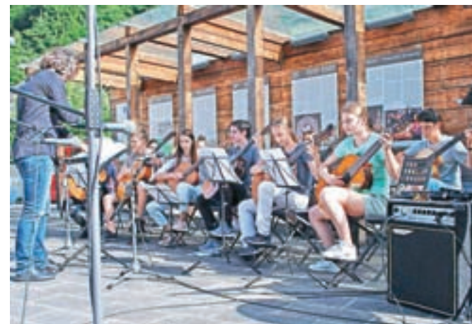
Nastopil je tudi Kitariski orkester Glasbene šole Škofja Loka.