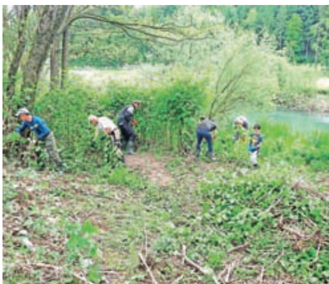
Člani Ribiške družine Visoko so konec maja izvedli prvo prostovoljno akcijo čiščenja in odstranjevanja dresnika ob reki Sori.