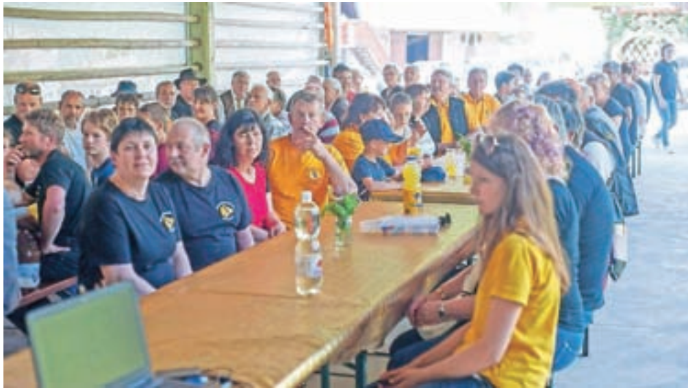
Člani Čebelarskega društva Blegoš so prvo soboto v juniju zaznamovali 110-letnico delovanja.