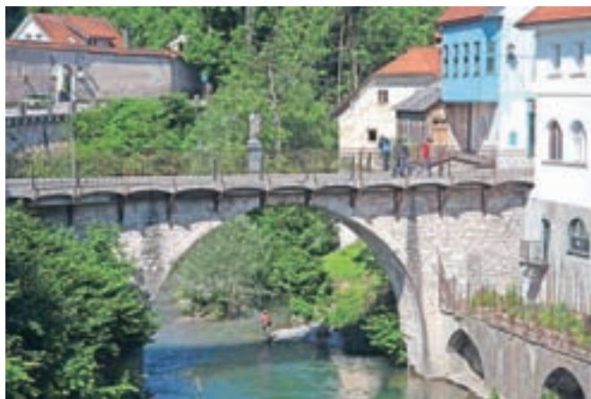
Z državnim sofinanciranjem bodo v Škofji Loki obnavljali Kamniti most.

so nečistoče in obloge, madeži, rja in siga, ki zmanjšujejo estetsko vrednost spomenika. Opazne so plesni, alge in lišaji. Kovinska ograja je deformirana in neustrezno pritrjena v tla. Stiki med posameznimi sklopi s razmajani, nestabilni ali neustrezno sanirani. Vidne so tudi renovacije v preteklosti, ki ne ustrezajo sodobnim kriterijem stroke. S projektom bomo zagotovili ustrezno izvedbo del, ki bo ohranila avtentičnost materialov, odpravila poškodbe, zaščitila spomenik pred nadaljnjim propadanjem in povrnila estetske vrednote spomenika. S tem pa privlačne za obiskovalce in stanovalce na Mestnem trgu," pojasnjujejo na Občini Škofja Loka.