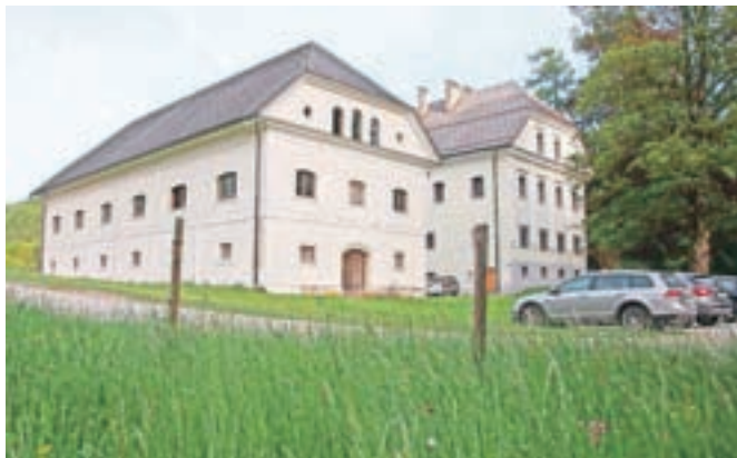
Konec leta naj bi začeli obnavljati tudi gospodarsko poslopje ob Dvorcu Visoko.

sade s kamnitimi oboki, leseni balkon, celotno leseno stavbno pohištvo, kovane mreže na oknih in arkadne kletne dvorane. Dela naj bi začeli izvajati konec leta, ta čas pa Restavratorski center