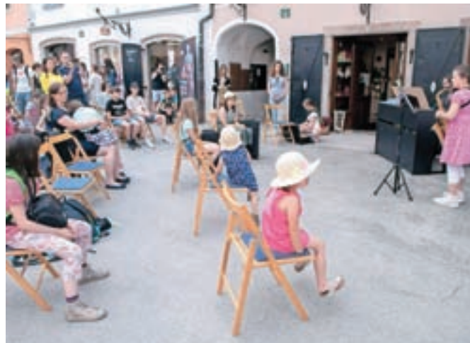
O'glasbena Loka je z glasbo zapolnila vse koticke starega mestnega jedra.

Letošnje šolsko leto je sicer tudi v glasbenih šolah zaznamoval pouk na daljavo. Tudi zato je bil poseben izživ znova stopiti na oder pred večjo publiko, je priznal pomočnik ravnatelja GŠ Škofja Loka Luka Železnik. Kljub temu so učenci nastope izpeljali na visoki