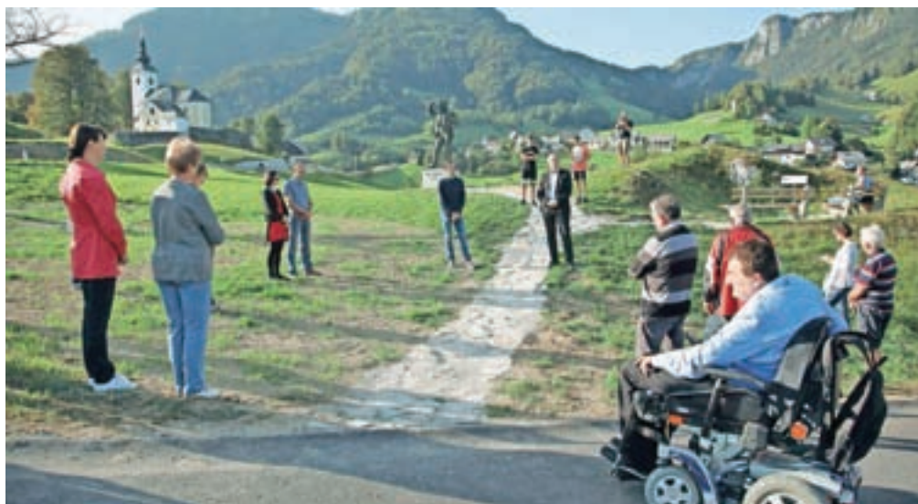
Z odprtja obnovljene okolice Groharjevega spomenika, kjer so obnovili in uredili klopi, tlakovano pot ter sanirali teren in zatravili okolico.