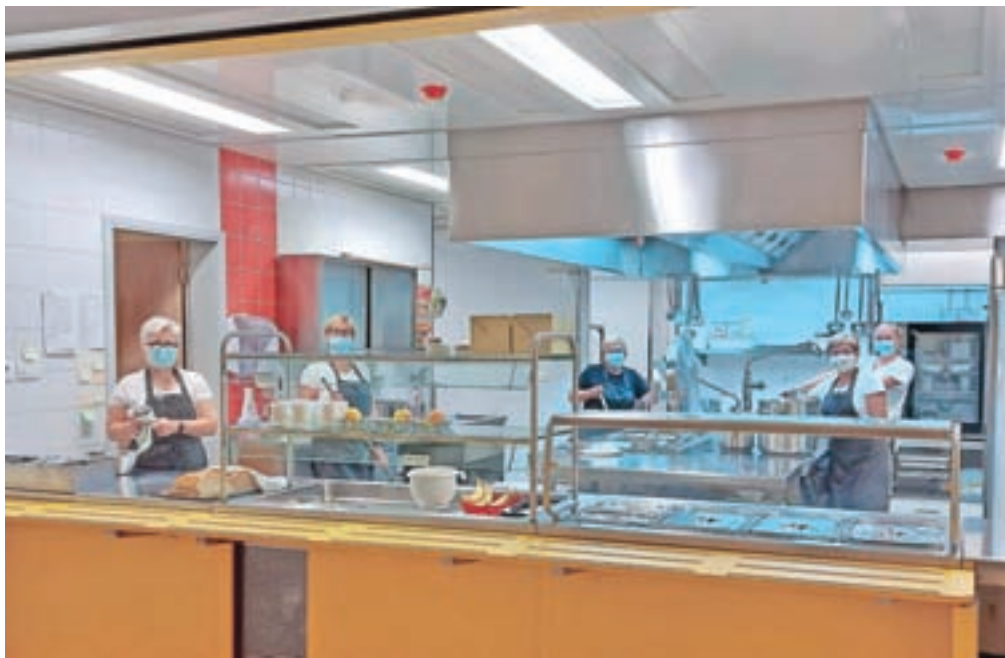
V Poljanah so končali celovito prenavo šolske kuhinje.

Sredi septembra so tako v novi kuhinji že začeli pripravljati kosila in druge obroke za vrtec ter kosila za šolske otroke. "Obnova je za otroke v šoli in vrtcu velika pridobitev, saj bo kuhinja omogočala hitrejšo pripravo še večjega števila obrokov, na novo bo omogočena tudi priprava dietnih obrokov, ki jih potrebuje čedalje več otrok tako v vrtcu kot v osnovni šoli, kjer se iz leta v