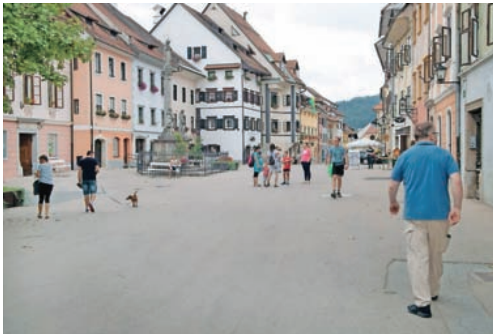
Dnevi evropske kulturne dediščine so tudi priložnost za spoznavanje bogate stavbne dediščine Škofje Loke.