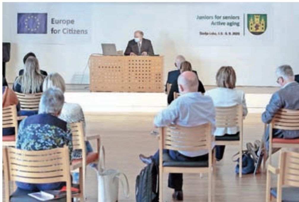
Mednarodna konferenca je v Škofji Loki potekala v živo...