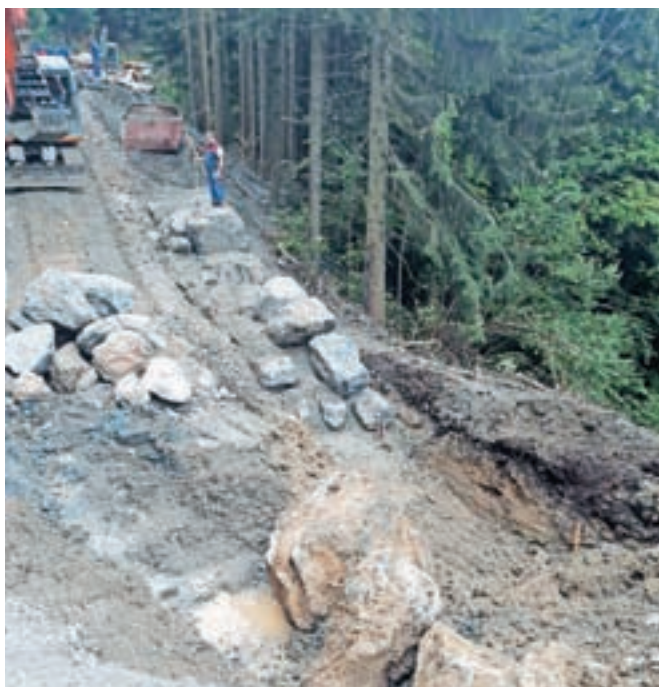
Na odseku Murave–Gorenja Žetina poteka druga faza obnove ceste.

Gorenja Žetina – Na odseku Murave–Gorenja Žetina poteka druga faza obnove ceste. Sanirali bodo pet cestnih usadov in tri zemeljske plazove. Pogodbena vrednost del znaša slabih 770 tisoč evrov, pri čemer je občina za izvedbo sanacije pridobila tudi nepovratna sredstva ministrstva za okolje in prostor v višini 619 tisoč evrov, so pojasnili na občini. Sanacija se je zaradi izvedbe obvoznov najprej začela na zgornjem odseku Gorenja Žetina–odcep Dolenja Žetina, so razložili na občini in dodali, da je končana sanacija prvega plazov pri Gorenji Žetini, kjer so dogradili 25-metrski oporni zid, v teku pa je sanacija drugega plazov z 90-metr-