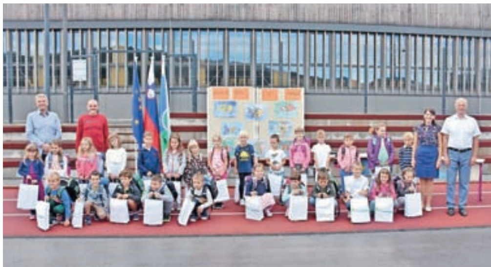
Sprejem prvošolcev v Gorenji vasi

seboj, na koncu pa so jim razdelili še ovojnice, v katerih jih je čakala skrivnost. Slovesno je bilo tudi v podružnični šoli v Javorjah, kjer so prvošolci prav tako najprej spoznali učilnico, ki si jo bodo delili z učenci tretjega razreda, nato so prisluhnili pravljici z naslovom Gusarji ne hodijo v šolo. Izdelali so tudi osebne zastavice, s katerimi so se predstavili sošolcem.