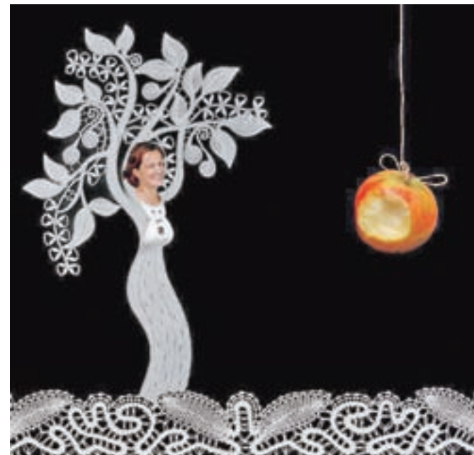
Prva fotografija, ki jo je Aleksander Čufar ustvaril v seriji Čipkopisov: Eva v raju

K prepletanju čipk in fotografij za Čipkopise je Čufarja dodatno spodbudila še Alenka Vrhovnik, učiteljica klekljanja iz Naklega, ki je ga prosila, naj fotografira bene-