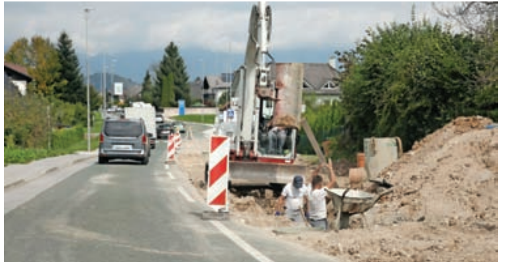
Gradbena dela na območju naselja Sv. Duh

Škofja Loka – Nekaj časa že potekajo gradbena dela na območju naselja Sv. Duh, kjer dopolnjujejo in posodablajo javno komunalno infrastrukturo. V delu naselja namreč nekateri objekti še vedno niso priključeni na javno kanalizacijo. Zato bodo tu zgradili novo z navezavo na obstoječe kanalizacijsko omrežje. Sočasno z gradnjo javne kanalizacije bodo obnovili tudi obstoječe vodovodno omrežje. Predvidena je obnova vodovoda vzdolž poteka gradnje kanalizacije z navezavo na obstoječi primarni vodovod. Fekalno kanalizacijo gradnjo v dolžini 790 metrov, nov meteorni kanal obsega 118 metrov, vodovod pa bo obnovljen v skupni dolžini 301 meter. Investicijo v celoti financira Občina Škofja Loka, vrednost skupaj z DDV znaša okoli 313 tisoč evrov, izvajalec gradnje je družba Euro Grad. Te dni potekajo tudi gradbena dela na Kopalški ulici,