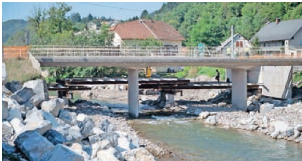
Čez približno leto dni bodo v Poljanah bolje zaščiteni pred poplavami.

Poljane – K projektu zagotavljanja večje poplavne varnosti so v Občini Gorenja vas - Poljane pristopili po hudih poplavah oktobra 2014. V štirih letih in pol so projekt pripeljali do izdaje gradbenega dovoljenja, pred enim letom je bila podpisana gradbena pogodba, dela pa so stekla novembra lani. Ta čas so približno na polovici izvedenih del, saj zaključek gradnje načrtujejo oktobra prihodnje leto, je pojasnil župan Milan Čadež. Ob tem je minister Andrej Vizjak ta projekt označil za primer dobre prakse, kako v tesnem sodelovanju z lokalno skupnostjo učinkovito izvesti protipoplavno ureditev. Naložba v povečanje poplavne varnosti na območju Poljan bo vredna slabe tri milijone evrov, od tega bo 2,2 milijona evrov prispevala republiška direkcija za vode, je pojasnil Čadež. Ob tem je minister Vizjak poudaril, da je najtežji del pri projektu, to je pridobivanje vseh potrebnih dovoljenj in soglasij lastnikov zemljišč, izpeljala občina. Verjame, da prav za