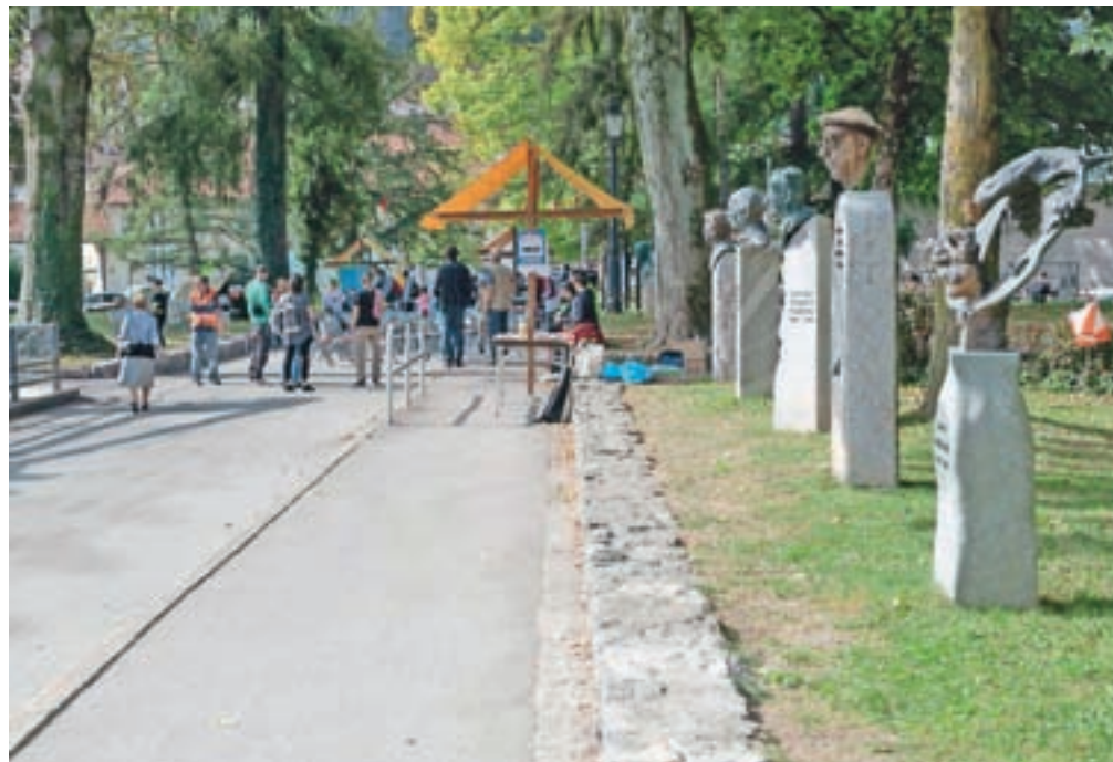
Del Šolske ulice je tudi Aleja zaslužnih Ločanov.

Šest sobot Odprte ulice se je izteklo, zadnja zaradi slabega vremena brez družabnega dogajanja. Žal je ostal brez dogajanja tudi 22. september, dan brez avtomobi-