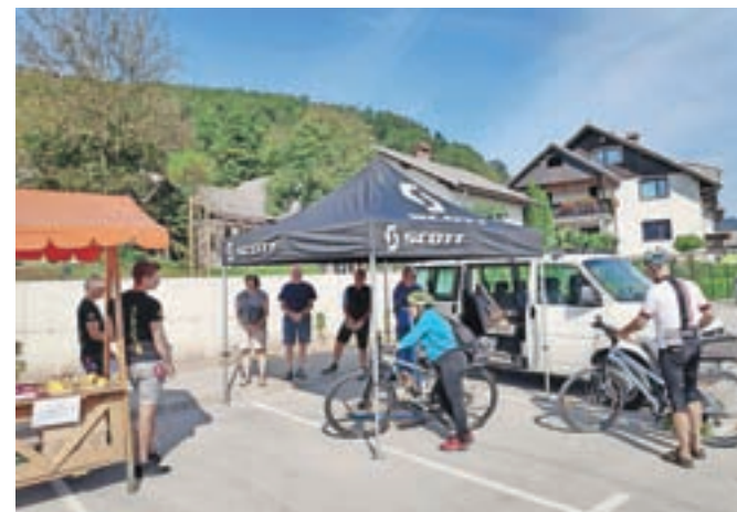
Udeleženci so lahko prisluhnili predavanju na temo varne vožnje in vzdrževanja koles.

Vsi udeleženci so na koncu prejeli mini zavojček prve pomoči in kolesarski zvonček za čim varnejšo udeležbo v prometu, je še pojasnil Rems.