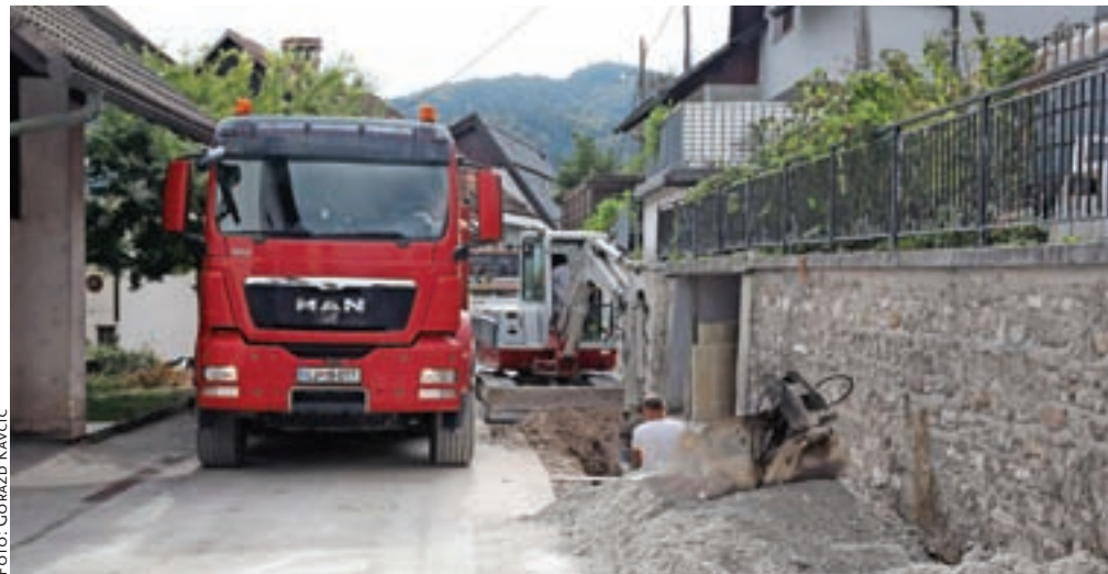
Vse do januarja prihodnje leto bodo obnavljali komunalno infrastrukturo na Kopalški ulici.

tangirane ceste. Pred predvideno zaporo ceste bodo stanovalci obveščeni o predvidenem trajanju (z obvestilom v nabiralnikih ter z obvestilom na spletni strani občine). Zaradi narave dela bo vzpostavljena fazna popolna zapora ceste, ki se bo izvajala po krajših fazah, tako da bo dostop do objektov kar najmanj moten. Po gradnji vodovoda je na tem območju predvidena tudi ureditev zgornjega ustroja ceste, javne razsvetljave in gradnja pripadajoče meteorne kanalizacije za odvodnjavanje cestnih površin. Tudi za to naložbo je bil izbran izvajalec gradnje Euro grad. Ureditev novega vodovoda je predvidena v skupni dolžini 453 metrov.