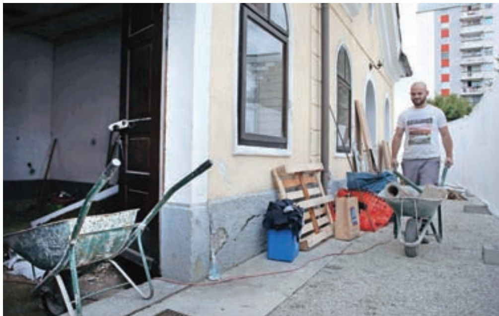
Na mestnem pokopališču bodo v treh mesecih obnovili mrliške vežice.

vih pip odvzem vode na pokopališču ne bo mogoč. Projekte za vzdrževalna dela so pripravili v ateljeju Arrea iz Ljubljane, dela na objektu bo opravilo podjetje Akvaing iz Ljubljane. Vzdrževalna dela na pokopališču bodo v celoti pokrita s sredstvi poračuna občine, pogodbeno vrednost brez DDV znaša okoli 190 tisoč evrov.