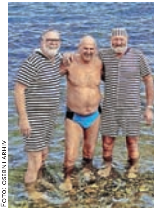
Rovtarji so veseljaki.