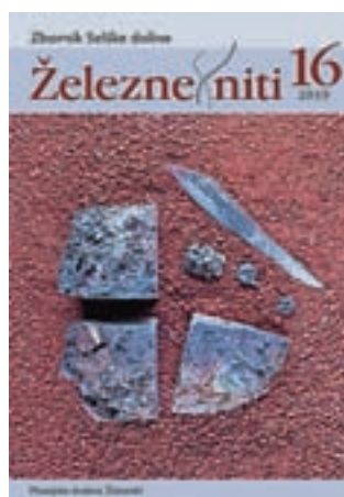
Naslovnica prikazuje "volka" in skovan nož.