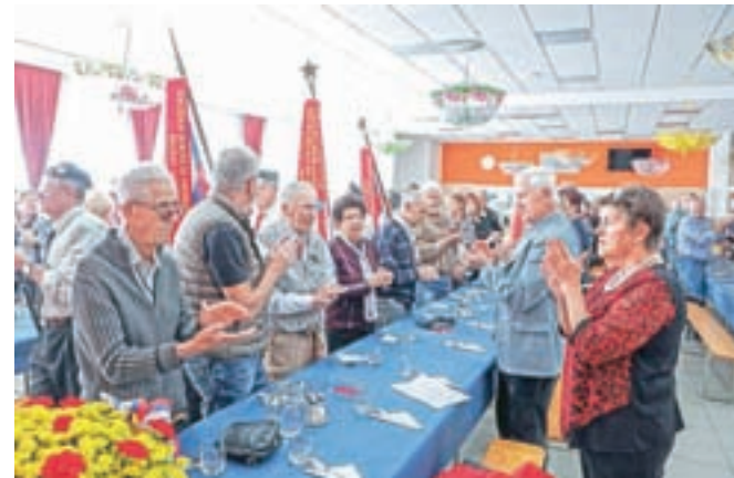
Občinsko združenje borcev za vrednote NOB Žiri je konec oktobra pripravilo slovesnost v spomin na osvoboditev Žirov 23. oktobra 1943.

zval, naj hranijo dokumente iz partizanskega obdobja. Po njegovih besedah gre za ključno dejanje v slovenski nacionalni zgodovini, zato verjame, da bodo dokumenti iz tega obdobja našli svoje mesto tudi v Muzeju Žiri. Kot je prepričan Žakelj, danes znova živimo v usodnem času. "Prihodnost je popolnoma negotova in moj pogled na prihodnost je žalosten," je priznal in opozoril na do konca degradirano in izčrpano Zemljo, posledica našega neodgovornega ravnanja z okoljem pa so klimatske spremembe. "Zato smo dolžni storiti vse, da se ne samo degradacija okolja, ampak tudi socialna degradacija konča in zanamcem omogočimo dostojno življenje. Zato je znova čas za osvobodilno fronto, ki se bo tokrat borila za ohranitev Zemlje."