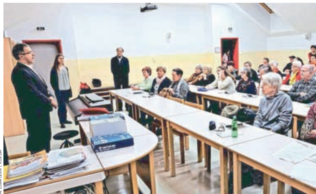
Na uvodnem srečanju se je zbralo okrog petdeset prostovoljcev.