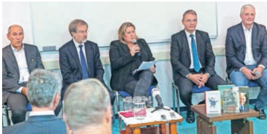
Ivana Omana so se spominjali: Janez Janša, Lojze Peterle, Marjan Podobnik in Aleš Primc.