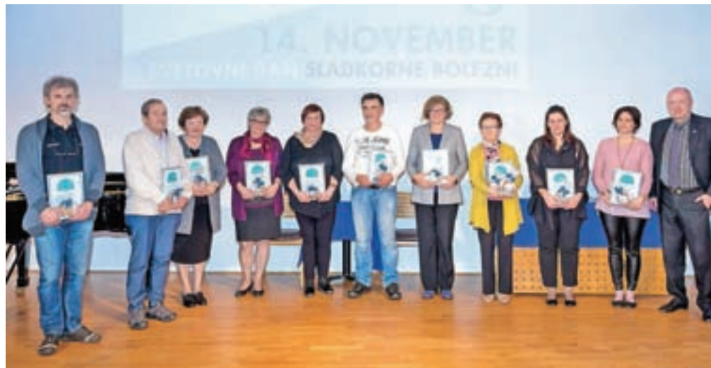
Priznanja Zveze društev diabetikov Slovenije

Osrednja državna proslava ob 14. novembru, svetovnem dnevu sladkorne bolezni, je bila v Škofji Loki. Društvo diabetikov Škofja Loka je obenem proslavilo tridesetletnico.