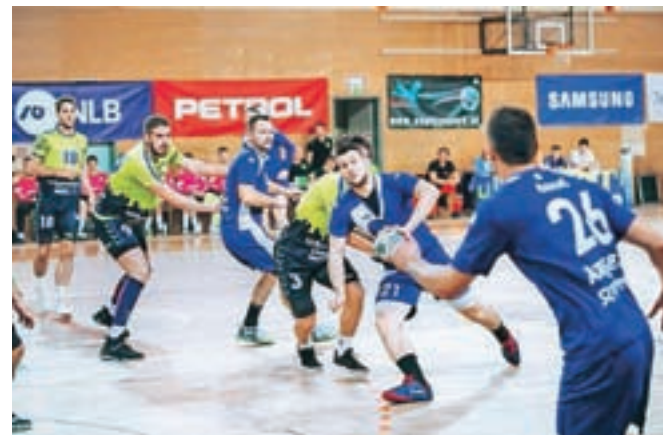
Rokometaši Urbanscape Loke so po desetih krogih prvenstva na osmem mestu prvoligaške lestvice.