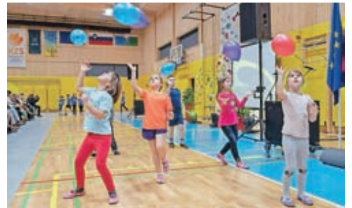
Parada športov OŠ Ivana Tavčarja