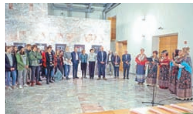
V Škofji Loki so odprli osmi teden ruskega filma.