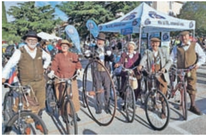
Bili so maskota Istrskega maratona.