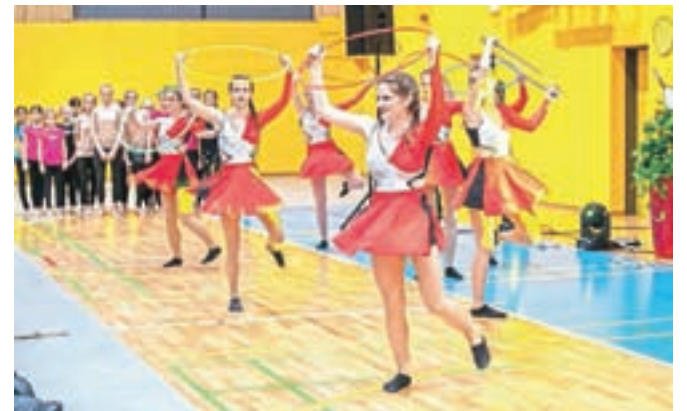
Plesna skupina Step je odplesala pot od stare do nove telovadnice.