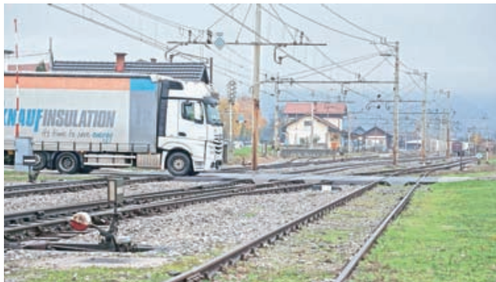
Nivojski prehod čez železniško progo še vedno uporabljajo tudi tovorna vozila.