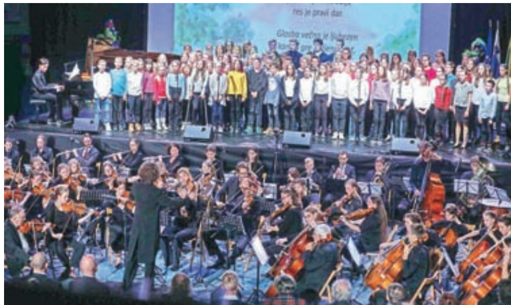
Na slavnostnem koncertu so nastopili nekdanji in sedanji učenci in učitelji Glasbene šole Škofja Loka.

Ustanoviteljice glasbene šole so občine Škofja Loka, Železniki, Gorenja vas - Poljane in Žiri. V njihovem imenu je zbrane nagovoril škofjeloški župan Tine Radinja. "Puštalski grad je prežet z mladostno energijo, saj se v njem pod vodstvom strokovnih in prizadevnih mentorjev mojstrijo naši glasbeniki in glasbenice. Učenci tradicionalno sodelujejo pri vseh največjih dogodkih v našem mestu. Brez vas si kulturnega utripa Škofje Loke ne znamo več predstavljati. Vaša glasba odmeva