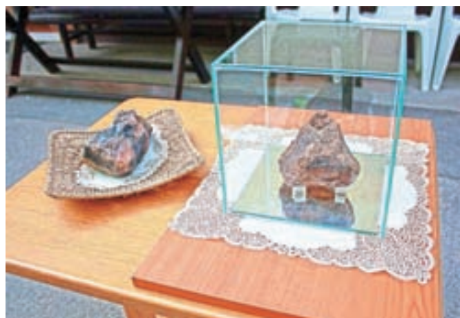
Meteorit Javorje in njegova replika

je, kjer so opravili raziskave in 12. maja 2010 potrdili, da gre res za meteorit, je razložila Hermina Jelovčan. "Za meteorit je vladalo precejšnje zanimanje in v Javorje so prišli strokovnja-