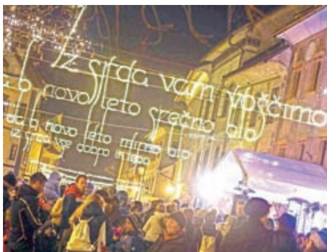
Z lanske Loke v snegu: voščilo v pisavi iz darilne listine iz leta 973, leta prve omembe Škofje Loke