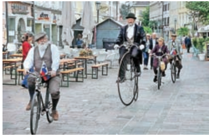
Rovtarji v Celovcu

Rovtarji so bili tudi gostje smučarskega sejma v Kranju, do konca tega leta pa si želijo obiskati še Rovinj. Decembar bodo preživeli v prazničnem vzdušju, takoj po novem letu se bodo udeležili tradicionalnega pohoda na Blegoš, februarja naslednje leto pa že načrtujejo 20. Mednarodno tekmovanje v smučanju po starem na pobočju pod Loškim gradom.