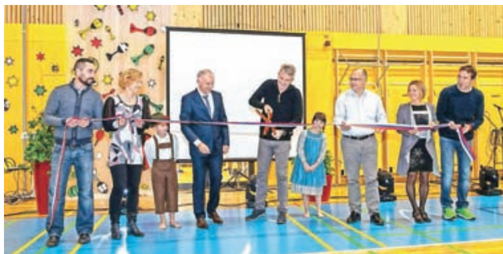
V Gorenji vasi so sredi novembra slovesno odprli novo športno dvorano.