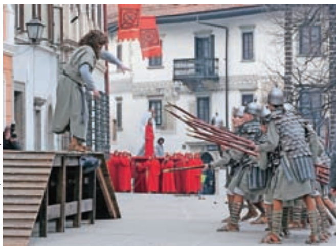
Prizor iz uprizoritve Škofjeloškega pasijona leta 2015

"Z zapolnitvijo ekipe Škofjeloškega pasijona, ko se ji je pridružil še režiser, je ta že začela priprave na uprizoritve v letu 2021. Poteka dogovarjanje z najpomembnejšim elementom pasijona, s pasijonci, da bomo lahko čez poldrugo leto znova izvedli Škofjeloški pasijon, ki bo potekal prvič po vpisu na Unesco seznam svetovne dediščine, in ga dvignili še