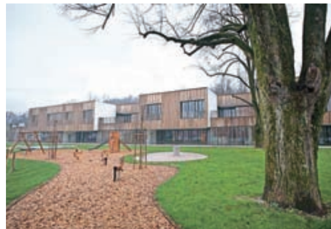
Vrtec Kamnitnik je nared za slavnostno odprtje in sprejem otrok.

Škofja Loka – Vrtec Kamnitnik na prostoru nekdanje vojašnice je zgrajen. Občina in vodstvo Vrtca Škofja Loka vabita na odprtje v petek, 29. novembra, ob 17. uri. Po uvodnih nagovorih bodo v kulturnem programu nastopili otroci in zaposleni v škofjeloških vrtcih, nato se bodo lahko obiskovalci udeležili vodenega ogleda nove stavbe. Že v ponedeljek, 2. decembra, bodo vrtec naselili otroci.