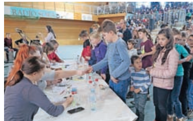
Letošnja dobrodelna prireditev s tombolo je bila ena najbolj obiskanih doslej, saj je v Športno dvorano Železniki privabila okoli 650 obiskovalcev.

Selcih. Za najmlajše se bo začela že ob 17. uri s klovnom Jako in Piko Nogavičko, odrasle pa čakajo zabav-