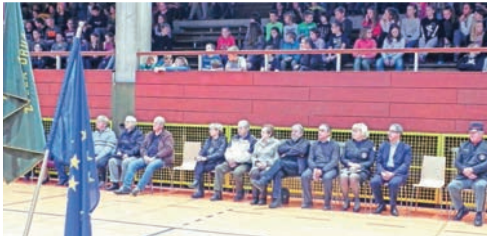
Domoljubno društvo general Rudolf Maister Žiri in Osnovna šola Žiri sta pripravila proslavo ob državnem prazniku, dnevu Rudolfa Maistra.

rodni zgodovini tudi človeka, ki je v sebi združeval vse te lastnosti: "Imamo vojaka in državnika, pesnika in umetnika, predvsem pa velikega domoljuba generala Rudolfa Maistra - Vojanova." Ko smo se po županovih besedah ob koncu prve svetovne vojne znašli v okoliščinah, ko so veliki narodi izsiljevali in pritiskali na manjše narodne skupnosti, v okoliščinah, ko niti ljubljanska vlada ni zares razumela usodnosti razmer na slovenskih mejah, so general Maister in njegovi soborci ukrepali. "Konkretno in s pogumom v srcu, ki ga je navdihovala globoka ljubezen do slovenske zemlje in naših ljudi," je izpostavil župan in dodal, da je bil Maister general, ki je znal presoditi, kdaj mora vzeti v roko puško in kdaj pero in čopič. "Razumel je vojno in cenil je mir. Kdor ima rad svojo domovino, v svojem srcu ve, kdaj in kako naj ukrepa, ko gre za skupne stvari. General in pesnik Maister nam je pri tem lahko odličan zgled in vsem nam želimo, da bi njegov lik čim bolj poznali tudi naši otroci in ob njem iskali navdiha."