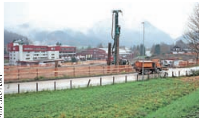
Na Dolenčevih vrtovih gradijo stanovanjsko soseko.