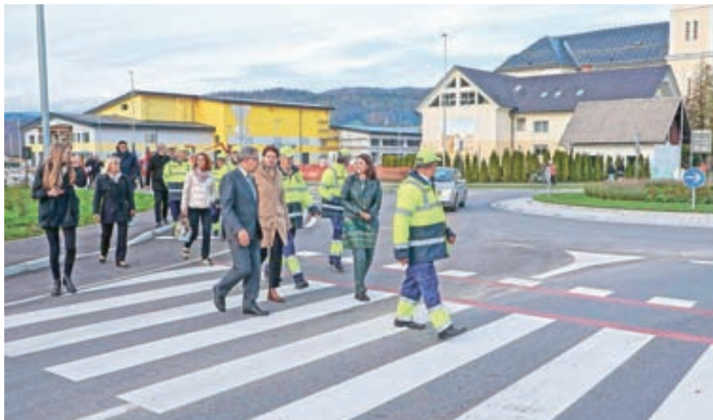
V Žireh so v začetku novembra slovesno predali namenu novo krožišče.