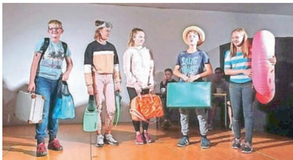
Gorenjevaški učenci so z igro Utrip podeželja v Italijo prinesli košček Slovenije.