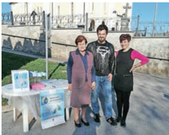
Akcija Manj svečk za manj grobov uspešna tudi v Škofji Loki