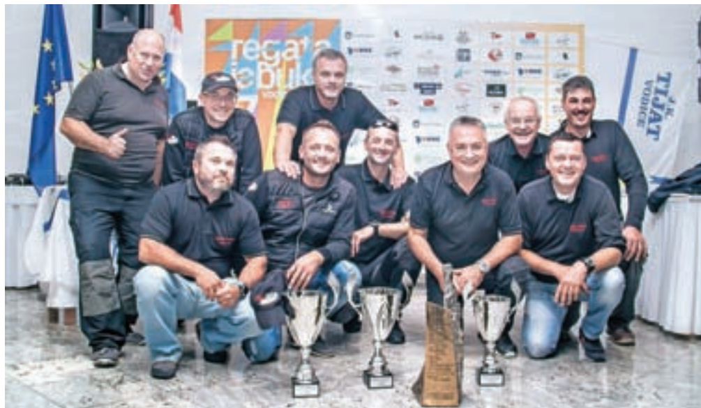
Člani posadke Taia 2 & White Goos so se za konec sezone veselili zmage na regati Jabuka v Vodichah na Hrvaškem.

mi potovalnimi jadrnicami so bili sedmi, prav tako pa so osvojili 49. mesto med sicer 2015 jadrnicami. Za zaključek so nato ta mesec nastopili še na slovitih regati Jabuka v Vodichah na Hrvaškem, kjer so, kljub težkim pogojem, slavili zadnjo letošnjo zmago. V 17. izvedbi regate so postali tudi prva slovenska barka, ki se