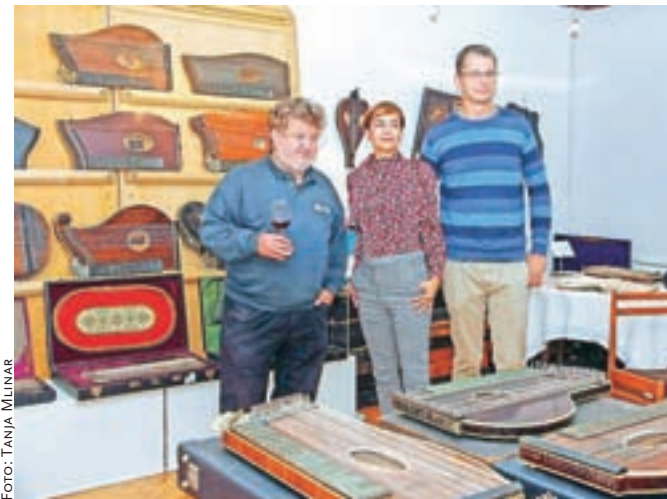
Z odprtja razstave citer v galeriji DPD Svoboda