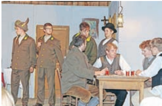
Dramska uprizoritev znamenitega brezniškega upora