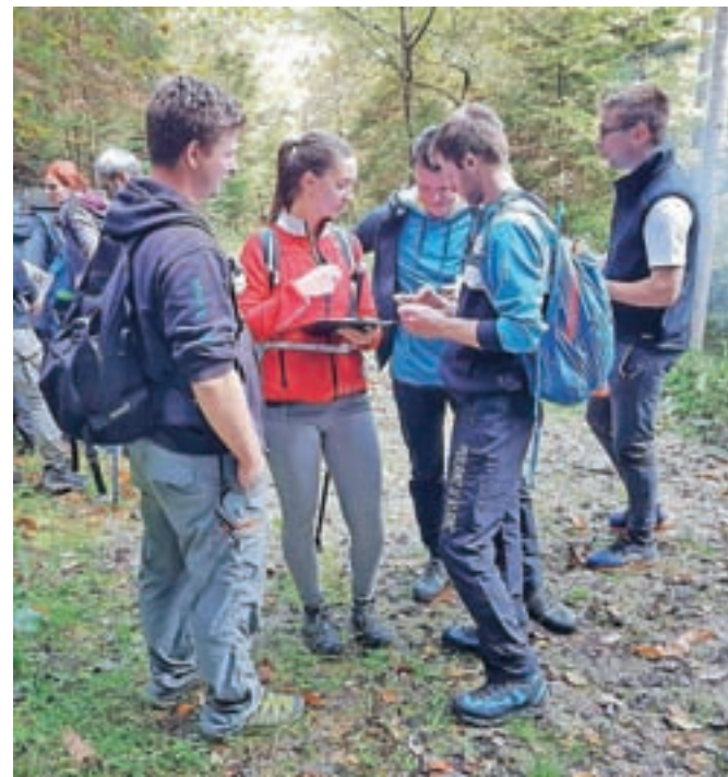
Na dobrih deset kilometrov dolgi poti so tekmovalce čakale različne naloge.

Ekipe pa sicer niso imele pri nobeni nalogi večjih težav, kar se je pokazalo tudi na