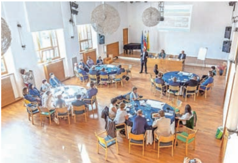
Na delavnici ob mednarodnem srečanju županov iz partnerskih mest