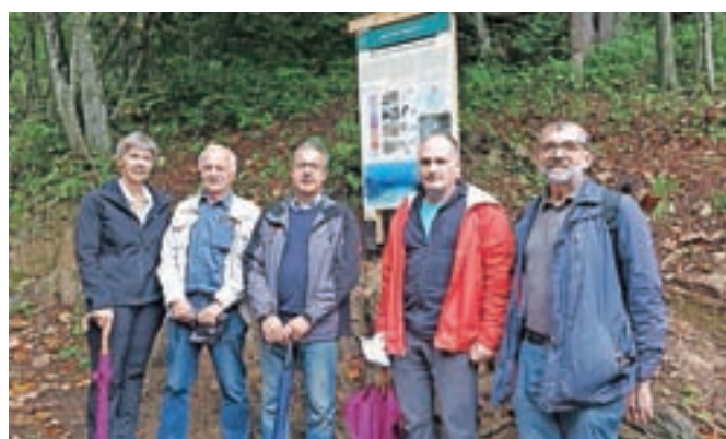
Odprtje informacijske table na permsko-triasni meji v Jarčji Dolini