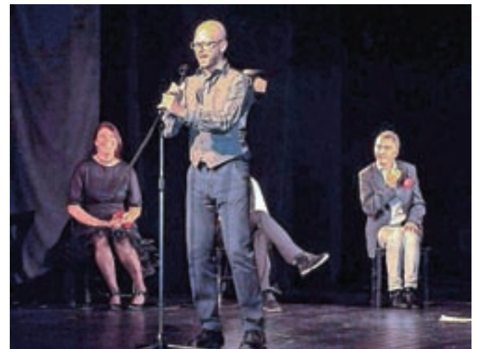
Loški oder je navdušil srbsko občinstvo.

vljajo reflektorje, se igrajo z neonskimi zapestnicami, plešejo zahtevno koreografijo, pojejo opero in govorijo stihove pesmi Arseno Dedića. Ne daj se, Ines v slovenščini, na odru povzročal vesplošno norišnico," poudarja kritičarka: "Režiserjeve rešitve, ki so se odlično ujele s tekstom, napisanim pred dvema stoletjema, so izzvale plejado čustev, ob katerih nismo mogli ostati ravnodušni. Čeprav se je predstava odigrala v tujem jeziku, jo je publika zelo dobro sprejela in je z aplavzi med prizori in med pesmimi vzdrževala Feydeaujevo zamisel, da je boljši vrabec v roki kot golob na strehi oziroma maček v žaklju." Mimogrede – Golob je bil tokrat na Loškem odru.