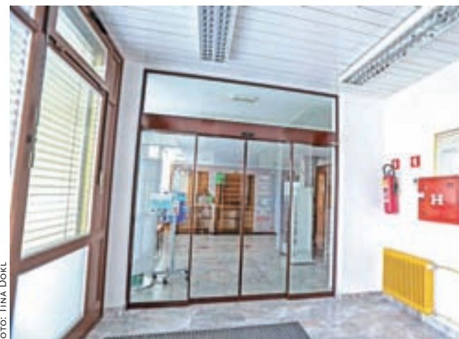
V prostorih nekdanje lekarne načrtujejo ureditev novih, sodobno opremljenih ambulant družinske medicine.