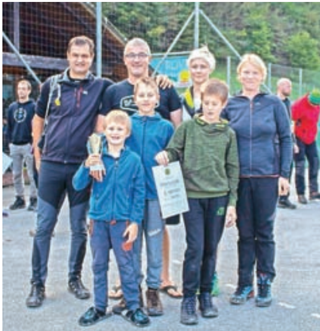
Prvovrščena ekipa Jakati

Zbrali so se na Rovnu v Selcih, od koder so se podali na dobrih deset kilometrov dolgo pot. Ker je bila krožna, se je polovica ekip podala v eno