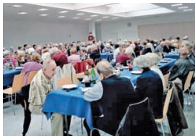
Letošnjega srečanja se je udeležilo blizu sto šestdeset starejših občanov.