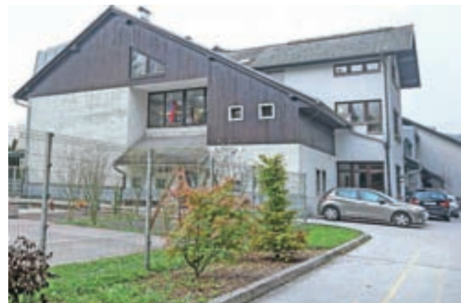
Za prizidek k vrtcu Agata so v proračunu namenili sedemsto tisoč evrov.