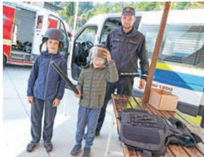
Delo in oprema policistov sta pri mladih vzbudila veliko zanimanja.

Osrednji dogodek Evropskega tedna mobilnosti so v Škofji Loki pripravili v soboto, 5. oktobra, pred njim pa že septembra organizirali t. i. pešbus v OŠ Škofja Loka-Mesto, OŠ Cvetka Golarja in OŠ Ivana Groharja, pripravili predavanje o trajnostnem in vključujočem urejanju prostora, v duhu Evropskega tedna mobilnosti je potekala tudi prireditelji Veter v laseh, kjer so izvajali ustvarjalne delavnice na temo prometa. Takrat in prvo oktobrsko soboto pa so ponudili tudi brezplačen prevoz z mestnimi avtobusi.