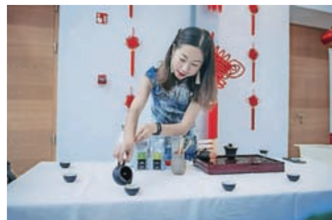
V Škofji Loki so obiskovalci spoznali tudi tradicionalni ritual pitja čaja.