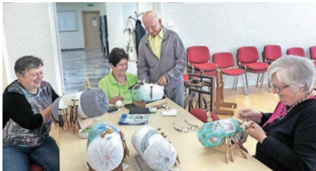
Članice Klekljarskega društva Deteljica so drugo soboto v oktobru v Sokolskem domu v Gorenji vasi pripravile Dan z Deteljicami.