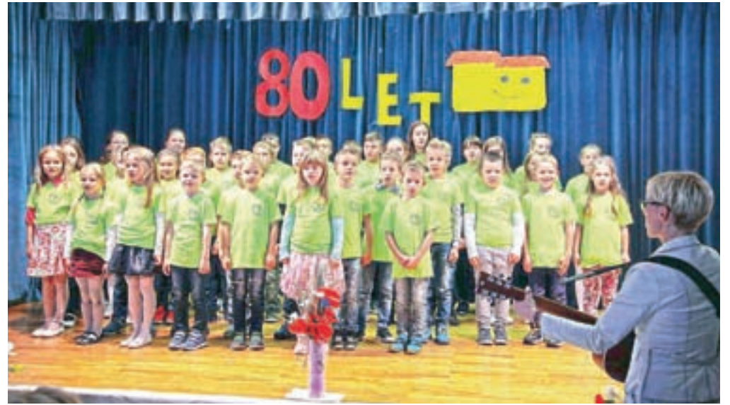
Z osrednje prireditve ob osemdesetletnici šolske stavbe v Lučinah