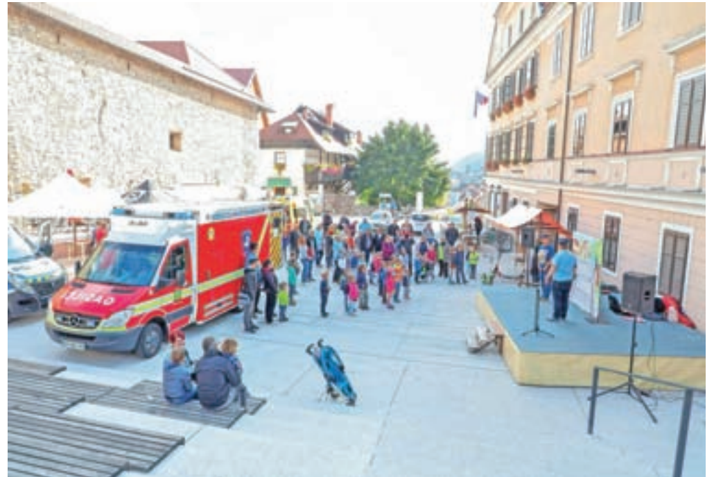
Loški gasilci so predstavili svoje vozilo.

Škofja Loka – Občina Škofja Loka se je že deveto leto pridružila Evropskemu tednu mobilnosti, ki je letos potekal pod geslom "Gremo peš!". Gre za kampanjo, ki vsako leto sredi septembra poteka pod okriljem Evropske komisije, njen namen pa je spodbuditi lokalne skupnosti k izvajanju ukrepov in promociji trajnostne mobilnosti ter s tem prispevati k zmanjšanju osebne motornega prometa. Ljudi ozavešča v smeri spreminjanje sodobne miselnosti pri navezavanosti na pretirano uporabo avtomobila, spodbuja k pešačenju, kolesarjenju in uporabi javnega prometa, kar je vse v prid zdravja ljudi in varovanja okolja.