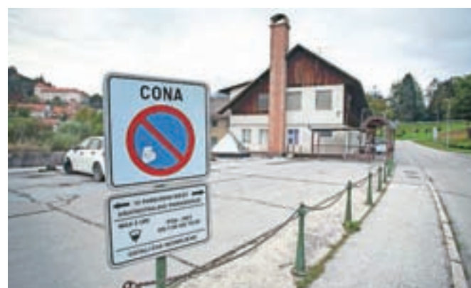
Obiskovalci zdravstvenega doma lahko parkirajo na platu nekdanjega Tehnika.

ljudje te možnosti verjetno še ne poznajo dovolj, saj je to parkirnišče manj zasedeno. V neposredni okolici zdravstvenega doma bo težko zagotoviti veliko več parkirnih mest, prav pa je, da so ta pra-