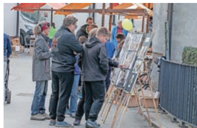
Razstava o miklavževanju na Sejmu na Fari

Stara Loka – Prvo oktobrsko soboto so v Stari Loki priredili sejem in v okviru Dnevo evropske kulturne dediščine, ki so letos potekali pod geslom Dediščina#umetnost#razvedrilo, priredili tudi zanimivo razstavo. Na fotografijah so prikazali star običaj miklavževanja, ki je v Stari Loki še zelo živ, slike pa prikazujejo to šego skozi več desetletij 20. in 21. stoletja, od tridesetih let prejšnjega stoletja do današnjih dni. Na Fari ta običaj živi v svoji prvobitnosti, zato so nanj še posebej ponosni. Razstava se je s Sejma na Fari preselila v Sokolski dom.