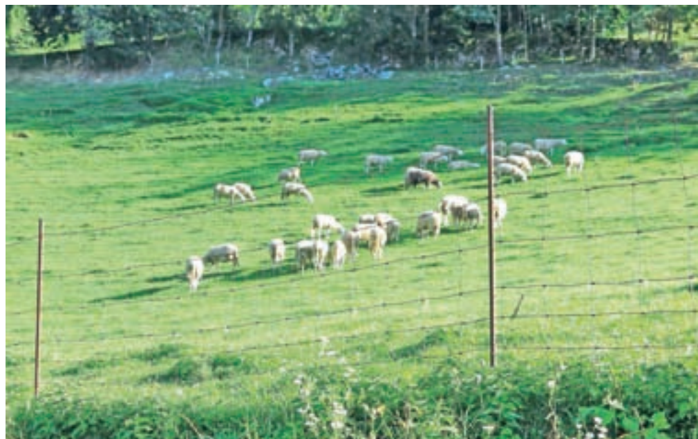
Volkovi so zgolj v eni noči močno zdesetkali čredo plemenskih živali z zaščitnim poreklom.

tveganja za varnost naših najmlajših, še manj pa je pričakovati, da bi bili pripravljeni takšnim tveganjem izpostaviti lastne otroke," je poudaril. V svoji vlogi za odstrel volkov so tako pristojne pozvali, naj nastalo stanje proučijo odgovorno in z vso resnostjo ter nemudoma odločneje ukrepajo.