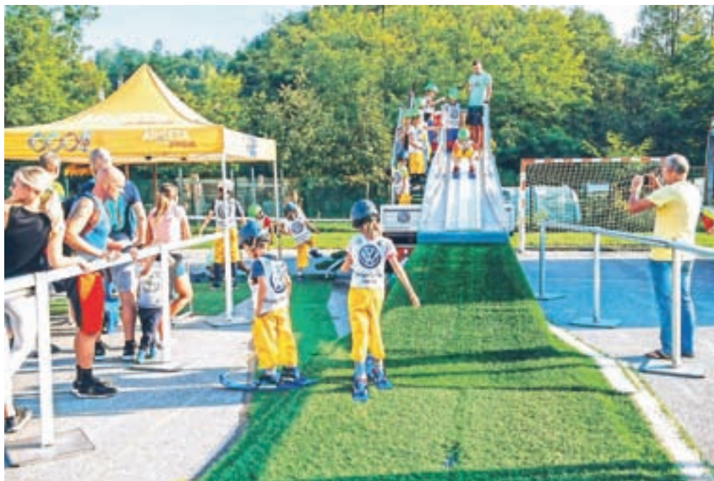
Otroke je pritegnila Mini Planica

Srečanje s športno dejavnostjo ponuja alternativo vsem vrstam odvisnosti, daje priložnosti za aktivno preživljanje prostega časa, zagotavlja druženje, zdravo zabavo in sprostitve. "Športno udejstvova-