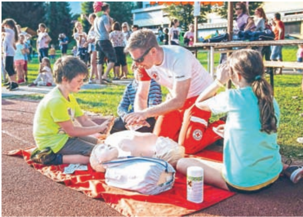
Reševalec prikazuje postopek oživljanja.

V Škofji Loki bodo letošnji Evropski teden mobilnosti zaznamovali v soboto, 5. oktobra, na Trgu pod gradom. Program bo potekal že od 8. ure naprej, ko bodo najprej predstavili program Evropskega tedna mobilnosti in delo Sveta za preventivo in vzgojo v cestnem prometu v občini. Obiskovalci bodo lahko videli reševalno vozilo, prikazali bodo tudi temeljne postopke oživljanja z električnim defibrilatorjem AED. Gasilci iz Stare Loke bodo pokazali logistično vozilo za reševanje pri množič-