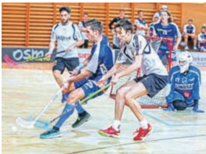
Ločani so v zadnji sezoni osvojili naslov državnih prvakov in prvakov mednarodne lige.

Prejšnji konec tedna je bil na sporedu prvi krog, ekipa Insport Škofja Loka A pa je v 1. krogu za gol premagal dvakratne zmagovalce