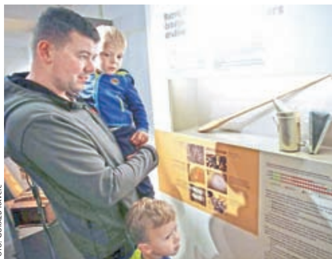
Ob odprtju muzejske zbirke v čebelarstvu