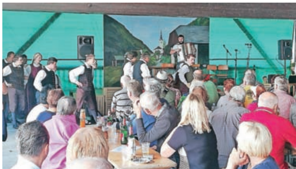
Obiskovalci so si v kulturnem programu z zanimanjem ogledali tudi nastop folklorne skupine Jelčki iz Škofje Loke.