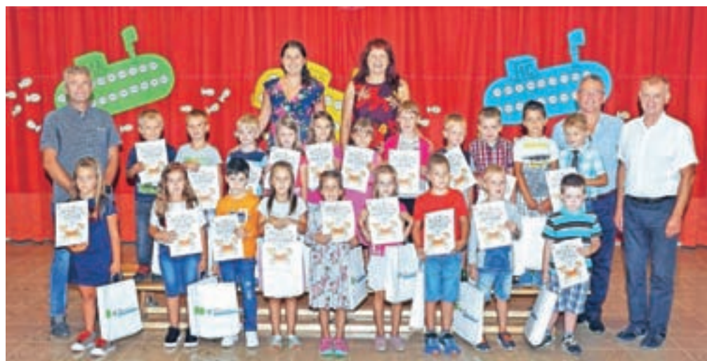
Prvi šolski dan v OŠ Ivana Tavčarja Gorenja vas