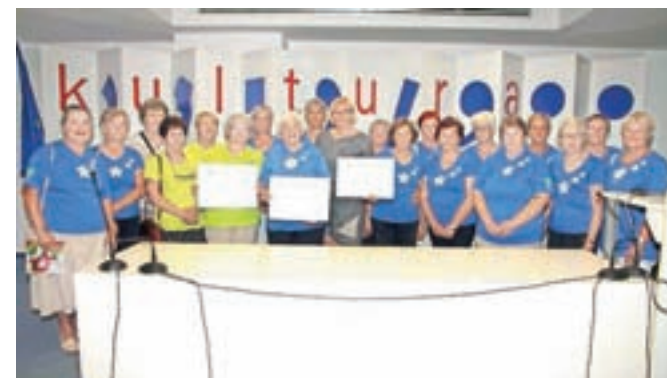
Sprejema pri ministru so se udeležile tudi klekljarice iz Poljanske doline.

svojo ljubezen do klekljanja prenašali naprej. Klekljanje čipk na Slovenskem je bilo na prestižni Unescov seznam vpisano 29. novembra lani na 13. zasedanju medvladnega odbora za varovanje nesnovne kulturne dediščine Unesco, ki je potekalo v mestu Port Louis na Mavriciju. Vpis je pomembno priznanje za vse organizacije in posameznike, ki se strokovno ukvarjajo s klekljanjem, pa tudi tiste, ki s svojim delom skrbijo, da klekljanje ostaja živa dediščina.