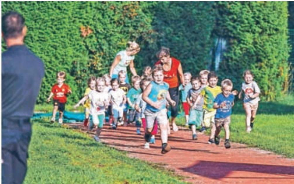
Z gibanjem proti odvisnosti

Dogodek Veter v laseh je organizirala Lokalna akcijska skupina za preprečevanje zasvojenosti. Na športnem igrišču Osnovne šole Ivana Groharja v Podlubniku je bilo 17. septembra vse popoldne živahno. Rekreativno-družabna prireditve Veter v laseh – s športom proti odvisnosti je letos udeležence vabila z geslom Poletimo daleč. Mladi so spoznali športe: floorball, odbojko, aikido, karate, košarko, gimnastiko, skoke na Mini Planici, body zorbing, nogomet, prstomet, družinsko rekreacijo, namizni tenis, rokomet. Predstavila so se škofjeloška športna društva in različne športne panoge. Ob športu pa so svoje programe ponudili tudi skavti, taborniki, mažoretna skupina Fokus, Na divje, mladinski dnevni centri DC Ω IN MDC Blok, Familija, gasilci, orgličarke, kari-