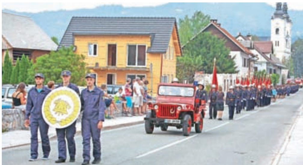
Jubilej so zaznamovali tudi z gasilsko paradno.