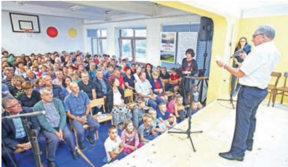
V Javorjah so v začetku septembra zaznamovali 150. obletnico ustanovitve samostojne občine.