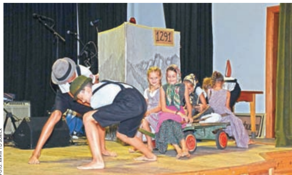
Pripravili so tudi igrano uprizoritev naseljevanja Tirolcev v zgornji del Selške doline.

Markelj je sicer v predavanju povzel ključna dognanja doktorske disertacije, ki jo je zagovarjal maja. Mladi razi-