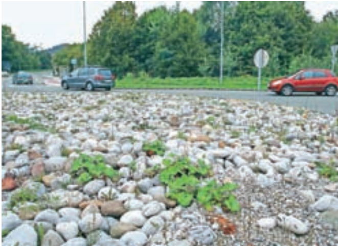
Ločani bi radi lepše krožišče v Starem Dvoru. / FOTO: GORAZD KAVČIČ

bi ga želeli urejati in lepšati z rastjo, bi bilo treba urediti tudi odvodnjavanje," o tem pravi župan Tine Radinja. "Za krožišča na državni cesti ima država svoj načrt urejanja, kar velja tudi za Škofjo Loko. Trenutno ima v planu takojšnjo izvedbo novega krožišča v Lipici, zelo si prizadevamo tudi, da čim prej uredijo krožišče pri starem Petrolu, hkrati pa bi radi, da bi bilo tudi začasno krožišče v Starem Dvoru estetsko polepšano. Pri teh prioritetah pa se včasih lovimo."