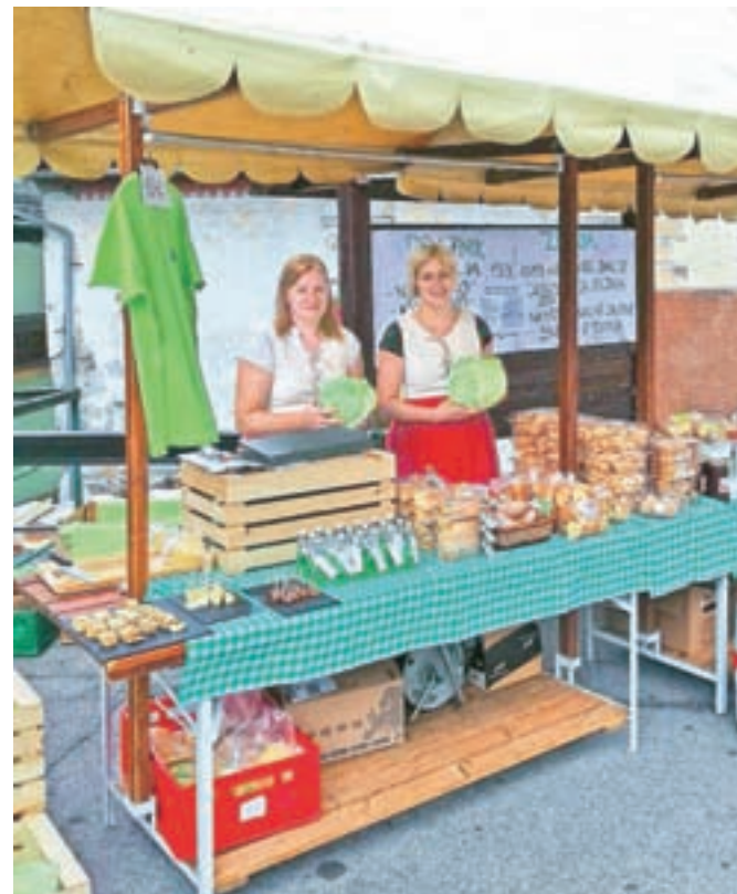
Na tržnici so v tem času lahko ponudili trideset glav zaloškega zelja, saj še ni dozorelo, so se pa z obiskovalci dogovorili tudi za naknadni prevzem.