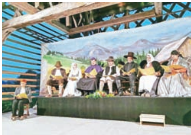
Pod kozolcem na Dvorcu Visoko so pripravili bralno izvedbo Visoške kronike.