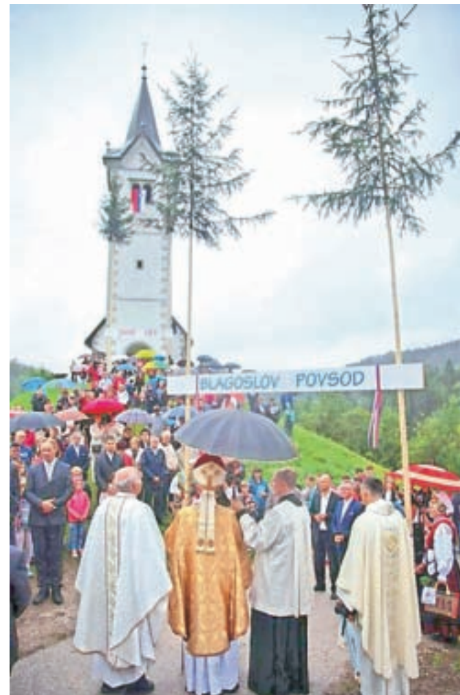
Letos je minilo petsto let od posvetitve podružnične cerkve sv. Jurija na Volči.