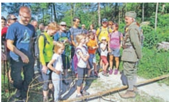
Pohodniki ob nekdanji rapalski meji so po poti srečali tudi varuha meje.