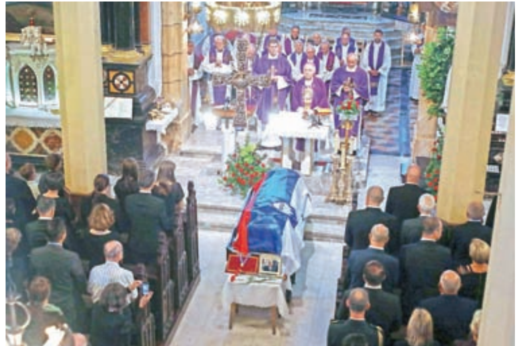
Pogrebna maša v cerkvi sv. Jakoba v Škofji Loki

Pahor je Oman označil tudi za ljudskega tribuna v najbolj zlahtnem pomenu te besede. "Bil je strpen in potrpežljiv, razumevajoč za dvome in drugačna stališča glede pomembnih vprašanj. To je v ljudeh dodatno poglobilo zaupanje v njegovo voditeljstvo." Najprej in predvsem pa je bil po njegovih besedah zelo pošten človek. "Samo tako je lahko neko drzno politično zamisel predstavil ljudem. Zaradi njegovega poguma so mu ljudje sledili. In čeprav se je zdelo, da za aktivne demokratične spremembe