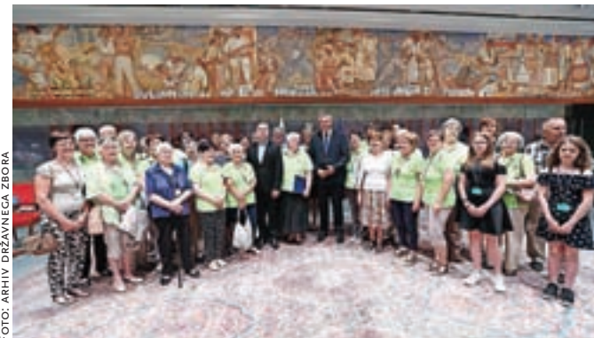
Članice Klekljarskega društva Deteljica Gorenja vas so se z razstavo Cvetje v jeseni predstavile v državnem zboru.

temveč tudi za vse klekljarice, ki so to rokodelsko veščino in klekljarsko znanje uspešno prenašale na mlajše rodove ter ju uspelo ohraniti vse do danes, so ob odprtju razstave poudarili v službi za odnose z javnostmi državnega zbora. Zbrane je ob tej priložnosti nagovoril tudi predsednik državnega zbora Dejan Židan, ki ga veseli, da so razstavo čipk gostili ravno v predprazničnem tednu, "pred rojstnim dnevom Slovenije, dnevom državnosti". Klekljane čipke, je dodal, so namreč naš simbol in neločljiv del naše narodne in kulturne identitete.