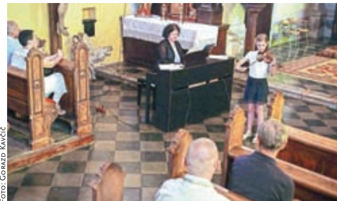
Glasba je zazvenela tudi v lepem ambientu Špitalske cerkve.