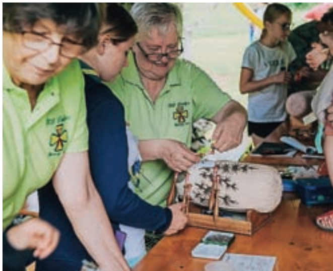
Svojo spretnost so obiskovalci lahko preizkusili na delavnici klekljanja.

"Družine so tudi letos odhajale zadovoljne in z okrepljenim zavedanjem o lastni