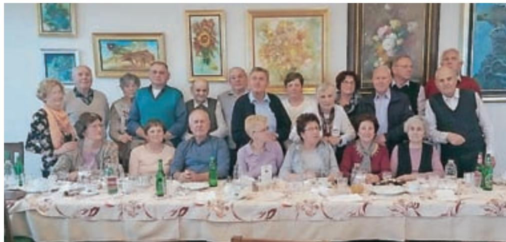
Srečanje Sekalove rodbine na Križni Gori