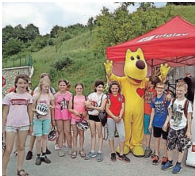
V Osnovni šoli Poljane so sredi junija izvedli servis koles, ki so si ga prislužili za nagrado v programu Varno na kolesu.

Poljane – Pri projektu Varno na kolesu, ki ga je sedmo leto zapored pripravila družba Butan plin, je letos sodelovalo več kot 3300 učencev iz devetdesetih slovenskih osnovnih šol. Program je v prvi vrsti namenjen šolarjem, ki se pripravljajo na kolesarski izpit, ob tem pa k varni udeležbi v prometu spodbujajo tudi vse druge. Prav vsi učenci sodelujočih šol so tako lahko letos z rednim kolesarjenjem v prostem času pridobivali dodatne točke za svojo šolo v okviru naloge Na kolo za zdravo telo in se tako potegovali za praktično nagrado – servis koles, ki ga je podarila Zavarovalnica Triglav.