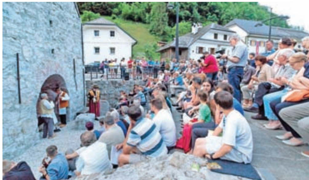
V edinstvenem ambientu pred plavžem se je zbrala množica gledalcev.