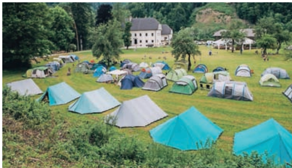
Več kot sto družin je na Visokem tudi prespalo.