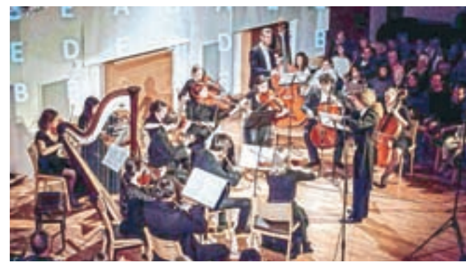
Škofjeloški orkester Amadeo

Škofja Loka – Od aprila se vrstijo koncerti v okviru letošnjega, že enajstega Mednarodnega cikla koncertov. Trije so že mimo, zadnji je bil 22. junija kot zaključni koncert nastop Orkestra ljudskih instrumentov Nekrasov, ki je v Škofji Loki nastopil med svojo evropsko turnejo. V četrtek, 4. julija, bo ob 18. uri na Trgu pod gradom nastopil Komorni orkester in zbor kraljeve gimnazije Colchester, 10. julija bo ob 19.30 v Sokolskem domu koncert škofjeloškega orkestra Amadeo z gosti iz Rusije, Avstrije in Slovenije, 19. julija pa bo ob 20. uri ob obletnici pobratenja med Maasmechelnom in Škofjo Loko v Sokolskem domu nastopil Godalni orkester akademije Maasmechelen.