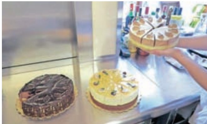
V slaščičarni postrežejo tudi torte Presečnikova Meta, Kosmov Janez in Tavčarjeva tortica.