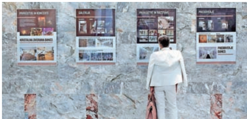
V Sokolskem domu so v začetku junija odprli štiri razstave, s katerimi so zaznamovali desetletnico delovanja Kulturnega centra Sokolski dom Škofja Loka in stoto obletnico začetka gradnje doma.