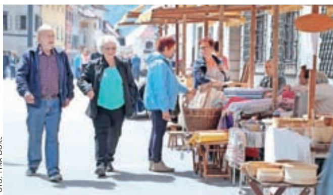
Teden podeželja se je s tržnico kmetijskih pridelkov in izdelkov začel v Škofji Loki in končal v Gorenji vasi.

Škofja Loka – Prve junijske dni je na Škofjeloškem potekal že tradicionalni Teden podeželja, ki ga 17. leto po vrsti organizira Razvojna agencija Sora. Prvega junija se je začel s tržnico kmetijskih pridelkov in izdelkov na Mestnem trgu v Škofji Loki, kjer so se predstavili ponudniki in društva. Pri dvorcu Visoko in v Šubičevi hiši v Poljanah so potekale ustvarjalne delavnice. Predavanja in delavnice so organizirali tudi za ponudnike izdelkov in storitev, in sicer na temo, kako razviti izdelek z dodano vrednostjo in zakaj je lahko lokalni izdelek del doživetja, ter o komunikaciji za osebno in poslovno uspešnost. Teden podeželja so sklenili s tržnico kmetijskih pridelkov in izdelkov v Gorenji vasi, dnevom odprtih vrat v domu čebelarjev v Brodeh in s pohodom iz Hleviš v Žetino mimo slapov.