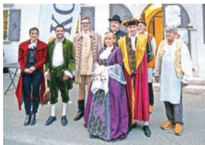
Zasedba, ki je uprizorila igro Hoja na plavž