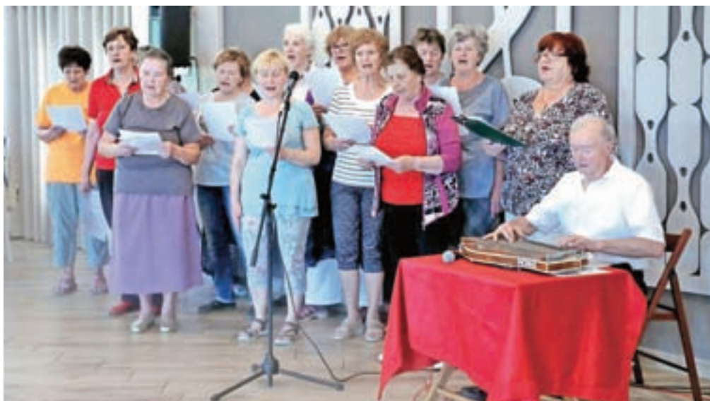
Trinajsto srečanje skupin starejših na Sv. Andreju