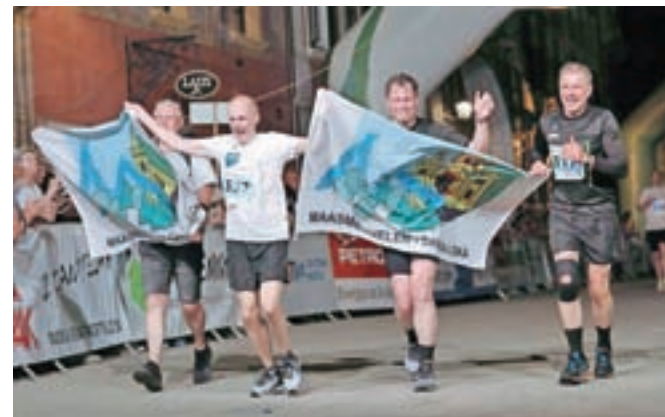
Belgijski tekači ponosno na cilju