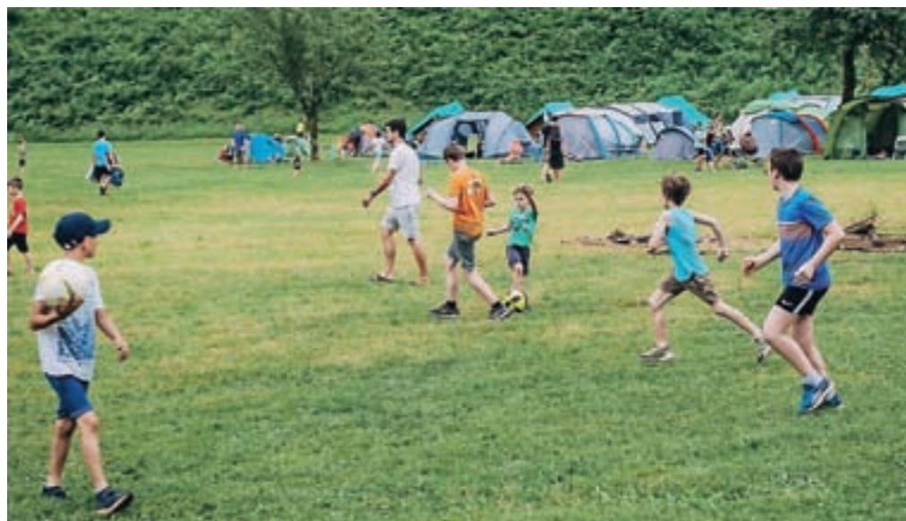
Veliko možnosti je bilo tudi za športne aktivnosti.