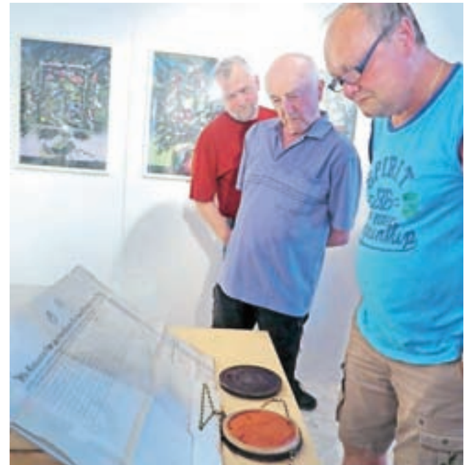
Žirovci so si na prireditvi z zanimanjem ogledali restavrirano cesarsko listino in pečat.

"Listina, ki smo jo dobili v restavratorstvo, ni bila kaj dosti poškodovana, bolj po-