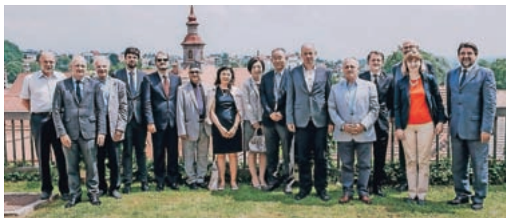
Veleposlaniki na sprejemu na vrtu Sokolskega doma v Škofji Loki

Mednarodno sodelovanje je v občini močno razvito, obisk veleposlanikov pa to dogajanje še nadgrajuje.