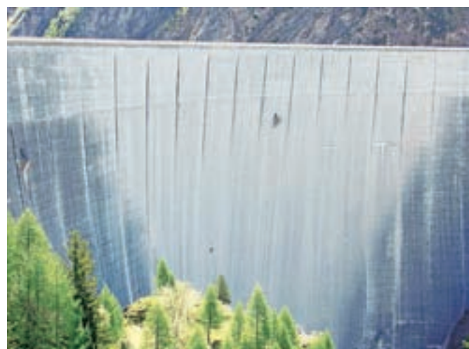
Najvišja umetna plezalna stena privablja najvzdržljivejše plezalce sveta.