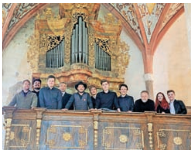
Orgle v cerkvi Marijinega oznanenja v Crngrobu bodo začeli obnavljati septembra letos.

tudi organist omenjene cerkve. Zaupal je, da bo obnova velik finančni zalogaj, saj skupna ponudbena cena obeh izvajalcev, Oglarstva Močnik in Restavratstva