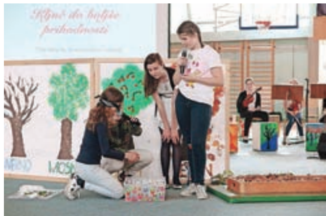
Učence na postajah čutilne sobe