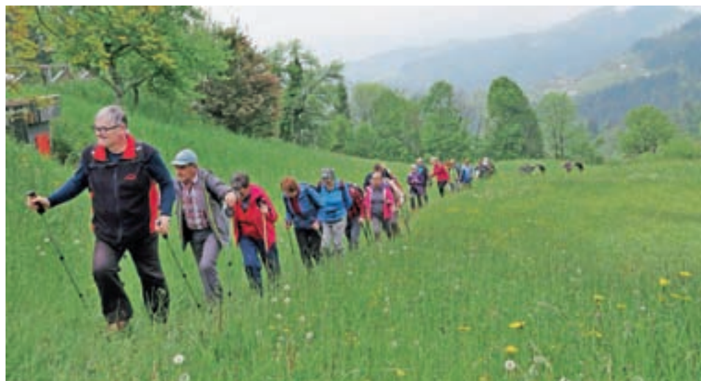
V maju so se odpravili na Pohod s pesmijo.

banje. Udeležbo pri žrebanju si je mogoče zagotoviti še z udeležbo na pohodu na Blegoš kot nekoč v juliju in pohodu Med gorami ob Dnevu oglarjev v avgustu. Septembra sledi še Lovski pohod, oktobra pa pohod po Valentinovi poti. "S tem pohodom tudi končamo sezono in podelimo priznanja," je razložil Šturm in dodal, da je vseh osem pohodov zasnovanih tako, da udeležencem predstavijo celotno območje Starega vrha in njegovo okolico, vedno pa vključijo tudi predstavitev lokalnih ponudnikov ob poti. Poleg glavne nagrade, celoletne smučarske vozovnice, podelijo nagrado še pohodniku, ki pride od najdlje, in najmlajšemu pohodniku. "Simbolično nagrado naših lokalnih ponudnikov pa prejme prav vsak udeležec," je poudaril Šturm. Po njegovih besedah se jim na vsakem od pohodov pridruži od štirideset do sedemdeset pohodnikov, največ pa se jih zbere na Meteoritkovem pohodu, saj se ga udeležijo tudi javorski šolarji.