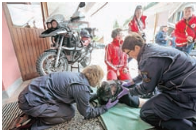
Veliko pozornosti je pritegnil prikaz postopka snemanja čelade pri poškodovanem motoristu in celotnega pristopa k oskrbi poškodovanega motorista.

V sklopu preverjanja so za ekipe pripravili še dve učni prikazni točki. Račevski gasilci so predstavili svoj kombi z opremo za tehnično reševanje in nudenje prve pomoči ob nesrečah, študenta ljubljanske medicinske fakultete pa sta prikazala postopek snemanja čelade pri poškodovanem motoristu in celoten pristop k oskrbi poškodovanega motorista.