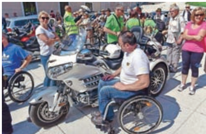
Lanski ParaWing je obiskal Škofjo Loko.

okoli trideset motoristov in nekaj več paraplegikov in tetraplegikov. Z motorji se bodo iz Kranja mimo Predvora odpravili na Jezerko, kjer jih bo pri Planšarskem jezeru sprejel župan občine Jezerko Andrej Karničar. Nato se bodo vrnili v Kranj, kjer bo potekalo praznovanje