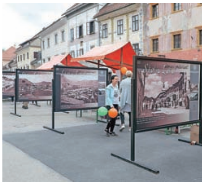
Še do sredine junija bo na Mestnem trgu ambientalna razstava Odmevi preteklosti.