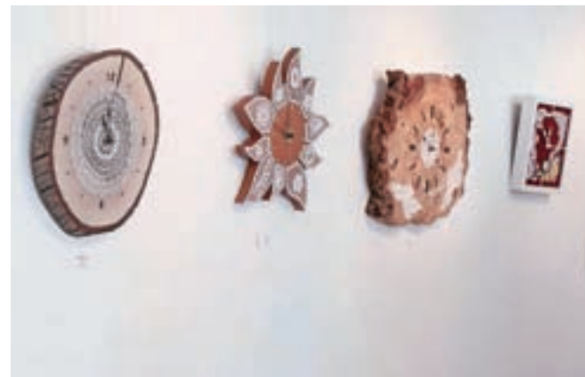
Nagrajene ure z natečaja Moja najljubša ura

cije narod brez prihodnosti. V Žireh že 114. leto neprekinjeno deluje tudi čipkarska šola, s čimer vrednote, kot so kreativnost, vztrajnost in delavnost, prenašajo tudi na mlade, je poudaril župan. Žirovsko klekljarsko tradicijo pa naj bi v prihodnje z Loškimi muzejem Škofja Loka, s pomočjo katerega zbirajo gradivo, predstavili tudi v Muzeju Žiri, je še napovedal. Ob razstavah so tudi letos pripravili še bogat spremljalni program. Klekljarji so