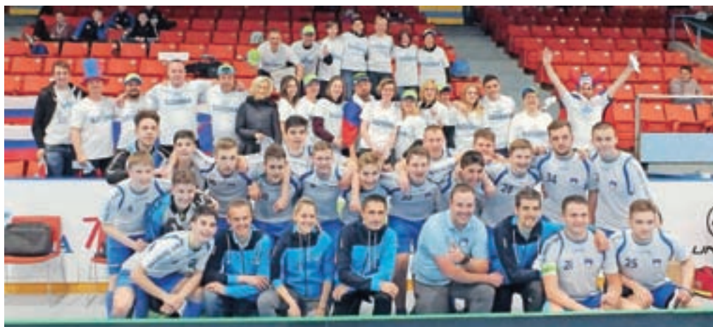
Naša reprezentanca v floorballu je v Kanadi nastopila s podporo številnih navijačev.

Škofja Loka – V Halifaxu v Kanadi je v prvi polovici maja potekalo svetovno prvenstvo za mladince do 19 let. Naši mladi upi, večina doma iz Škofje Loke in okolice, so se v skupini B najprej pomerili z reprezentanco Nove Zelandije in jo premagali s 14 : 2. Na drugi tekmi so moštvo Kanade ugnali z rezultatom 11 : 4, ekipa Nemčije pa je bila od naših boljša z 11 : 6. V polfinalu so se naši pomerili z reprezentanco Rusije, ki so jo premagali z 8 : 5. V finalu so imeli za nasprotnike ponovno Nemce in izgubili s 3 : 9 ter osvojili srebrna odličja. "Po kvalifikacijah v Moskvi so bile naše misli usmerjene na svetovno prvenstvo v Kanadi. Dolgi meseci priprav in trdega dela niso bili enostavni. Vedeli smo, kakšni nasprotniki nas čakajo na prvenstvu, zato smo si postavili za mejo uspeha tretje mesto. Vsak pravi športnik pa si vedno