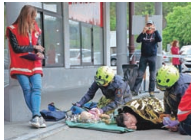
Drugo soboto v maju so v Žireh pripravili 24. regijsko preverjanje usposobljenosti ekip prve pomoči Civilne zaščite in Rdečega križa.