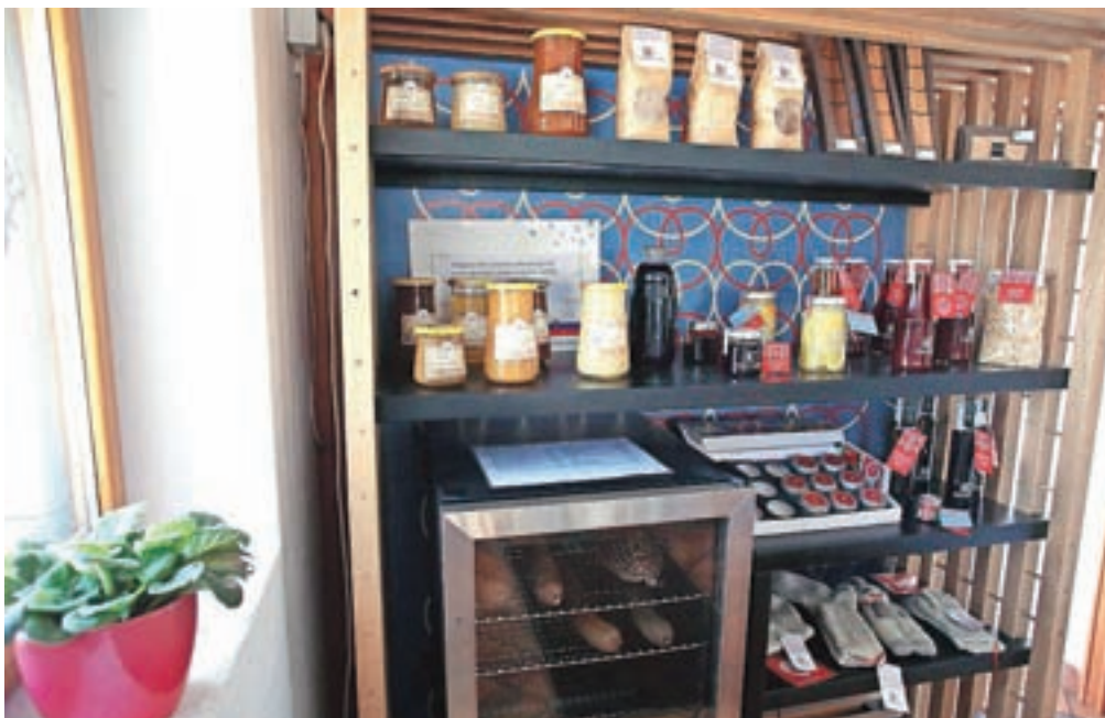
V okviru projekta Marejne so na sedmih lokacijah na širšem škofjeloškem območju postavili promocijsko-prodajne omare, imenovane marejne, v katerih je mogoče najti kakovostne izdelke s Škofjeloškega.

V marejnah je mogoče najti izdelke, ki jih ponujajo pod blagovnimi znamkami Dedek Jaka in Babica Jerca, naravni izdelki iz škofjeloških hribov, pri katerih so pri Razvojni agenciji Sora v sodelovanju s partnerji po osemnajstih letih osvežili logotip in poskrbeli za novo celotno podobo. Omenjeni blagovni znamki, ki se po novem imenujeta Babica in Dedek, naravni izdelki iz škofjeloških hribov, sta po besedah Kristine Miklavčič iz Razvojne agencije Sora med potrošniki prepoznavni kot znamki, ki povezujejo proizvajalce na Škofjeloškem, ki znotraj svojih dejavnosti po tradicionalnih postopkih ter ob uporabi kakovostnih lokalnih in drugih izbranih surovin izdelujejo najrazličnejše izdelke višje kakovosti, ki jo tudi redno preverjajo. V sklopu tega so potem tudi