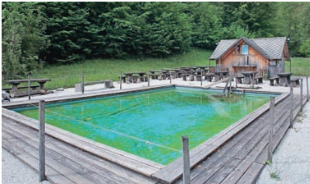
V Kopačnici načrtujejo ureditev sodobnih toplíc.

V podjetju IJP ta čas pripravljajo novelacijo že izdelanih projektnih rešitev, ki na tem mestu predvidevajo gradnjo novih bazenov in manjših glamping hišk. »Investitor že dlje časa razvija koncept umestitve toplíc v prostor ter pri tem testira različne sodobne pristope in izkušnje primerljivih projektov s ciljem optimiziranja projektnih reši-