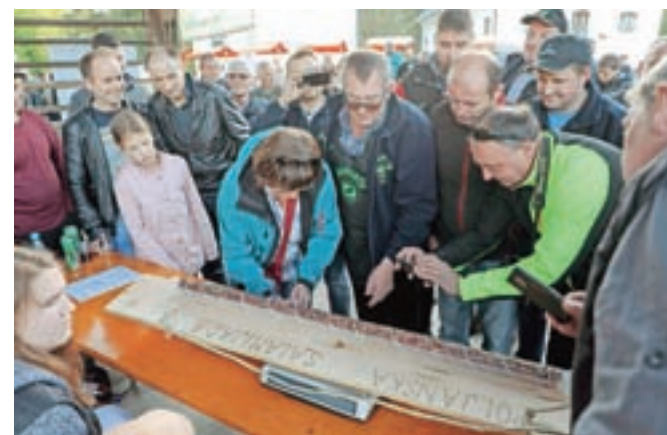
Salamijado je popestril bogat spremljevalni program: uganjanje teže salame velikanke, tržni dan s stojnicami, predstavitev škofjeloškega domačega piva in nastop mladih ansamblov.