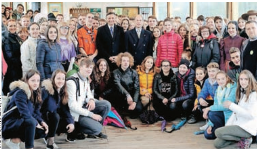
Britanski princ Edvard in predsednik Borut Pahor med mladimi mepijevci