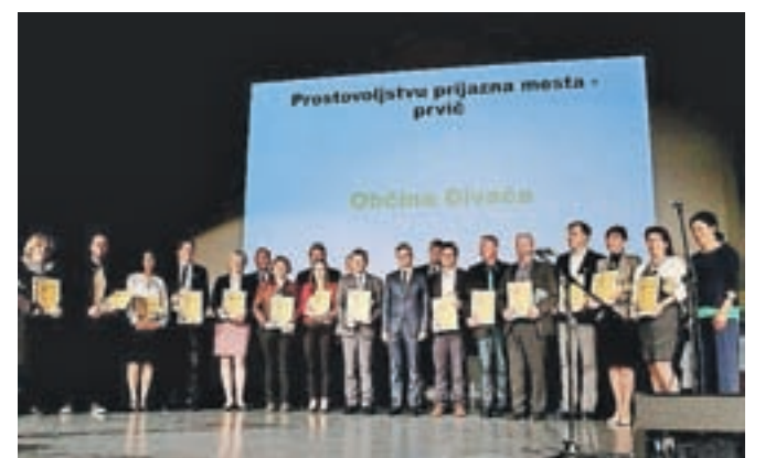
Med občinami, ki so potrdile naziv Prostovoljstvu prijazno mesto, je tudi Škofja Loka.