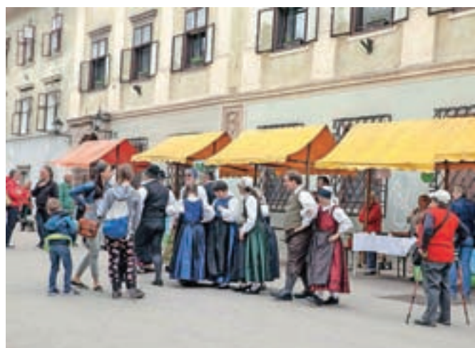
Folkloristi iz Društva Sožitje so na Mestnem trgu zaplesali nekaj živahnih plesov.

Škofja Loka – Teden vseživljenjskega učenja, ki naj bi trajal od 10. do 19. maja, so na Gorenjskem, kjer je dogajanje koordinirala Ljudska univerza Kranj, raztegnili na mesec in pol. Na Škofjeloškem jih koordinira Ljudska univerza Škofja Loka, ki v tem času generacijam, ki želijo sodelovati, ponuja 117 brezplačnih prireditev v občinah Škofja Loka, Gorenja vas - Poljane, Železniki in Žiri. Živahno dogajanje smo prvo soboto, ko se je začel Teden vseživljenjskega učenja, ujeli v Škofji Loki, kjer so se predstavila društva in drugi izvajalci, ki ponujajo priložnosti za pridobivanje najrazličnejših znanj, spretnosti in veščin pa tudi za druženje. Našteli smo jih okoli dvajset, med njimi je bilo tudi Društvo Sožitje, ki se je med drugim predstavilo s svojo folklorno skupino.