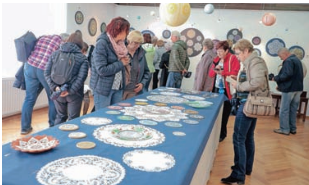
Rdeča nit letošnjih razstav so bile okrogle čipke.