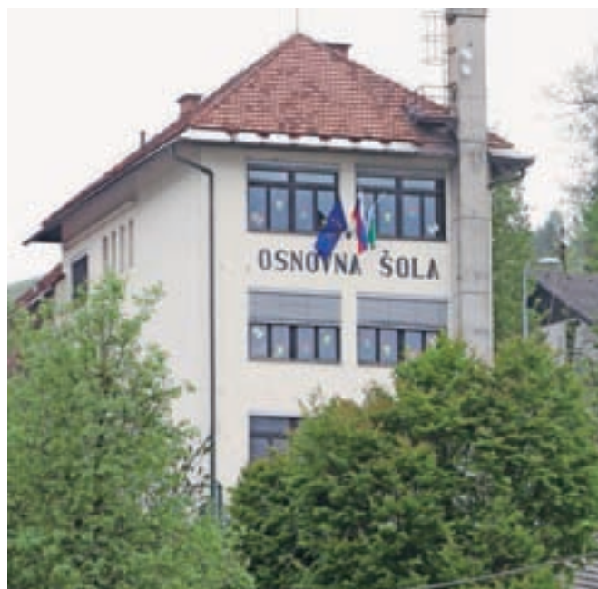
Osemdeset let staro šolo na Sovodnju bodo do sredine prihodnjega leta temeljito obnovili.

Obnova bo po pogodbi vredna skoraj šeststo tisoč evrov, pri čemer je občina pridobila tudi nepovratna sredstva ministrstva za in-