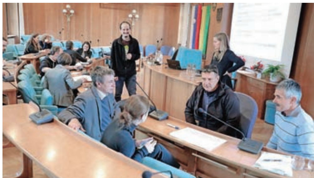
Udeleženci Zero Waste delavnice so razpravljali o pobudah, praksah in ukrepih za preprečevanje nastajanja in ponovne rabe odpadkov.

Škofja Loka – Zero Waste Evropa je gibanje, ki združuje evropske lokalne skupnosti in jih povezuje z mednarodnimi organizacijami ter z lokalnimi Zero Waste skupinami. Njihov cilj je opuščanje vseh vrst odpadkov kot načina doseganja bolj trajnostnega bivanja, gospodarske stabilnosti in socialne povezanosti. Gibanje obenem pomeni oblikovanje in upravljanje izdelkov in procesov na takšen način, da se zmanjšata volumen in toksičnost odpadnih materialov ter se ohranjajo ali predelajo vsi viri brez sežiganja ali odlaganja. V občini Škofja Loka v pobudi Zero Waste, v katero je vključenih že devet slovenskih občin, med njimi Bled, Gorje in Radovljica, vidijo odlično priložnost za zeleni razvoj domače občine. "V Škofji Loki že dalj časa razmišljamo o pridružitvi Zero Waste iniciativi in delavnica je prvi korak na tej poti, da se seznanimo s podrobnostmi, zavezami, načini ravnanja in spremembami, ki jih taka zaveza od nas zahteva. Delavnica je bila zato namenjena občinski upravi, predstavnikom organizacij, društev, podjetij, ki se na našem okolju ukvarjajo z zbiranjem in predelavo odpadkov. Z