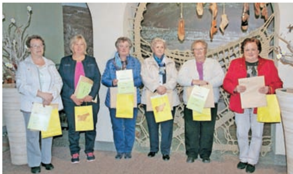
Zmagovalke tekmovanja v klekljanju