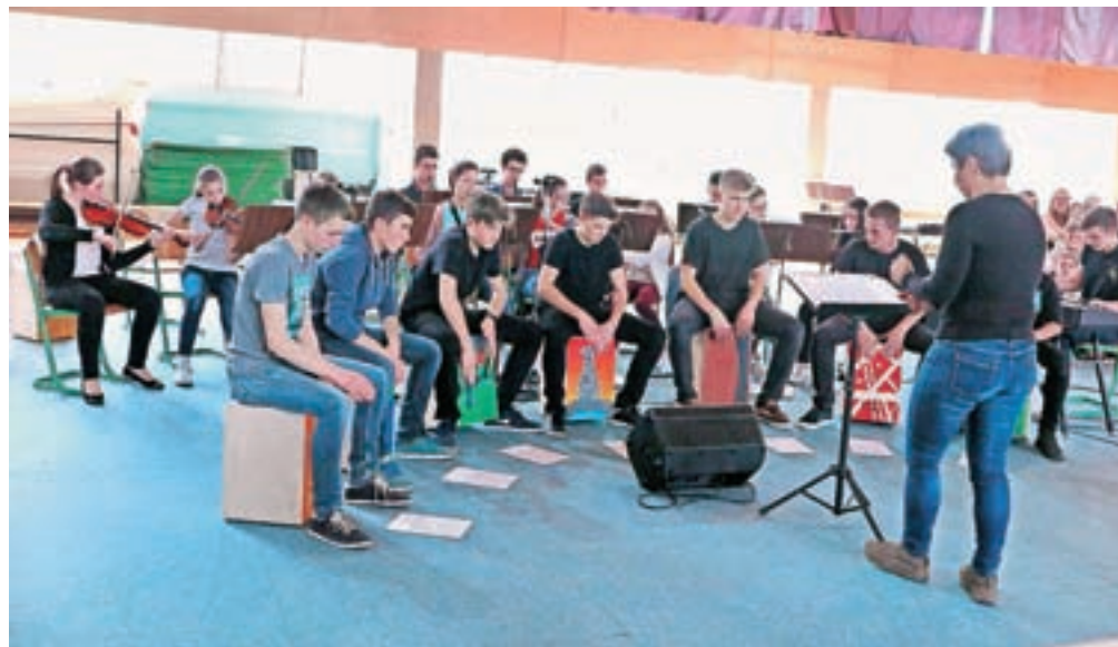
Učenci so zaigrali tudi na cajone, tolkalne instrumente, ki jo jih izdelali sami.