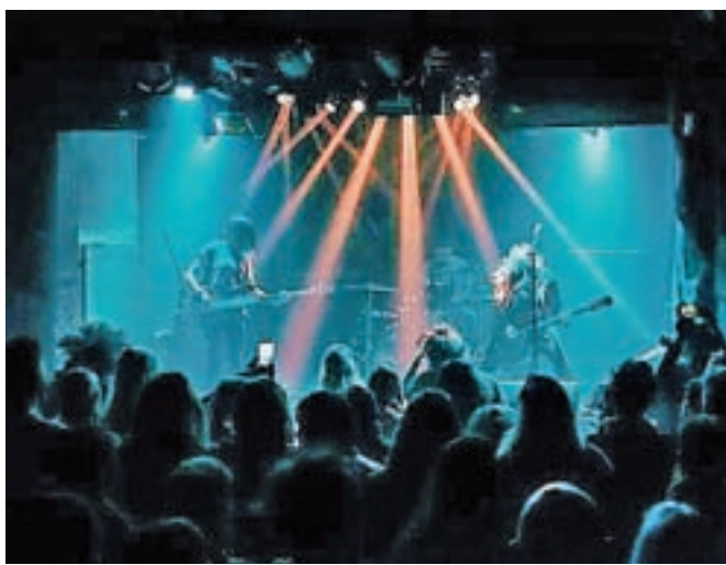
Punčke na poslovlilni turneji

"V času, ki nam je še preostalo do Lucijinega odhoda, se bomo odpravili v studio, posneli nekaj pesmi, ki so nastale v zadnjem obdobju, ter poskušali ustvariti nekaj novih pesmi. Brez pritiska. Želimo zgolj zabeležiti zadnje trenutke, ko smo še skupaj. Zaradi številnih koncertov in turnej v zadnjih letih nam je vedno