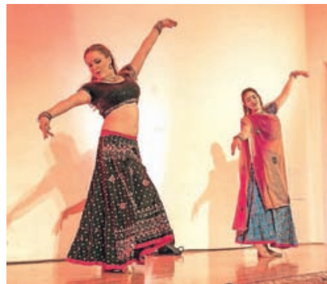
Okusi Indije s plesom...