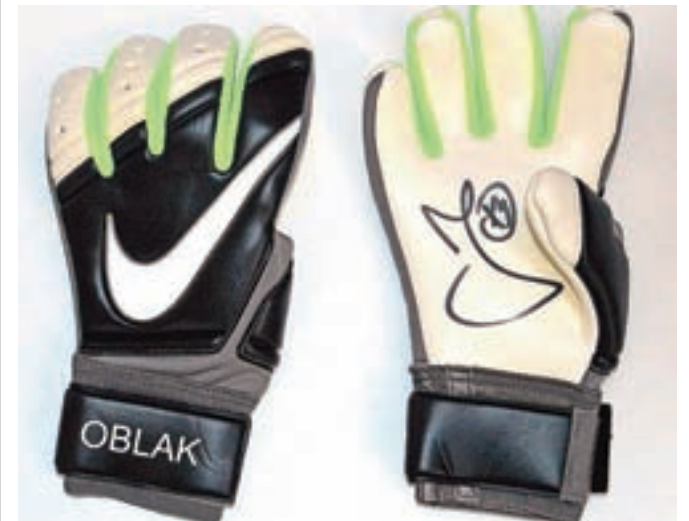
Za športno zbirko podarjene vratarske rokavice so delovni pripomoček enega najboljših nogometnih vratarjev na svetu, Škofjeločana Jana Oblaka.

Naj v tem kontekstu razložim tudi pričujočo fotografijo. Ljubitelji športa, še posebej nogometa, seveda vedo, čigave roke so oblečene v te rokavice. Gre za eno zadnjih pridobitev, s katero se lahko pohvalijo v Loškem muzeju, namreč vratarske rokavice Jana Oblaka, prvega vratarja slovenske nogometne reprezentance, ki navdušuje na