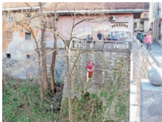
Loški jamarji, ki so sodelovali v čistilni akciji, so se po smeti spustili v kanjon Selške Sore.

ko rečemo, da so bile do sedaj vse uspešne, ker velja, da je namen dosežen, ko odpadki konča tam, kamor dejansko sodi. Iz dneva v dan se kljub akcijam pojavljajo nova smetenja. Ljudje bi se morali zavedati stare modrosti ameriških Indijancev, da "Zemlja ne pripada človeku, ampak človek pripada Zemlji, zato jo je dolžan varovati in globoko spoštovati".