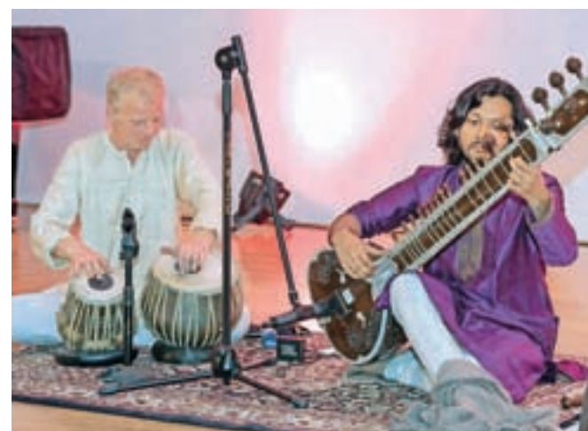
... in glasbo na indijskih glasbilih

V kinu Sora so v teh dneh prikazovali indijske filme. Obiskovalci so si že lahko ogledali tri (Sodišče, Pogreb, Apur Panchali), drevi pa bo ob 20. uri možen ogled fil-