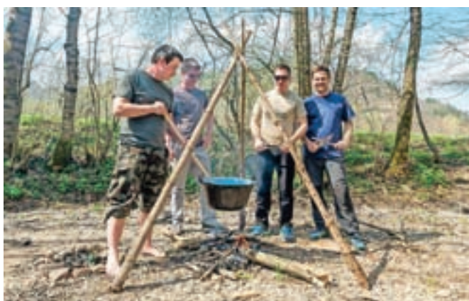
Ekipa B'ki je skuhalo golaž, ki je najbolj navdušil ostale kuharje golaža na Golažirjadi.

kaj netiva, da so lahko zakurili ogenj," je razložila tabornica Lara Zajc. Med prvimi se je kuhanja lotila ekipa nekdanjih tabornikov B'ki. "Najpomembnejše je, da je čebule vsaj toliko kot mesa, vse ostalo so finese, ki jih dosežeš skozi petdeset golažev, kolikor sem jih skuhal