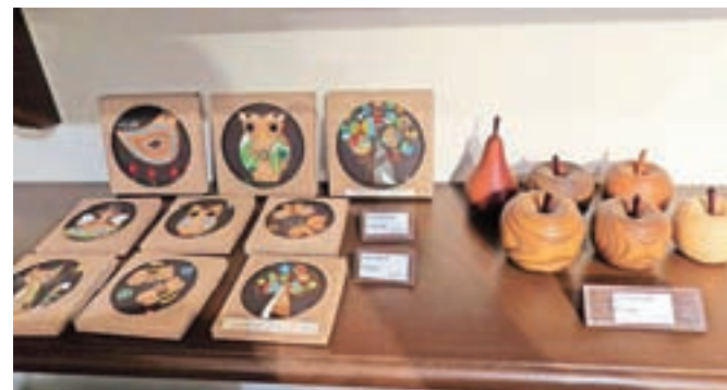
Unikatni izdelki so lahko lep spominek ali izvirno darilo.

da se večje skupine še vedno lahko odločijo tudi za vodene ogledje. Največ obiskovalcev naštejejo od začetka aprila do konca junija. Kot poudarja Oblak, je Poljanska dolina destinacija, kjer doživiš vse od kulture do kulinarike in pristnega kmečkega življenja ter iskrenega navdušenja nad vsem, kar počnejo. "To se pozna tudi v Šubičevi hiši; zgodba te hiše temelji na iskrenem veselju do ustvarjanja, ki izhaja iz narave." Lepa narava Poljanske doline je bila navdih vsem njihovim umetnikom. "Zgodba hiše ni natrpna z letnicami in dejstvi, ki jih lahko prebereš v učbenikih, ampak obiskovalcem rajši predstavimo zanimive ustvarjalne postopke tako slikarjev in rezbarjev pred 150 leti kot tudi zabavno, vsem lahko razumljivo ustvarjanje karikatur v ustvarjalni delavnici." Tako jim omogočajo vpogled onkraj vsebine slik v same postopke, ki so lahko zelo zanimivi, sploh recimo pri pozlatah, kjer se izredno tanki lističi zlata nanašajo s pomočjo čopiča. Obenem pri-