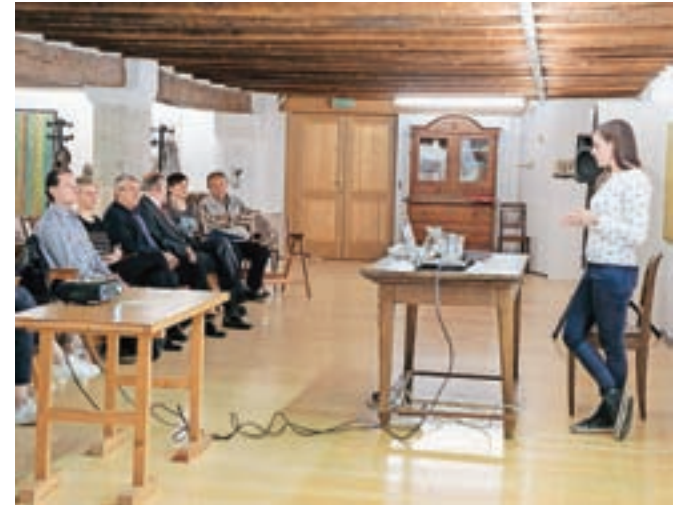
Turističnim ponudnikom so celovito predstavili Zeleno shemo slovenskega turizma.