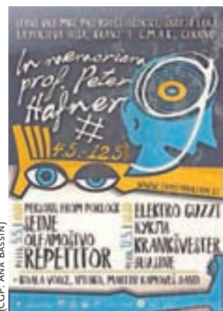
(GCP: ANA BASSIN)

Tudi letos bo festival potekal v treh memorialnih mestih. "Pred dvema letoma se je memorialnim prizoriščem