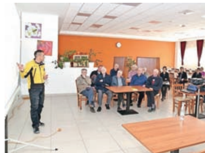
Predavanja AMD Žiri o cestnoprometnih predpisih se je udeležilo okrog šestdeset občanov.