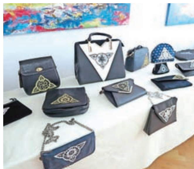
V okviru letošnjega natečaja so s čipkami okrasile torbice.