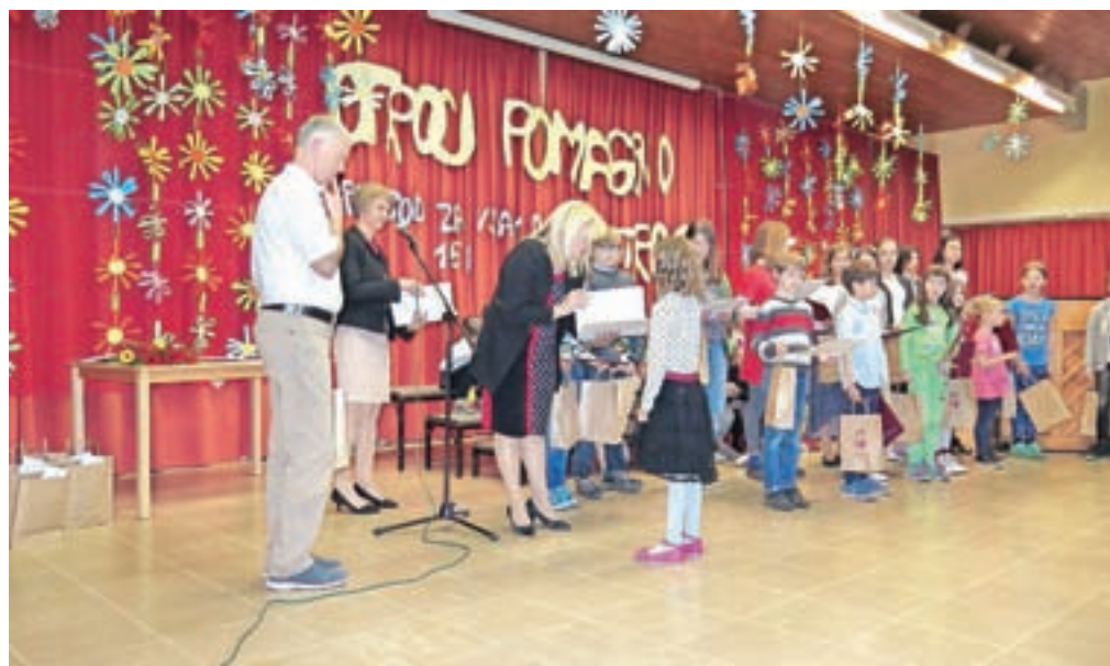
V prostorih Osnovne šole Ivana Tavčarja v Gorenji vasi so konec marca podelili nagrade v sklopu natečaja Otroci pomagajo otrokom.