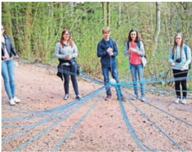
Žirovski učenci so na izmenjavi v Nemčiji raziskovali in občutili gozd.