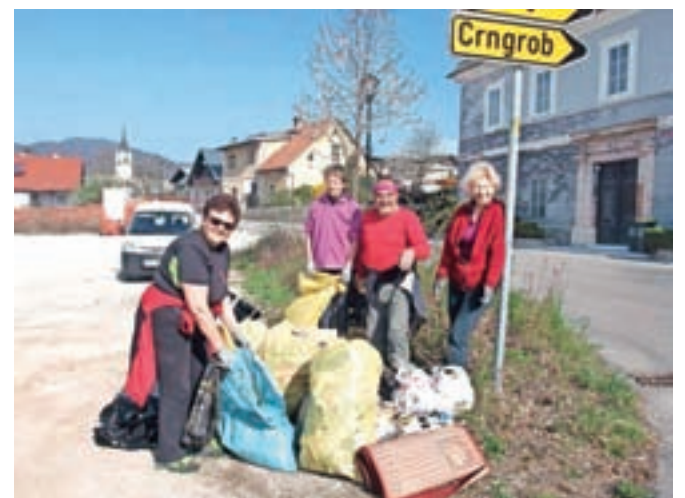
Udeleženci čistilne akcije v krajevni skupnosti Stara Loka Podlubnik so na svojem območju nabrali precej odpadkov.