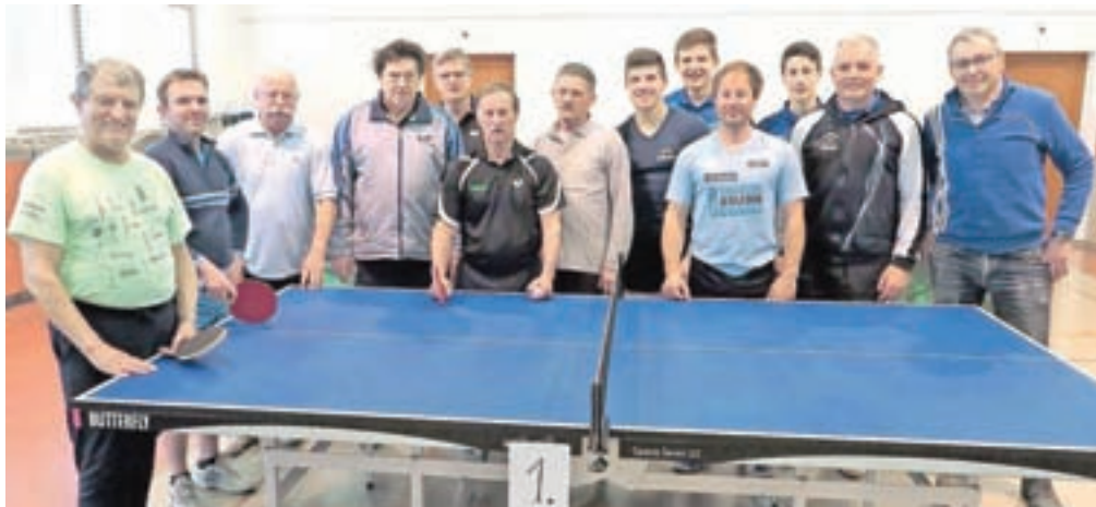
Prvi dogodek ob 50-letnici je bil namiznoteniški turnir štirih ekip.