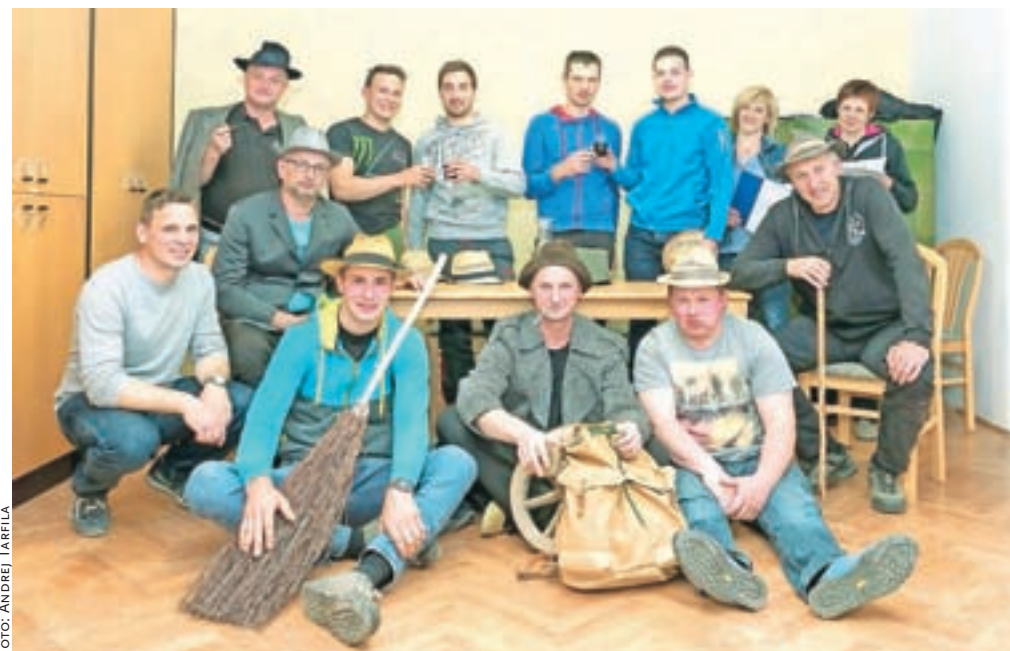
Deset let po Sveti Luciji bodo v Dražgošah znova odigrali Krekovo igro – Cigana čarovnika.