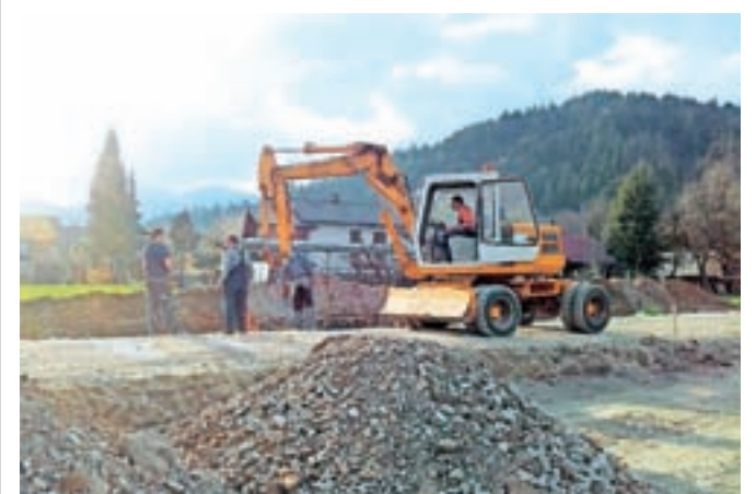
Gradnja kanalizacije in vodovoda za gasilski dom v Selcih