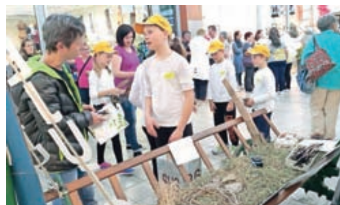
Podružnična šola Sovodenj je predstavila projekt Potujem in raziskujem.

krajšajo še s starimi pastirskimi igrami. Šola iz Javorij je predstavila projekt na temo Potujem, torej sem. V sodelovanju s Turističnim društvom Stari vrh so se lotili oblikovanja poti, ki vodi do zelo zanimive najdbe na tem območju, meteorita iz gozda blizu Javorij. Skupaj so tako zasnovali učno pot Iskanje izgubljenega koščka vesolja. V šoli na Sovodnju pa so pripravili raziskovalno nalogo z naslovom Potujem in raziskujem. Učenci so predstavili pot po Podosojski grapi preko Laniš na Sovodenj, ki so jo popestrili s spoznavanjem naravnih in zgodovinskih značilnosti ob poti ter z reševanjem nalog.