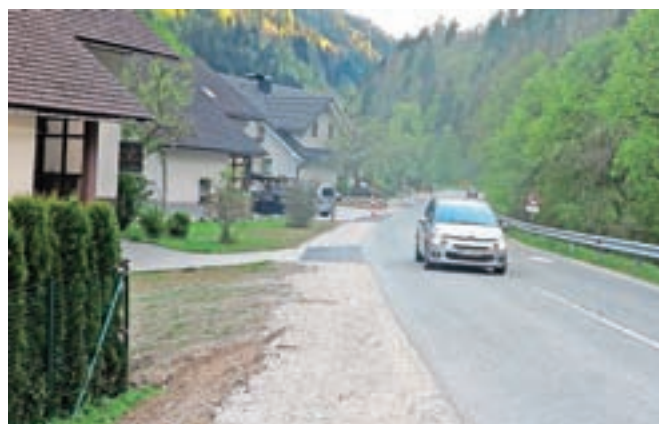
Zagotovili so tudi denar za pločnik na Jesenovcu.

Železniki – Z rebalansom so se načrtovani proračunski prihodki povečali za slabih 70 tisoč evrov na 6,2 milijona evrov, saj pričakujejo za 43 tisoč evrov več pobranega stavbnega nadomestila zaradi zajema podatkov iz registra nepremičnin, poleg tega pa so prejeli 24 tisoč evrov evropskih sredstev za projekt Europe2gether, ki ga bodo izvajali predvsem v sklopu Čipkarskih dni. Odhodke so povečali za 556 tisoč evrov na 7,14 milijona evrov. Razliko bodo pokrili z ostankom sredstev z lanskega leta v višini slabih 564 tisoč evrov, predvideli so tudi zadolževanje za pol milijona evrov, od ministrstva za gospodarski razvoj in tehnolo-