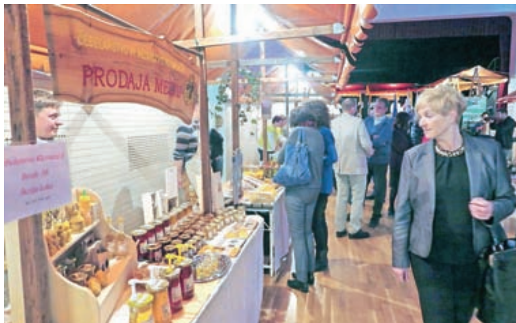
Na tržnici v veliki dvorani Sokolskega doma je 21 lokalnih pridelovalcev in predelovalcev hrane predstavilo svojo ponudbo.

V Društvu podeželskih žena Blegoš so za vse udeleženci pripravile domačo malico, delovni sestanek pa so končali s sprehodom po Gorenji vasi ter obiskom sirarn Pustotnik in Bogataj.