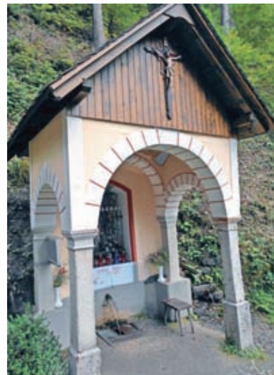
Znamenita Marijina kapelica, izpod katere naj bi tekla zdravilna voda