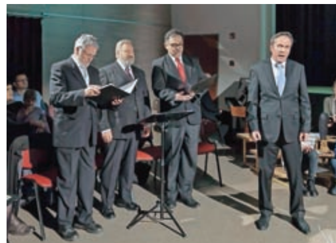
Slovesnost ob kulturnem prazniku je obogatil tudi Kvartet Obzorje.