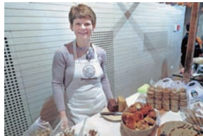
Na kmetiji Zamuda že četrto leto z nekaterimi svojimi izdelki oskrbuje osnovno šolo v Poljanah in njeno podružnico v Javorjah.