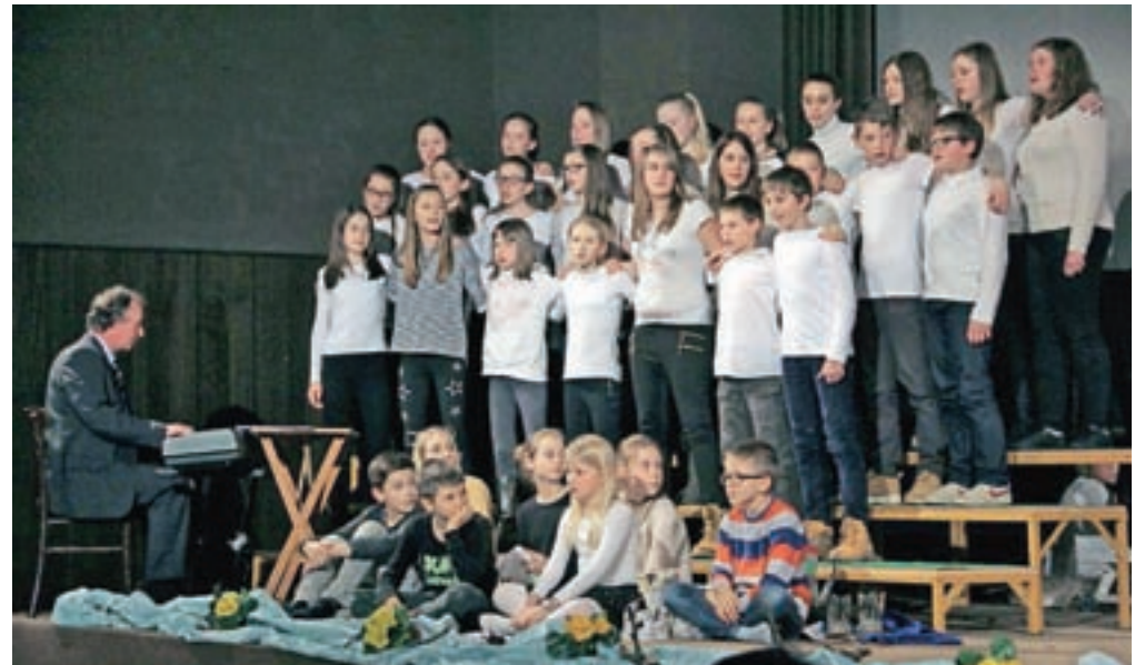
Večer so s svojim nastopom med drugim popestrili učenci Osnovne šole Žiri.