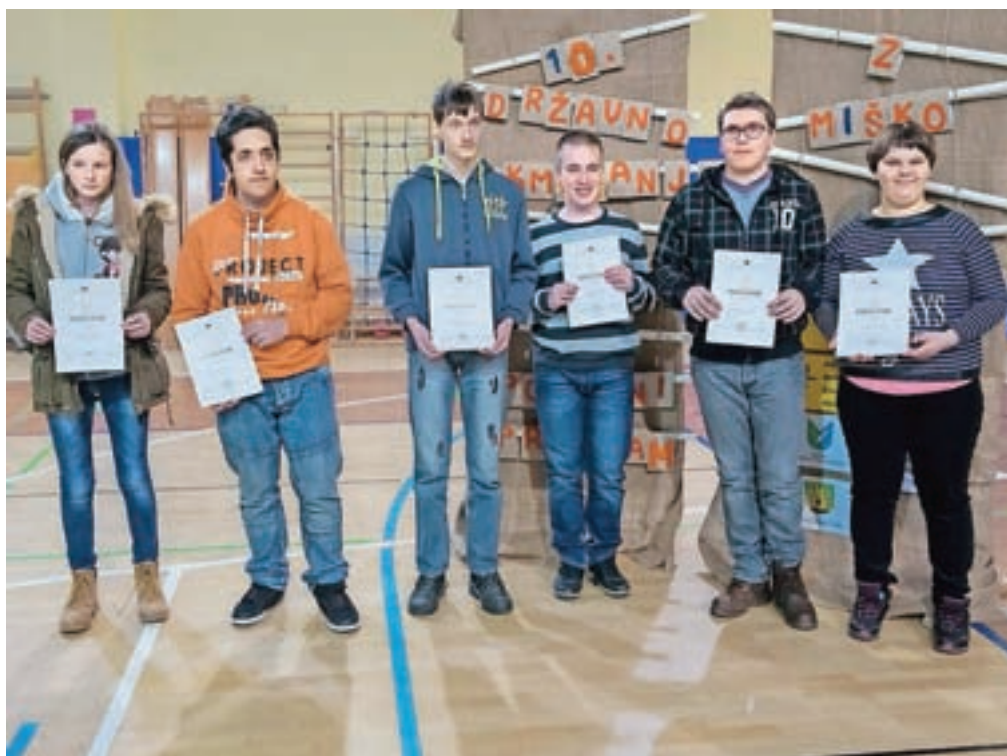
Najboljši na jubilejnem tekmovanju Z miško v svet