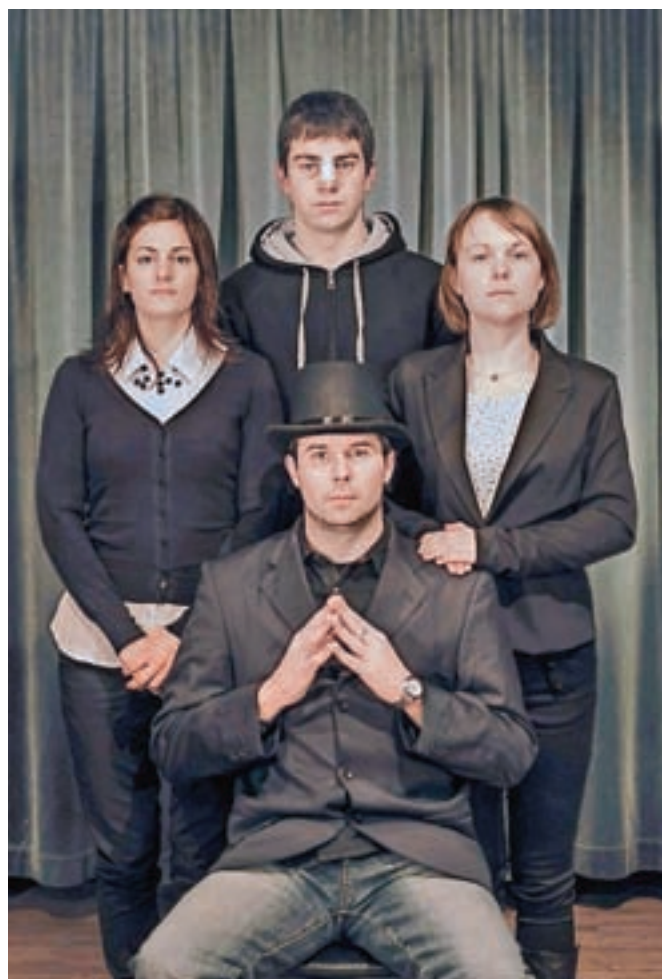
Družina Cvek iz Zapečkarjev

Štala na odru 2 pa je nadaljevanje predstave iz leta 2007,