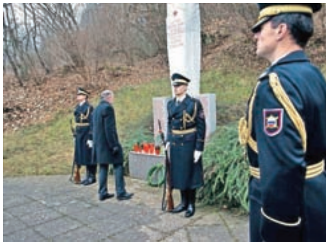
Za Kamnitnikom so počastili spomin na petdeset talcev, padlih 9. februarja 1944.

dejal govornik, ki je v svojem govoru polemiziral tudi s tistimi, ki menijo, da je bil poboj talcev nepotreben in da so ga s svojimi dejanji izzvali partizani sami. Brez partizanskega boja bi bilo žrtev še več, brez upora pa danes tudi slovenskega naroda ne bi bilo, saj bi se izpolnil Hitlerjev ukaz leta 1941 v Mariboru: "Naredite mi to deželo zopet nemško." Odpor je bil državotvorno dejanje, privedel je do zmage ob boku zaveznikov protifašistične koalicije, Slovenci pa smo tudi dokazali, da smo vojaški narod, ki se je zmožen upreti še tako močni vojaški sili. Govornik je poudaril, naj bomo ponosni na preteklost in na vrednote, ki smo jih obranili takrat in pred 26 leti, ko smo dobili samostojno državo.