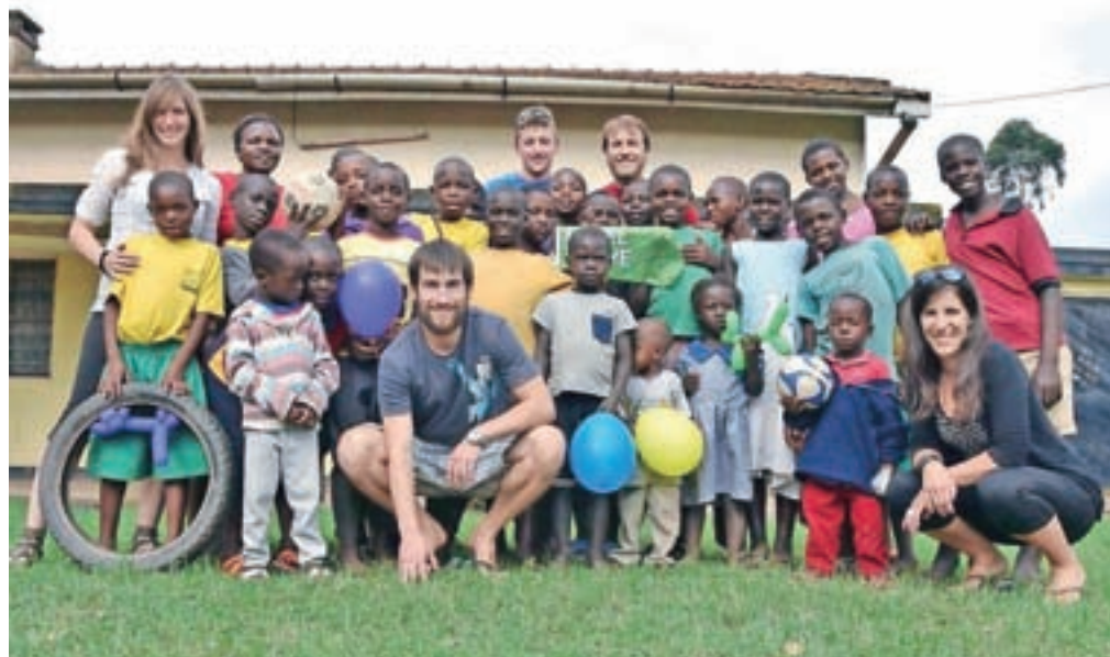
V Ugandi so delali v manjšem podeželskem zdravstvenem centru.