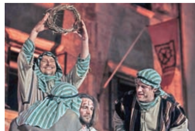
Prizor Škofjeloškega pasijona 2015