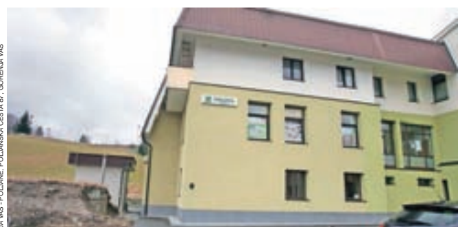
Lekarno v zdravstvenem domu v Gorenji vasi bodo iz prvega nadstropja preselili v pritličje.

išči, a doslej ni bilo zadostnega interesa morebitnih investitorjev. Zato jih veseli, da so se v Gorenjskih lekarnah odločili razširiti prostore lekarn. "Po širitvi ponudbe na področju zdravstva v Gorenji vasi se je namreč povečal tudi obisk lekarn," je razložil župan in dodal, da bo to prispevalo k še višji ravni zdravstvene oskrbe v občini. Za potrebe lekarn bodo izvedli rekonstrukcijo znotraj zdravstvenega doma in zgradili prizidek na južni strani objekta ob obstoječem servisnem vhodu lekarn ter uredili vetrolov na vzhodni strani pri pripadajočo zunanjo ureditvijo.