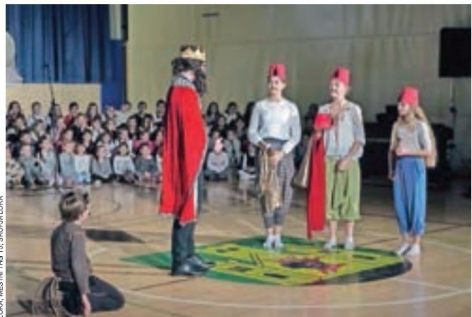
Osrednje motive predstave so nastopajoči izbrali v igri Kralj Matjaž in Alenčica.