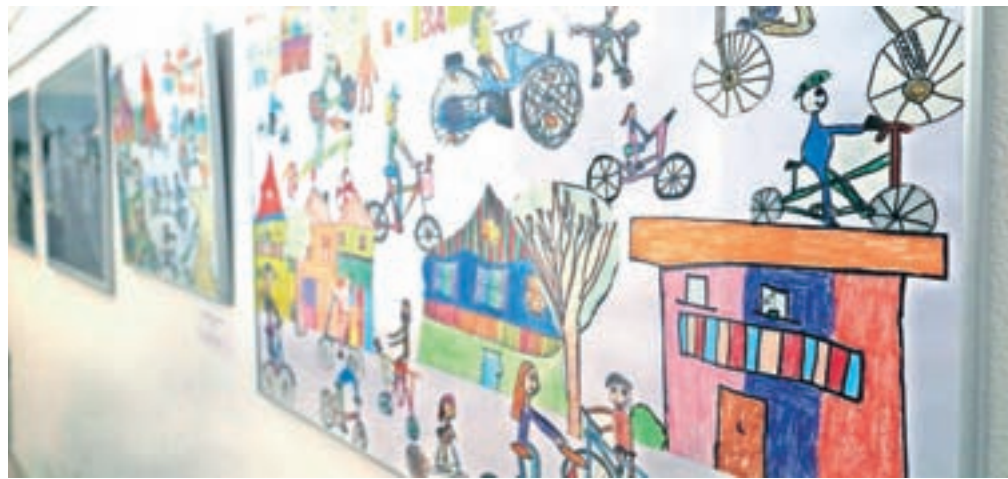
Otroška vizija prometa na razstavi v predverju občine

Škofja Loka – Kot napoveduje izdelovalec prometne strategije, bodo na voljo znatna sredstva za kolesarsko infrastrukturo, za sistem "parkiraj in se pelji", za površine za pešce, za avtobusna postajališča ... skratka za ukrepe, ki jih celostna prometna strategija predvideva pri uresničevanju ciljev trajnostne mobilnosti. Poudarek je na hoji, kolesarjenju, uporabi javnega potniškega prometa, medtem ko želi strategija motorni promet zmanjšati na račun drugih oblik mobilnosti. Možnosti za pešačenje in kolesarjenje želijo v prihodnjih letih izboljšati, zagotoviti več površin, boljše naj bo tudi obveščeno o kolesarskih in peš poteh, zmanjšale naj bi se prometne nesreče z udeležbo pešcev in kolesarjev, omogočili bi izposojno in parkiranje koles, delež kolesarjev in pešcev v prometu naj bi se že v naslednjih petih letih opazno povečal. Takšne cilje ima strategija tudi pri javnem potniškem prometu, in sicer z izboljšanjem dostopnosti in kakovosti ponudbe. Vsako leto bi uredili dve avtobusni postajališči, vozni redi naj se