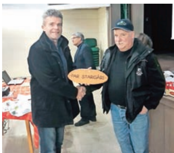
V Poljanah so sredi februarja razdelili prve tablice s hišnimi imeni.