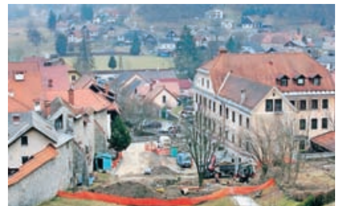
Gradnja trga pred upravno enoto naj bi bila končana poleti, dotlej bo trg tudi dobil novo ime.

Škofja Loka – Komisija za izbiro predloga za poimenovanje novega trga pred upravno enoto v Škofji Loki je januarja pozvala občanke in občane ter tudi druge prebivalce občine Škofja Loka in zainteresirano javnost k predložitvi predlogov za poimenovanje novega trga pred upravno enoto v Škofji Loki. Ta komisija je namreč na svojem prvem sestanku 18. januarja sklenila, da se izvede poimenovanje le za prostor oziroma površino pred upravno enoto Škofja Loka, ne pa tudi za stavbe ob prostoru oziroma površini. Komisija je predloge sprejemala do 20. februarja. "Prispelo je enajst predlogov in postopek zbiranja je končan. Komisija se bo sestala v prihodnjih dneh in se do predlogov opredelila. Točkvali bomo predloge in oblikovali predlog, ki bo šel na občinski svet," nam je sporočila predsednica komisije občinska svetnica Melita Rebič.