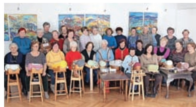
Cvetkarijade se je letos udeležilo 32 klekljaric.