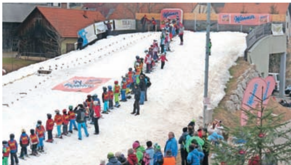
Najmlajši šolarji z Gorenjskega so tekmovali v Žireh.