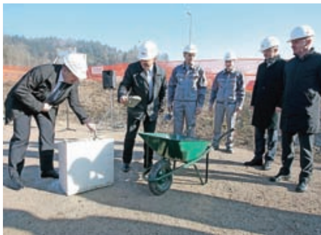
Podjetje Polycom je v Dobju začelo graditi nove proizvodno-poslovne prostore.

Gradnjo novih prostorov so v podjetju načrtovali že leta 2008, a je takrat naložbo ustavila gospodarska kriza, je priznal Stanonik in dodal, da so tokrat časi ugodnejši, saj se gospodarska rast krepi, podjetje posluje dobro in stabilno. Vzoredno s prvo fazo gradnje bodo začeli tudi z iskanjem izvajalcev inštalacijskih del, tako da bi v jesenskih mesecih lahko začeli z obrtniški deli in bi se torej po njihovih načr-