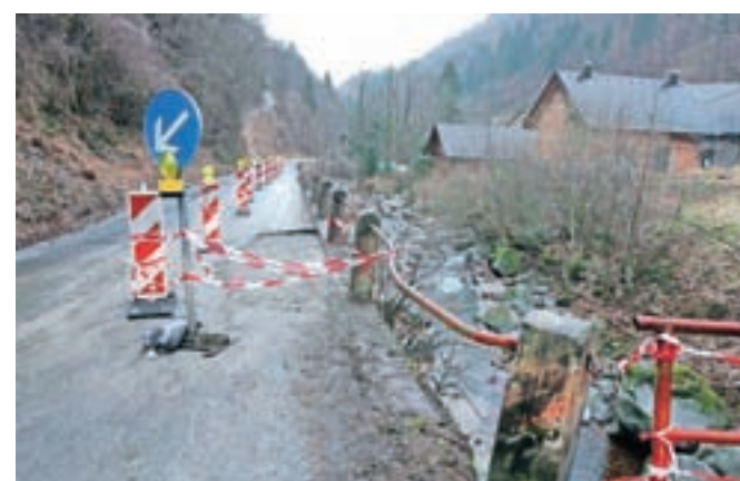
Pri direkciji za infrastrukturo načrtujejo tudi obnovo ceste od Trebije do Sovodnja.

obnove ceste do odcepa za Fužine, kjer je prihajalo do prometnih zamaškov. Obnavljali bodo tudi oporne in podporne zidove nad potokom Hobovščica od začetka vasi Sovodenj do podjetja Lesgal. Prvi del obnove se bo začel sredi leta, je po zagotovitvi pristojnih z direktije napovedal župan. Pri direkciji se obenem pripravljajo na začetek sanacije brežine na Visokem, kjer bodo po končanju del odstranili delno zožitev ceste na tem delu. Obenem pa so že objavili razpis za ureditev uvoza za Dobje, kjer bo sočasno občina uredila prometnico za varen dovoz kombijev v osnovno šolo.