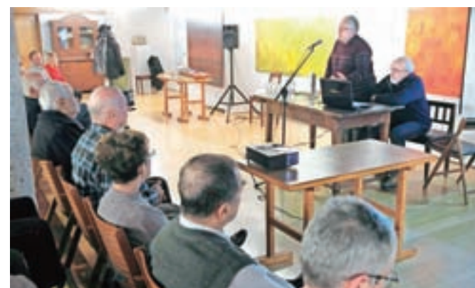
Na prvem letošnjem Blaznikovem večeru so spregovorili o botaniku Franu Jesenku.