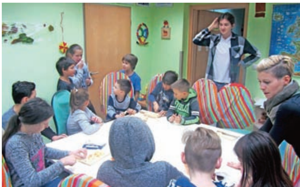
Dnevno dogajanje v dnevnih centrih...

goji za otrokov razvoj v družini, da jim pomaga pri vključevanju v socialno okolje in prepreči odklonska vedenja. "Namen vseh aktivnosti je opremljanje mladega človeka za življenje v smislu razvijanja delovnih navad, prevzemanja odgovornosti, treninga socialnih veščin. Nekaterim otrokom že priprava nezahtevne malice in pomivanje posode predstavlja svojevrsten izziv," pravi sogovornica. Tudi v mladinskem dnevnem centru Blok v Frankovem naselju s svojimi programi skrbijo, da mladi kakovostno preživljajo svoj prosti čas, se učijo, nadgrajujejo svoje znanje in veščine, pri tem pa se počutijo varne in zaželene. Prvi del popoldneva je v Bloku namenjen prostemu času, družabnim igram ali organiziranim delavnicam, v drugem delu je čas za individualno ali skupinsko učno pomoč in delo za šolo, zadnja tretjina spet organiziranim delavnicam. Tudi v tem centru nudijo svetovanje mladostnikom in njihovim staršem, ko kaj zaškriplje v šoli ali ko se pojavijo morebitne vedenjske teža-