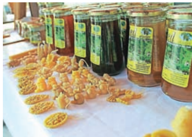
Na Medenem na Visokem so predstavili številne možnosti za ustvarjanje, ki jih ponuja med.