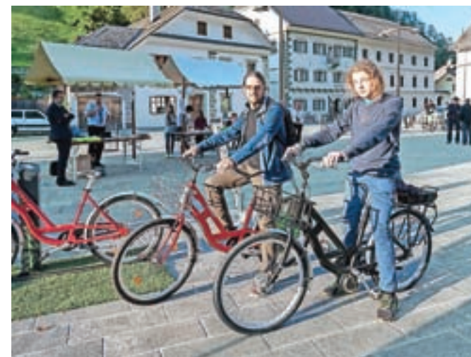
V Evropskem tednu mobilnosti je bilo možno preizkusiti tudi električna kolesa.

mobilnosti, malčki iz vrtca pri šoli pa so porisali del parkirišča ter ceste med vrtcem in šolo. Na prostoru pri plavžu in na občini je bila na ogled razstava risbic šolarjev na temo prvega šolskega dne in varnosti v prometu. Trg pred plavžem je gostil tudi sklepno prireditev Evropskega tedna mobilnosti, na njej pa so se predstavili Gorskokolesarski klub Železniki, Športno društvo Kamikaze, medobčinski inšpektorat in redarstvo, predstavili so električna kolesa ... Občane so osveščali o pomenu trajnostne mobilnosti, dobili so informacije o celostni prometni strategiji Občine Železniki, ki jo pripravljajo v podjetju Appia. Izdevalcem so lahko podali pobude na področju prometne problematike v občini, kar je bilo možno storiti tudi konec avgusta na javnih obravnavah za občane in zainteresirano javnost ter v zadnjem mesecu z izpolnitvijo ankete. V njej je sodelovalo okoli 150 občanov, med katerimi so na sklepi prireditvi tedna mobilnosti izžrebali srečneža, ki je prejel električno kolo.