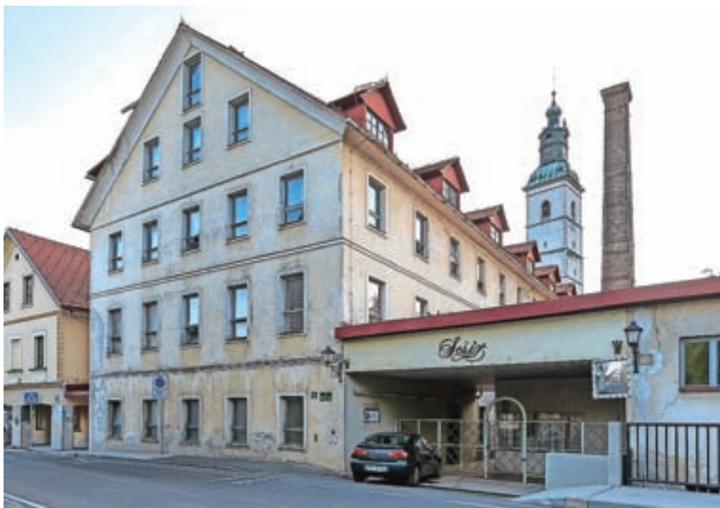
Tovarna klobukov Šešir letos praznuje petindevetdeset let in bo ob dnevih evropske kulturne dediščine deležna še posebne pozornosti.

Uvodni dogodek bo v petek, 30. septembra, od 10. do 13. ure v Sokolskem domu, kjer bodo odprli tudi razstavo likovnih del učencev in dijakov na temo oblačilna dediščina. Tega dne bodo v izložbah Mestnega trga odprli niz razstav Živa dediščina tekstilne industrije na Škofjeloškem, ki bodo na ogled vse do 20. oktobra. Poudarek bo na dediščini tovarne klobukov Šešir, ki letos praznuje 95 let. Čeprav je veliko tekstilnih tovarn v državi