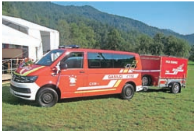
Novo gasilsko vozilo s prikolico je stalo 58 tisoč evrov. Občina Železniki je zanj prispevala 40 tisočakov, preostalo pa je zbralo društvo.