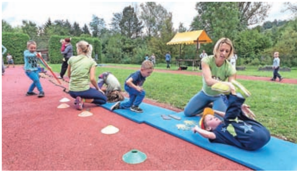
Gibalne igre vseh vrst