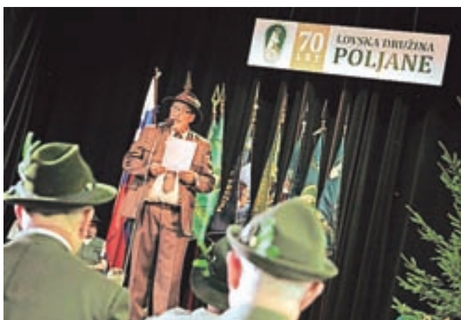
Lovska družina Poljane je v septembru s slovesnostjo v Kulturnem domu Poljane zaznamovala sedemdeseto obletnico ustanovitve.

globoko čustveno doživljanje narave. "Lov ni samo strokovno znanje, temveč tudi srčnost," je poudaril in dodal, da so del teh lovskih doživetij opisali tudi v njihovem novem zborniku, ki so