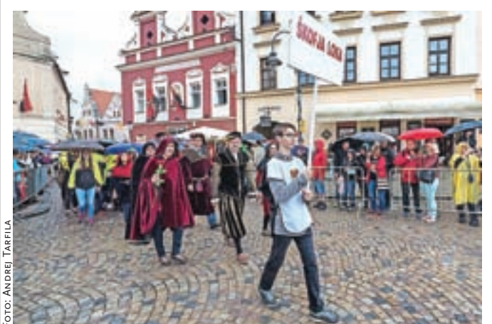
Ločani v srednjeveškem sprevodu Taborskih srečanj