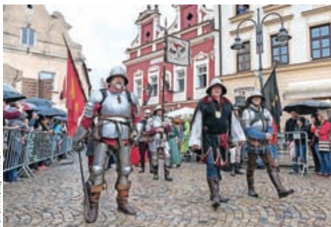
Slikoviti prizori v starem mestnem jedru češkega Tabora