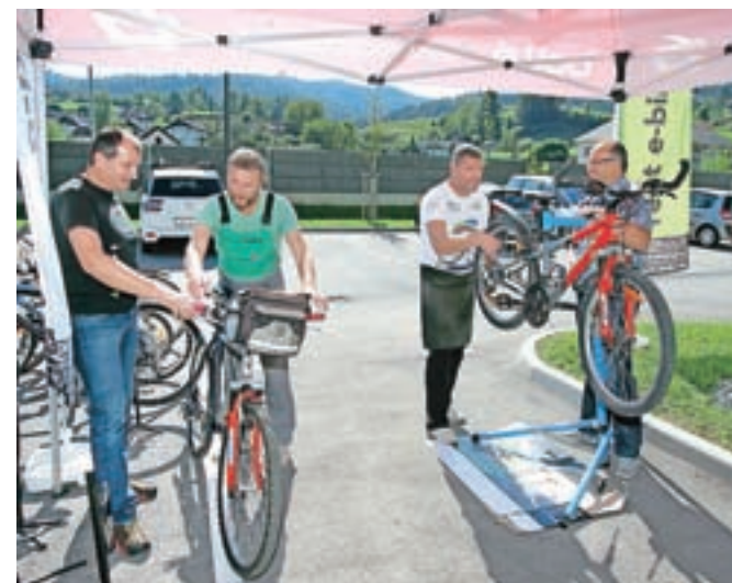
Ob tednu mobilnosti so občani lahko izkoristili možnost brezplačnega pregleda in popravila koles.