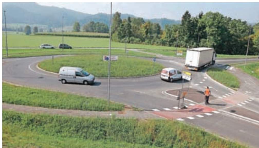
Zgrajeno je bilo tudi novo krožno križišče, kjer se dovozna cesta v industrijsko cono navezuje na regionalno cesto.