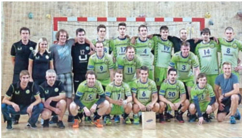
Članska ekipa rokometarjev Urbanscape Loka je letos pomladjena, a zelo ambiciozna.