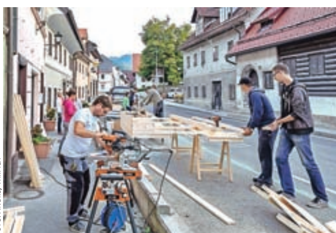
Prebivalci Lontrga pri nameščanju nove urbane opreme