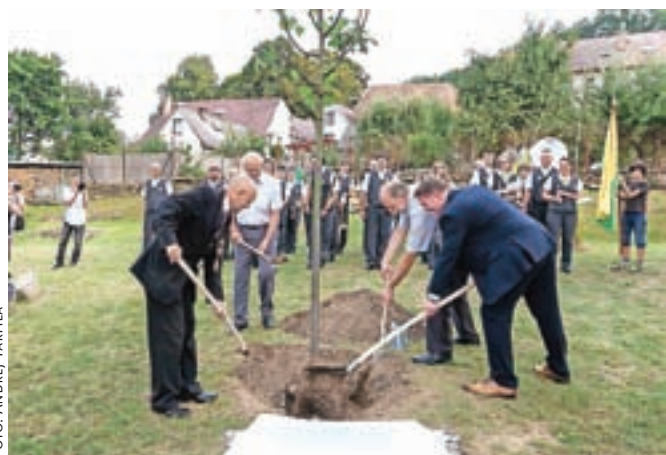
Zasadili so še eno lipo češko-slovenskega prijateljstva.

ga dogodka Taborskih srečanj, ki se je letos navkljub dežju kot vsako leto vila skoz staro mestno jedro Tabora. Na osrednjem odru na Žižkovem trgu je nastopil tudi Mestni pihalni orkester Škofja Loka, ki je svoj koncert ponovil tudi zvečer na letnem vrtu kulturnega doma Střelnice.