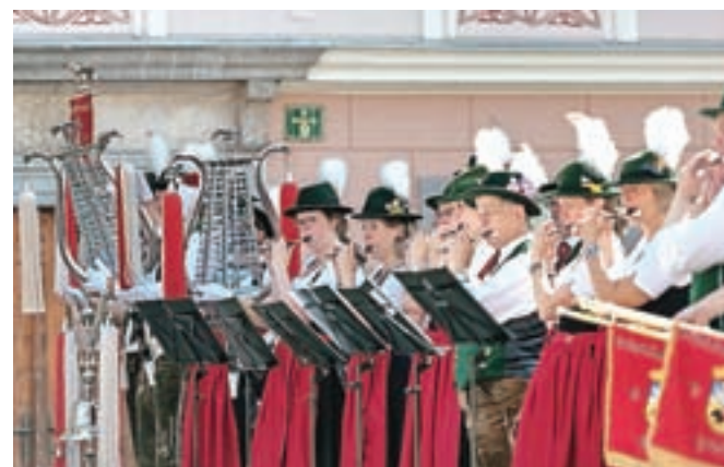
Na loškem Mestnem trgu je zaigrala tudi gasilska godba iz Freisinga.