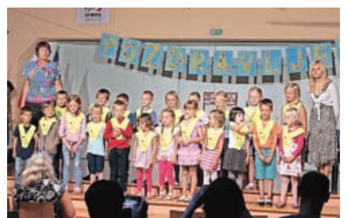
Sprejem za prvošolce v Osnovni šoli Žiri