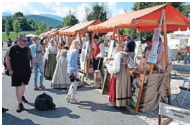
Na stojnicah v Beljaku so se predstavile kmetije iz Poljanske doline.