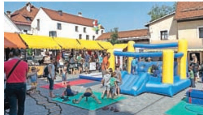
Z zadnjega LUFTa / FOTO: ANDREJ TARFILA

Škofja Loka – Loški umetniški festival LUFT spet lahko pričakujete 8. oktobra od 9. do 18. ure. Kot navaja Jerneja Stanišič, pripravljajo otroško likovno in športno delavnico ter predstavo Ti in jaz (prav tako za otroke). Delavnici bosta med 10. in 13. uro, predstava pa ob 17. v Sokolskem domu (z vstopnino). Letos so imeli že štiri LUFte, oktobrski bo peti. Obetata pa se še dva, Miklavžev in božični.