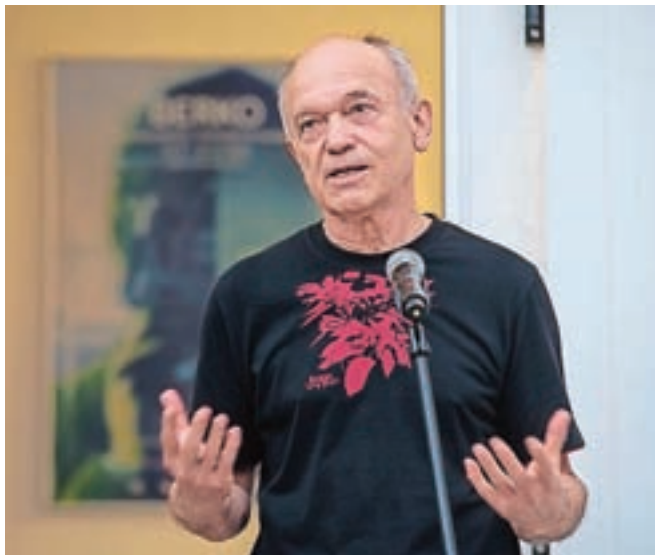
Berko velja za enega prvih in zagotovo najuspešnejših hiperrealističnih slikarjev pri nas.

Po razstavi v Kranju je od sredine septembra pregledna razstava Berkovih del na ogled tudi v galeriji na Loškem gradu.