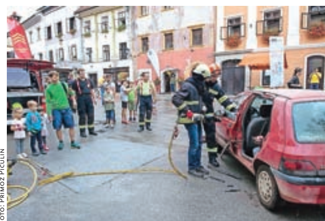
Ob dnevu trajnostne mobilnosti so se na Mestnem trgu predstavila gasilska in policijska intervencijska vozila.