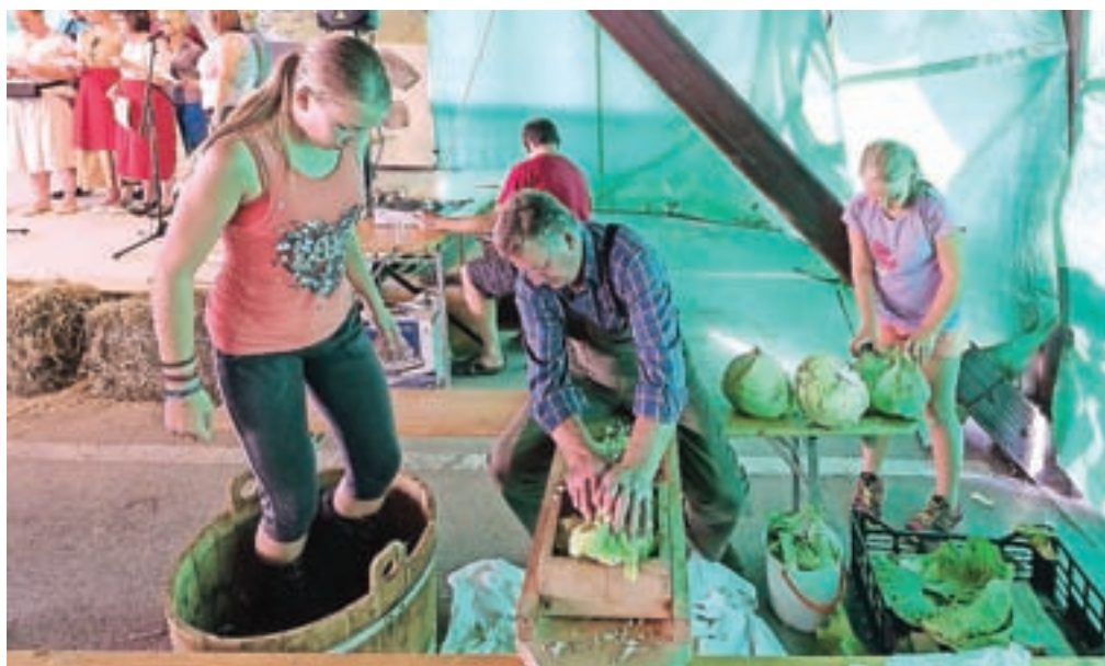
Prikazali so tudi ribanje in tlačenje zelja.