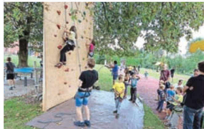
Bi si za svoj šport izbrali plezanje?