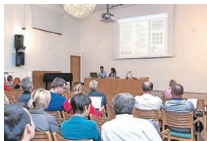
Javna razprava o celostni prometni strategiji