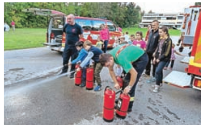
Poleg športnih so svoje početje pokazala tudi druga društva, denimo gasilci.