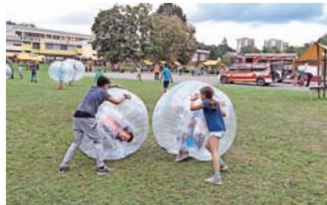
Mlade je pritegnil zorbing.