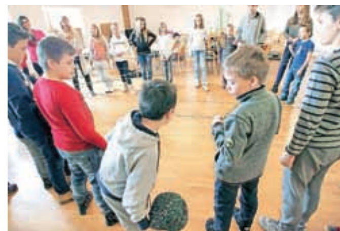
"Mreženje" mladih loških parlamentarcev