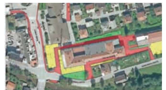
Nov režim parkiranja v središču Žirov ...

mestih morajo vozniki na vidnem mestu v vozilu označiti čas prihoda, po izteku dovoljenega časa pa vozilo odpeljati. "Pri parkiranju bo torej treba uporabljati parkirne ure ali drugače označiti čas prihoda," je pojasnila Olga Vončina. Časovno neomejeno parkiranje bo še naprej mogoče na parkirišču za Zdravstvenim domom, ob levi strani Zadržnega doma in na polovici parkirišča ob desni strani Zadržnega doma. Nad upoštevanjem pravil pri parkiranju bodo bdeli občinski redarji, kršiteljem pa grozi globa v višini štirideset evrov.