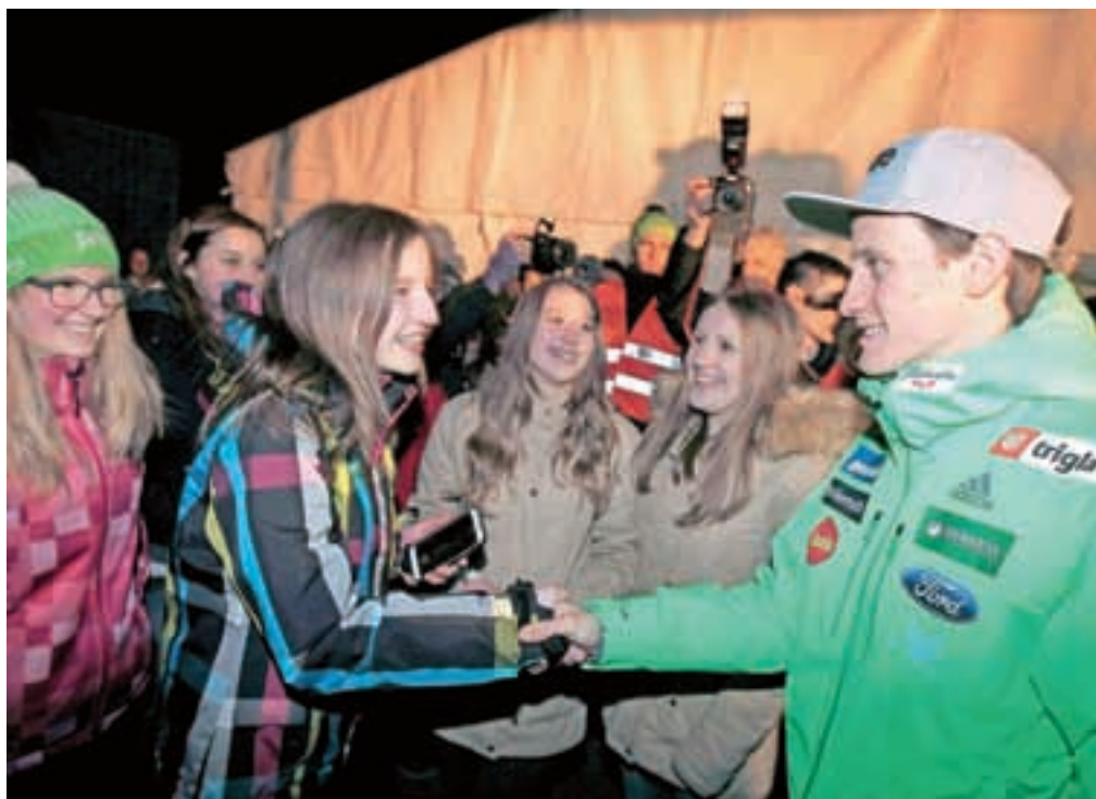
Stiski rok, podpisovanje in fotografiranje s številnimi navijači na sprejemu v Dolenji vasi

Toliko ljudi pravijo, v njihovi vasi še ni bilo. Od blizu in daleč so prišli pozdravit junaka letošnje zime. Za pripravo sprejema je skupaj stopila cela Selška dolina. Kljub