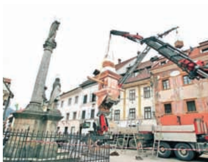
Na Mestnem trgu so na dvigalo naložili zvončnico ...