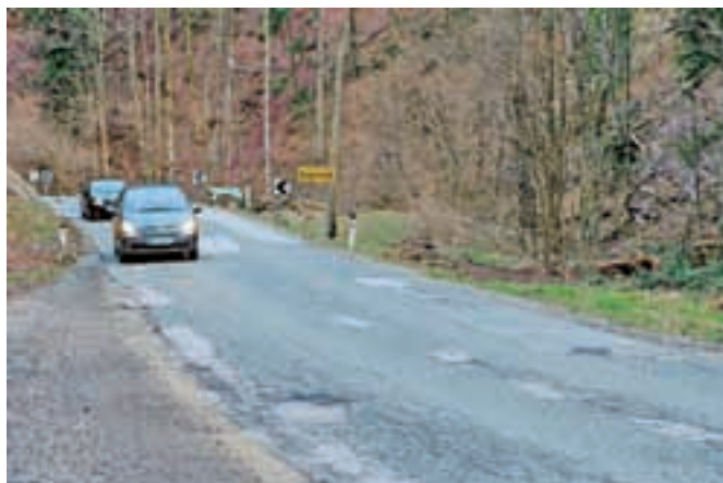
Nekatere najbolj kritične odseke na cesti proti Sovodnju so si pred časom na povabilo župana ogledali tudi predstavniki direkcije za infrastrukturo.

Po idejnem projektu, ki so ga izdelali v preteklih dveh letih, vrednost del ocenjujejo na 10,5 milijona evrov. Začetek del na prvi, slabi kilometer in pol dolgi etapi je po besedah župana mogoče pričakovati prihodnje leto, vzporedno pa bodo pripravili projekte za izvedbo del na naslednjem, malo manj zahtevnem odseku. "Na cesti proti Sovodnju bodo sicer potrebna zahtevna in posledično