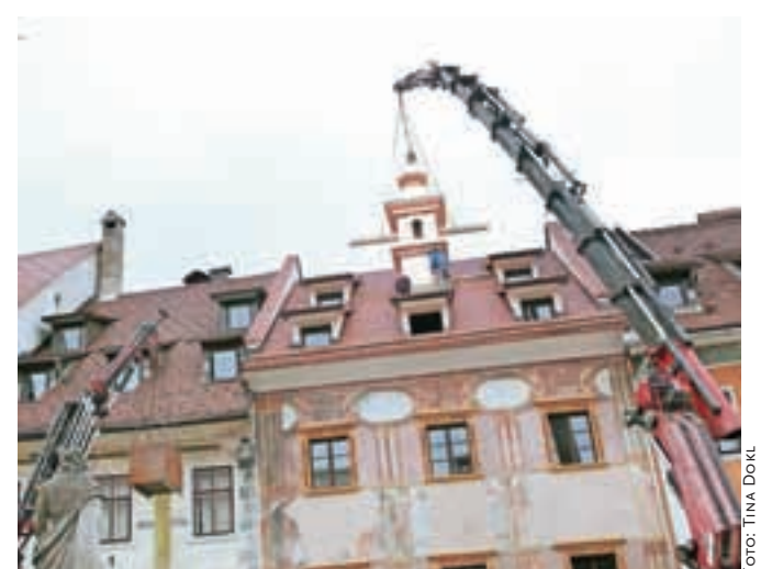
... in jo dvignili na streho starega rotovža.