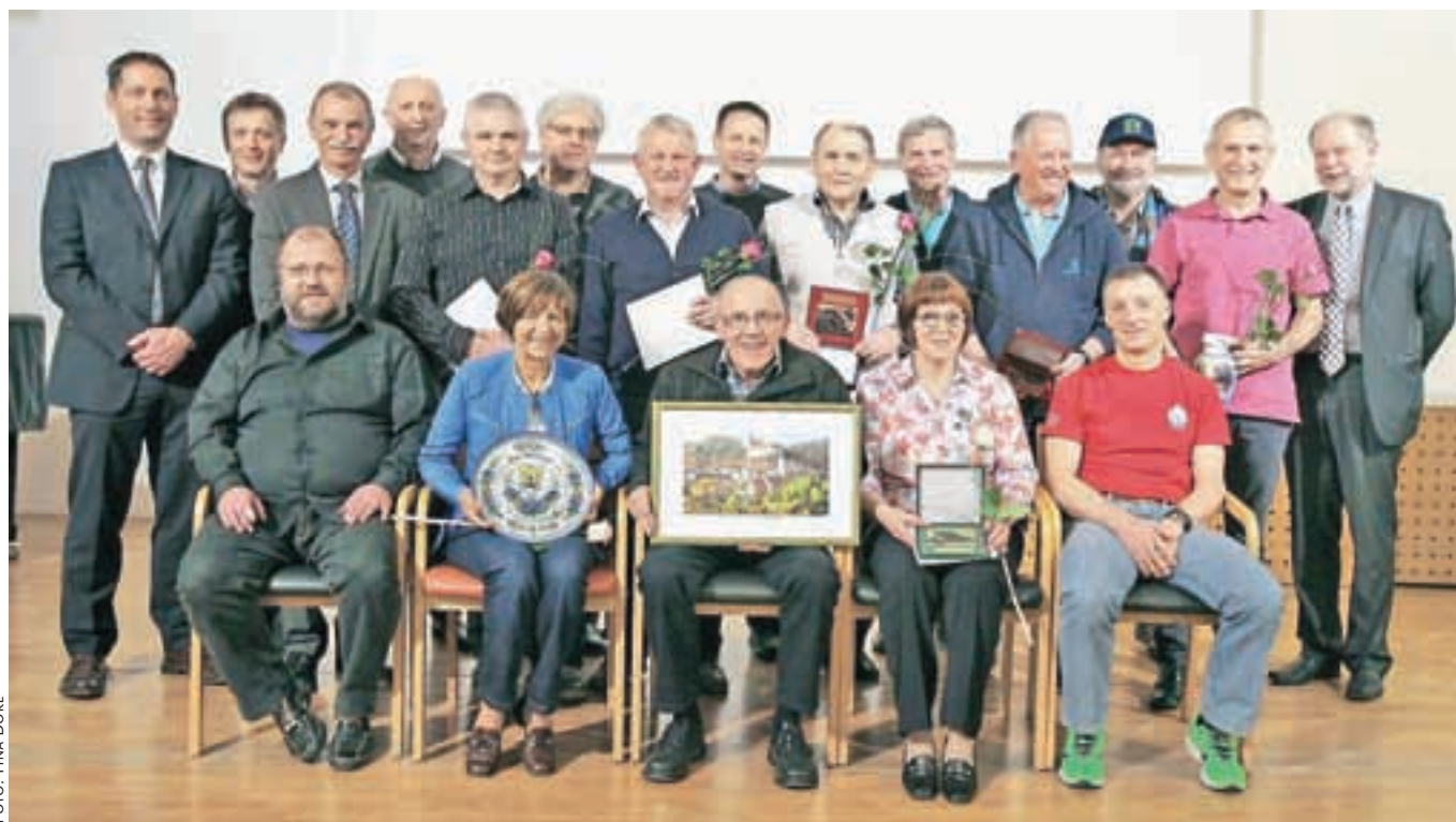
Prejemniki športnih priznanj v občini Škofja Loka za leto 2015. Zaradi drugih obveznosti se jih nekaj podelitve ni udeležilo.

Kot pravi, se letos želi udeležiti še ultra trail tekme v Vipavi, 69-kilometrsko tekmo v sklopu 100 milj Istre in svetovnega prvenstva v gorskem maratonu junija v Podbrdu.