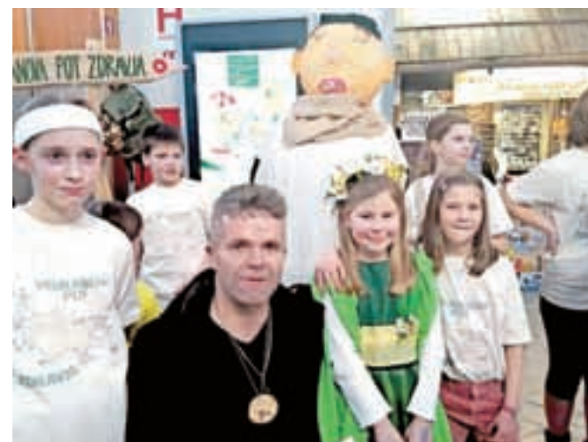
Velikan Blegaš je Podružnični šoli Javorje prinesel zlato priznanje.

Gorenja vas - Poljane – Na regijski turistični tržnici jubilejnega 30. festivala Turizmu pomaga lastna glava na temo zeleni turizem so se v začetku marca v trgovskem centru Mercator Kranj Primskovo s svojimi nalogami izkazale tudi tri šole iz občine Gorenja vas - Poljane. Obiskovalcem so predstavili programe zelenih doživetij v njihovem lokalnem okolju. Zlato priznanje in uvrstitev na zaključno državno tekmovanje so prejeli učenci Osnovne šole Poljane ter Podružničnih šol Javorje in Sovodenj. V osnovni šoli Poljane so prejeli še posebno priznanje za najboljšo turistično nalogo, v Podružnični šoli Sovodenj pa so pripravili najboljšo turistično tržnico po mnenju komisije mladih. Projekt Turizmu pomaga lastna glava predstavlja celovit sistem organiziranega delovanja osnovnošolske mladine v turizmu. Vsebinska projekta je vezana na raziskovanje turizma v domačem kraju ter ugotavljanje možnosti za hitrejši razvoj in oblikovanje take ponudbe, ki bo vzbudila podjetništvo in trženje naravnih danosti ter ostale ponudbe v vseh možnih oblikah.