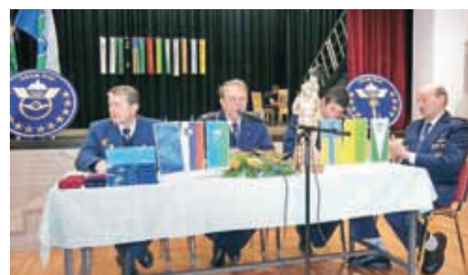
Člani ZŠAM Žiri so se zbrali na 37. letnem zboru članov.