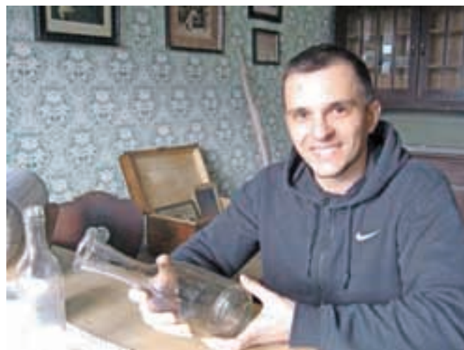
Prek odlomkov iz pisem Šubičev predmeti sami pripovedujejo zgodbo Šubičeve hiše.