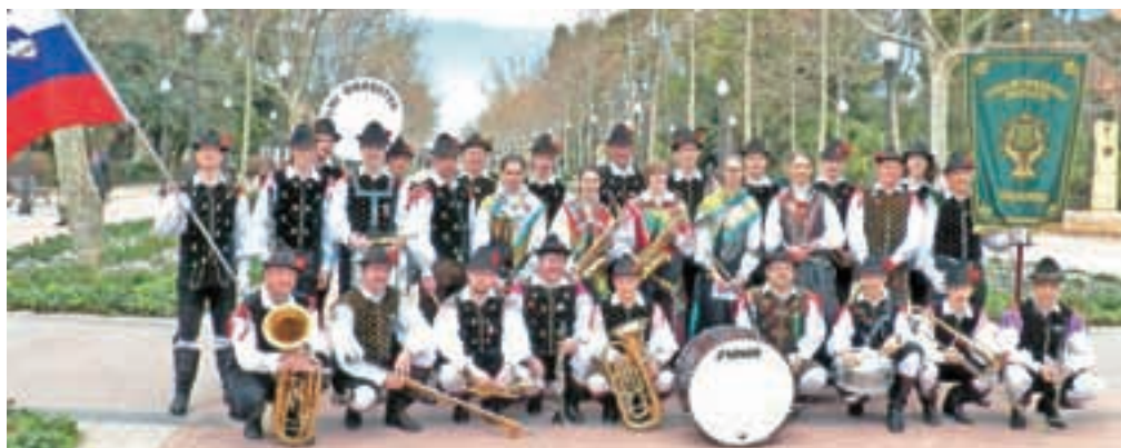
Španija je deveta evropska država, v kateri je gostoval Pihalni orkester Alples Železniki.

se polni doživetij odpravili proti domu," je pojasnil Prevč. Udeležba na Magdaleninem festivalu jim bo zagotovo še dolgo ostala v spominu. "To je bil prvi obisk Pihalnega orkestra Alples Železniki v Španiji. Tako smo na zemljevid, kjer smo že bili, vpisali še to evropsko državo, ki se je pridružila Hrvaški, Italiji, Avstriji, Madžarski, Srbiji, Franciji, Nemčiji in Makedoniji," je še dejal.