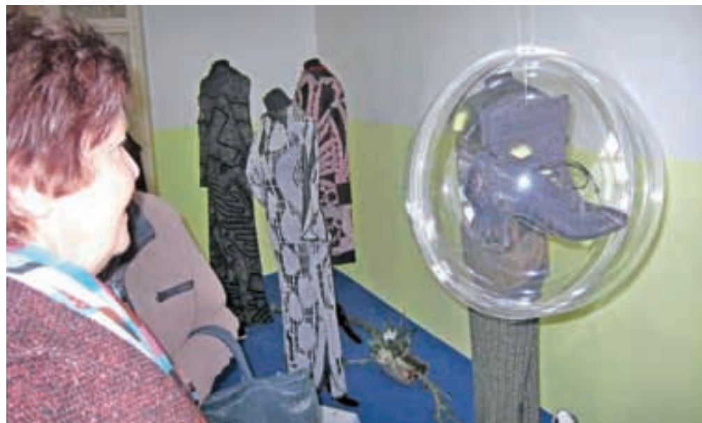
Na razstavi si je do petka mogoče ogledati čudovite klekljane izdelke.