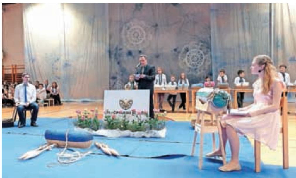
V Osnovni šoli Žiri so pripravili osrednjo prireditev ob visokem jubileju čipkarske šole.