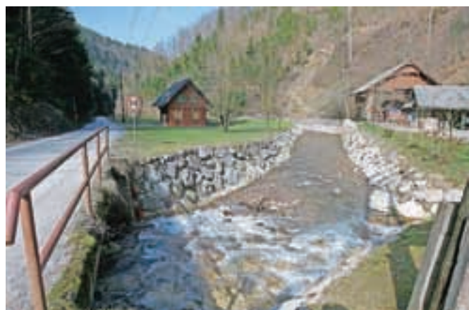
Spodnji del doline Hrastnice je po poplavih jeseni 2014 dobro urejen, morali bi urediti še zgornji del.

Sogovorniki so na novinarski konferenci na začetku marca sicer lansko obnovo v povodnji poškodovanih vodotokov, cest, mostov in druge infrastrukture ocenili kot uspešno, obnovljenega je bilo več kot prej nekaj let skupaj, cestna infrastruktura je bistveno izboljšana in boljša je tudi varnost ljudi. A da bi bila slika popolnejša, manjka še ureditev zgornjega dela Hrastnice.