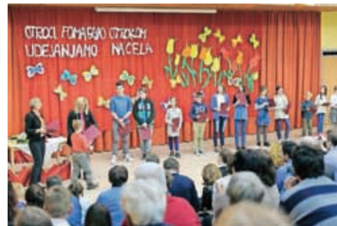
Nagrajenci letošnjega likovnega natečaja Otroci pomagajo otrokom.