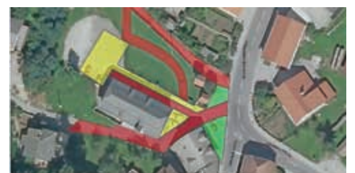
... in pri Kulturnem središču Stare Žiri.