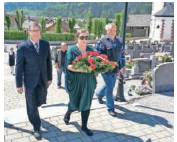
Pri spomeniku padlim v narodnoosvobodilnem boju, kjer so pokopani tudi ruski vojaki, so položili venec vsem, ki so umrli za človeško svobodo.

prebiranju izrekov o miru nagovorila misel neznanega avtorja, ki pravi: "Mir povzroča bogastvo, oholost pri naša vojno, vojna povzroči bedo, beda ponižnost, a ponižnost ponovno povzroči mir." V vsakdanjem jeziku, meni župan, bi lahko rekli tudi, da mir ni zastoj, da se je zanj treba truditi. "Zato je še posebno dragoceno, da se tega zavemo tudi ob današnji slovesnosti, ko se spominjamo 70. obletnice konca druge svetovne vojne." Za mir, je še dodal župan, naredimo največ, če ga najprej poiščemo v sebi in ga potem delimo drugim. Zato je vsem zbranim zaželel osebnega miru in moči, da se bodo pripravljene še na