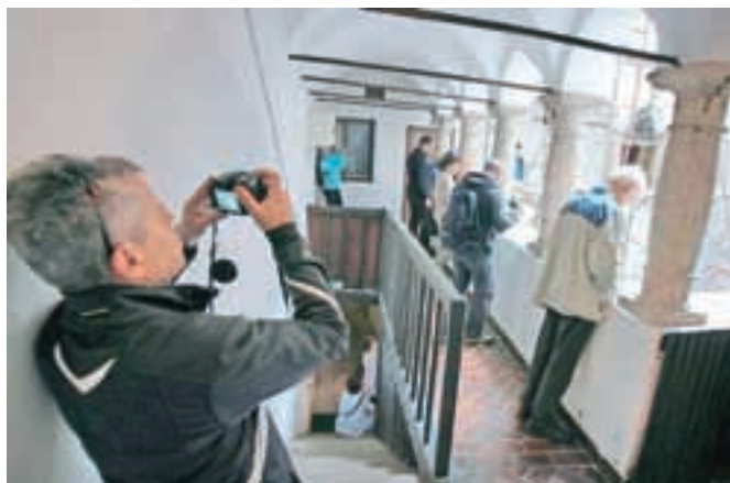
V atriju rotovža še stojijo gradbeni odri.