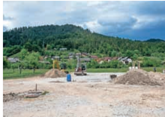
V Dolenji vasi se je pred dnevi začela gradnja športnega igrišča.