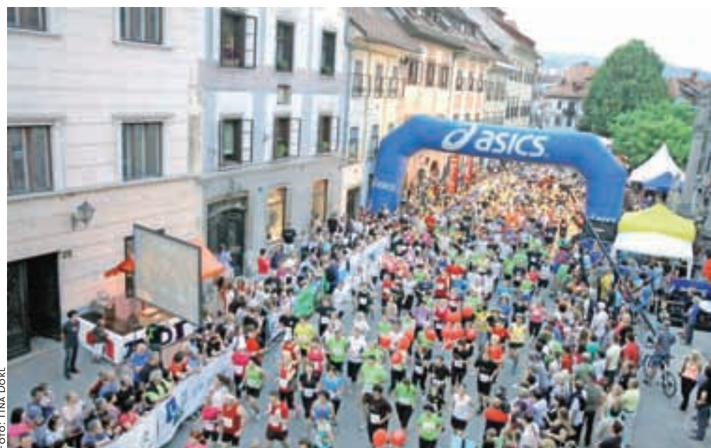
Tek štirih mostov je najbolj množična športno-rekreativna prireditev v Škofji Loki.