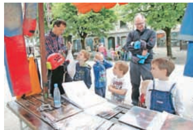
Veliko zanimanje je na stojnicah vseživljenjskega učenja vladalo za delo škofjeloških jamarjev.

Škofja Loka – V Teden vseživljenjskega učenja so se na Škofjeloškem vključili z 69 brezplačnimi prireditvami, od razstav, predstavitev, predavanj do delavnic, ki jih pripravlja 36 sodelujočih. Toliko dogodkov seveda ni mogoče izvesti v enem samem tednu, temveč so ga na Loškem raztegnili od 15. maja do 30. junija, je povedala Tanja Avman z Ljudske univerze Škofja Loka, ki koordinira prireditve. Osrednja je bila Parada učenja 16. maja na Mestnem trgu v Škofji Loki, kjer so svojo dejavnost na 16 stojnicah predstavila društva, šole in zavodi. Glavnina dogodkov je sedaj že mimo, med zanimivejšimi, ki sledijo v teh dneh, pa omenimo program Spregovorimo italijansko (rusko, češko, portugalsko) jezikovne šole Mekon, izdelavo rož iz tekstila v Centru slepih, slabovidnih in starejših v Stari Loki, tečaj orientacije in voden orientacijski pohod v naravi s taborniki Roda zelenega žirka iz Žirov, ogled Marijinega brezna z Društvom za raziskovanje podzemlja Škofja Loka in spoznavanje pozabljenih iger iz otroštva z Ljudsko univerzo Škofja Loka.