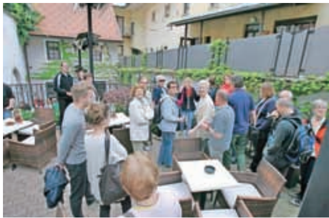
V Vahtnco smo prišli s Klobovsove ulice.