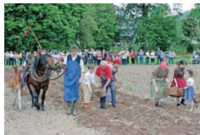
Sajenje krompirja po starem na Visokem

malica »za njivo«, ki je letos zadišala tudi beraču, zato se je ponudil, da bo pomagal pri delu. »Berači so namreč vedeli, da kjer se je delalo, se je tudi dobro jedlo,« je pojasnil Bašelj. A bolj kot delo mu je dišala malica, zato je iz ješprenja, ki so ga pripravile gospodinje, kolikor so ga posadili letos, naj bi po pričakovanjih pridelali okrog osem ton krompirja. Nekaj ga bodo sprazili na festivalu krompirja jeseni, večino pridelka pa bodo tako kot lani podarili šolam v občini.