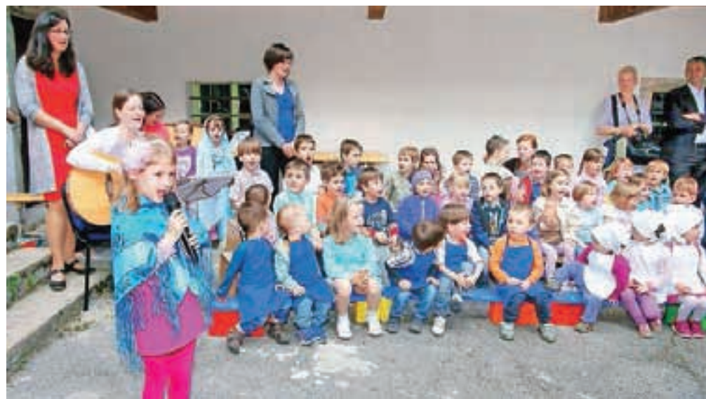
Na odprtju razstave so otroci iz Antonovega vrtca tudi zapeli in zaplesali.