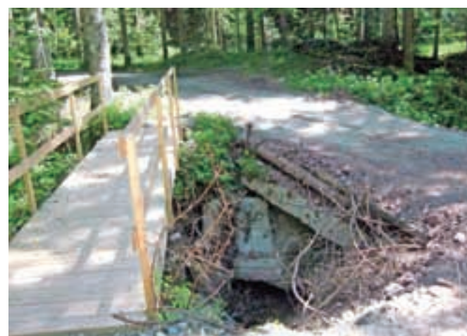
Čez potok v Plastuhovi grapi je odslej možno tudi z avtom.