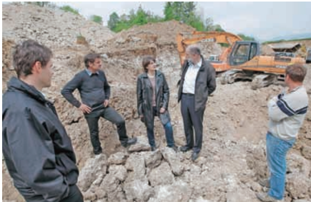
Pred prvomajskimi prazniki so pripravili teren za gradnjo južne dovozne ceste v industrijsko cono na Trati.

Gradnja južne dovozne ceste, ki jo gradijo v javno-zasebnem partnerstvu, bo vredna 1,9 milijona evrov, delež občine pa znaša približno 1,5 milijona evrov. Zaradi zahtevnosti del se je rok za izkop zemljine med cesto zahodno od Godešiča in podvozom pod železniško progo podaljšal do konca aprila, projekt pa je to tudi nekoliko podražilo. Večino