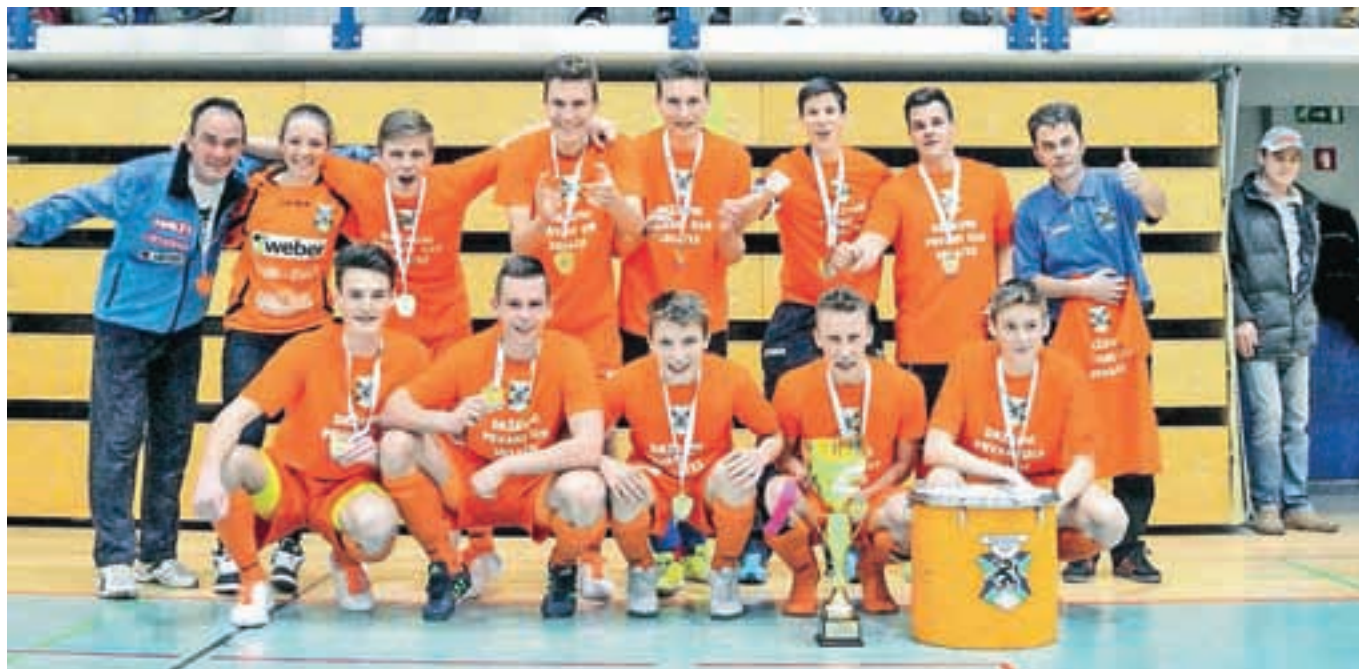
Ekipa FSK Stripy do 19 let si je z odličnimi igrami priborila naslov državnih prvakov.