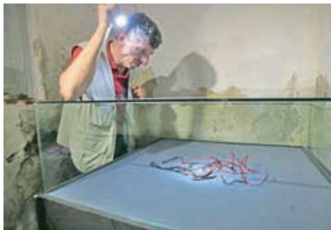
Razstavo osebnih predmetov iz Hude jame si je mogoče ogledati v soju baterijske svetilke.

sniitev dr. Tineta Debeljaka in slikarke Bare Remec Velika črna maša za pobite Slovence in Kyrie Eleison. Na sklepni koncert Komornega zbora Megaron v Nunski