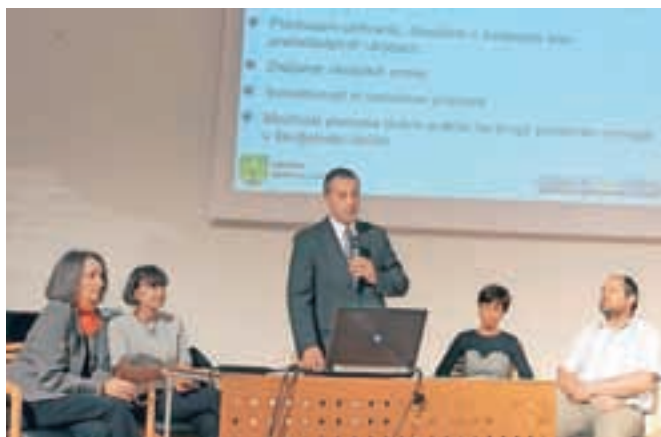
Komisija je izbirala med enajstimi predlogi.

Vrtec je v minulem letu za več kot 16 odstotkov izboljšal energetske učinkovitost (ob upoštevanju vpliva zunanjih pogojev), in to predvsem na osnovi organizacijskih ukrepov. Kažejo se tudi rezultati celostnih energetskih sanacij vrtcev Pedenjped in Najdihojca. Komisijo je dodatno prepričalo tudi dejstvo, da vrtec že majhne otroke vzgaja k varčnemu ravnanju, kar obeta, da bodo prihodnje generacije skrbnejše ravnale z viri, ki jih imamo na razpolago. Prihranki pri energiji pa niso zgolj finančni, pač pa je zaradi tega tudi manj škodljivih izpustov v okolje, kar je prav tako eno od merljivih meril iz škofjeloškega energetskega razpisa.