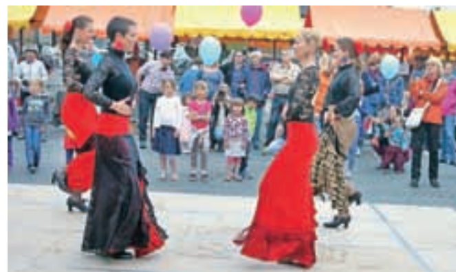
Plesalci flamenka na loškem LUFT-u

Škofja Loka – Po zimskem premoru se je 9. maja na Cankarjev trg vrnil LUFT, loški umetniški festival. Na stojnicah je bilo mogoče videti in kupiti različne unikatne izdelke zanimivih ustvarjalcev. Potekala je Zelemenjava, zamenjava semen, sadik, plodov, domačih marmelad, vložene zelenjave in podobnega. Izmenjati si je bilo mogoče tudi oblačila. Otroci so kuhali in pekli s slaščičarjem Gorazdom Potočnikom, priredili so zelo odmevno fotografsko delavnico in delavnico flamenka, s tem temperamentnim plesom pa je nastopila skupina Cora Viento. Ob dobri glasbi se je dogajalo še mnogo zanimivega, niso pa pozabili tudi na dobrodelnost: zbirali so material za zavetišča za živali. Naslednji LUFT bo spet kmalu popestril mestne ulice.