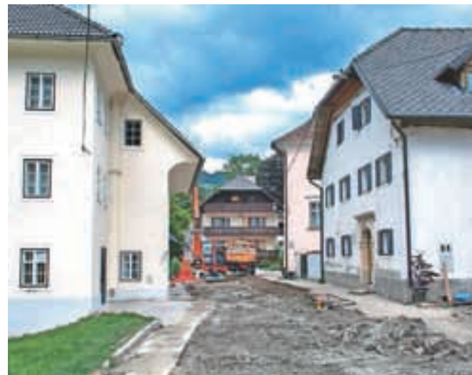
Gradnja komunalne infrastrukture na Racovniku, kjer bodo poleg vodovoda zgradili tudi kanalizacijo ter položili električni kabel in optiko.

Vodovod pa so že zgradili od vrtine na Jesenovcu proti hišam Na plavžu. "Na tej trasi je prišlo do sprememb, saj bo del speljan po javni cesti, del pa ob njej, hkrati pa bomo za te hiše gradili kanalizacijo, izvajalec bo prav tako Zidgrad," je razložil župan. Z vodovodom naj bi do Tehtnice prišli do konca meseca, s kanalizacijo pa nekoliko kasneje. "Na Rudnem so dela v grobem že zaključena, zaključujejo se tudi na Tr-