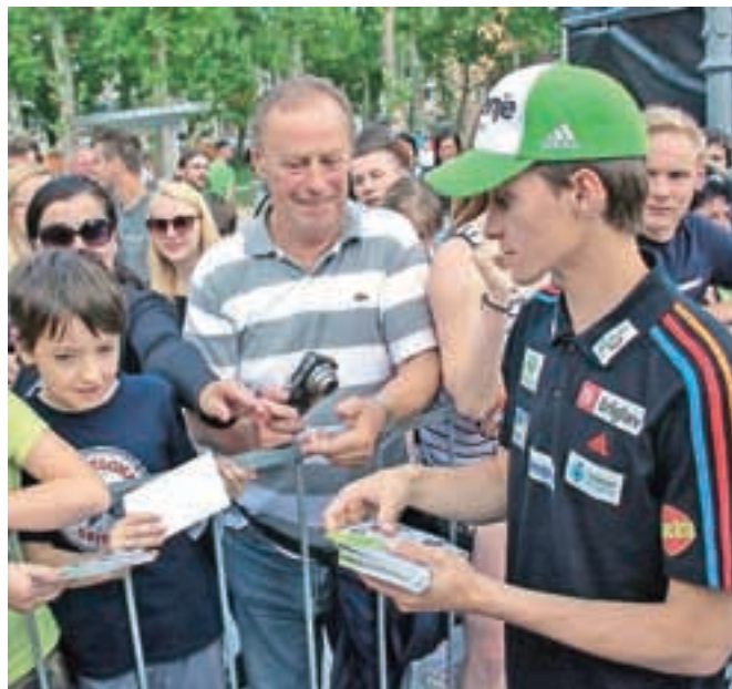
Peter Prevc je navijačem delil slike.

med zvezdniki tudi na sklepni prireditvi smučarske sezone na ljubljanskem Kongresnem trgu, ki so jo pri Smučarski zvezi Slovenije pripravili minulo sredo. Peter Prevc, ki si je po končani sezoni vzel nekaj časa za počitnice in odpotoval čez lužo, se zdaj že pripravlja na novo zimo, vmes pa si je nekaj časa vzel tudi za navijače.