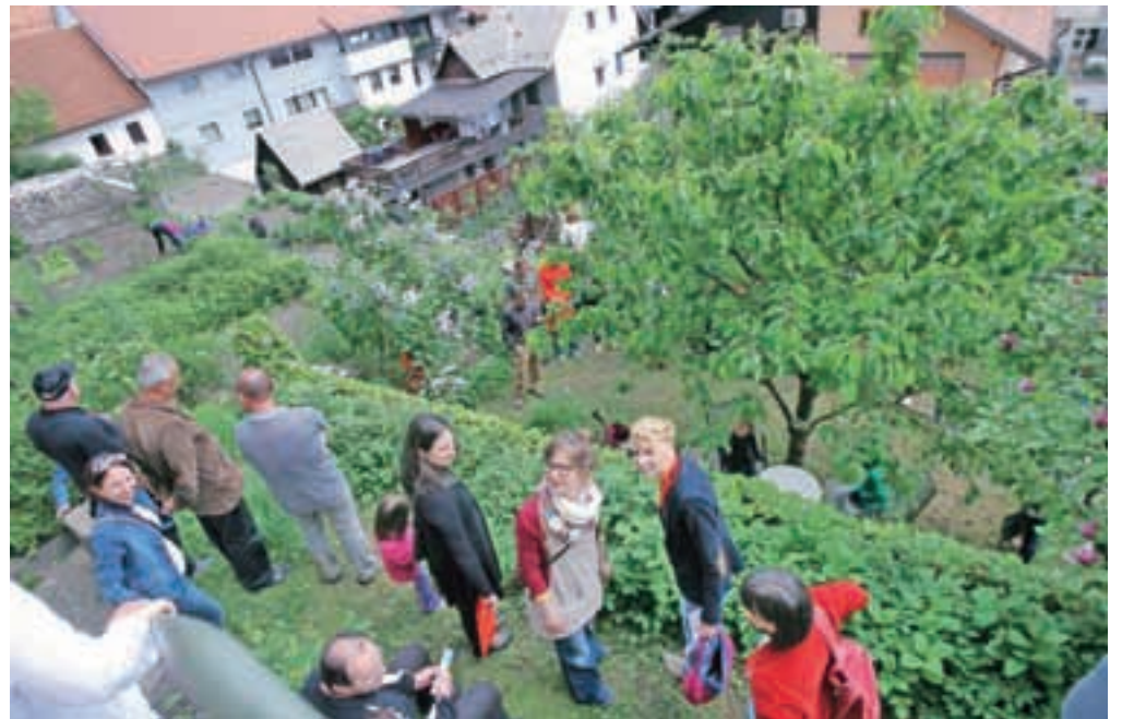
Za vrati hiše na Mestnem trgu se skriva vrt v terasah.