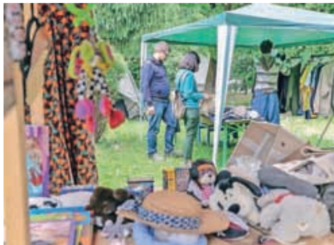
Uspešna prva Izmenjevalnica v Škofji Loki

leta 1999. Tako vas ob zaključku leta vabijo na razstavo, ki je nastala izpod prstov otrok. Mentorice otroških delavnic so bile letos Ema Nunar, Gaja Panjtar in Eva Knific. Odprtje bo 12. junija ob 17. uri, razstavo pa si boste lahko ogledali vse do 9. julija.