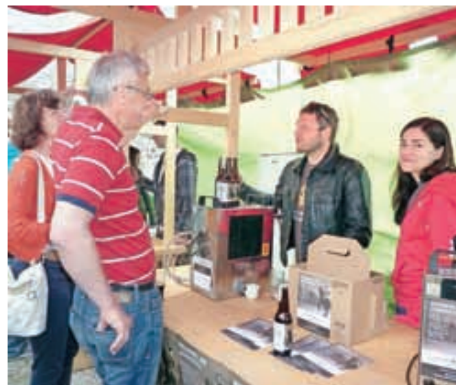
Za pivo je bilo med Ločani veliko zanimanja.