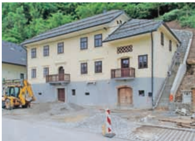
Konec junija bodo uradno odprli prenovljene prostore Kulturnega centra slikarjev Šubic, okrog katerega ta čas urejajo tudi okolico.