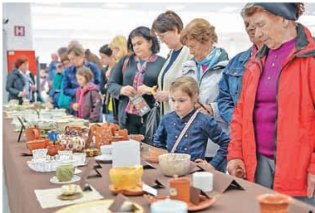
Razstave so bile tudi letos prava paša za oči.