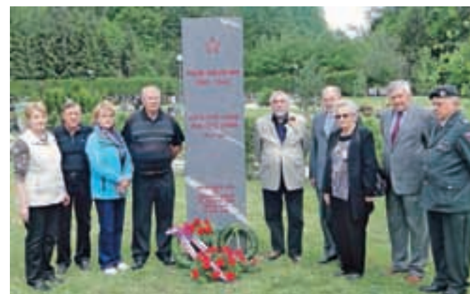
Na skupnem grobu padlih borcev NOV

To je bila osvobodilna vojna in hkrati revolucija, ki so jo partizani razumeli kot boj za pravičnejše družbenoekonomske odnose, je menil Žakelj. Spregovoril je tudi o povojnih pobjah in o etičnem problemu te tragike, ki je bil v tem, da ni bilo časa za sodne postopke ter da so bili pokončani poveljniki nedolžni