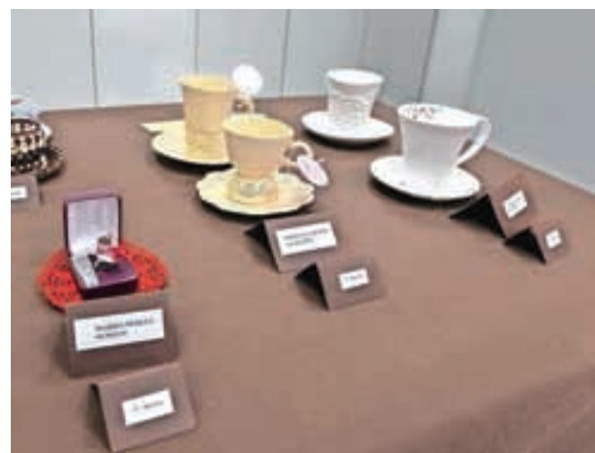
Nagrajene skodelice z natečaja Skodelica kave, ki so ga letos pripravili prvič.