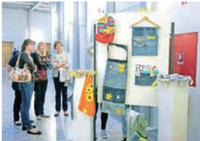
V Vrtcu Škofja Loka varčujejo tudi tako, da zbirajo in predelujejo rabljen tekstil.

letih privarčevala za trideset odstotkov pri energiji in specifični emisiji CO 2 , opazen je prihranek pri električni energiji, posebno pohvalo pa si zaslužijo za izrabo odpadne toplote, saj za ogrevanje deset tisoč kvadratnih metrov površine ne uporabljajo nobenega drugega energenta, razen odpadne toplote tehnoloških procesov. Tak koncept so razvili med prvimi v Sloveniji.