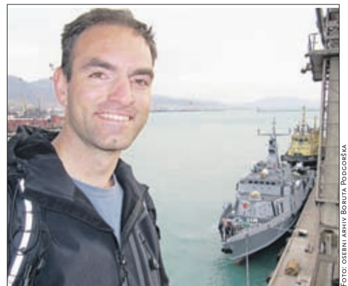
V Novorossiysku ob Črnem morju, v ozadju ladja Triglav