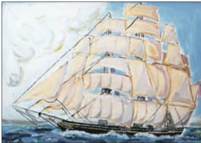
Lansko poletje je jadrnice začel tudi slikati.