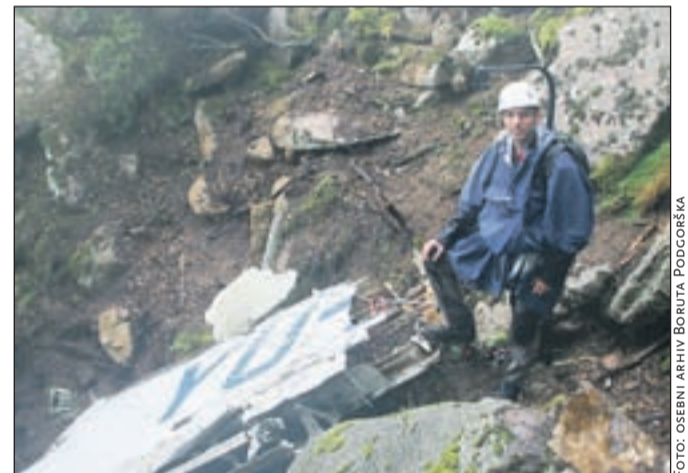
Pri odpravljanju razbitin slovenskega letala na Korziki