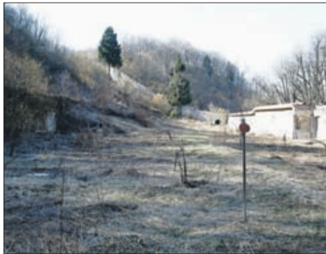
Sedanje stanje na Nunskem vrtu

Kako bo urejeno parkiranje na Nunskem vrtu? Miloš Bajt odgovarja, da bo zavarovano z zapornico, stanovalci pa bodo imeli kartice, ki bodo odpirale zapornice. Parkiranje ne bi bilo povsem zastoj, pač pa bi uporabniki plačali 100 evrov na leto, kar se sobesedniku ne zdi pretirana vsota za celoletno parkiranje.