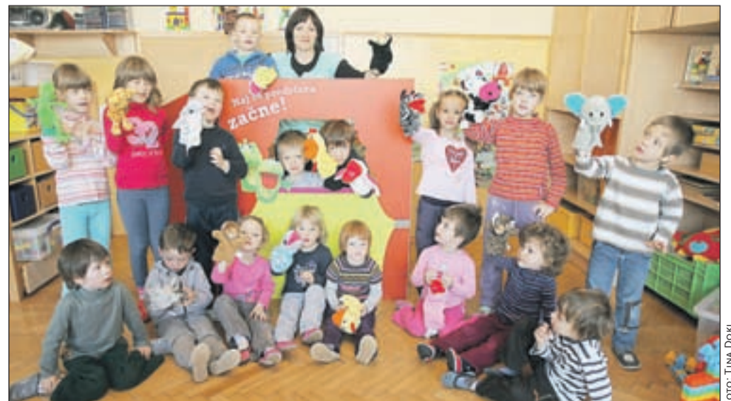
Otroci in vzgojitelji v oddelku Tinka Tonka v Retečah so se mini gledališča zelo razveselili.