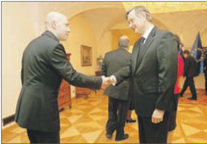
Prešernovim nagrajencem in nagrajencem Prešernovega sklada je na posebnem sprejemu čestital tudi predsednik države dr. Danilo Türk.

ga poklica. Ob tem razume trenutek in spoštuje tradicionalna izhodišča okolja, v katerem deluje in v katerega se neprestano vrača. Tako s svojimi vrhunskimi in do najmanjšega detajla celovito oblikovanimi izdelki popolnoma zadovolji končnega uporabnika kakor tudi proizvajalca," je bilo med drugim povedano v obrazložitvi k njegovi nagradi. Za svoje oblikovalske projekte je prejel številna mednarodna priznanja in nagrade, tri predstajne nagrade Red Dot Award v Nemčiji ter dve nagradi Good Design Award v ZDA. S svojimi oblikovalskimi rezultati na področju tekaške in smučarske opreme si je letos prislužil nominacijo za najvišje priznanje Design Award of the Federal Republic of Germany.