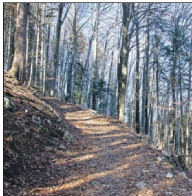
Del poti skozi bukov gozd