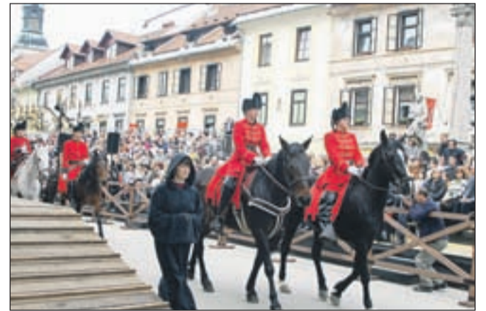
Eden od prizorov Škofjeloškega pasijona 2009

in gostitelji iz Škofje Loke razpravljali o vključevanju lokalnih skupnosti v turistični in kulturni razvoj mest, o izzivih prostovoljstva pri ohranjanju kulturne dediščine, o sodelovanju in povezovanju pasijonskih krajev. Škofja Loka bo pasijonski utrip v petek podoživela s prihodom pasijonskih konjenikov, mednarodno konferenco pa bo spremljalo še nekaj kulturnih dogodkov. Poleg že omenjene razstave Slovenski pasijoni, ki bo v dneh konference v Sokolskem domu, nato pa se bo do 3. maja preselila v pasijonsko pisarno na Mestnem trgu, bo v mali razstavnici galeriji občine od 15. marca do 3. maja tudi razstava Kapucinske knjižnice Processio Locopolitana . Pripravljajo tudi dva koncerta, in sicer 18. marca ob 19. uri v cerkvi sv. Jurija v Škofji Loki in 19. marca ob 19. uri v kapeli Loškega gradu. Projekt financira Evropska unija. Konferenca je postavljena v postni čas in je ena od pri-