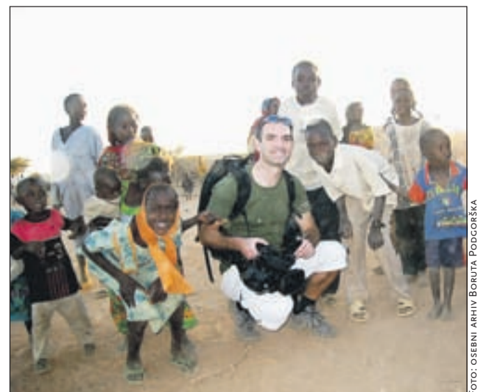
V družbi črnskih otrok v Čadu