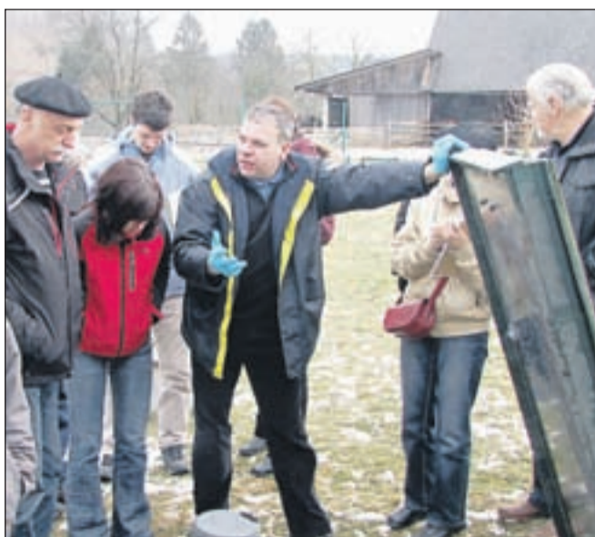
Sodelavci projekta so si pred kratkim ogledali rastlinsko čistilno napravo za endružinski objekt na Zgornji Dobravi.

V sklopu projekta bodo sodelovali tudi učenci podružničnih šol v obeh občinah, ki bodo pod mentorstvom učiteljev in članov strokovne ekipe izvedli poskus ali sodelovali na delavnicah na temo varovanja voda. "Naš namen je dolgoročno zagotoviti ustrezno čiščenje odpadnih komunalnih voda, med drugim tudi zaradi vedno strožje okoljske zakonodaje. Velik delež ljudi na teh območjih obveznosti, ki