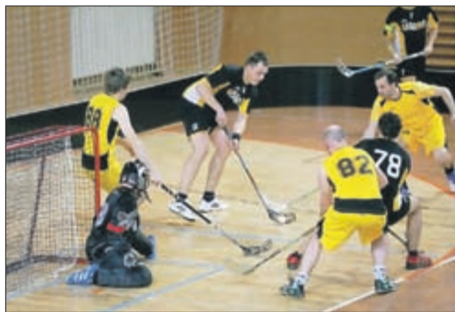
Igralci Insporta (v temnejših dresih) so na prvi polfinalni tekmi po hudem boju vendarle strli odpor žilavih Žirovcev.

Zelenci Kranjska Gora. Ekipa so prvi polfinalni tekmi že odigrali. V dvorani Poden so bili prepričljivejši Ločani, ki so sicer povedli, nato pa je Žirovcem uspelo izenačiti. Tekma je bila enakovredna vse do zadnje tretjine, ko so Škofjeločani preštetali mrežo nasprotnikov in slavili z 10:2. Bolj izenačen je bil prvi polfinale v Ljubljani, kjer je ekipa Olimpije morala priznati premoč Zelencev, ki so slavili s 5:9. Povratni tekmi naj bi moštva odigrala ta teden, za uvrstitev v veliki finale pa bosta potrebni dve zmagi.