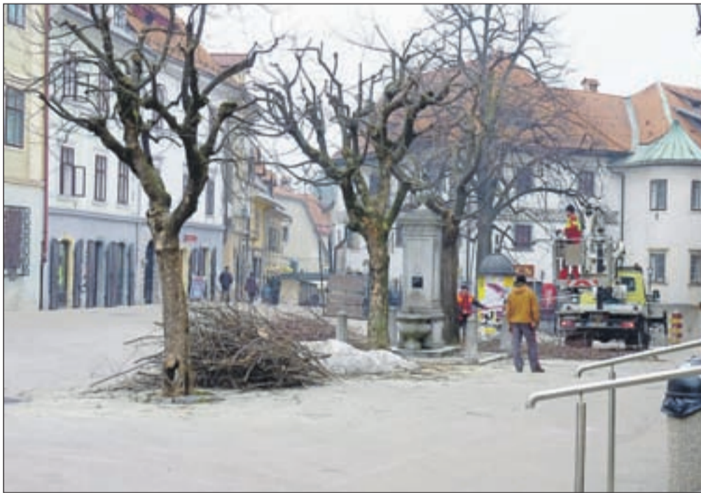
Spomladansko "pomlajevanje" mesta

Že v soboto, 26. marca , bo na celotnem območju občine Škofja Loka potekala spomladanska akcija čiščenja in urejanja okolja. V četrtek, 31. marca , ji bo sledilo predavanje kluba Gaia o sodobnih trendih ocvetličanja balkonov in teras. V petek, 1. aprila , se začne akcija Vsi na avtobus, s katero želijo mestno avtobusno linijo približati občanom in jo s precej nižjo ceno ter povečano frekvenco voženj narediti bolj privlačno uporabnikom. V soboto, 2. aprila , bo na škofjeloškem Mestnem trgu