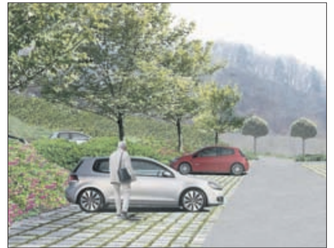
Takšna naj bi bila hortikultura ureditev parkirišča.