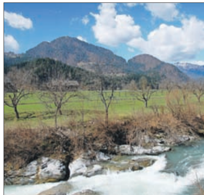
Pogled na Miklavško goro iz Dolenje vasi

Nadmorska višina: 955 m Višinska razlika: 545 m Trajanje: 2 uri in 30 minut Zahtevnost: ★★