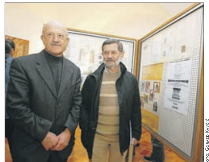
V severovzhodnem stolpu Škofjeloškega gradu so odprli zanimivo filatelistično razstavo na temo potresa.