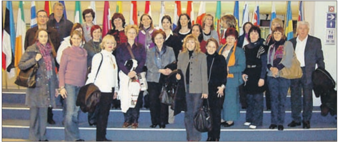
Sredi februarja je 24 mentorjev in koordinatorjev odpotovalo v evropsko prestolnico.