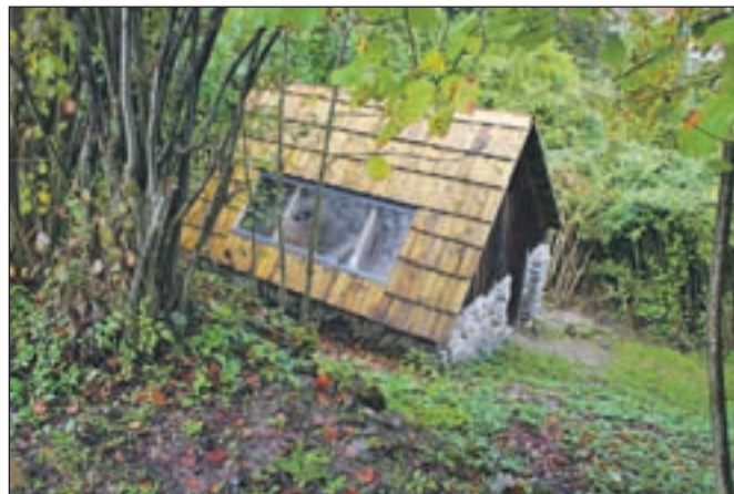
Mlin je dobil novo, deloma zastekljeno kritino, ki omogoča direkten pogled v njegovo notranjost.