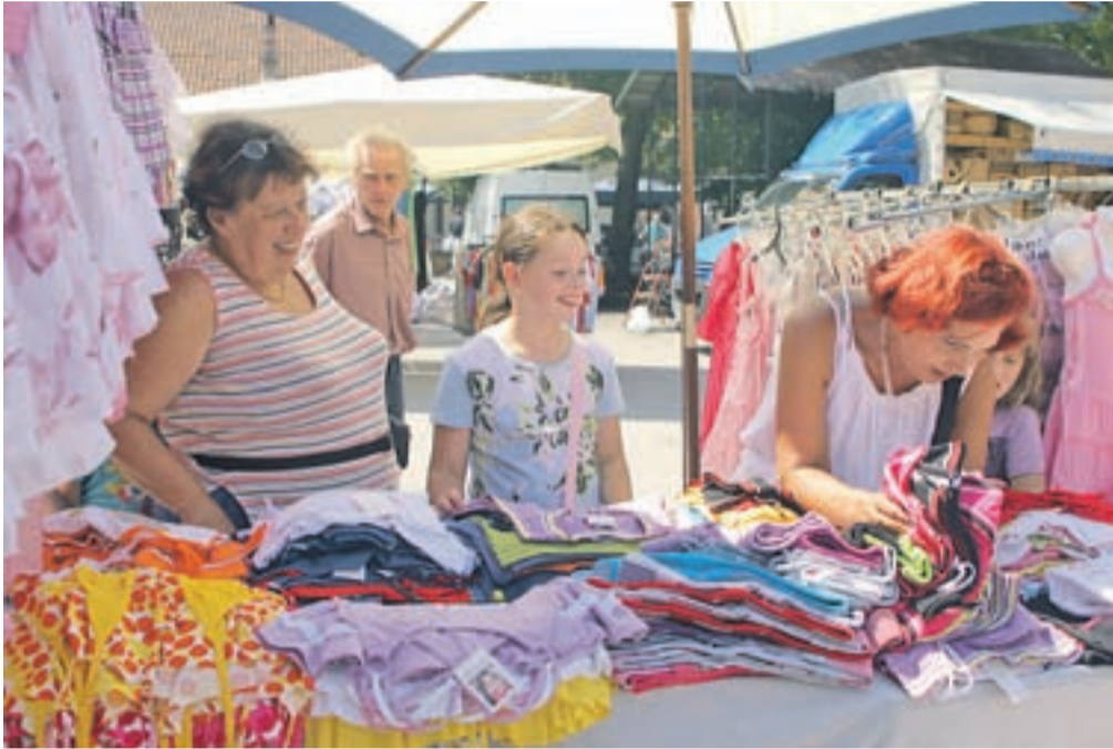
Tri generacije žensk navdušeno brskajo med razstavljenim blagom, moški pa so pri nakupih običajno rahlo nezaupljivi.

V Škofji Loki je geslo Sejem bil je živ sicer namenjeno neki drugi vsebini in lokaciji, toda tistim, ki vsako drugo sredo v mesecu obiše sejmišče v nekdanji škofjeloški vojašnici, pride na misel natanko ta začetek Aškerčeve pesmi. Poleti smo se po loškem Lentiju, kakor ga ironično (ali pa ljubkovalno) imenujejo Ločani in drugi obiskovalci, sprehodili tudi mi.