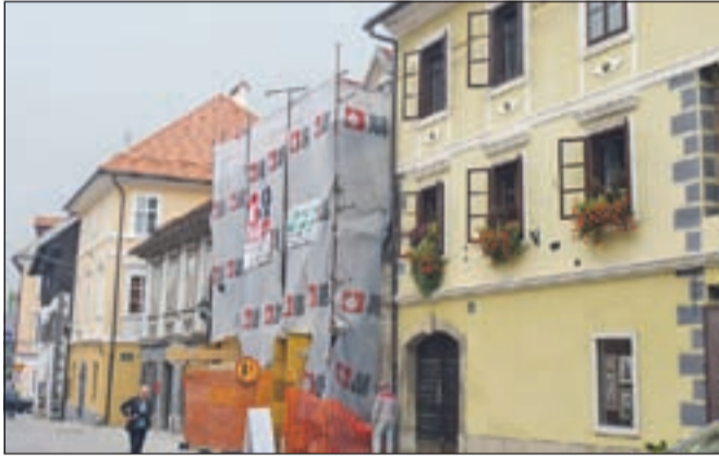
Obnovljena mestna lepota za zdaj še z zastrtim licem

Drugi razpis pa je namenjen lastnikom ali investitorjem pri prenovi kvalitetne stavbne dediščine na vsem območju občine Škofja Loka (pri prvem gre namreč le za hiše v starem mestnem jedru). Na letošnjega je prispelo devet vlog. Kot pravijo na občini, so ustregli vsem, sofinancirajo