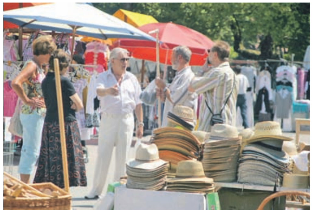
... do glave. Tle klobuki so v vročih avgustovskih dneh, ko nagaja sonce, še posebej zgovorno vabili k nakupu.