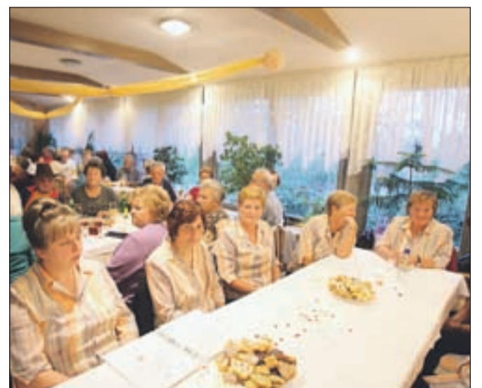
Za bolj neuraden del večera so poskrbele Ljudske pevke s Trboj.

Sredstva, ki so jih upokojenci zbrali, so namenili trem družinam v Škofji Loki. Eno izmed njih predstavlja mama samohranilka z malima otrokoma, ki je pred kratkim izgubila zaposlitev, oče otrok pa ne plačuje preživnine. Med tri obdarovane družine sodi tudi 57-letna gospa, ki ima hude zdravstvene težave; živi s sinom, ki pa jo poleg vsega tudi fizično zlorablja. Kot zadnja pa je pomoč prejela slepa invalidska upokojena, ki živi s hčerjo, katere oče prav tako ne plačuje preživnine. Odziv je bil številen, gostilnica v Crngrobu je bila tako polna dobrotelov. To pa ni prvič, da so se upokojenci iz Žabnice tako zavzeli za nekoga. "Že lani smo zbirali sredstva za Rdeče noske," je še povedala Jerica.