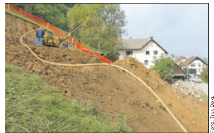
Začela so se dela za drugo fazo obvoznice v Puštalju.