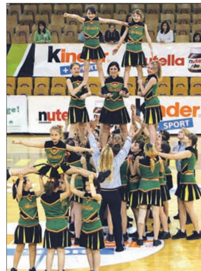
Cvetke iz OŠ Cvetka Golarja - najboljša osnovnošolska navijaška skupina