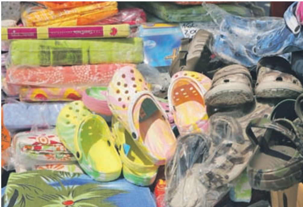
Na loškem sejmišču v vojašnici je na okoli 120 stojnicah na prodaj skoraj vse, tu se lahko dobesedno opremimo od nog ...