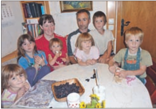
Družina Šavli svoje otroke šola doma.

Vseh učbenikov pa starša ne sprejemata, iz nekaterih sta iztrgala liste z vsebinami, ki niso v skladu z njihovim verskim prepričanjem. Čarovnice, zmaji, tudi pustne maske, ki se pojavljajo v šolskih knjigah in delovnih zvezkih, so po njenem mnenju primer zla in odpirajo vrata hudiču, česar pa svojim otrokom ne želita. Z božjo pomočjo se sproti