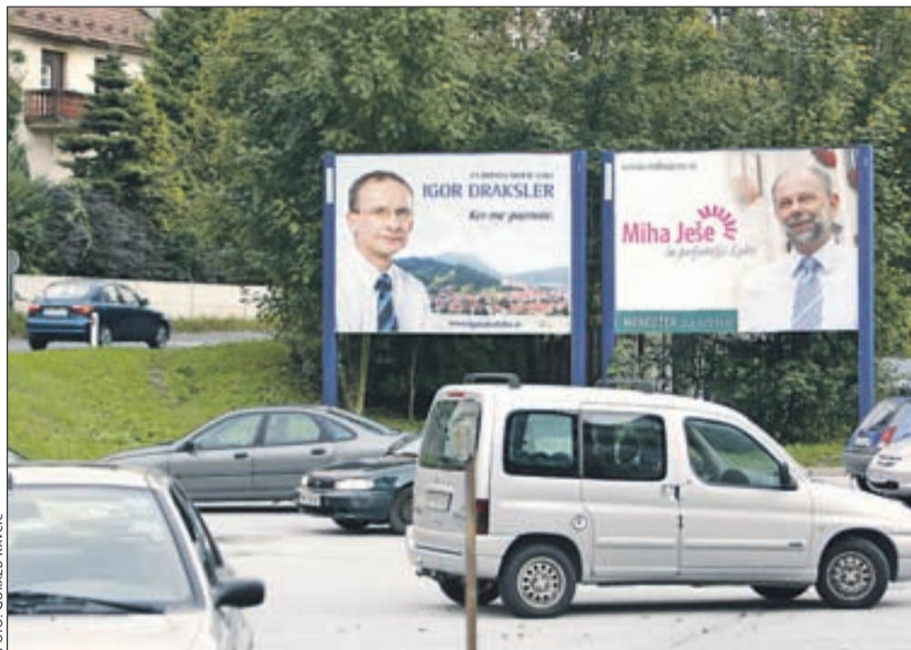
Ločani bodo na letošnjih lokalnih volitvah izbirali med sedmimi županskimi kandidati.

Na volitve gremo 10. oktobra (5., 6. in 7. oktobra bo predčasno glasovanje), v Škofji Loki pa bo ob veliki izbiri močnih in prepoznavnih kandidatov zagotovo drugi krog volitev. Med dvema najmočnejšima kandidatom bosta Ločani izbirali 24. oktobra. V Škofji Loki, kjer je na zadnjih lokalnih volitvah pred štirimi leti prišlo do zapleta, radi rečejo, da je bil pri njih tedaj tudi tretji krog volitev. Kaj imajo