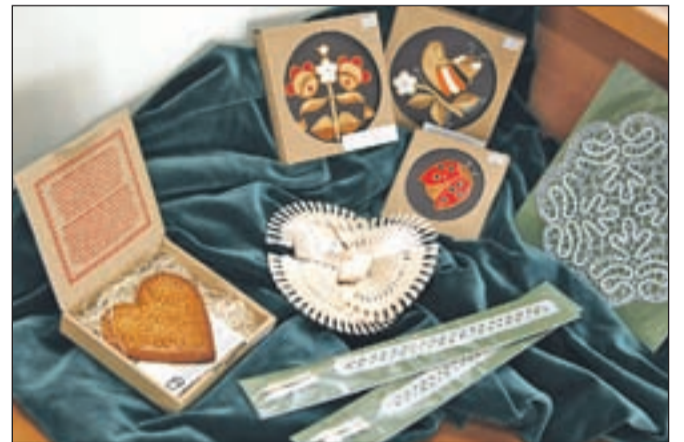
Rokodelske izdelke (kot so na sliki) bodo predstavili v novem Rokodelskem centru, ki bo prihodnje leto zaživel na Mestnem trgu v Škofji Loki.