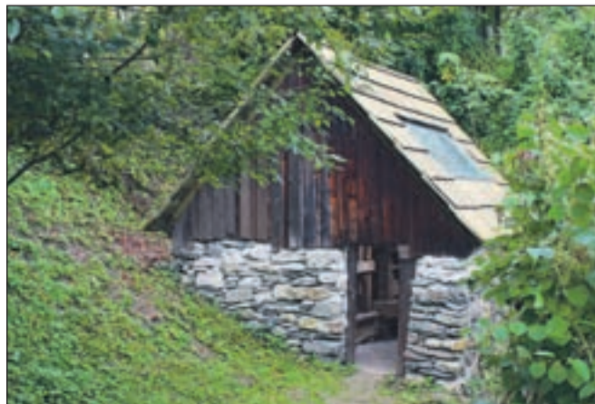
Z nadaljnjo obnovo bo mlin dodatno poživil "grajski" muzej na prostem.