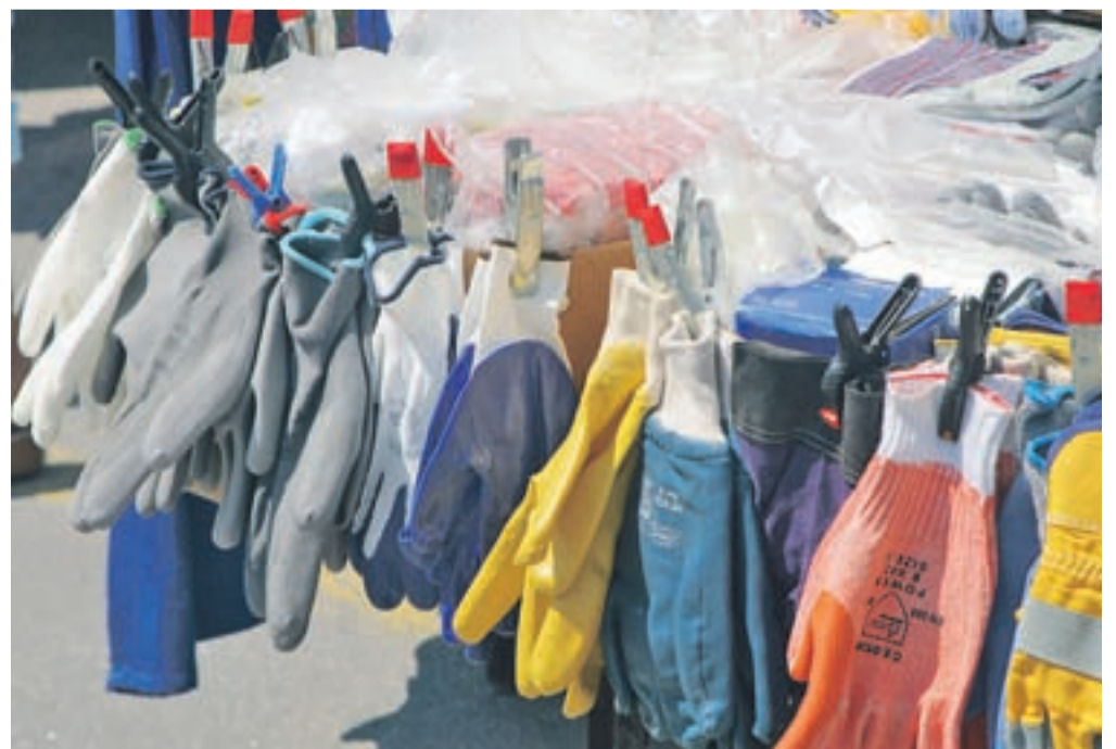
Delovne rokavice pa so si poleti vzele počitek do jeseni, ko se namočijo vrtna in druga opravila.