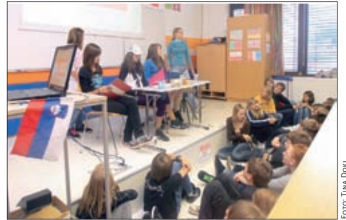
Igrani prizor, v katerem španske turistke obiščejo slovensko podeželsko gostilno, je nasmejal obiskovalce.

evropskih jezikih: angleščini, francoščini, nemščini, španščini, albanščini in slovenščini. Pokazali so, kako pri pouku spoznavajo abecede tujih jezikov, učenci z albanškimi koreninami sta v albanščini deklamirali pesem o abecedi, članice angleškega dramskega krožka so se pošalile na račun moških, obiskovalci so prisluhnili tudi francoskim hitrim povedim in izštevankam v tujih jezikih ter se nasmejali igranemu prizoru, v katerem tri španske turistke obiščejo slovensko podeželsko gostilno ... "Učenje jezikov predstavlja odlično priložnost za širjenje strpnosti in medsebojnega razumevanja ljudi. Naj bo Evropski dan