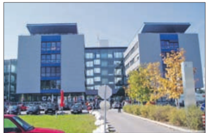
Pred leti so si Škofjeločani ogledali sodoben tehnološki park v Beljaku in videli, kakšnega želijo postaviti v Škofji Loki. Projekt bo lahko prihodnje leto postal realnost.