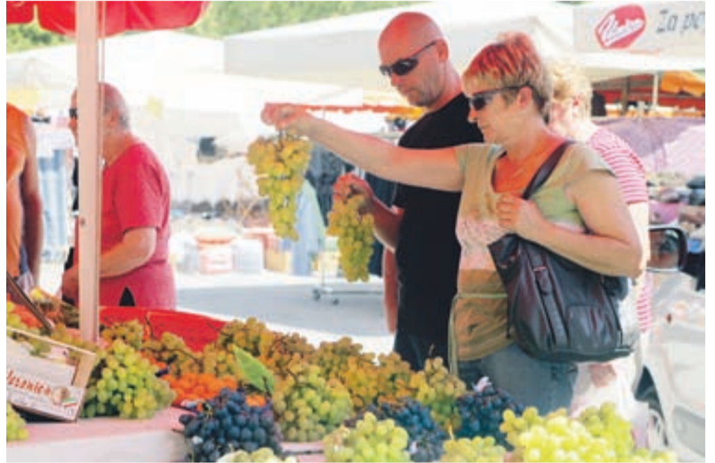
Stojnice ponujajo marsikaj, tale z naše fotografije je bila v poletni vročini ena najbolj vabljivih.