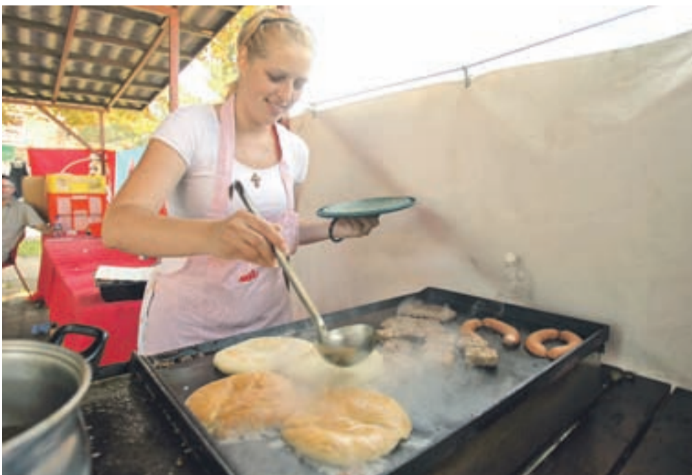
K sejmskemu razpoloženju na škofjeloškem sejmišču sodi tudi jedača, ki mamljivo diši z žara.