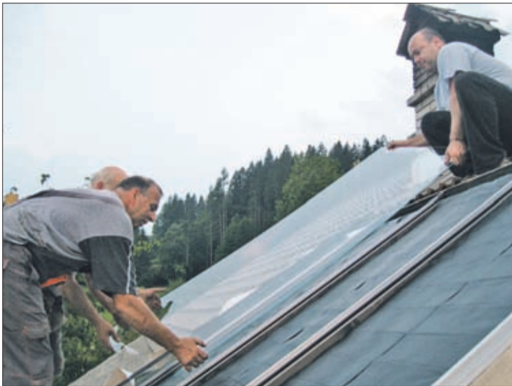
V skupinah po šest ali devet samograditeljev in pod strokovnim vodstvom je avgusta 24 družin prešlo na ogrevanje vode preko sončnih sprejemnikov.

In rezultat? "Samograditelji so se oblikovali v tri skupine s skupaj 24 člani in skupaj