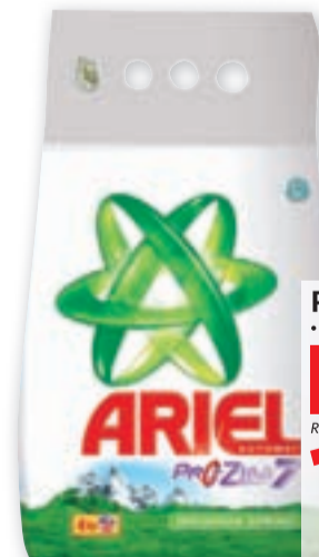
Prašek Ariel • Mautain Spring, 4 kg