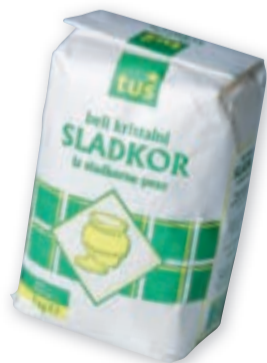
Sladkor • Tuš, 1 kg