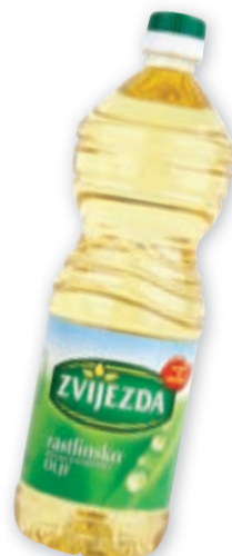
Olje Zvijezda • rastlinsko Zvijezda, 1 l