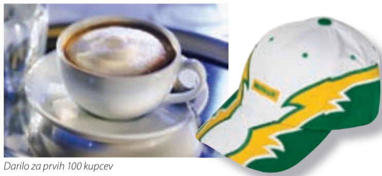
Darilo za prvih 100 kupcev

Merkurjeva riviera že nestrpno pričakuje svoje prve obiskovalce. Za pravo razpoloženje bodo pol ure pred začetkom otvoritvene slovesnosti poskrbeli zvoki glasbene skupine YuhuBanda . Po otvoritvi se bo pestro dogajanje nadaljevalo tudi v samem trgovskem centru. Že prvi dan se bodo s svojimi izdelki predstavili strokovnjaki priznanih proizvajalcev, kot so Unichem, Rt-Tri, Status, Belinka, Tefal in Rowenta. Strokovnih predstavitev proizvajalcev se boste lahko udeležili tudi v dneh po otvoritvi, vse do 19. aprila.