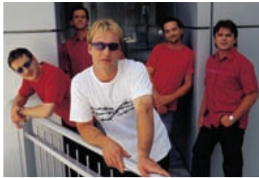
Glasbena skupina YuhuBanda

Merkurjeva riviera že nestrpno pričakuje svoje prve obiskovalce. Za pravo razpoloženje bodo pol ure pred začetkom otvoritvene slovesnosti poskrbeli zvoki glasbene skupine YuhuBanda . Po otvoritvi se bo pestro dogajanje nadaljevalo tudi v samem trgovskem centru. Že prvi dan se bodo s svojimi izdelki predstavili strokovnjaki priznanih proizvajalcev, kot so Unichem, Rt-Tri, Status, Belinka, Tefal in Rowenta. Strokovnih predstavitev proizvajalcev se boste lahko udeležili tudi v dneh po otvoritvi, vse do 19. aprila.