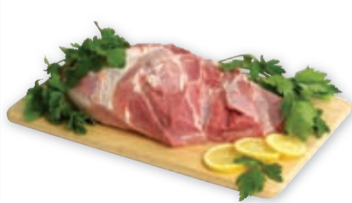
Svinjsko pleče • brez kosti • vakuumsko pakirano

OTVORITEV SUPERMARKET ŠKOFJA LOKA v sredo, 24. 3. 2010, ob 11. uri