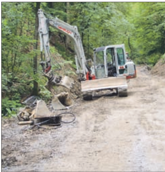
Lanska dela na cesti Pasja vas-Hrastnica