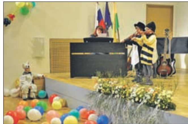
Pustni nastop učencev so v glasbeni šoli letos pripravili tretjič po vrsti. Tokrat so zavzeli in do konca napolnili kar Kristalno dvorano. Učitelji so skupaj z mladimi glasbeniki, malo za šalo, še bolj pa zares, v pustnih maskah pripravili kar dvajset točk, med drugim smo srečali tudi simpatične violiniste ...