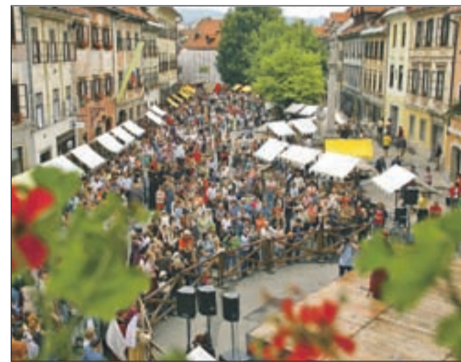
Z ene od minulih Venerinih poti