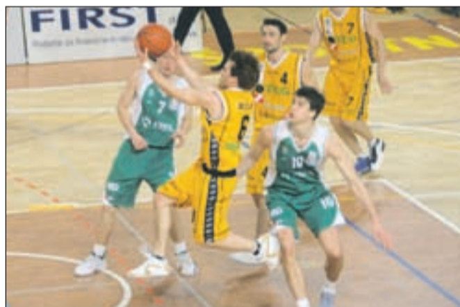
Loški košarkarji (v rumenih dresih) so zadnjo tekmo v domači dvorani izgubili, v nadaljevanju prvenstva pa se bodo borili za obstanek v eliti.

"V nadaljevanju je dobro, da se nam točke prenesejo in da imamo v primerjavi z neposrednimi konkurenti boljše rezultate. Kljub temu bomo za obstanek v prvi ligi še kako potrebovali zmage in točke. Upam, da nam bodo pri tem pomagali tudi gledalci na tribunah, za katere moram reči, da so v Škofji Loki izredno zahtevni. Tudi če res dobro igramo, jih je na tribunah bolj malo, vzdušje pa je bolj turobno. To bi radi spremenili, saj bi nam glasna podpora veliko pomenila," dodaja Tomaž .