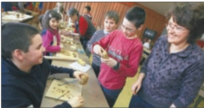
LAS Škofja Loka je med zimskimi počitnicami pripravil tudi medgeneracijsko delavnico.

že vrsto let na škofjeloških osnovnih in srednjih šolah izvaja programe, osredotočene na zdrav način življenja, mlade in njihove starše ozaveščajo o škodljivosti uživanja drog in jih učijo za koristno preživljanje prostega časa, starše pripravljajo na dobro vzgojo otrok in pravilno ravnanje z odraščajočim najstnikom, kako naj se soočijo s problematiko uživanja drog ... "Pomembno je, da probleme pravočasno prepoznajo, da mladi ne zapadejo v zasvojenost, iz katere pot do ozdravitve ni lahka," pravi Okornova in dodaja, da so droge sicer globalen problem, k njegovemu reševanju pa bi bilo zato treba pristopiti z globalno akcijo.