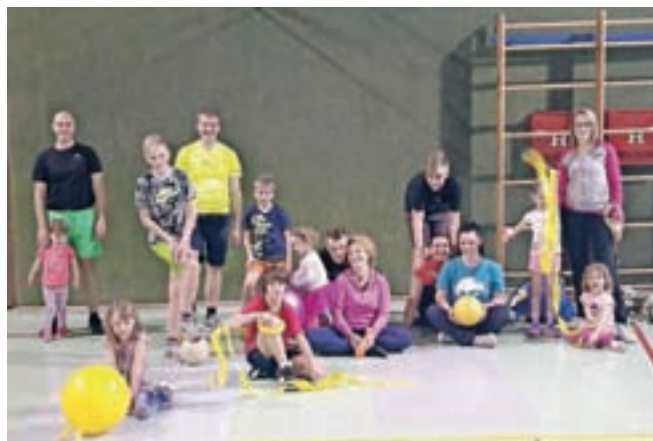
Razigrana, športna, vesela, predvsem pa kakovostno preživeta sobota na družinski rekreaciji