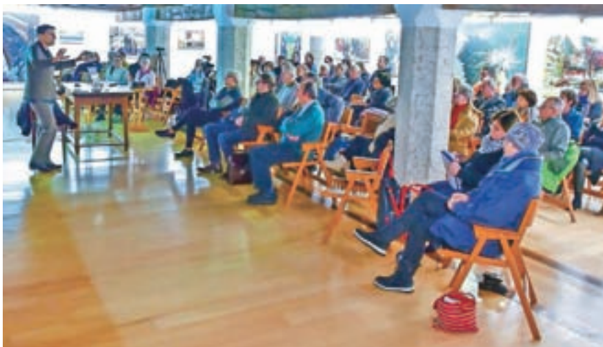
Z muzejskim večerom o kulturni dediščini so v Škofji Loki začeli dogajanja ob evropskem letu kulturne dediščine.