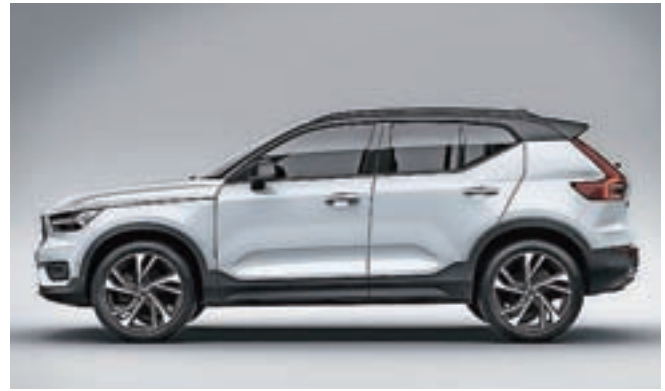
Volvo XC 40, evropski avto leta

Ženevski festival ob izboru evropskega avta leta vsakič izbere tudi finaliste za svetovni avto leta 2018. Naslov svetovni avto leta se podeljuje v šestih kategorijah: svetovni avto