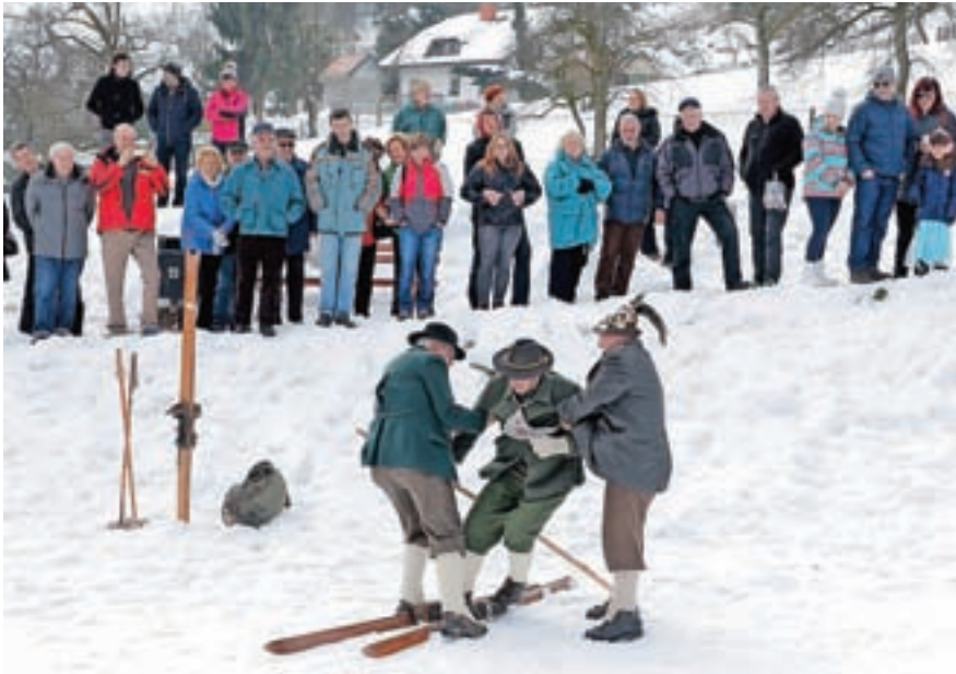
Na hribu pod Loškim gradom se je drugo soboto v februarju odvijalo 18. mednarodno tekmovanje v smučanju po starem.

Na letošnjem 18. mednarodnem tekmovanju v smučanju po starem, ki ga pripravljajo v Društvu Rovtarji, se je v začetku februarja na hribu pod Loškim gradom pomerilo več kot petdeset smučarjev s starimi lesenimi smučmi in v starodobni opravi.