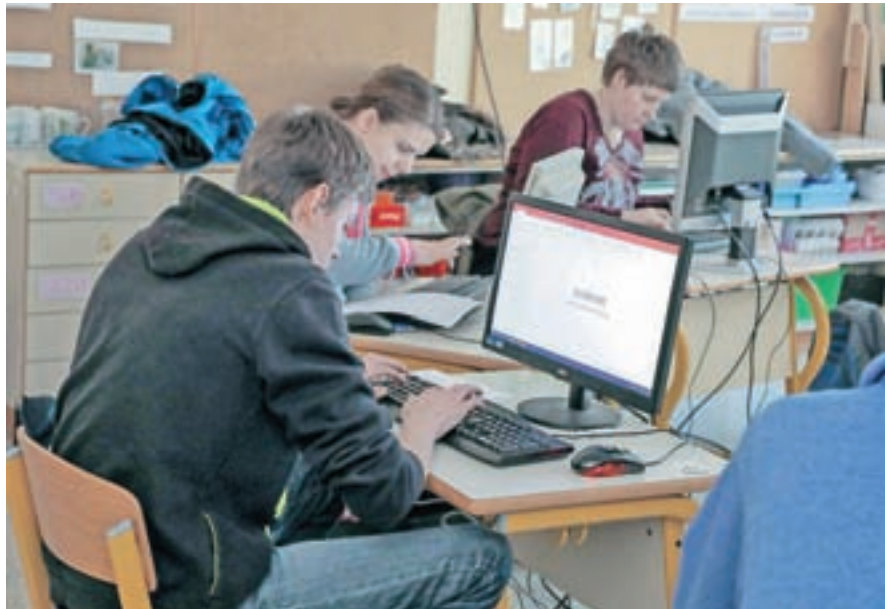
Da so si z računalniki domači, se je pokazalo tudi na tekmovanju Z miško v svet.

Tekmovanju je sledilo prijetno druženje ob kegljanju, kjer se utrdijo stara in vzpostavijo nova prijateljstva med udeleženci, po skupnem kosilu pa je potekala razglasitev rezultatov, obogatena z družabno-kulturnim programom, za