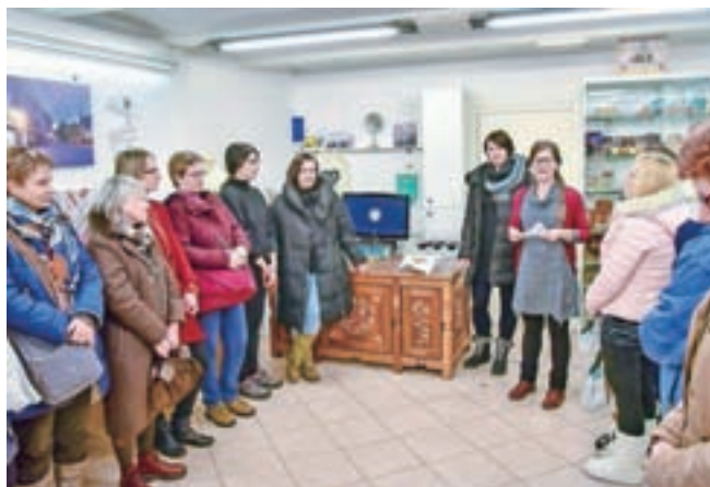
V Rokodelskem centru DUO Škofja Loka je na ogled razstava, na kateri predstavljajo rezultate projekta, pri katerem so povezali vseh pet muzejev in kulturnih centrov na Škofjeloškem.