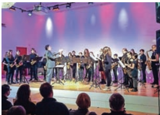
V Kristalni dvorani je za valentinovo navdušil Slovenski orkester mladih saksofonistov SOS junior.

Ni pogosto, da bi poklicni glasbeni sestavi vzgajali tudi svoj lastni podmladek, kot to že šest let načrtno počnejo saksofonisti orkestra SOS. Po letih uvajanja in vzgajanja mladih v orkestrskem in komornem muziciranju so v letošnji koncertni sezoni združili moči in pripravili zanimiv program, ki so ga predstavili tudi občinstvu v Škofji Loki. Deloma ločeno, z nekaterimi skladbami pa tudi kot pravi, veliki orkester saksofonov so v Kristalni dvorani predstavili program, ki ga bodo kot predstavniki Slovenije izvajali tudi na 18. Svetovnem kongresu julija v Zagrebu, zajema pa med drugimi skladbe klasičnih avtorjev, kot so Glin-