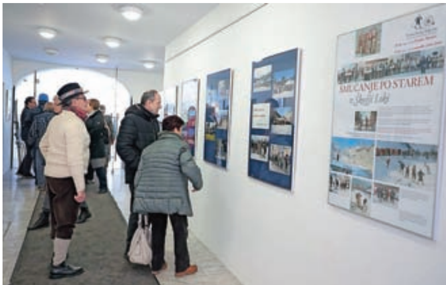
Na razstavi v predverju Sokolskega doma si je bilo mogoče ogledati utrinke s preteklih tekmovanj.