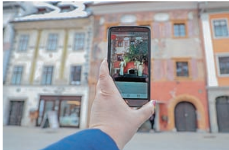
Na digitalizirani Romualdovi poti se nam na ekranu pametnega telefona prikaže "obogatena resničnost", prizor iz Škofjeloškega pasijona.