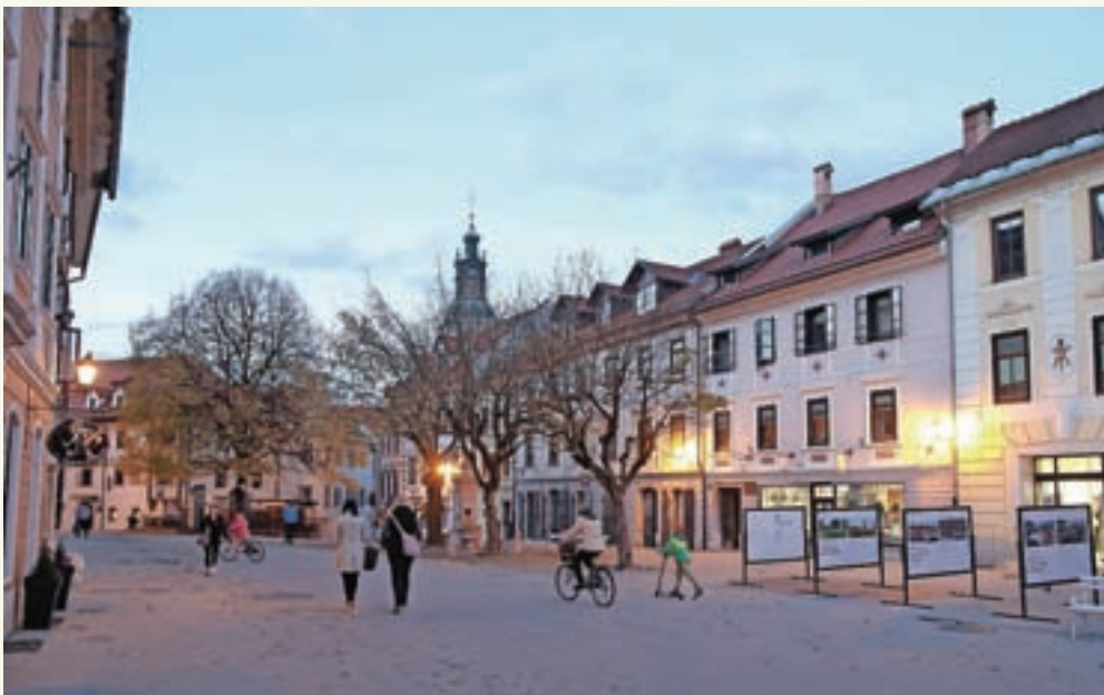
Predhodne arheološke raziskave so bile uvod v celovito prenovu Mestnega trga, ki naj bi se začela prihodnje leto.

Občinski svetniki so to predlagali sami in v sklopu komisije za statutarnopravna vprašanja tudi pripravili besedilo za prvo obravnavo. Sam zelo podpiram to, da se svetniki samozavežejo k čim višjim standardom delovanja, tudi k strpni razpravi in komunikaciji.