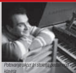
Potovanje skozi tri stoletja pedalnega klavirja