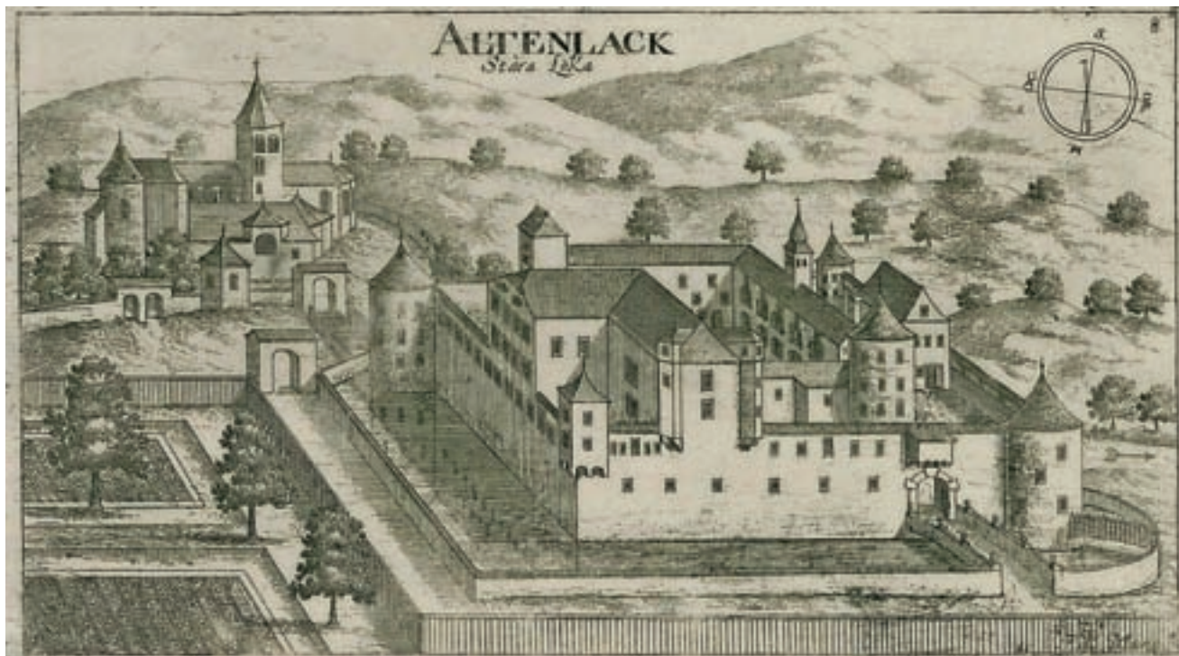
Stara Loka po Valvasorju iz leta 1679

Pivo, priljubljena alkoholna pijača, zvarjena iz sladu, hmelja, kvasa in vode, ima večtisočletno tradicijo in še danes zaseda tretje mesto med vsemi pijačami po svetovni porabi. Pred njim sta le voda in čaj.