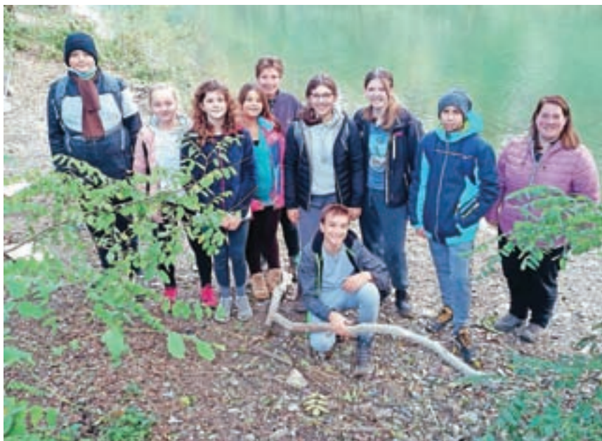
Učenci so raziskovali, koliko plastike je v reki Sori.