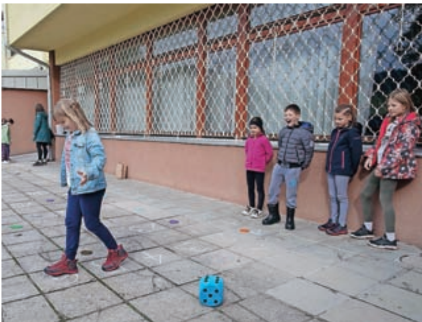
Otroci nova znanja pridobivajo skozi igro na šolskem dvorišču oziroma v naravi.