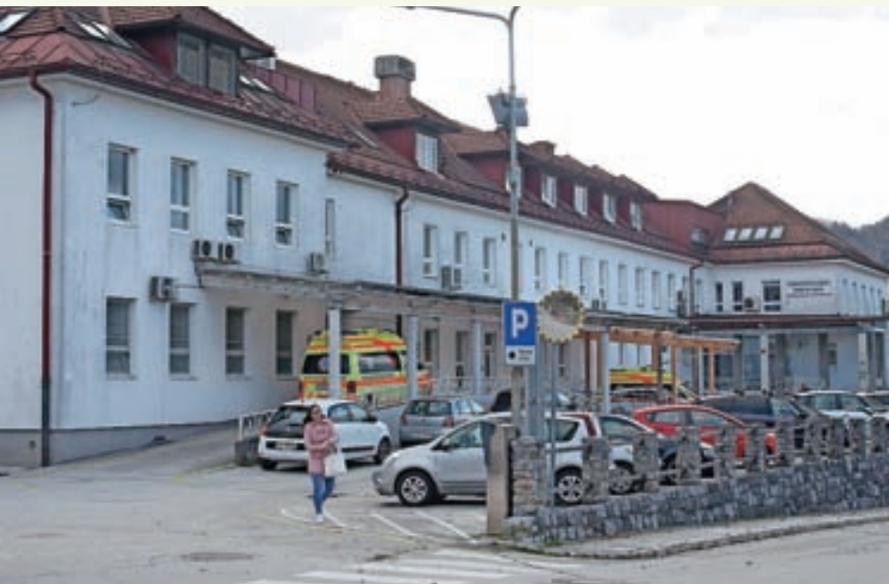
Več kot 660 občanov nima izbranega svojega družinskega zdravnika v Zdravstvenem domu Škofja Loka. S sprejetim odlokom se bo sprostilo kar nekaj kapacitet.