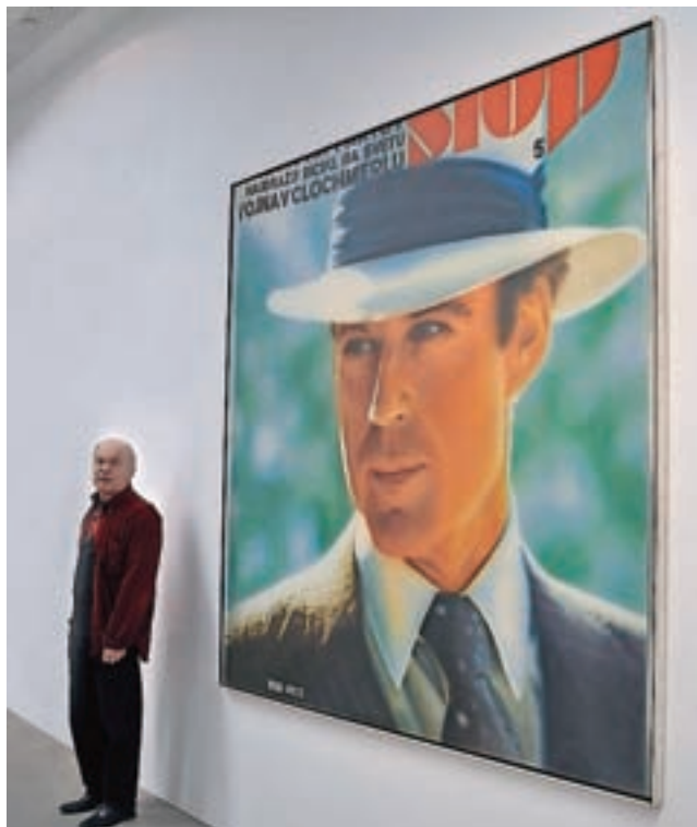
Gatsby (Najdražji bicikl na svetu), 1975, akril na platnu, 200 x 200 centimetrov

Pred dnevi pa je Berko prejel tudi vabilo na likovno razstavo z naslovom Image to Image (Slika do podobe) v Hiši Legata, galeriji Srbske akademije znanosti in