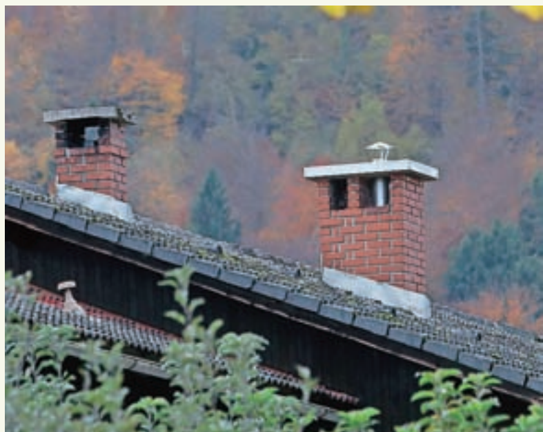
Z rednim čiščenjem dimnika lahko preprečite požar.