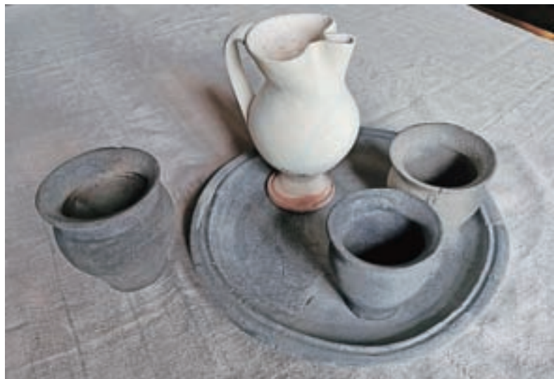
Keramično pivsko posodje; arheološke najdbe s področja Komuna na Mestnem trgu v Škofji Loki, 16.–17. stoletje

Tudi inventarni popisi z Loškega gradu, ki so nastali v letih 1315, 1318 in 1321, omenjajo sode in vrče za pivo. Tako srečamo v popisu iz leta 1315 v kleti 4 sode za pivo,