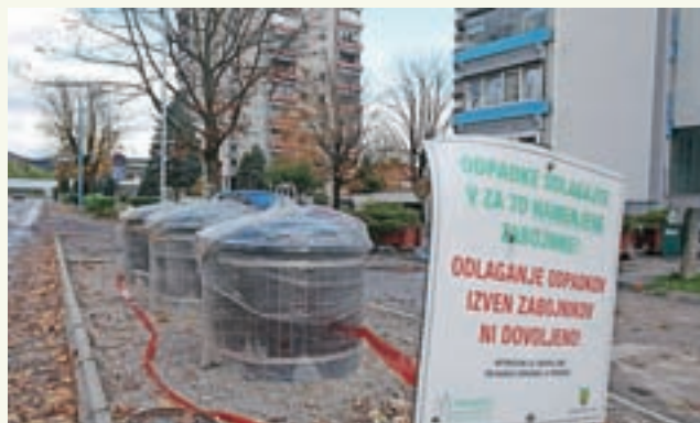
V Podlubniku bo stala prva polpotopna zbiralnica ločenih odpadkov v Škofji Loki.

V Podlubniku bo stala prva polpotopna zbiralnica ločenih odpadkov. Dela so začeli izvajati konec oktobra. Zbiralnica pred večstanovanjskim objektom Podlubnik 160 bo prva od treh v nizu novega načina oblikovanja zbiralnic in tudi zbiranja ločenih frakcij komunalnih odpadkov. V času gradnje bo oviran promet, zato prosijo za razumevanje. Po zaključku del se bo stanje območja vzpostavilo v stanje pred posegom. V sklopu teh del bodo obnovili tudi del poškodovanega cestišča in odvodnjavanje meteorne vode.