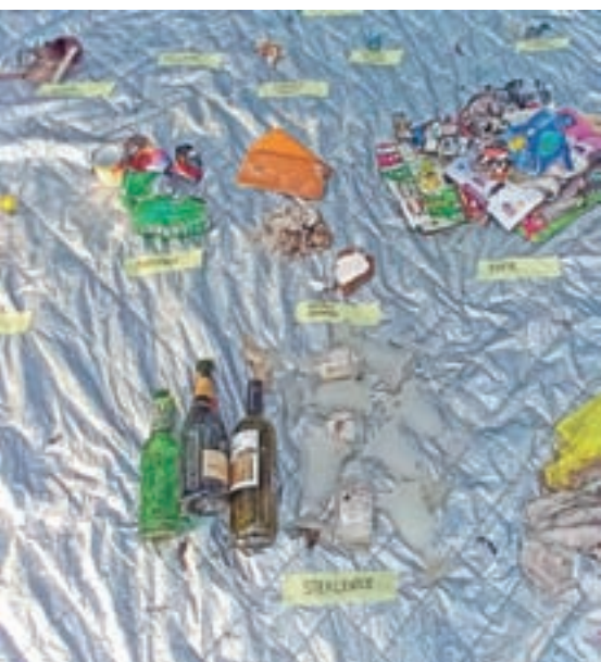
Med zbranimi odpadki so prevladovali steklovina in pločevinke.

Zbrano so popisali in dokumentirali tudi s fotoaparatom ter nato pospravili. Ugotovitve so jih razočarale, saj se zavedajo, da k onesnaževanju narave prispeva predvsem človek. Zdaj čakajo še na rezultate analize, ki bo pokazala, koliko mikro in makro plastike se nahaja v Sori.