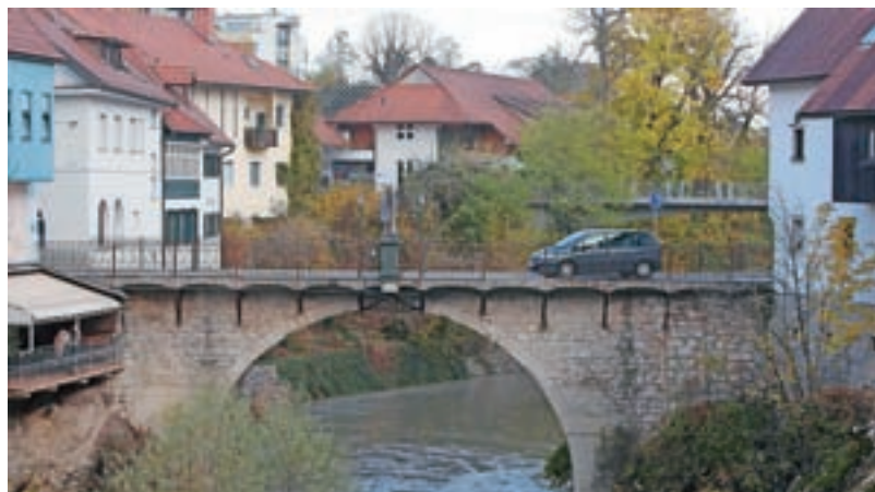
S pomočjo državnih sredstev bodo obnovili tudi Kamniti most.

V starem mestnem jedru Škofje Loke so se tako konec oktobra začela obnovitvena in predhodna raziskovalna dela na prepoznavnih kulturnih spomenikih. Ministrstvo za kulturo bo za sofinanciranje del na Kamnitem mostu z obnovo kipa namenila slabih 57 tisoč evrov, za restavratorska dela na spomeniku Marijino znamenje na Mestnem trgu pa dobrih 17 tisoč evrov. »Oba projekta opredeljuje konservatorsko-restavratorski program in v letošnji jeseni so se na obeh ikoničnih kulturnih spomenikih začela obnovitvena dela,« so sporočili z občine in dodali, da se bodo dela nadaljevala tudi v prihodnjem letu.