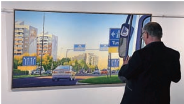
Model, slikar in gledalec, 2014, akril na platnu, 100 x 200 centimetrov