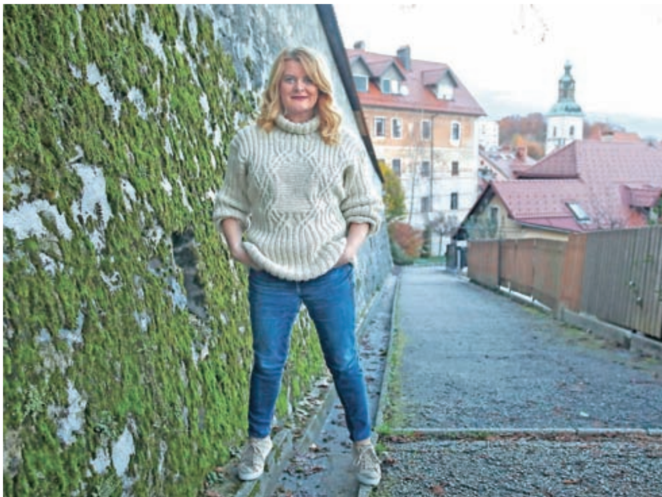
Škofje Loke, pravi, ne bi zapustila, saj je mesto z dušo, v katerem se povsod počuti domače.

▣ Po drugi strani pa je verjetno tudi veliko dogodkov, ki se vtisnejo v lep spomin, pustijo v vas poseben pe-čat?