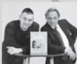
Repki – rap koncert za otroke