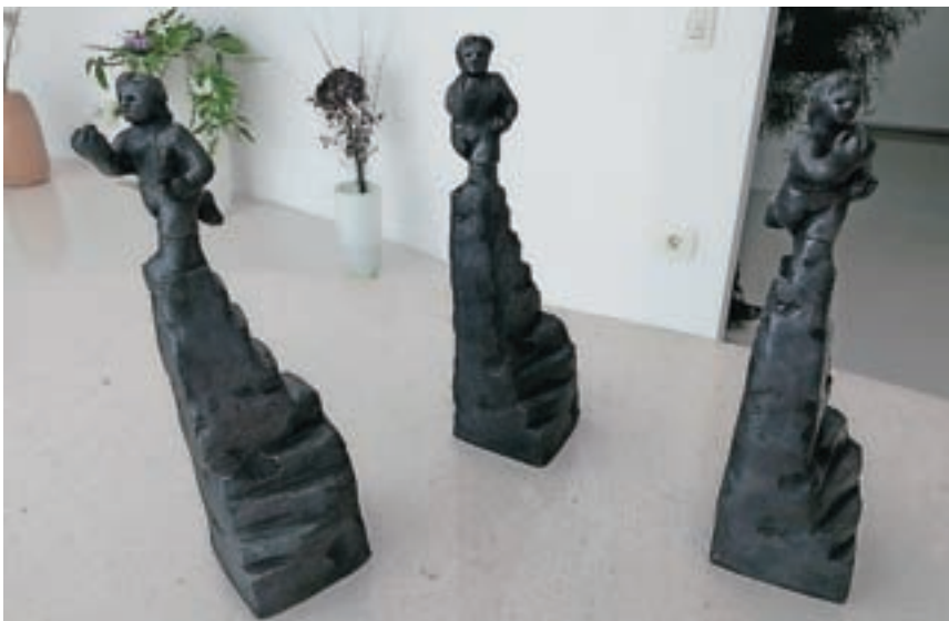
Na Loškem odru se matički počutijo kot doma.

Ustvarjalci Loškega odra so bili seveda veseli uspeha. »Čeprav