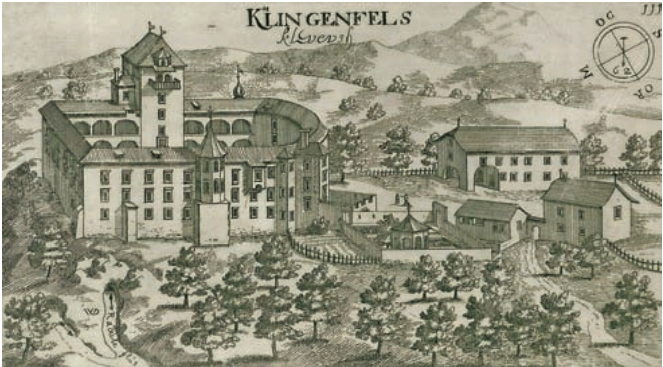
Grad Klevevž, zgrajen leta 1265, je bil sedež freisinškega dolenjskega gospostva.

Tako kot v različnih delih sveta tudi v vinorodnih predelih Slovenije uspevajo najrazličnejše žlahtne sorte vinske trte. Iz njihovih plodov vinogradniki že stoletja pridelujejo vino, nam vsem dobro znano in priljubljeno alkoholno pijačo.