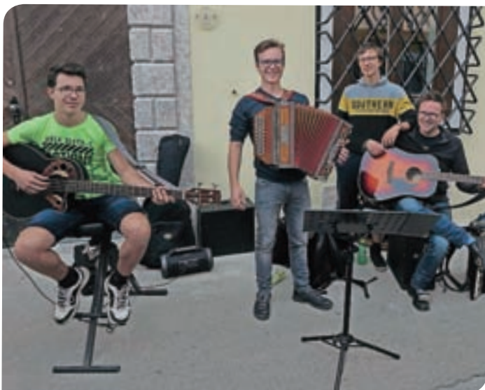
Če ti rečejo, da se imenujejo Jemc band, potem se najprej vprašaš, ali so si v sorodu. In tale moška zasedba je, celo v ožjem. Priimek Jemc v Škofji Loki, ko omeniš glasbo, ni neznan, njihova virtuoznost pa postaja prepoznavna tudi izven občinskih meja. A. B.