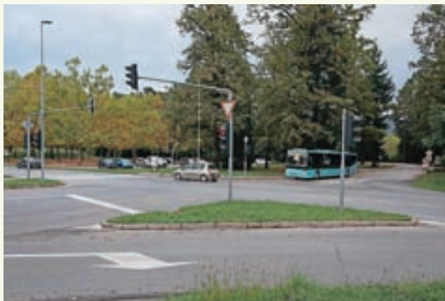
Ureditev krožišča na Lipici bo zajemala tudi ureditev obračališča za mestno linijo in cestno navezavo na sosednji rondo IC Trata.

Vsekakor velja omeniti turistično cesto na Stari vrh, ki je z zaključkom zadnje etape pridobila dodatno varnost in prevoznost. Lokalna cesta Ševlje–Bukovščica je po rekonstrukciji štirih mostov in precejšnjega dela ceste dobila še ureditev odseka do Podružnične šole Bukovščica. Komunalna ureditev z ureditvijo zgornjega ustroja Grajske poti se sicer z zamikom, pa vendarle zaključuje. Zaključena je ureditev v Zabrajdi. Poleg preplastitve šte-