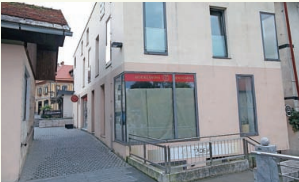
Turistično-informacijski center Škofja Loka se seli na novo lokacijo na Cankarjev trg, v prostore, kjer je bila nekoč knjigarna Založbe Modrijan.

Zadolženost občine se znižuje že drugo leto zapored, saj si želim, da dolgove občine čim bolj odplačamo, saj se bomo kaj hitro znašli sredi novega investicijskega cikla, ko bomo tudi potrebovali dodatna sredstva. Mislim pa, da je prav, da ohranimo zdrave finance, ki so na zeleni veji. In trenutno imamo priložnost za to. Na drugi strani pa z rebalansom namenjam precej več denarja za obnovo cest, ogromno se zdaj vloga v podeželje in podeželske ceste, ker je bila marsikatera resnično dotrajana. Vlagamo tudi v nakupe zemljišč, ki bodo omogočali nadaljnjo stanovanjsko gradnjo. Pa seveda z rebalansom smo prerazporedili denar tako, da podpira vse tiste projekte, ki so bili izglasovani znotraj participativnega proračuna – projekta Naša Loka.