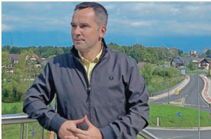
Robert Strah / Foto: osebni arhiv

V smeri Kranja imamo urejeno kolesarsko pot do Starega dvora, nadaljujemo rekonstrukcijo Kidričeve ceste do železniške postaje, od tam pa sledi nadaljevanje po obstoječih