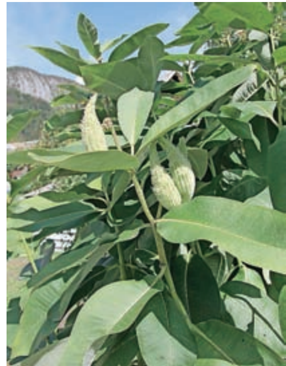
Sirska svilnica, ki ji zaradi oblike plodov rečemo tudi papagajčki, je izjemno invazivna tujerodna rastlina.

še ni zelo pogosta, večinoma se pojavlja posamezno ali v manjših sesto- jih, predvsem v osrednji in vzhodni Sloveniji. Kot pojasnjujejo na Zavodu RS za varstvo narave, sirske svilnice, ki se je zaradi oblike plodov prišlo ime papagajčki, ne smemo imeti na vrtovih, saj zaradi njenega načina razmnoževanja prav zlahka zaide v naravo, kjer dela škodo.