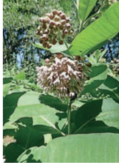
Rastlina uničuje pestrost travnikov, ki z njeno razširitvijo postanejo neprimerni celo za kmetijsko rabo.

Lokacije sirske svilnice lahko najdemo na spletnem portalu Invazivke, kjer je razvidno, da v Škofji Loki in okolici za zdaj še niso zazna-