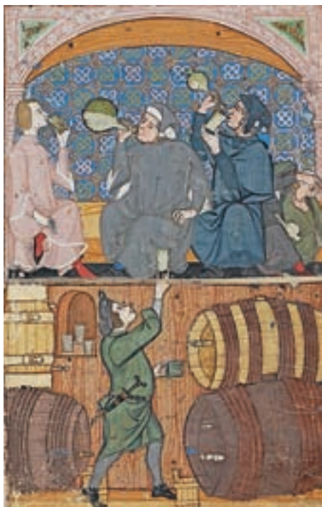
Pivci v vinski kleti, Pellegrino Cocharelli, Razprava o slabostih in vrlinah, 1330–1340

V srednjem veku je tudi Škofja Loka za okolico sodila med vinorodne okoliše.