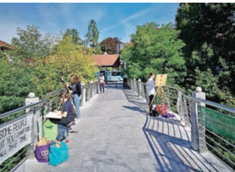
Mladi likovniki so tudi letos ustvarjali na Mali Groharjevi koloniji.