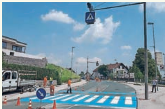
Dodatna označitev prehoda za pešce na barvni kontrastni podlagi

V občini je na državnih in lokalnih cestah nameščenih 22 prikazovalnikov hitrosti, ki služijo dodatnemu umirjanju prometa, obenem pa so koristni tudi z vidika prikaza povprečnih hitrosti in prekorajitev. »Letos smo na Bukovici v sklopu ureditve šolskih poti namestili dodatno svetlobno signalizacijo, ki bo delovala v času večje frekvence pešcev in prisotnosti šolarjev na območju šole. Veliko pozitivnih odzivov je bilo tudi na namestitve