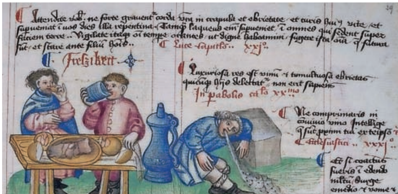
Zmernost je lepa čednost tudi pri pitju vina, Hugo von Trimberg, Tekači, 1300