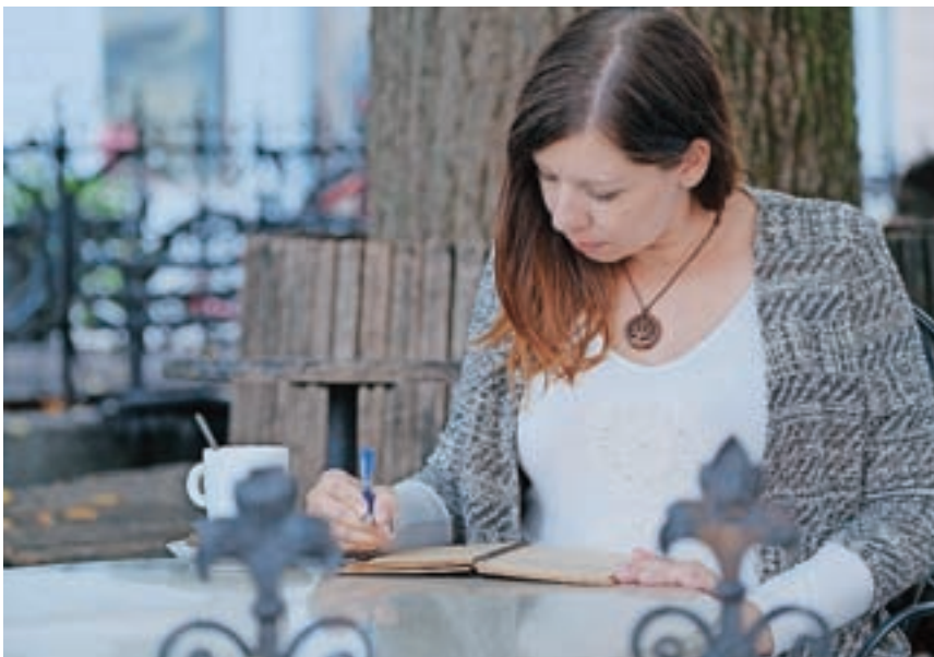
Že pred desetimi leti, ko se je preselila v Škofjo Loko, si je predstavljala, kako pod Homanovo lipo piše pravljice.

Pogosto me sprašujejo, ali s tem želim premagati svoje strahove, pa