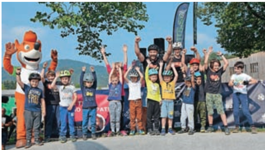
V Foksijevi kolesarski šoli in Foksijevih izzivih so se zvrstile tri skupine mladih kolesark in kolesarjev, skupaj jih je bilo blizu petdeset.

Za to atraktivno tekmovanje, ki vključuje tudi spremljevalni program za otroke Grbine so fine, je vsako leto več zanimanja. Letošnja serija se je 26. septembra ustavila tudi v Škofji Loki, ki je bila tretja postaja, po Zagorju in Laškem. Dogodek na pumptracku oziroma grbinastem poligonu na območju nekdanje vojašnice je bil celodnevni. Je kombinacija zabave in tekmovanja. Že dopoldan je privabil veliko družin. V Foksijevi kolesarski šoli in Foksijevih izzivih so se zvrstile tri skupine mladih kolesark in kolesar-