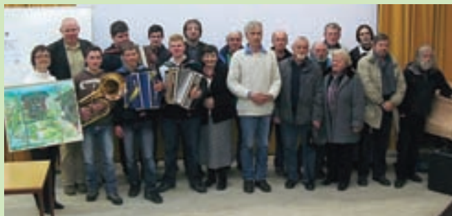
Skupinska fotografija s slikarji in nastopajočimi z razstave v Šolskem centru

Jasna v Šmarjeti na Dolenjskem? Ja in ne. Namreč ime likovnega srečanja je spomin na prvo druženje likovnih ustvarjalcev, ki je leta 2006 potekalo v Kranjski Gori ob jezercu, ki se imenuje Jasna. Ime je ostalo, likovniki in fotografi, pri čemer je treba dodati, da je skupina vsako leto večja, pa svoje ustvarjalne izzive vsako leto iščejo v novem okolju. Letošnje peto Likovno srečanje Jasna je junija potekalo v Šmarjeti pri Šmarjeških Toplicah. Med tridnevnim ustvarjanjem so nastale risbe, osnutki za likovna dela, ki so posameznim