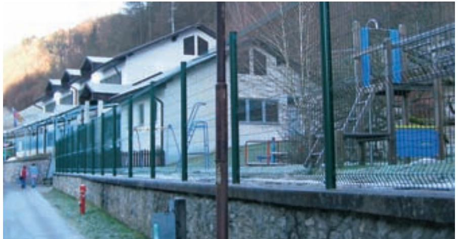
Letos naj bi pri vrtcu v Železnikih zgradili prizidek z dvema oddelkoma.

”Moje vodilo je, da mora občina omogočiti vključitev v vrtec za vse otroke, katerih starši