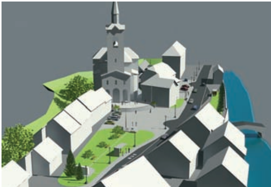
Takole naj bi bil videti obnovljen Plac pred cerkvijo sv. Antona v Železnikih.

Na obeh trgih nameravajo urediti meteorno kanalizacijo, vodovod, javno razsvetlavo, zelene površine, načrtujejo novo tlakovanje in postavitev urbane opreme. Trg pred plavžem bo namenjen raznim prireditvam, sicer pa bo prostor deloval kot mestni trg s panoji s pred-