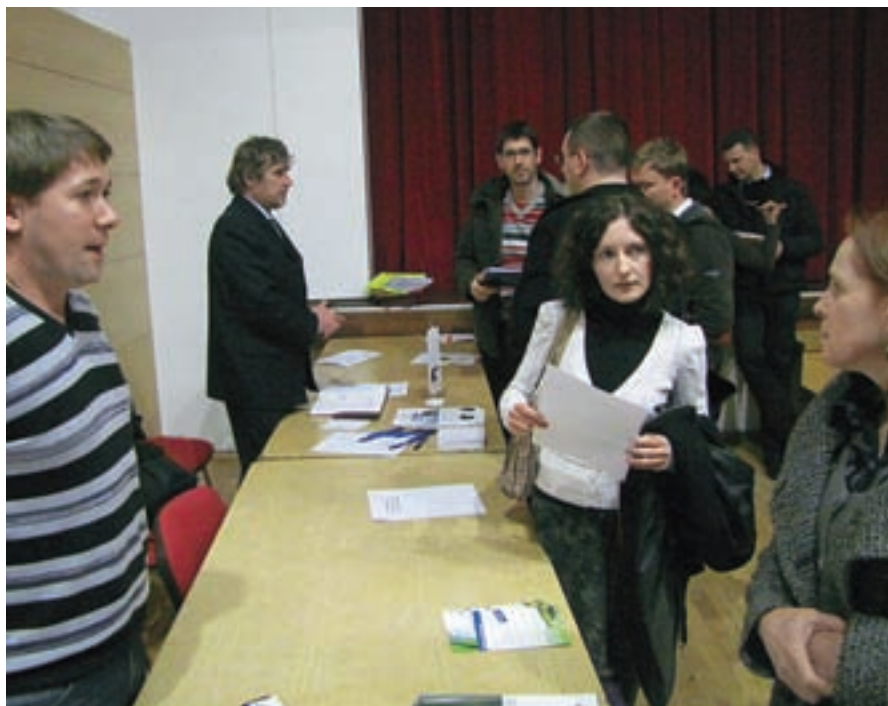
Prve aktivnosti projekta Čiščenje odpadnih voda v malih čistilnih napravah se je v Gorenji vasi udeležilo štirideset domačinov.