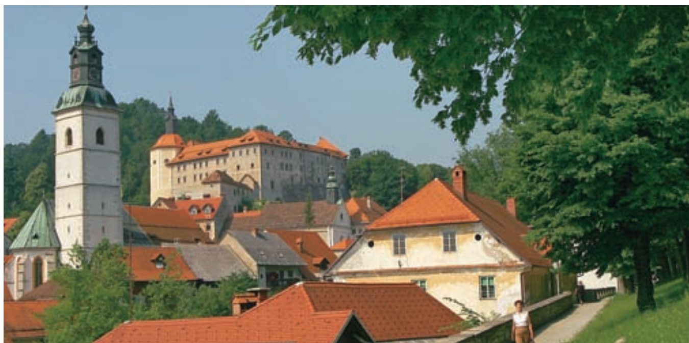
Škofja Loka, 500 let po potresu

Med 17. in 20. marcem bo v Škofji Loki potekal tudi Mednarodni znanstveni simpozij Bogata dediščina za prihodnost, v okviru katerega bodo sodelovala tudi partnerska mesta, člani združenja Europassion ter člani mnogih drugih strokovnih združenj, povezanih z zgodovino. Igor Kavčič