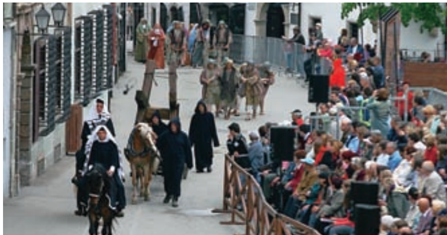
Škofjeloški pasijon je izhodišče mednarodne konference Bogata dediščina za prihodnost

Poleg partnerskih mest in članov združenja Europassion sodelujejo predstavniki društev in zavodov iz Škofje Loke, slovenske pasijonske občine, predstavniki enot žive kulturne dediščine, slovensko kulturno ministrstvo, predstavniki ljubljanske in mariborske uni-