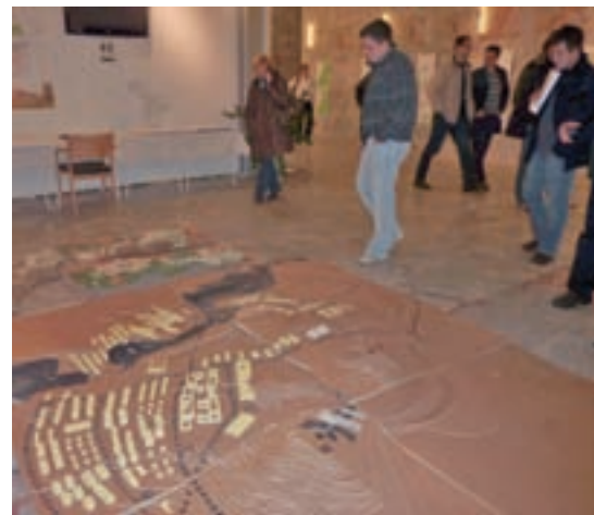
Prostorski načrt je še do 2. februarja razgrnjen v Sokolskem domu in na občini.

Več vprašanj so udeleženci javne razprave postavili v zvezi z razpršeno gradnjo, nekaj v zvezi z zemljišči, ki bi jih želeli izvzeti kot stavbna, zanimalo jih je, kje se bodo gradila otroška igrišča, kako bo s parkirišči, zlasti za škofjeloško mestno jedro, za katero smo slišali tudi pobudo, da bi prešlo pod Unescovo zaščito. Kmetje pa želijo, da bi se zaščitila obdelovalna zemlja. Tako denimo v Retečah vztrajajo, da ob progi ne bo gradnje. Eden od kmetov tudi opozarja, koliko kmetijske zemlje gre za ceste, poslovno dejavnost, trgovske centre. Oblast naj raje razmišlja o tem, kako bi širila sedanje ceste, da bi bil promet bolj tekoč, kot gradila nove. Enako velja za poslovno dejavnost, ki naj jo umesti v opuščene objekte nekdanjih tovarn, ne pa gradi nove cone na kmetijskih površinah. Po drugi strani pa so razpravljavci tudi opozarjali, da so kot najboljša kmetijska zemljišča opredeljena tista, ki v resnici to niso. Na javni razpravi v Škofji Loki so na to odgovorili, da bo to na