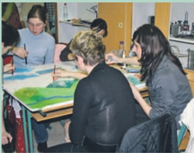
Likovno ustvarjanje v programu Predšolska vzgoja

Predavanja v poklicnem tečaju, ki se bo začel februarja 2011, bodo potekala trikrat na teden do sredine junija in od sredine septembra do konca januarja prihodnje leto. V poklicni tečaj se lahko vključijo kandidati, ki imajo končan najmanj četrti letnik srednje šole. V primeru, da imajo opravljen tudi zaključek izobraževanja, se jim pri opravljanju poklicne mature v poklicnem tečaju priznata dva splošna predmeta in za zaključitev poklicnega tečaja opravljajo