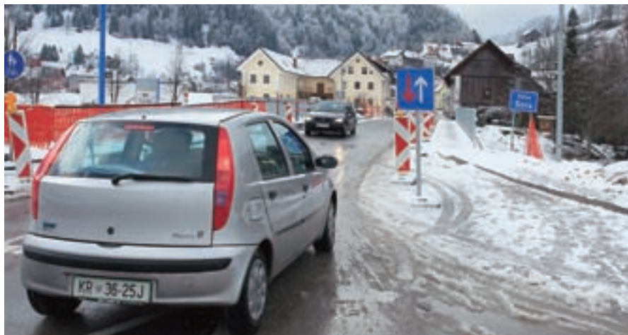
Most v Starih Žireh je po intervenciji občine prevozen vsaj enosmerno, dela pa bodo dokončana spomladi.

”Na prihodnji seji bom svetnikom predstavil idejno zasnovo nove športne dvorane s spremljajočimi učilnicami v dveh izvedbah. V proračunu imamo nekaj denarja za odkup zemljišč že načrtovanih. Tudi za to investicijo bomo skušali kandidirati na razpisih, ven-