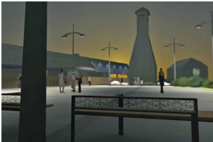
Nočni posnetek obnovljenega trga pred plavžem