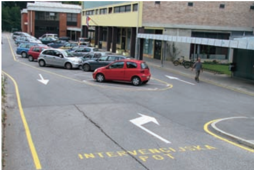
Označene intervencijske poti pri šolah