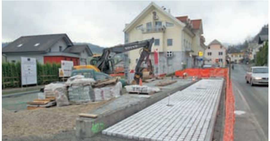
Dela pri urejanju središča Gorenje vasi lepo napredujejo.

”Na našem območju smo še zadnja občina, ki tega nima urejenega z odlokom. Odločitev o pripravi pravnih podlag za komunalni prispevek je bila sprejeta že ob ukinitvi zaračunavanja priklopnih taks na vodovod in kanalizacijo, ki jih po direktivi ministrstva za okolje in prostor občina že nekaj časa ne smemo zaračunavati. Pri tem posebej poudarjam, da se po predlaganem odloku komunalni prispevek ne bo zaračunaval za nadomestne gradnje, saj smo želeli razbremeniti tiste lastnike hiš, ki so v preteklosti že prispevali za urejanje cest in vodovodov. S komunalnim prispevkom se namreč poplačajo prav minula vlaganja v infra-