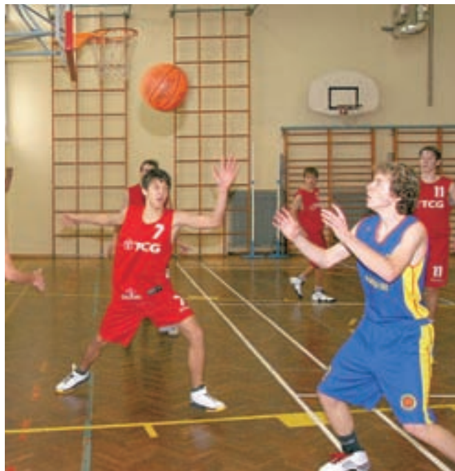
Ob obletnici so v OŠ Ivana Tavčarja v Gorenji vasi pripravili tudi turnir, na katerem so se predstavile vse generacije košarkarjev.