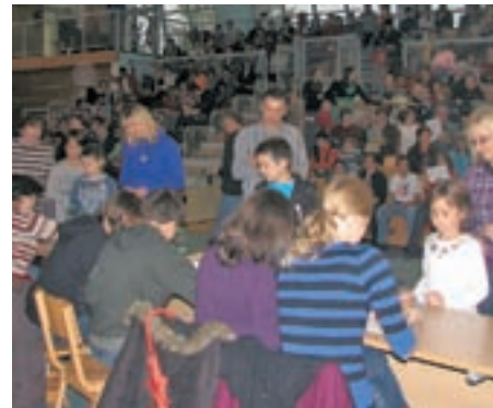
S tombolo so za Zavod Zarja zbrali 5.400 evrov.

Železniki - Župnija Železniki je v sodelovanju z župnijami Selca, Sorica in Bukovščica drugo nedeljo v novembru pripravila sedemnajsto dobrodelno tombolo. Pust, deževen dan je v športno dvorano v Železnikih privabil okoli šeststo obiskovalcev, ki so se potegovali za 780 dobitkov, glavna nagrada pa je bila slika avtorja Mira Kačarja iz Sorice. Za preganjanje živčne napetosti ob žrebanju številke je med premori skrbel domači ansambel Jeglič, otroke pa je zabaval čarodej Toni. S tombolo so letos zbrali 5.400 evrov. Izkupiček so namenili Zavodu Zarja, ki je namenjen osebam po nezgodni poškodbi možganov in njihovim svojcem, porabili pa ga bodo za ureditev dotrajanih garderob v delovni enoti v Ljubljani. "Tombola je precejšen organizacijski zalogaj, zato smo zelo hvaležni vsem, ki so po-