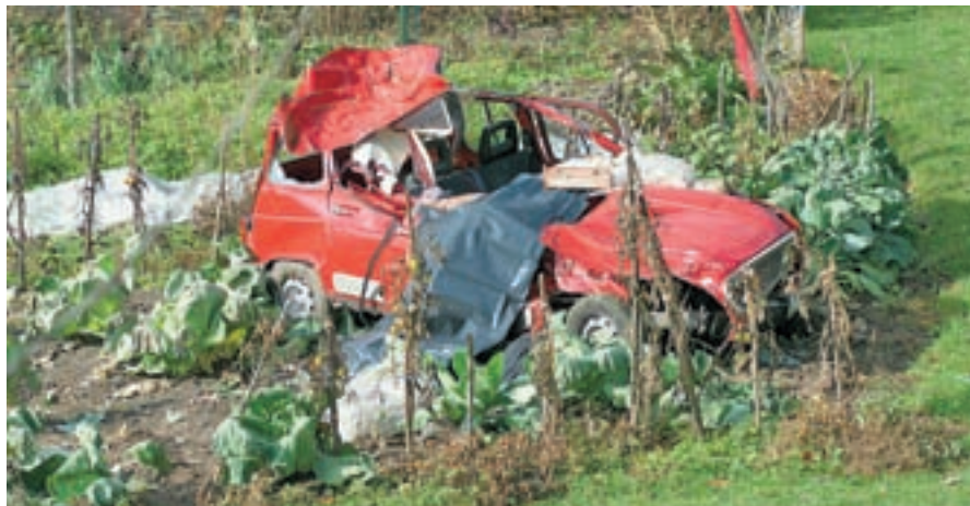
V bližini Gorenje Žetine je med prevračanjem umrl 79-letni domačin.

Huda prometna nesreča se je 4. novembra popoldne zgodila tudi na regionalni Kidriče-