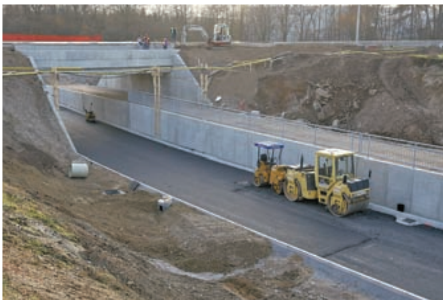
Pred zimo so končali tudi dela pri železniškem podvozu.