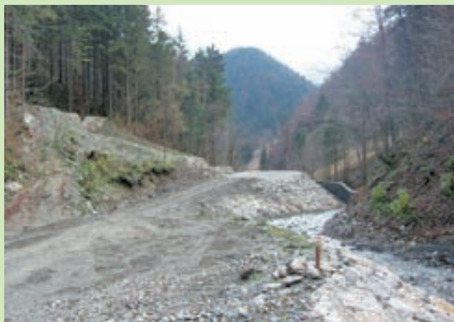
Obnovljena dolina Plenšak

Železniki - V občini Železniki se je letos zaradi krepko okrnjenih državnih sanacijskih sredstev sanacija po poplavi močno upočasnila, prednostno pa so se lotili obnove javnega vodovoda v Plenšaku, ki je stala 300 tisoč evrov. "V poplavah je bila vodovodna napeljava povsem uničena, za čimprejšnjo zagotovitev oskrbe s pitno vodo pa smo nato cevi začasno speljali kar po površju. Zdaj so vkopane v zemljo, sanirani so tudi obstoječi vodohrani. Poleg tega je v ujmi uničena dolina Plenšak dobila povsem novo podobo,