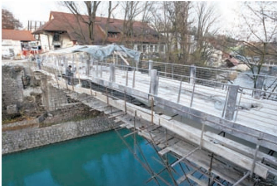
Na decembrske prireditve bodo Ločani že lahko hodili po obnovljeni brvi.

Kaj pa že dolgo pričakovano odprtje športne dvorane na Trati, kjer vas občinska opozicija sprašuje o "milijonih, ki letijo v nebo" do dveh letnih zamud pri gradnji?