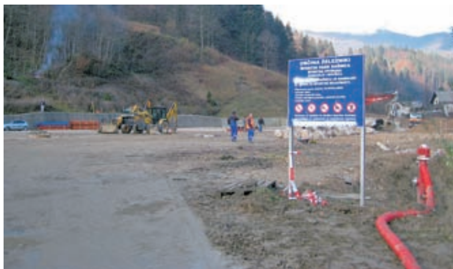
Prihodnje leto bo ena največjih investicij v Železnikih gradnja Športnega parka Dašnica.

In katere investicije se obetajo na področju športa in šole?