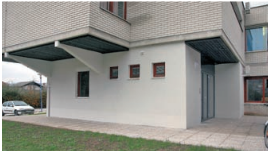
Nova zobozdravstvena ambulanta bo nared do srede decembra.

Za gradnjo vodovodnega sistema v sklopu projekta Urejanja porečja Sore, ki še ni potrjen, pa boste morali zagotoviti še dodaten denar.