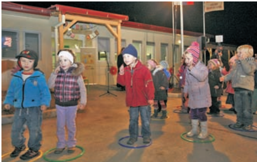
S slovesnega odprtja novega modularnega vrtca Biba v Škofji Loki

Vrtec Biba obsega 876 kvadratnih metrov neto notranjih površin, 194 kvadratnih metrov zunanje terase in zunanja igrišča s skupno površino 2.200 kvadratnih metrov, ima osem igralnic, lastne komunalne priključke, samostojno kotlovnico, razdelilno kuhinjo in manjšo telovadnico. Kot smo slišali ob odprtju, so modularne enote nekoliko zunajstandardne in višje od siceršnjih "kontejnerjev", da zadostijo predpisanim standardom za gradnjo vrtcev. Stavba je nadgrajena z dodat-