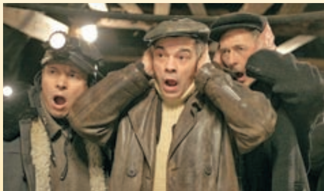
Prizor iz filma Petja na poti v nebesa, s katerim se bo 1. decembra začel Teden ruskega filma.